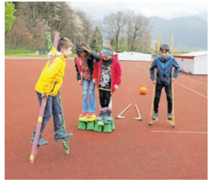
Hoja s hoduljami ni bila mačji kašelj, vendar so jo hitro usvojili.

Poleg atraktivnih delavnic, na katerih so se otroci lahko preizkusili in pomerili v igri med dvema ognjema, v košarki, zviratlonu, hoji s hoduljami, orientaciji, lovu na skriti zaklad in mnogih drugih, so na šoli poskrbeli tudi za realizacijo svojega naziva zdrave šole. Ponudili so namreč najrazličnejše sadne napitke, sadna nabadala, za tiste bolj sladkosnede so bile na voljo palačinke, starši pa so lahko uživali v dobri kavi. V sklopu podjetniškega krožka, ki na šoli poteka kot projekt Razvojnega centra Zgornje Gorenjske, so otroci