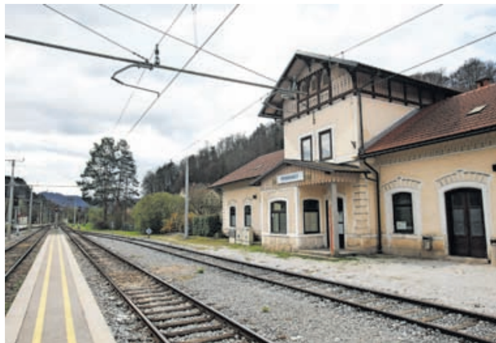
Na novo urejena bo tudi železniška postaja v Podnartu. Tako kot v Lescah bodo tudi tu ob postaji uredili parkirišče.

»Ker je izdelava omenjene projektne dokumentacije še v teku, bo ocenjena vrednost investicij znana na podlagi projektantskega popisa del. Če bodo za izvedbo investicij zagotovljena finančna sredstva, bi lahko k izvedbi postopka javnega naročila za izvedbo del pristopili v prvi polovici leta 2024 in gradbena dela začeli izvajati predvidoma v letu 2025.«