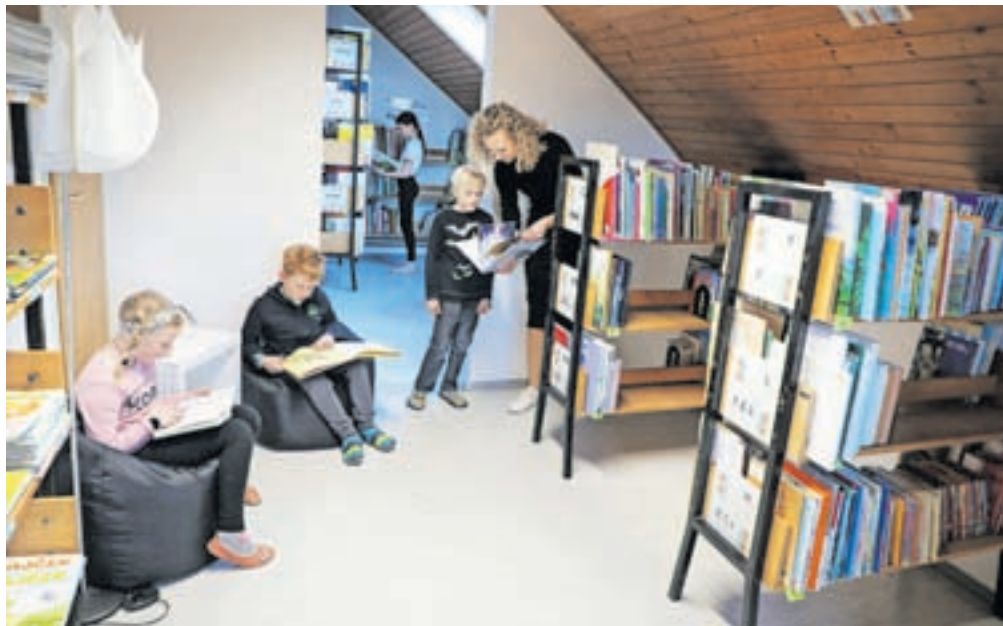
Prenovljena knjižnica je postala mali raj za nadobudne mlade bralce.

ljudnoznanstveno literaturo, knjige znanih otroških in mladinskih avtorjev, ljudske pripovedke in pravljice, poezijo in revije, kot so Gea, Pil, National Geographic, in še