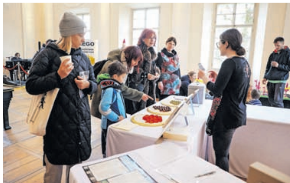
Obiskovalci so v Radovljiški graščini izglasovali svoje najljubše pralineje.