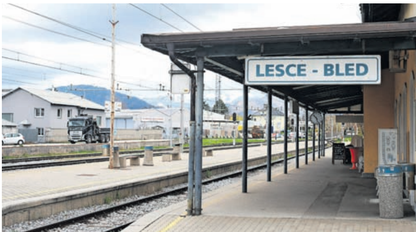
Železniško postajališče v Lescah bo popolnoma prenovljeno, vključno z ureditvijo novih dostopov do peronov.

in način izvajanja nalog. Za področje zaščite in reševanja, vključno s predvidenimi naložbami, je v proračunu za leto 2023 zagotovljenih približno 433 tisoč, za leto 2024 pa 450 tisoč evrov. V tem okviru so v proračunih zajeta tudi sredstva, ki jih bo občina prispevala za sofinanciranje nakupa novega gasilskega vozila PGD Brezje, kompresorja za potapljače in drona za gorske reševalce.