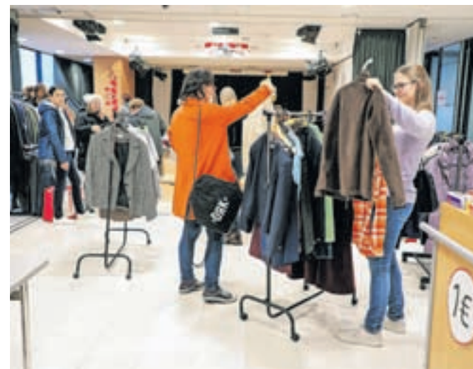
Zelo lepo obiskano izmenjevalnico zimskih oblačil so v prostorih knjižnice pripravili novembra lani.

Več informacij o izmenjevalnici, ponovni rabi in zmanjševanju količine odpadkov je na voljo na spletni strani Komunale Radovljica, www.komunala-radovljica.si . Kot so ob dnevu rabljenih oblačil, ki ga zaznamujemo 23. aprila, zapisali Ekologi brez meja, Slovenci na leto zavržemo več kot dvanajst kilogramov oblačil na osebo. Kar 900 milijonov kosov iz vsega sveta izvozimo