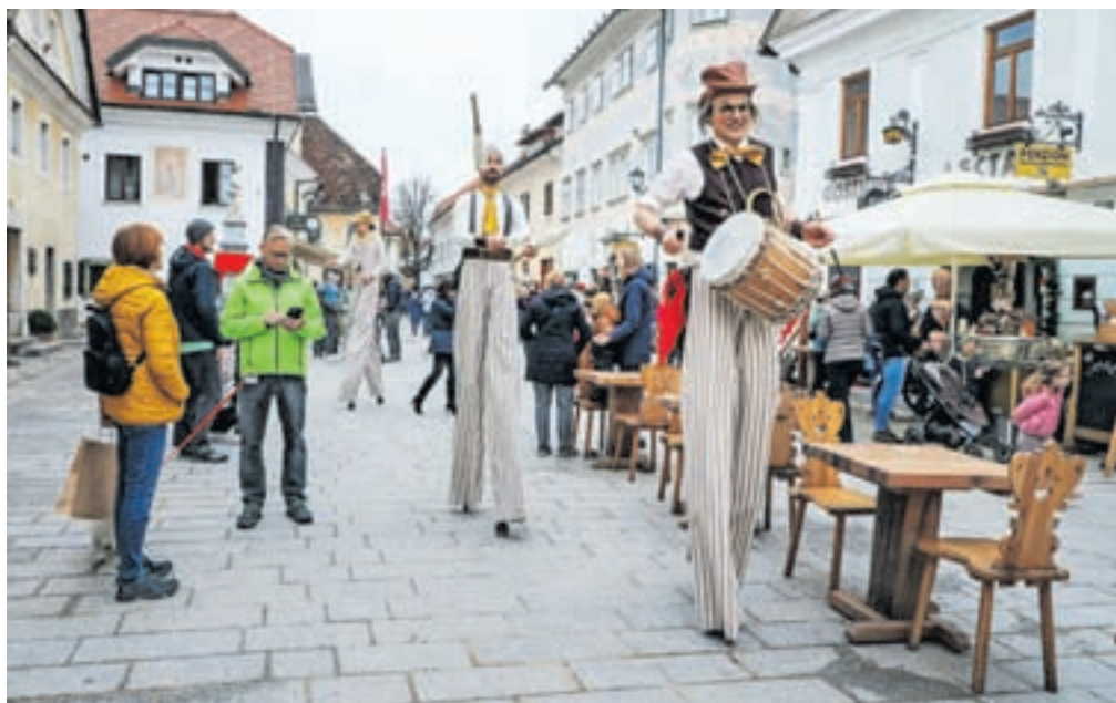
Atraktivna Čupakabra je z vragolijami zabavala mimoidoče.