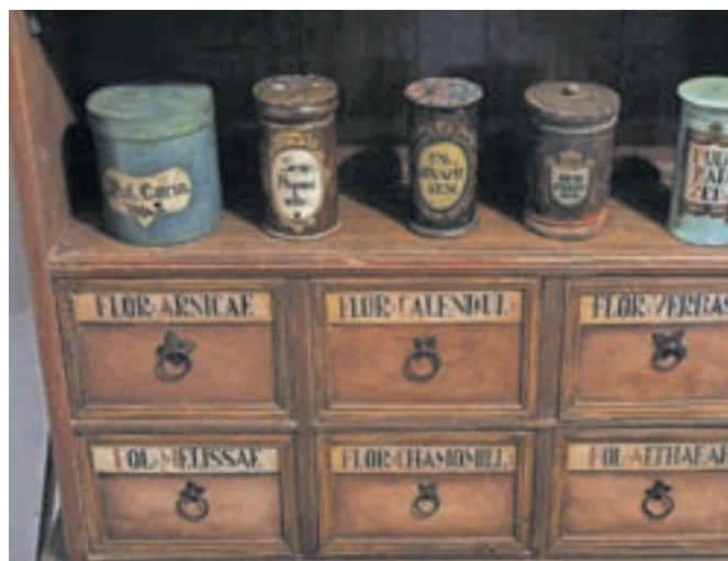
V muzeju je zbranih več kot dva tisoč predmetov s področja lekarništva, zdravilstva, farmacije, zeliščarstva, vračarstva in medicine.