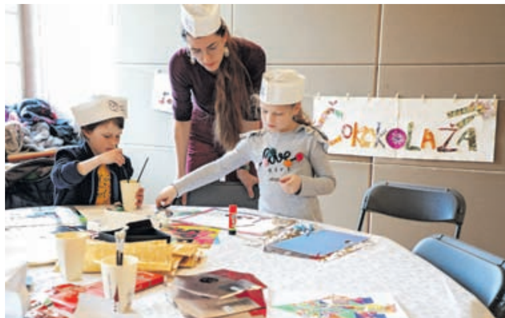
Otroci so ustvarjalno žilico lahko izrazili na različnih delavnicah.