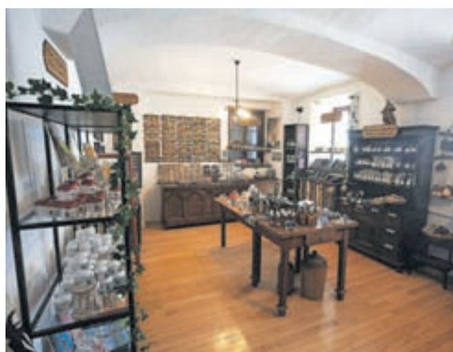
Pleščevi muzejski izkušnji dodajajo ponudbo iz muzejske lekarne, to so zeliščni izdelki in kozmetika lastne proizvodnje.