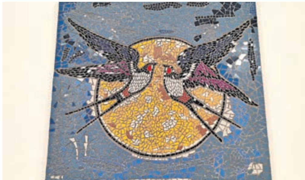
Mozaik z motivom dveh lastovk po novem krasi dvorano doma v Ljubnem.

Dom ŠD Ljubno je izredno izkoriščen, saj se dejavnosti odvijajo praktično vsak dan. Kar petkrat tedensko v domu poteka vadba namiznega tenisa ter ligaške tekme, ob večerih pa se zberejo ljubitelji prstomete, rekreativnega namiznega tenisa, aerobike, telovadbe za krajanke in pilatesa. ŠD Ljubno trenutno združuje več kot 150 članov različnih generacij ter športno sekcijo prstomete, nogometa ter namiznega tenisa. Ekipe prstomete je v pretekli sezoni nastopila v 1. državni ligi, kjer so osvojili 6. mesto, prav tako pa so zavidanja