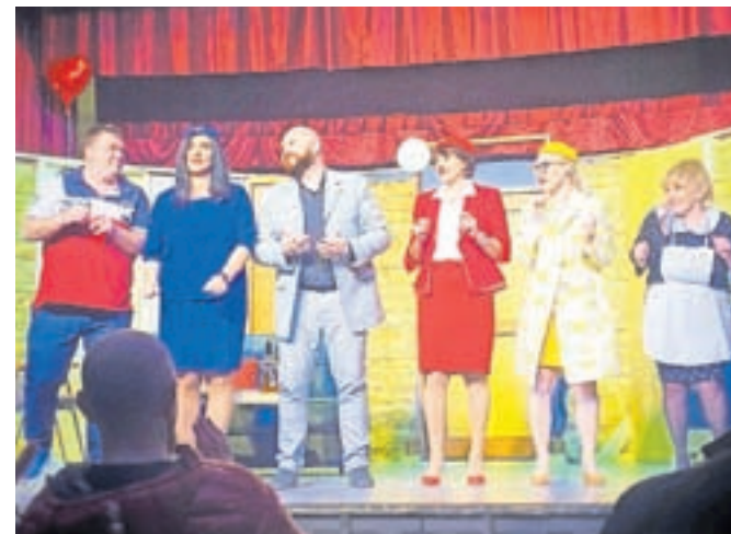
Predstavila se bo tudi Gledališka skupina Podstreha KD dr. Jakoba Prešerna Begunje, fotografija je s predstave Jutri pristanem.