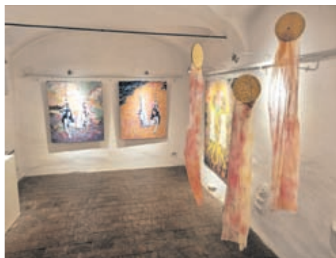
Medene impresije slikarke Mete Šolar

Splača se biti naročnik Gorenjskega glasa