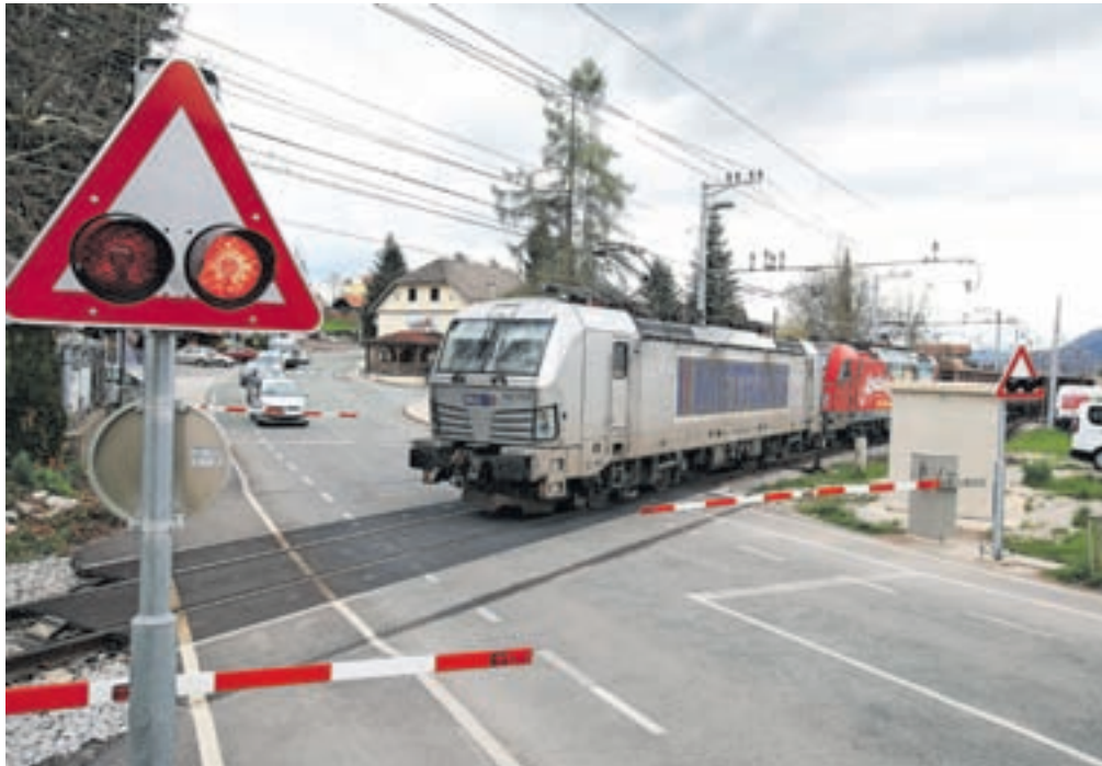
Prehod čez železnico v Lescah naj bi bil vendarle urejen kot zunajni vojski križanje proge in ceste.

Projektne rešitve na železniških postajah Podnart in Lesce Bled predvidevajo ureditev nove tirne sheme z umestitvijo nove peronske infrastrukture. Načrtovani so novi zunajni vojski dostopi na perone, prilagojeni za gibalno ovirane osebe ter slepe in slabovidne.