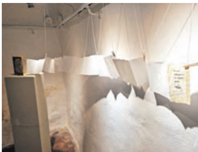
Knjižica Dvesto kilometrov za kapljo medu