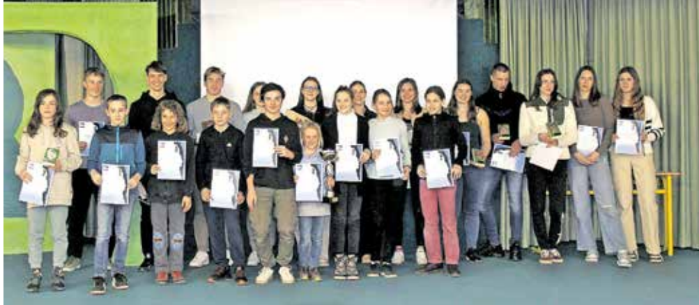
Del nagrajencev radovljiškega športnoplezalnega odseka