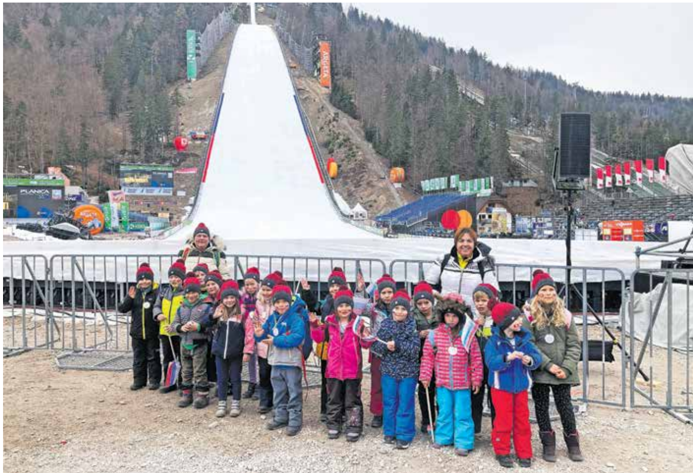
Navdušeni navijači Vrtca Brezje v Planici

nahrbtnikov so se odpravili proti avtobusu, vsak otrok je s seboj vzel zastavo in izdelal sonček za okoli vratu, na katerem je bilo njegovo ime in vsi pomembni podatki v primeru, če se kdo slučajno izgubi. Kot nam še pripoveduje vodja vrtca, so bili otroci navdušeni in so že dolgo odštevali