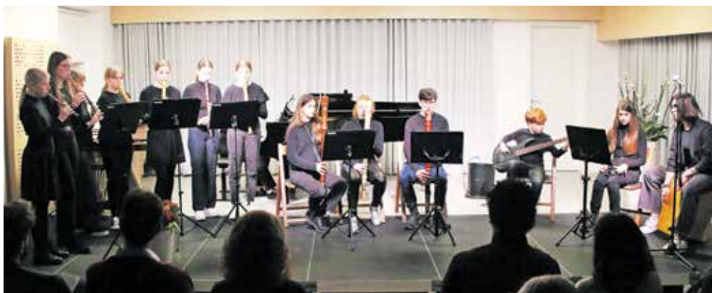
V radovljiški glasbeni šoli deluje odlični sestav kljunastih flavt.

Polna dvorana je tako prisluhnila bogatemu naboru