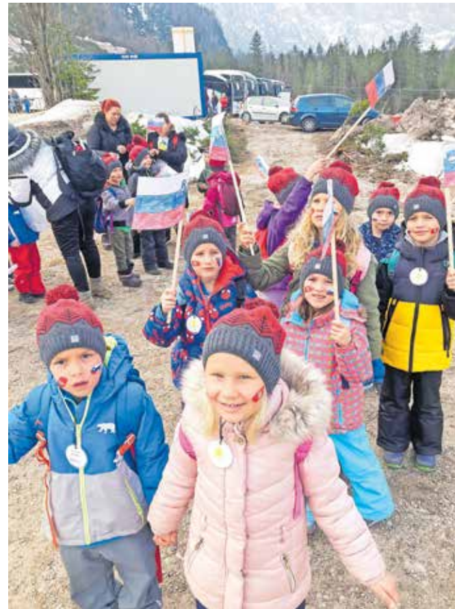
Najbolj so navijali za Slovence

dneve do odhoda. V skupini sta bili strokovni delavki, ena od mamic iz zavarovalnice ter strokovna delavka iz druge enote. Prijavili so se že tri tedne prej in takoj naslednji dan že dobili potrditev za obisk. Otrokom so bile najbolj všeč maskote, kuža Pazi, dolgi poleti in Challe Salle, katerega oboževalci so tudi sami.