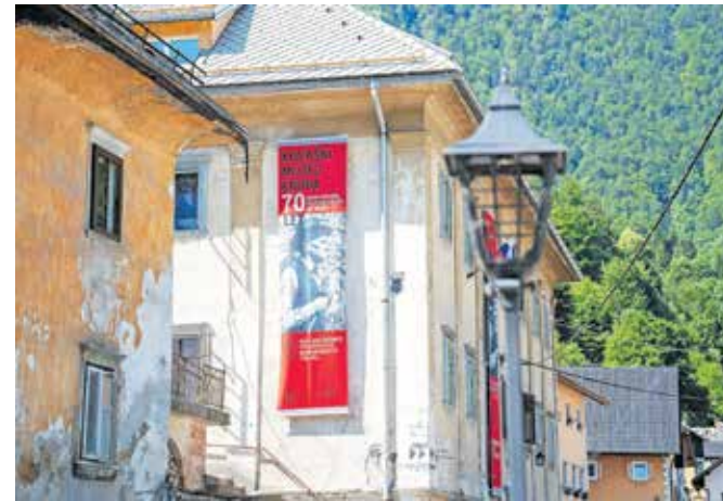
Klinarjeva hiša v Kropi, v kateri so prostori Kovaškega muzeja

Vrednost investicije je ocenjena na 415 tisoč evrov, 200 tisoč od tega naj bi zagotovilo Ministrstvo za kulturo. Celovita obnova Klinarjeve hiše, za katero je občina že pridobila gradbeno dovoljenje, se bo nadaljevala tudi v prihodnjih letih, med drugim z umestitvijo dvigala in kotlovnice, zunanjo ureditvijo in posodobitvijo razstave Kovaškega muzeja.