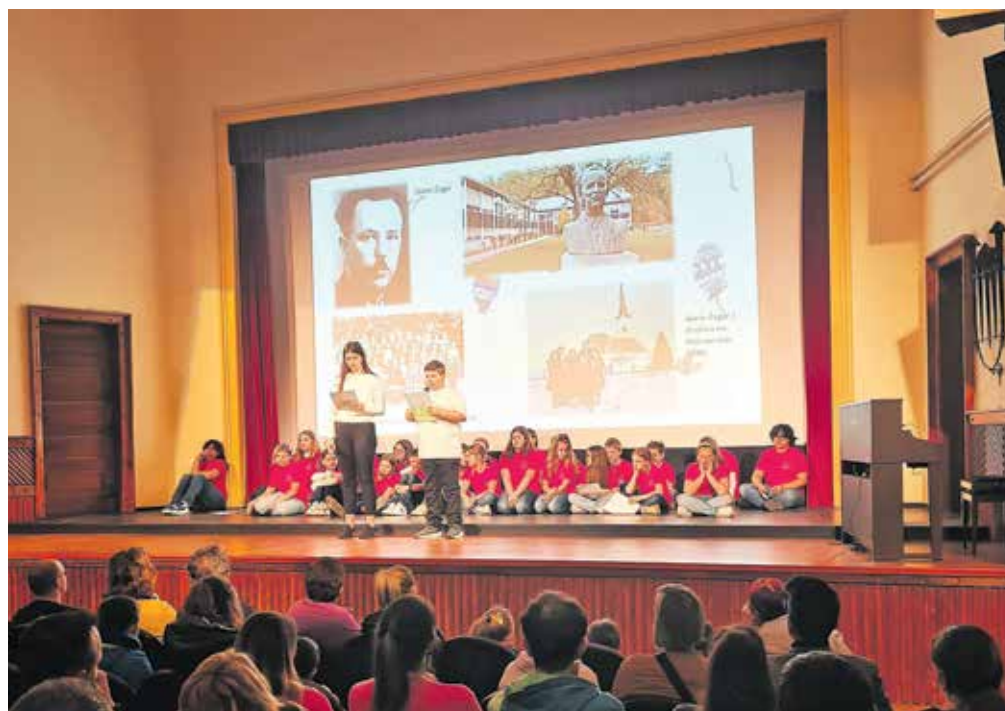
Prireditev so tokrat prvič pripravili v dvorani Kulturnega doma Kropa.