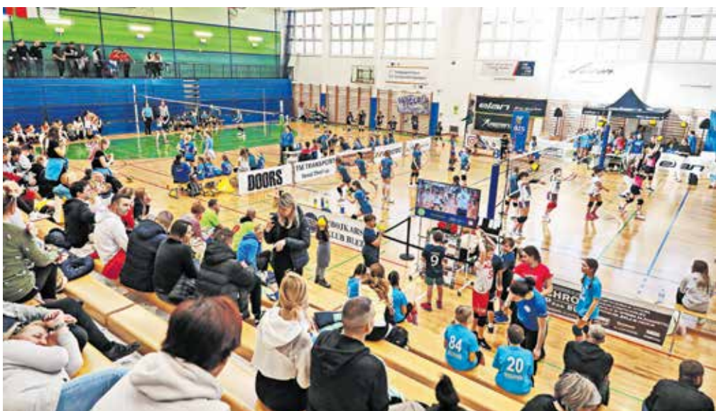
Na desetih igriščih v dvoranh osnovne šole ter Srednje gostinske in turistične šole v Radovljici je bilo kar 82 tekem.

Lubnik, OK Triglav Kranj, Flip Flop Grosuplje, ŽOK Šentvid in Formis II. Na koncu so se zmage veselile odbojkarice Formis I, drugi je bil Calcit Volleyball, tretja pa Nova KBM Branik I. Turnir v Radovljici je bil letošnji drugi v seriji prvenstev v mini odbojki, odvijal pa se je v sklopu projekta Evropske odbojarske konfederacije CEV Schooll Volleyball, katerega namen je spodbujanje vključevanja mladih v športne dejavnosti.