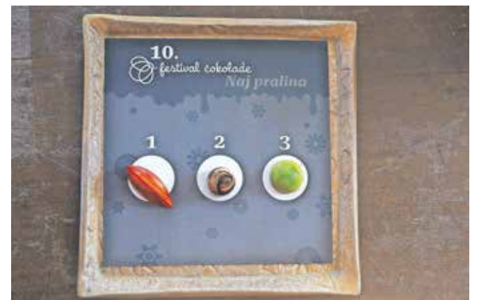
Tri naj pralineje so že izbrali.