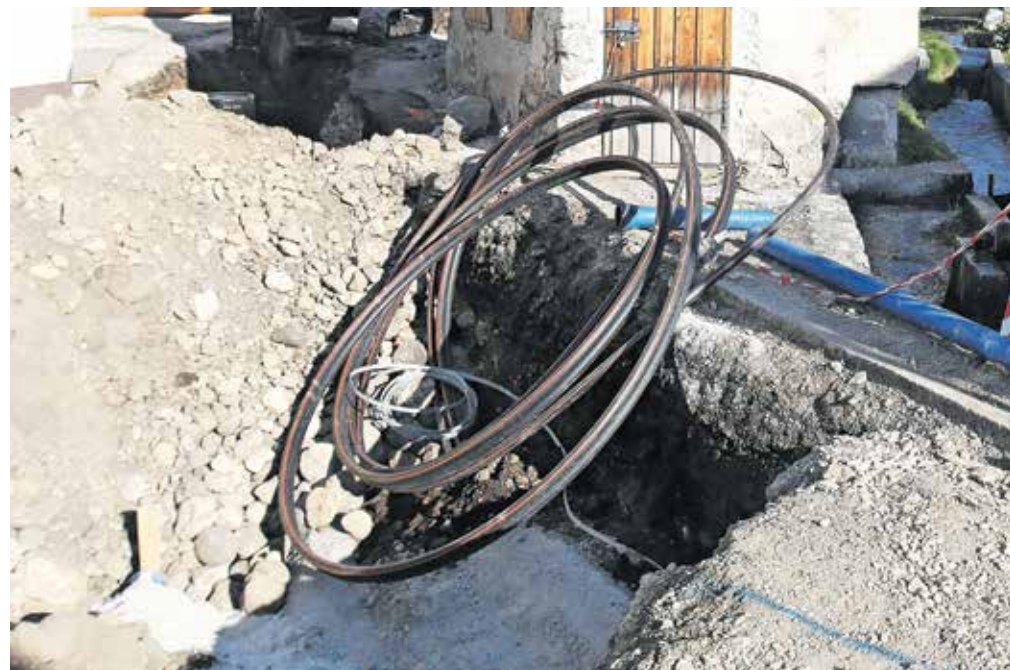
Gradnja v strnjem starem naselju, ki je tudi spomeniško zaščiten, predstavlja velik izziv.

Gradnja v strnjem starem naselju, ki je tudi spomeniško zaščiten, sicer predstavlja izredno velik izziv, še pravi Bezjak. Krajevna skupnost je zato ob začetku projekta organizirala javno razpravo, na kateri so se dogovorili o poteku projekta ter tudi o tem, da Zavod za varstvo kulturne dediščine vsakemu od lastnikov zagotovi predhodne smernice za obnovo objektov, ki so se je številni lastniki lotili sočasno z gradnjo kanalizacije in vodovoda.