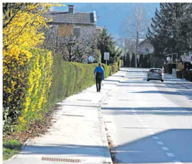
Vegetacija mora biti obrezana tako, da je zagotovljena preglednost ceste.

»Prav posebej opozarjamo na obrezovanje vegetacije, ki raste ob pločnikih – tudi pločnik namreč velja za del cestišča –, saj ta zaradi razraščeniosti pogosto zmanjšuje varnost pešcev in drugih najranljivejših udeležencev v prometu.«