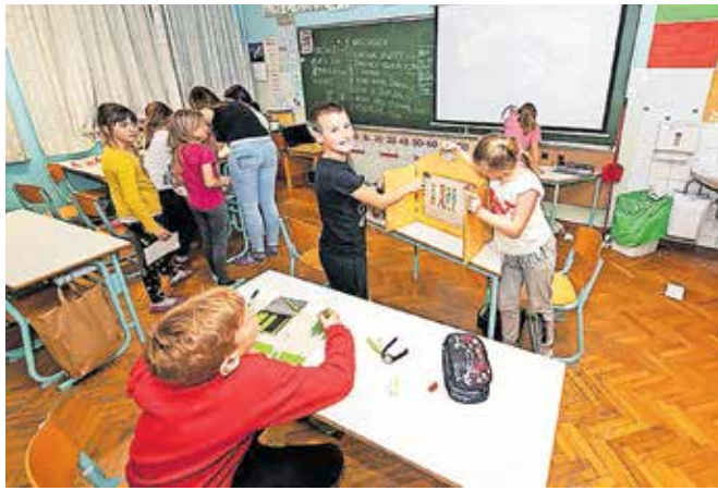
Živahno nočno dogajanje na Podružnični šoli Ovsiške

»Večer se je začel z branjem Andersenovih pravljic Vžigalnik in Palčica, potem pa so sledile različne ustvarjalne delavnice in sprostitvene dejavnosti.« je povedal. »Za učence je bilo posebno doživetje, da so si lahko sami nad ognjem popekli hrenov-