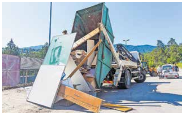
Tudi višji stroški prevzema odpadkov bodo vplivali na spremembo cene.

V občinskem proračunu so za leto 2023 predvidena sredstva za namen blaženja zvišanja cen komunalnih storitev za gospodinjstva in neprofitne organizacije. Na občinskem svetu je bil potrjen najbolj optimalen način subvencioniranja omrežnine pitne vode, ki bo dosegel vse uporabnike javnega vodovoda. Subvencija omrežnine za oskrbo s pitno vodo bo od 1. aprila do 31. decembra 2023 znašala 0,8806 EUR/faktor brez DDV. Število faktorjev je določeno na osnovi velikosti vodomera. Stanovanjske hiše (vodomer velikosti ≤ DN 20 mm) in stanovanja v večstanovanjskih objektih imajo en (1) faktor.