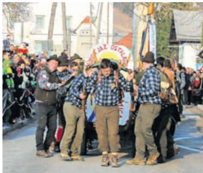
Vleka ploha v Begunjah poteka tradicionalno, brez uporabe traktorja.

Za ploh so izbrali najdebelejšo, najvišjo in najmočnejšo smreko, ki so jo lahko našli v dolini Drage, Ambrožič pa je v šali povedal, da so se v nedeljo, ko je smreka, požagana z žago amerikanke, padla, zagotovo tresle vse hiše v bližini. Poleg dolgotrajne priprave vseh vencev, ki so krasili mogočni ploh, je sledilo še cel kup opravil. Smreko je bilo treba olupiti ter paziti vse do torke, da je ne bi kdo požagal, saj bi to pomenilo veliko sramoto.