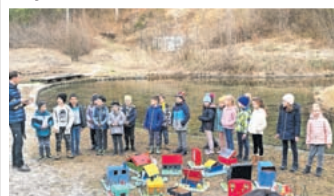
Spušcanje pisanih hišk po vodi je bilo prijetno doživetje tako za otroke kot starše.