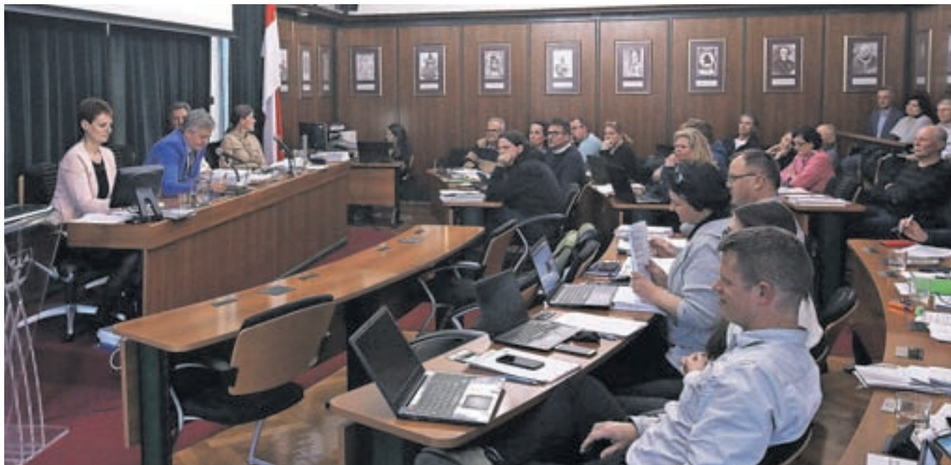
Svetniki so proračuna potrdili v ponedeljek na četrti redni seji občinskega sveta.

avtobusni postaji v Radovljici. Za investicije, načrtovane v proračunu, je v letu 2023 predvidena namenska zadolžitev za dva milijona evrov, v prihodnjem letu pa za 1,6 milijona evrov. Predvideni investicijski odhodki v letošnjem letu predstavljajo približno 42 odstotkov vseh odhodkov, v letu 2024 pa je za investicije načrtovanih 33 odstotkov vseh proračunskih sredstev.