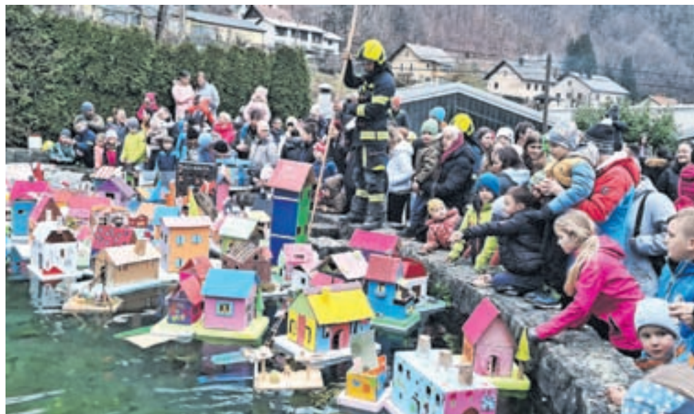
V Kropli otroci spuščajo barčice na bajerju nekdanje spodnje fužine ...

šnje turistično društvo, so registrirali kar 170 barčic, kar je okoli dvajset več kot v najboljših predkoronskih letih. Otroci so jih navdušeno spustili po bajerju nekdanje spodnje fužine. V sklopu prireditve so v Kropli prikazali tudi ročno kovanje žebeljev, v okviru projekta Pokus Kroppe pa predstavili dve tra-