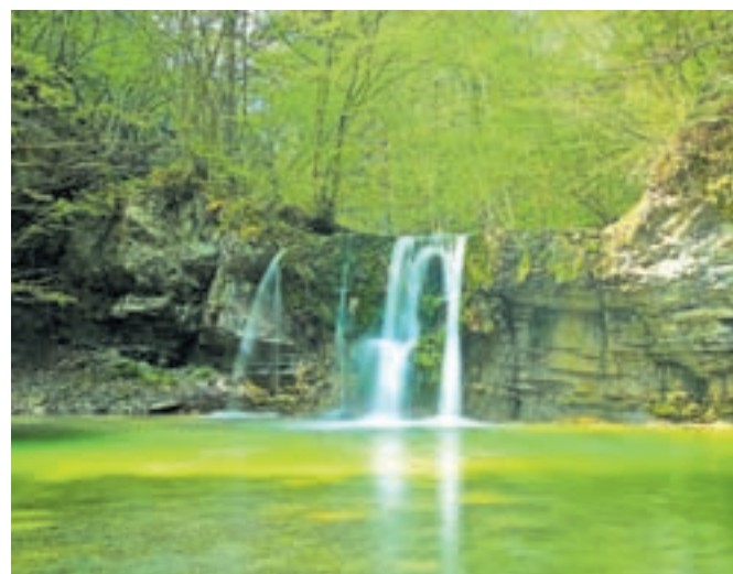
Peraški slap, avtor Tomaž Sedej, prva nagrada v kategoriji Tematske poti

V drugi temi Tematske poti v Občini Radovljica je sodelovalo osem avtorjev s skupaj 40 fotografijami. Vsak avtor je lahko sodeloval s šestimi fotografijami. Devet fotografij je bilo izbranih za razstavo na fotografskem pa-