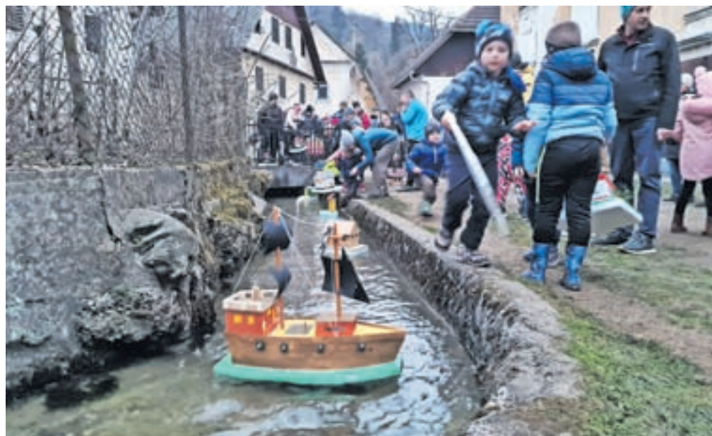
... v Kamni Gorici pa jih spuščajo po enem od številnih vodnih kanalov v središču vasi.

dicionalni kroparski jedi: sladkule in rožičeve štrukeljce.