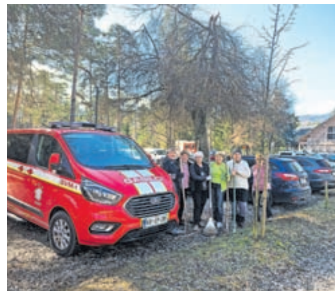
Za novo turistično sezono so v akciji, ki so se je tudi letos udeležili številni prostovoljci iz Lesc in okolice, očistili in pripravili okoli trideset hektarov zemljišč.

in parkov, gasilci pa so medtem s pomočjo gasilne opreme očistili bajer. Kot poudarjajo v Turističnem društvu Lesce, ki je lastnik kampa Šobec, ob koncu vsakega leta del tistega, kar ustvarijo s sezonsko turistično dejavnostjo, podarijo drugim društvom v kraju. »Ta dolgoletna družbena odgovornost Turističnega društva Lesce je deležna hvaležnosti prostovoljcev iz krajevnih društev, ki jo izkažejo tudi na ta način, da se vsako leto udeležijo spomladanske čistilne akcije. S tem je ustvarjen krog sodelovanja, dobrih odnosov in zadovoljstva vseh vpletenih,« poudarjajo.