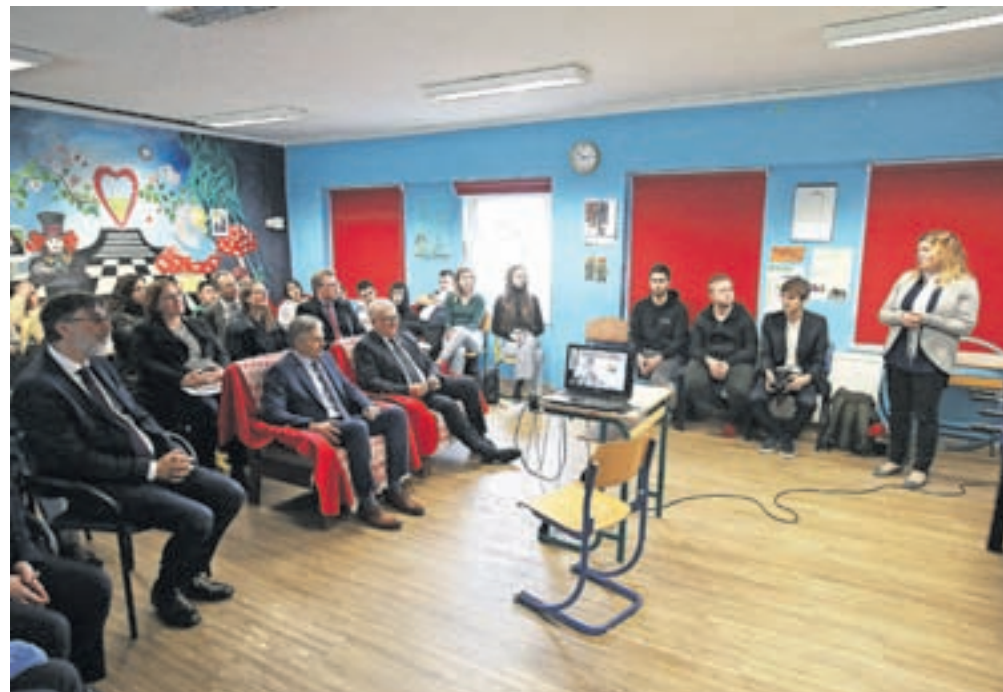
Med mladimi v mladinskem centru Kamra / FOTO: GORAZD KAVČIČ

Ljudske univerze pa niso pomembne le za tiste, ki morda obupajo v šolskem sistemu in se s tovrstnimi