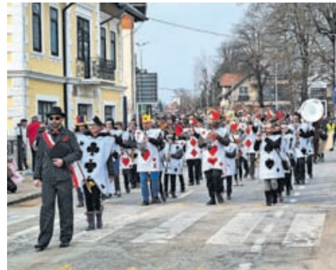
Pustni sprevod je tudi letos vodil pustni župan, za njim korakajo Pihalni orkester Lesce ter pustne maskare in kurenti.

Pustni sprevod, ki so se ga udeležile tako posamezne maskare kot skupine, je na pustno soboto popoldan krenil s Cankarjeve ulice, od koder ga je pustni župan vodil skozi Radovljico, mimo ekonomske šole in proti staremu mestnemu jedru, kjer se je nato na Linhartovem trgu začelo pustno rajanje. Sprevod, ki ga tradicionalno organizira Turistično društvo Radovljica, so obogatili skupina Čupakabra, večja skupina kurentov iz Rogoznice ter Pihalni orkester Lesce. V starem mestnem jedru je bila v času pustovanja udeležencem na voljo posebna sladka ponudba, ki so jo na stojnicah pripravili Radolška čokolada, Fritula, Slaščičarna Vidic, Hiša Linhart, Go-