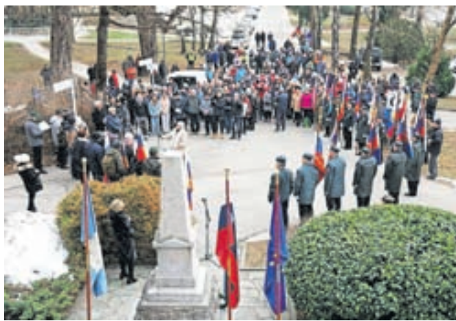
Ob letošnjem kulturnem prazniku so pripravili že 21. Pohod Janeza Svetine od Radovljice skozi Bled do Vrbe, tokrat z več kot 260 udeleženci.

V združenju prosijo vse člane, da jim posredujejo elektronske naslove, da jih bodo lažje sproti obveščali o pomembnih dogodkih in delovanju združenja, in, seveda, da poravnajo članarino za tekoče leto. Vse člane vabijo, da kar najbolj množično spremljajo program in se udeležujejo aktivnosti, ki jih v združenju organizirajo in nudijo.