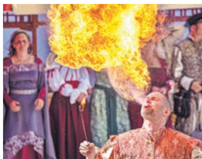
Ognježer, avtor Janez Resman, prva nagrada v kategoriji Dogodki v občini Radovljica

Organizatorja si želita, da bi v prihodnosti sodelovalo še več avtorjev. Podrobnosti boste našli na strani Fotografskega društva Radovljica www.fd-radovljica.si .