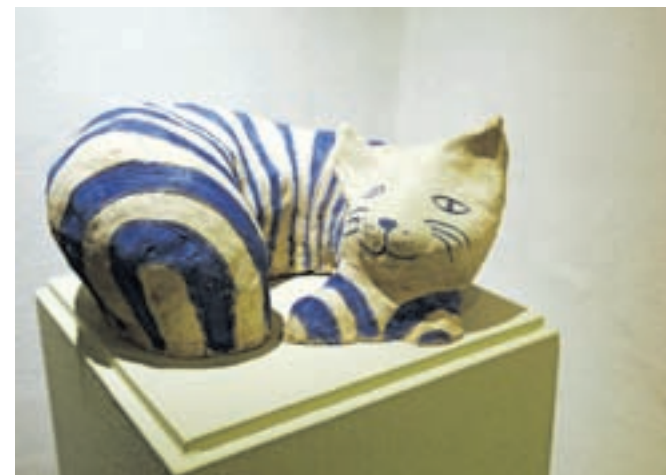
Ena od hudomušnih mačk ...

lik, barv in vzorcev pa jih lahko dojemamo tudi kot upoštevanja vredne likovne stvaritve, poudarja kustosinja.