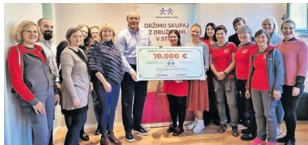
Na slovesnosti ob predaji donacijskega bona ZPM Ljubljana Moste - Polje se je vodstvu podjetja pridružil celoten kolektiv.

Najranjlivejše družine potrebujejo približno dve leti celostne pomoči, da se opolnomočijo, pa pojasnjujejo v DPM Moste - Polje. Vključenost v projekt jim nudi finančno in materialno pomoč, brezplačno pravno pomoč, strokovno vodenje in krepitev funkcionalnih kompetenc ter psihosocialno in zdravstveno pomoč. To pa so ključna orodja za nov začetek, pogum in izhod iz revščine.