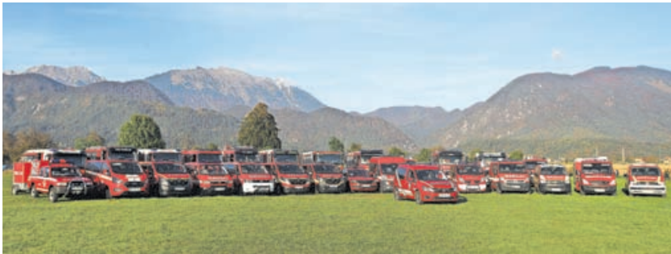
Na slikanju, ki so ga pripravili na letališču v Lescah, je bilo 28 vozil 13 teritorialnih gasilskih društev Gasilske zveze Radovljica.

sredstev financiran nakup 14 gasilskih vozil, pri nakupu katerih so društva prispevala od 10 do dobrih 30