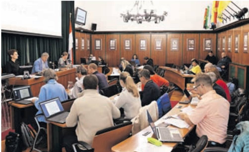
Radovljiški občinski svetniki so se konec septembra sestali na predvidoma zadnji seji v tem mandatu.

Za ureditev kulturnega doma Kropa pa je občina pridobila sredstva Ministrstva za kulturo. Na podlagi javnega poziva za sofinanciranje vlaganj v javno kulturno infrastrukturo lokalnih skupnosti bo letos prejela 82 tisoč evrov in zagotovila še 44 tisoč lastnih sredstev,