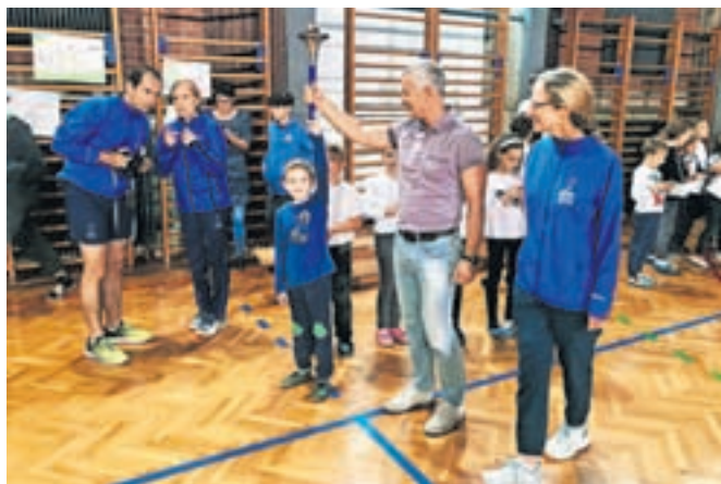
Tekači iz Italije so se ustavili tudi na radovljiški šoli, od koder so pot nadaljevali proti Bledu.

»Tek miru je pobuda, ki že 35 let povezuje ljudi v skupni želji po harmoniji in prijateljstvu. Zrasla je iz truda številnih posameznikov, da začnemo sami graditi svetovno harmonijo, najprej v svojih srcih in v medsebojnih odnosih. Tekači na svoji poti poleg politikov in drugih javnih osebnosti najraje obiščejo šole, kjer z učenci delijo svoj navdih. Tudi k nam so prinesli sporočilo, da ima prav vsak od nas pomembno vlogo pri ustvarjanju prijaznejšega in mirnejšega sveta. Učencem so se predstavili