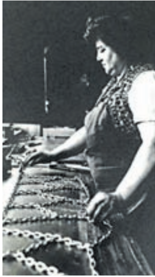
Letos mineva sto let od ustanovitve tovarne Veriga v Lescah.

»Dobimo se na recepciji Čebelarskega in Mestnega muzeja v Radovljiški graščini. Ob kavi in posladkih se bomo pogovarjali o delu in življenju v tovarni in obujali spomine na pretekle čase. Hkrati bomo zelo veseli, če nam ob tej priložnosti prinesete pokazat predmete, povezane z Verigo, ki jih hranite doma. Rezultat raziskovanj industrijske de-