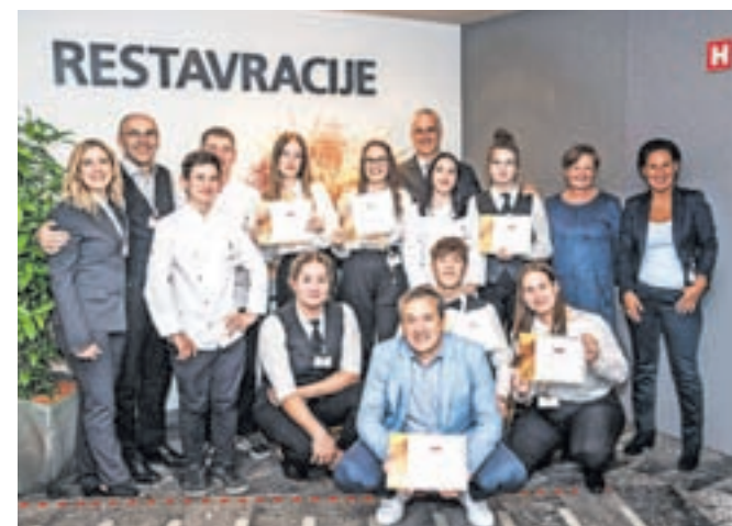
Udeleženci letošnjega mednarodnega tekmovanja srednjih gostinskih in turističnih šol z mentorji in ravnateljem