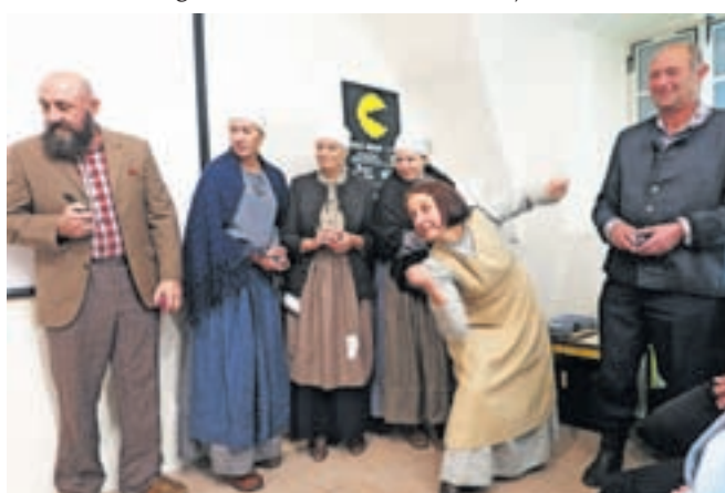
Dramska skupina Čofta s staro igro loščanca

Razstavo so ob številnem občinstvu odprli otroci iz Vrtca Kropa, ki so z vzgojiteljicami pripravili rajalno igro Bela bela lilija, v kratkem predstavitvenem filmu, ki ga je s skupino Čofta pripravil Anže Habjan, pa spoznamo nekatere igre, ki so se jih nekdo igrali v Kropi, za današnje čase prav čudnih imen postalenc, poganeta, parenga, loščanca ... Slednje smo v izvedbi Čofte videli tudi v živo. Na vprašanje, kdo je pri metanju meče – žogice iz cunj zmagal, so - da se zmagalo ne bi sprli - sprejeli pametno odločitev: »Pejmo zdej k Jarmu na en'ga.« Razstava bo v Kropi na ogled še vse do konca leta. Svetujem vam, da še enkrat preberete prvi stavek in si jo ogledate – v družbi najmlajših, seveda.