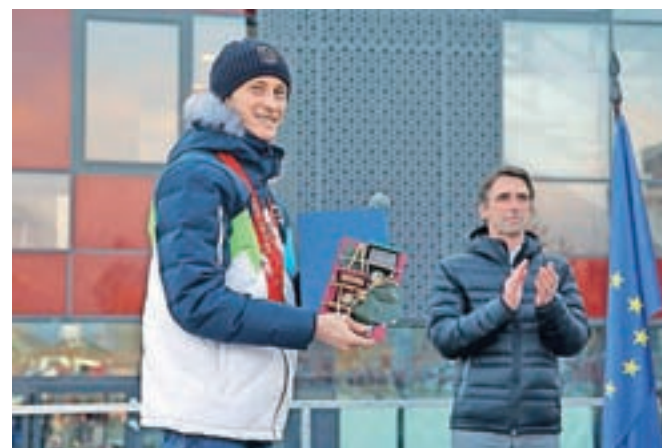
Prevc v družbi Leščana Francija Petka, svetovnega prvaka v smučarskih skokih leta 1991, ki je bil leto za tem na olimpijskih igrah v Franciji prvi zastavonoša v samostojni Sloveniji.

Zimska akcija Osvežite dom z Gorenjskim glasom