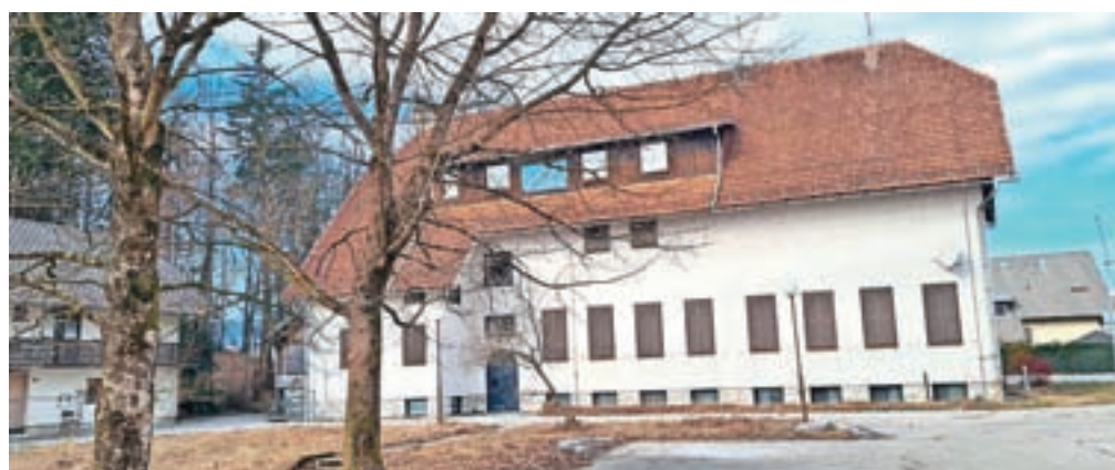
Šlandrov dom naj bi novi lastniki podrli in na njegovem mestu že do konca prihodnjega leta zgradili nov dom za starejše občane.

Obstoječi Dom dr. Janka Benedika v Radovljici trenutno lahko sprejme 222 stanovalcev. Do leta 2030 bi v občini radi zagotovili še 200 dodatnih mest, ob pričakovanih 140 v novem domu v Radovljici so predvidena tudi v načrtovani dislocirani enoti Doma dr. Janka Benedika Radovljica na območju Doma Matevža Langusa v Kamni Gorici. Pridobljena koncesija za dom za starejše v Radovljici na ta projekt ne vpliva, so prepričani na občinski upravi, kjer še pojasnjujejo, da je ureditev enote doma starejših v Kamni Gorici vključena tudi med projekte v občinskem razvojnem programu. "Nosilec je Dom dr. Janka Benedika Radovljica, občina je pripravljena za potrebe širitve doma zagotoviti brezplačen prenos lastništva svojih zemljišč na državo, izdelati projekt in pridobiti gradbeno dovoljenje. Izvedba in financiranje