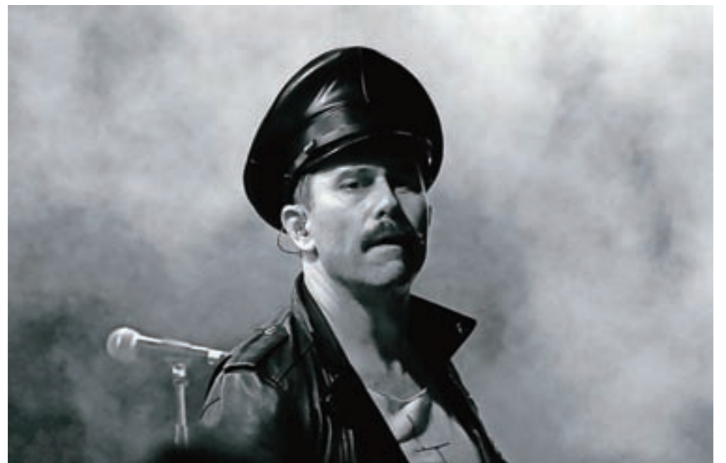
Freddie Mercury, avtor: Damjan Markovec, prva nagrada v kategoriji Dogodki v občini Radovljica

nih novic. V temi Dogodki v občini Radovljica je sodelovalo sedem avtorjev, ki so prispevali 162 fotografij. Žirija je izbrala 39 fotografij, Nagrade in diplome so osvojili: prva nagrada: Damjan Markovec,