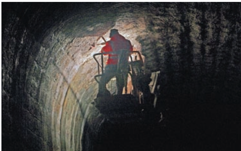
Obnova oboka v predoru Globoko (8. marca 2021), avtor: Vitomir Pretnar, prva nagrada za temo Posegi v prostor ob nadgradnji železniške proge Podnart–Lesce