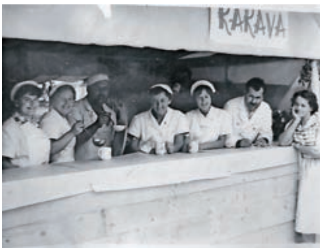
Prodaja kakava na leškem letališču