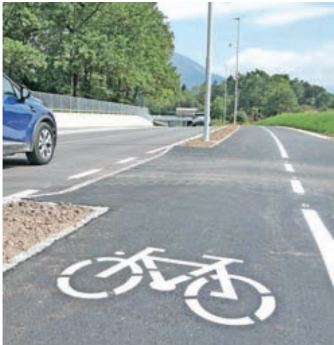
Lani je bil izveden prvi del projekta, kolesarska povezava pod železnico. Izvedba drugega dela, povezave do železniške postaje v Lescah, se pravkar začena.

Sočasno je potekala rekonstrukcija in obnova regionalne ceste, ki jo je izvajala Direkcija RS za infrastrukturo, občina pa je ob tem na rekonstruiranem cestnem odseku zgradila še novo fekalno kanalizacijo. V drugem sklopu gradnje kolesarske povezave bo zdaj