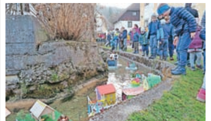
Spuščanje barčic na predvečer gregorjevega v Kamni Gorici in Kropi sta bili pred dvema letoma zadnji večji prireditvi pred popolnim zaprtjem javnega življenja zaradi epidemije.

Komunala Radovljica, d.o.o. Ljubljanska cesta 27, 4240 Radovljica tel.: 04 537 01 11, faks: 04 537 01 12 e-naslov: info@komunala-radovljica.si www.komunala-radovljica.si