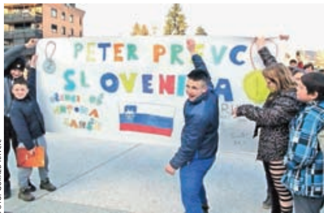
Posebno toplo so junaka olimpijskih iger Petra Prevca pozdravili učenci Osnovne šole Antona Janše.

(Atene 2004) in bronasto (London 2012) ter Sadik Mujkič bronasto (Barcelona 1992), v smučarskih skokih Peter Prevc zlato (Peking 2022), dve srebrni (Soči 2014 in Peking 2022) in bronasto (Soči 2014), v plavanju Sara Isakovič srebrno (Peking 2008) in v biatlonu Jakov Fak prav tako srebrno medaljo (Pjongčang 2018). Omeniti velja, da sta Jure Franko (srebrna) in Sadik Mujkič (bronasta) osvojila medalji za Jugoslavijo, Jakov Fak (bronasta) pa tudi za Hrvaško. Ob vsem naštetem se lahko samo sprašujemo, kdaj se bomo v radovljiški občini lahko veselili nove olimpijske medalje. Peter Prevc se je s štirimi medaljami priključil trojci, ki je že imela štiri medalje z največjega tekmovanja, Leonu Štuklju, Tini Maze in že omenjenemu Iztoku Čopu.