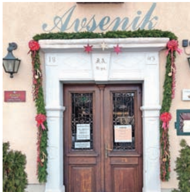
Domačini so iz smrečja napletli kar okoli osemdeset metrov vencev, s katerimi so okrasili portale in okna v središču vasi.