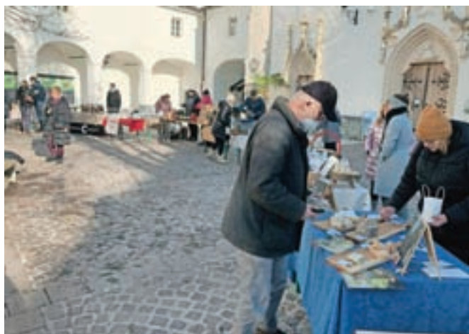
Prejšnjo soboto je na trgu pred cerkvijo sv. Petra zaživela Radolška tržnica, sejem lokalnih dobrot, rokodelskih izdelkov in starin.