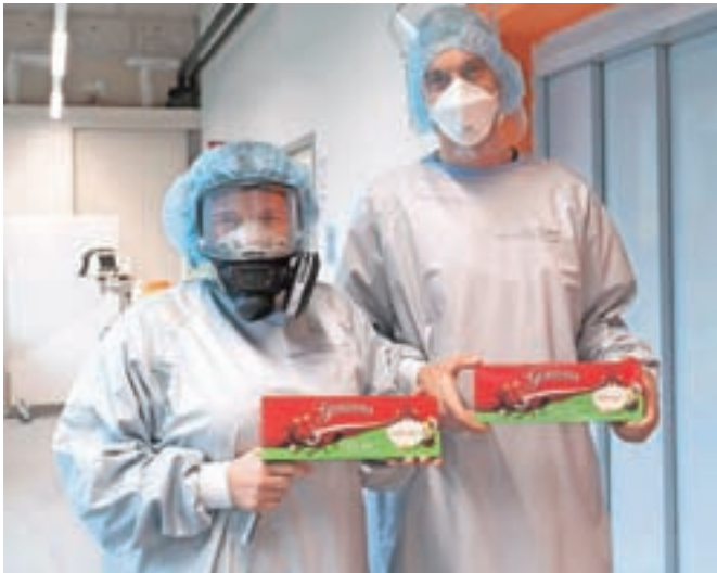
Sladka poživitev zahtevnega delovnega dne zaposlenih na kovidnih intenzivnih enotah

Družba Žito, v katere okvir sodi tudi leška Gorenjka, je prejšnji teden s posredovanjem ekipe prostovoljcev Covid-19 Sledilnika osebju intenzivnih kovidnih enot po vsej Sloveniji razdelila tisoč čokolad Gorenjka. Kot pravijo v Žitu, so se odločili za obdarovanje s sladko donacijo tistih, ki so na delovnih mestih izjemno izpostavljeni resnično napornim okoliščinam dela. »Prisluhnili smo ekipi prostovoljcev Covid-19 Sledilnika in skupaj z njimi omogočili donacijo čokolad blagovne znamke Gorenjka, za katero verjamo, da lahko vsaj malenkost posladka zahtevan delovni dan oseba, ki v teh dneh dela na intenzivnih enotah.«