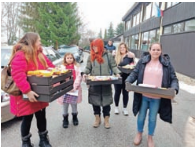
Prodajalke in prodajalci radovljiškega Hoferja so s sladkimi dobrotami takole razveselili bližnje sosede, učence Osnovne šole Antona Janše Radovljica.