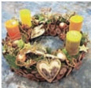
Adventni venček v toplih tonih letos aktualnega spektra barv konjaka

Prepričana je, da imajo mnogi za pripomoček radi prav klasično knjigo, ki jo lahko listajo, med delom sledijo zapisanim navodilom, se vračajo na prejšnje faze navodil ... Tako kot takrat, ko pri pripravi jedi sledimo receptu v kuharski knjigi. »Tradicionalna krščanska adventna barva je vijolična,