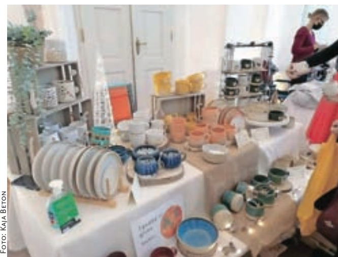
V nedeljo so Radovljico obiskali umetniki in ustvarjalci, ki se predstavljajo pod skupnim imenom ARTish.