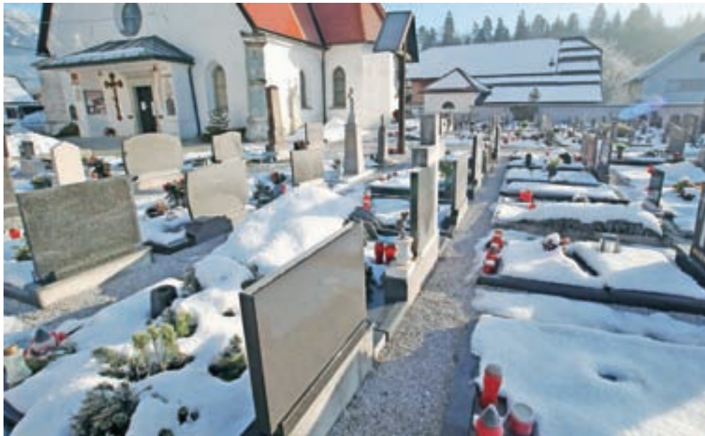
Občinski svet je na oktobrski seji obravnaval tri osnutke, ki se nanašajo na pokopališko in pogrebno dejavnost v občini.

Kot pojasnjujejo na občinski upravi, trenutna ureditev tega področja v občini ni skladna z zakonodajo ne glede določitve upravljavca pokopališč ne glede določit-