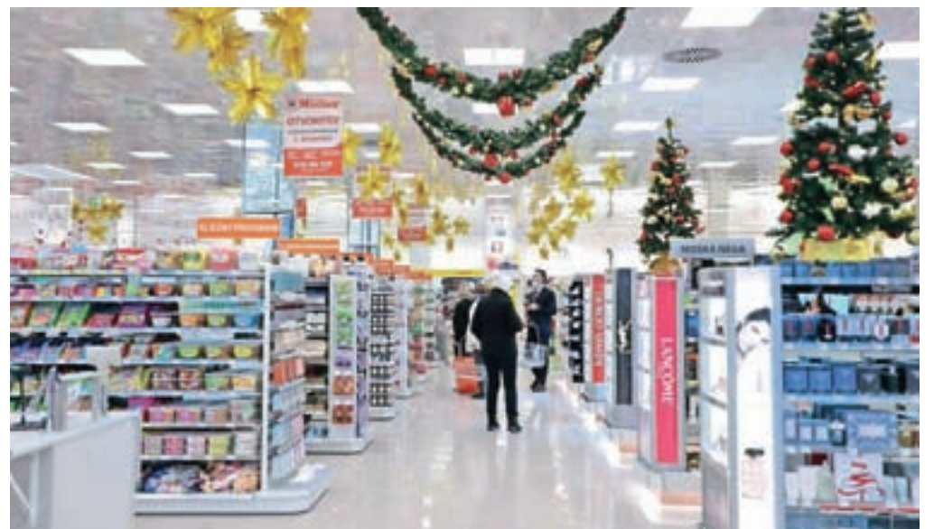
Novost v ponudbi je prostorna drogerija Müller, ki je bila potrošnikom iz zgornjega dela Gorenjske doslej najbližje v Kranju.