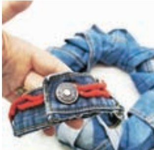
Sodoben, enostaven venec, v osnovi izdelan iz recikliranega džinsa

to je barva pričakovanja. Veliko venčkov nastane tudi v klasičnih rdečih, zelenih in belih odtenkih. Najbolj modni letos pa so po eni strani tako imenovani odtenki konjaka, ki so podobni odsevom plamenov v kaminu in vzbujajo občutke toplote. Za izdelovanje takšnih venčkov sama veliko