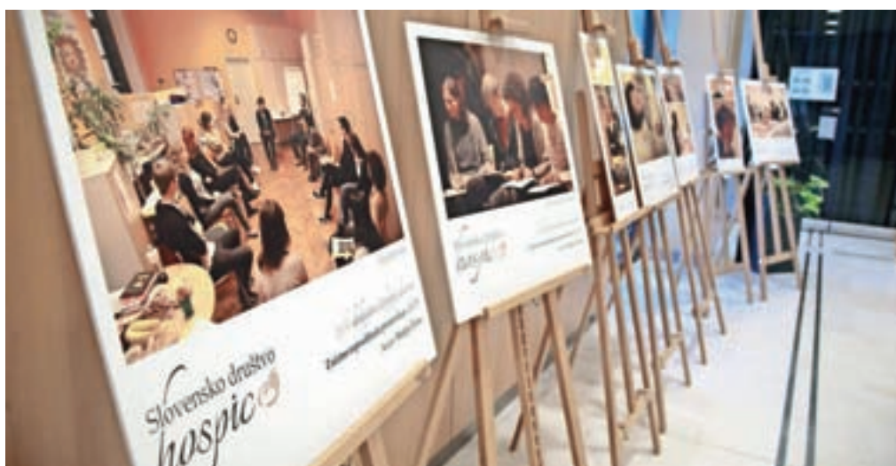
Razstava ob obletnici društva Hospic

V Knjižnici Blaža Kumerdeja na Bledu pa je na ogled potujoča razstava Mestnega muzeja Radovljica o Antonu Tomažu Linhartu.