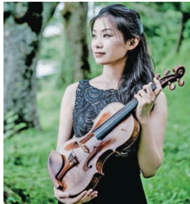
Na koncertu to nedeljo bo gostja večera violinistka Moeko Sugiura.

Z gostujočim velikim simfoničnim orkestrom in solisti bodo tako lahko prišle do