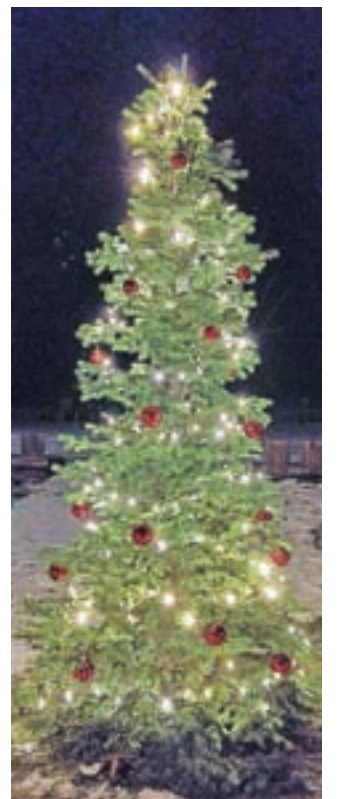
Letos je del praznične okrasitve tudi v lučkami okrašena smreka sredi Begunj.