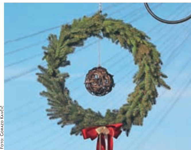
Okrasitev mesta temelji na uporabi naravnih materialov.