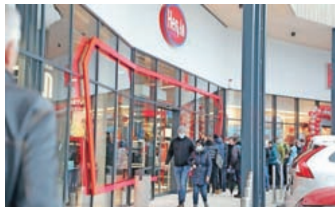
Kljub slabemu vremenu je bila prejšnji četrtek že pred odprtjem trgovin v novem nakupovalnem centru velika gneča.

V Hervis pa poudarjajo preglednost trgovine, kar zagotavljajo z delitvijo na t. i. športne svetove, kot so: tek, pohodništvo, fitnes in smučanje s servisom ter možnost prevzema naročil iz njihove spletne trgovine.