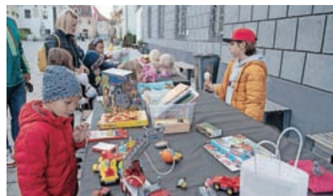
Izmenjevalnico in delavnico igrač so pripravili v sodelovanju z Ljudsko univerzo Radovljica.

z veseljem obiskovali vse aktivnosti," je dejala Blanka Grašič iz zavoda in dodala: "Tudi v prihodnje nameravamo pripraviti podobna doživetja, že prihodnji mesec pa na Linhartovem trgu spet pripravljamo ustvarjalne delavnice, kamor so vabljeni vse najmlajši." In kako so otroci preživljali jesenske počitnice? Desetlet-