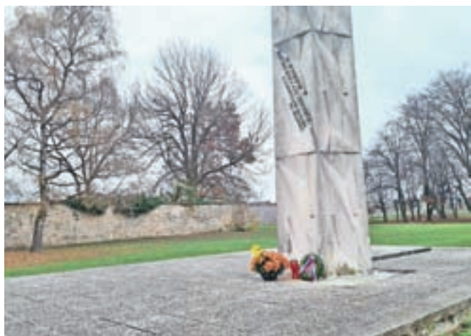
Namesto spominske slovesnosti so tudi pred spomenik na grobišču v grajskem parku položili lovorjev venec in cvetje.