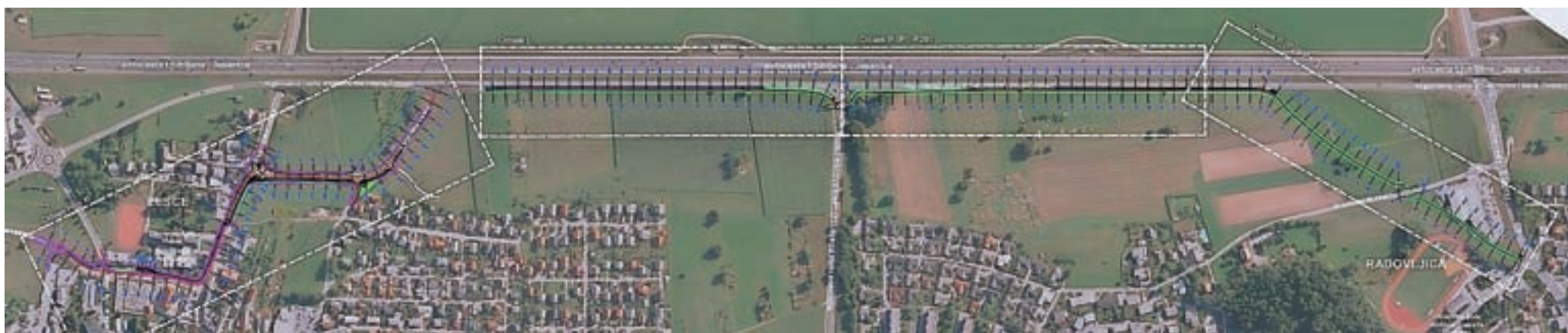
Na sliki je prikazana umestitev kolesarske poti z načrtovano povezavo Radovljice in Lesc.

Direkcija še letos načrtuje zaključek postopka recenzije projektne dokumentacije za izvedbo kolesarskega omrežja daljinskih kolesarskih poti v občini Radovljica, začetek gradnje pa se obeta že v naslednjem letu. Predvidoma v prihodnjem letu bo urejen tudi manjkajoči pločnik na odseku od križišča Gradnikove in daljinske kolesarske povezave do trgovine Spar. V pripravi je namreč projektne rešitve za servisni dostop do Spara, s katero bo usklajen tudi manjkajoči odsek pločnika, so še pojasnili na občinski upravi.