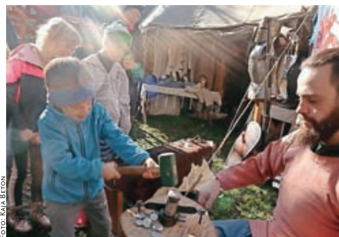
Viteški dan z delavnicami in igrami na gradu Kamen