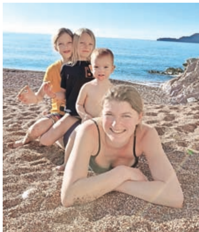
S hčerkami Kiro, Vasiliso in Vero lani na morju

In koliko stika ohranja z Rusijo? "V Rusiji so ostali moji starši in moji stari starši, dve babici in dedek. Zadnjič sem bila pri njih poleti 2019, po tem so potovanja postala otežena, tako da smo sedaj na vezi samo po video klicih. Rada bi našla možnost, da otroke peljem v Moskvo vsaj za prihajajoče novoletne praznike," odgovarja. Od ruskih navad je ohranila 'ta pravi zajtrk', ki vedno vsebuje toplo sveže pripravljeno ajdovo, proseno ali ovseno kašo z maslom ali mlekom, lahko z malinami ali borovnicami. "Punce obožujejo tudi bline, po domače palačinke, najbolj pa pogrešajo nekatere ruske sladice, ki jih gremo včasih iskat v rusko trgovino v Ljubljani. Sama osebno ničesar ne pogrešam, zelo pa me veselita raznolikost in množica živil za zdravo prehrano."