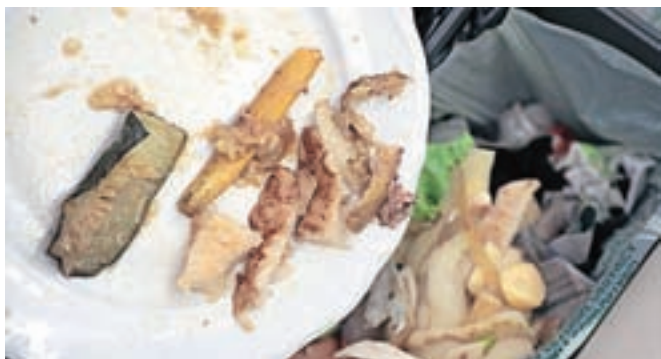
Pri ravnanju s hrano ustanove sledijo ukrepom za zmanjšanje izgub hrane in količine odpadne hrane.

Principu racionalnega naročanja v skladu z izkazanimi potrebami in normativi zdrave in uravnotežene prehrane sledijo tudi v Domu Dr. Janka Benedika Radovljica. "V fazi priprave obrokov smo pozorni na smotrno porabo živil, pri razdeljevanju pa na normative, ki so prilagojeni potrebam stano-