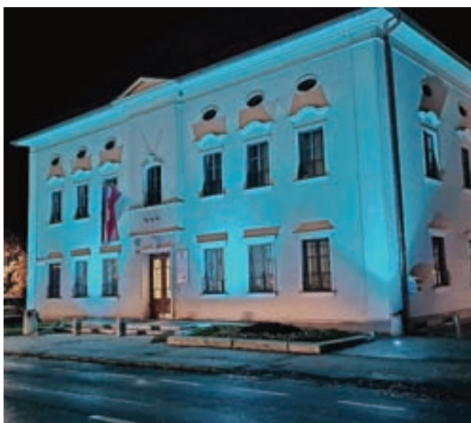
Modro osvetljena občinska stavba v podporo prizadevanjem za ozaveščanje o sladkorni bolezni, vijoličasta opozarja na raka trebušne slinavke.

Sladkorna bolezen prizade ne veliko ljudi vseh starosti, v zadnjem obdobju pa zbolevalo vedno mlajši. Z ukrepi za zdrav način življenja, zgodnjim odkrivanjem in zagotavljanjem dostopne in kakovostne zdravstvene obravnave lahko pomembno prispevamo k preprečevanju te bolezni oziroma odložimo njen pojav na kasnejše življenjsko obdobje, k boljšim izidom zdravljenja in k večji kakovosti življenja bolnikov s sladkorno boleznijo, opozarjajo strokovnjaki. Svetovni dan sladkorne bolezni je 14. november, tokrat je nosilna tema dostop do oskrbe osebam s sladkorno boleznijo. Ljudje s sladkorno boleznijo namreč potrebujejo stalno oskrbo in podporo, da bi obvladali svoje stanje in se izognili zapletom, milijoni ljudi s to boleznijo po vsem svetu pa do nje nimajo dostopa. Letos mineva tudi sto let od odkritja inzulina. Več informacij je na voljo na spletni strani Zveze druš-