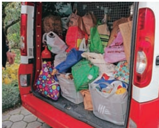
Zbrali so predvsem hrano ter higienske in gospodinjske pripomočke. Pomoč pri nalaganju in transportu v Varno hišo Gorenjske so prijazno ponudili radovljiški gasilci.