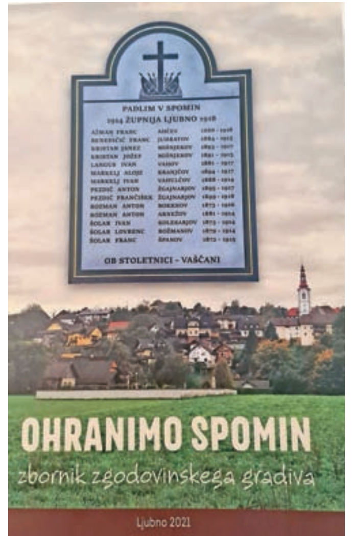
Naslovnica zbornika zgodovinskega gradiva Ohranimo spomin

Projekt postavitve plošče so izpeljali domačini, poveza-