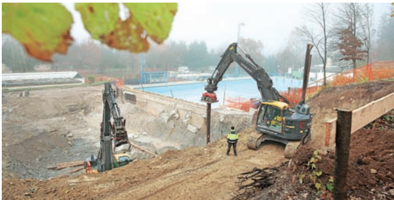
Rekonstrukcija se je začela takoj po podpisu pogodbe. Izvedba bo prilagojena tako, da bosta kopališče in kamp med poletno sezono lahko obratovala. V času del bo sicer za promet zaprto obračališče pri vhodu na kopališče.

Po zaključku prve faze bo sledila druga, v kateri je načrtovana še preureditev obstoječega olimpijskega bazena v pokrit olimpijski bazen z možnostjo odpiranja strehe ter ureditev vseh spremljajočih prostorov bazenov, zunanja ureditev kopališča in postavitev zunanjega tobogana.