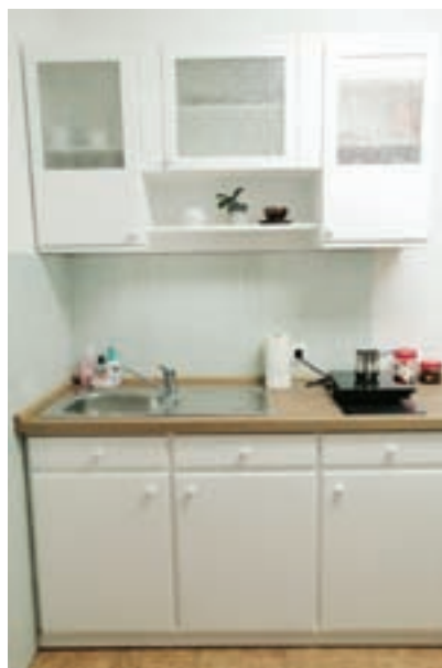
Stara čajna kuhinja na sedežu Komunale Radovljica v novem sijaju

Štacuna Brvač, Savska cesta 28, 4240 Radovljica, T: 040 256 770, E: stacuna.brvac@t-2.si