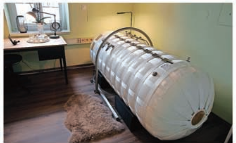
V centru Vdih Izdih na Bledu poskrbijo, da je tretma v hiperbarični komori za vsakega uporabnika prijetna izkušnja.