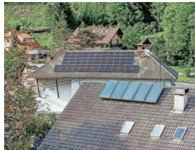
Proizvodnja elektrike je mišljena za samooskrbo, in ne kot profitna dejavnost, saj elektrike ne bodo prodajali.