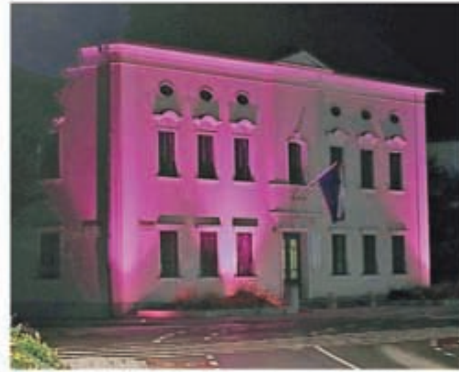
Stavba Občine Radovljica je v nočnem času ves oktober osvetljena z rožnato svetlobo, drevesa pred radovljiškim grajskim drevoredom pa je Ljudska univerza Radovljica tudi letos ovila z rožnatimi pleteninami.

»Številne raziskave kažejo povezovalno med zdravim načinom življenja in manjšim tveganjem za razvoj raka dojk. Po podatkih Svetovne