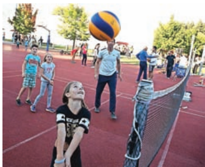
Otroci so se lahko v okviru predstavitve OK Bled preizkusili v odbojki.

uspešno zastopajo šolo na različnih športnih področjih, odlične rezultate pa dosegajo tudi v mednarodnem merilu. Vsako leto razglasijo tudi športnika in športnico šole. S svojo točko so se predstavili tudi veterani Sokolske zveze Slovenije, katere člana sta tudi radovljiška zveza in bežigrasjsko društvo. Zveza je izkoristila priložnost in preko točke veteranov izročila čestitke za vse dosežene športne rezultate in uspehe ter zaželela uspeha tudi v prihodnje. V športnem parku so obiskovalci lahko pridobili oziroma obnovili znanje o oživiljanju, v okviru predstavitve projekta Oživimo srce pa je bil nameščen tudi javno dostopen avtomatski defibrilator. Cilj projekta je povečati možnost preživetja ob srčnem zastoju.