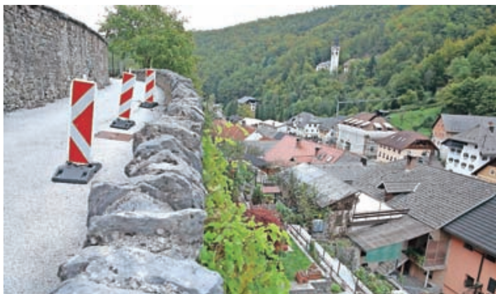
V načrtu je tudi sanacija opornega zidu pod cerkvijo sv. Lenarta v Kropi. Dela naj bi bila končana še v tem letu.

dovinski razvoj obdelave železa od rude do žeblja ter gospodarske, socialne in kulturne razmere v železarskih naseljih od 15. stoletja vse do propada fužin v 19. stoletju in ročnega žebjarstva v 20.