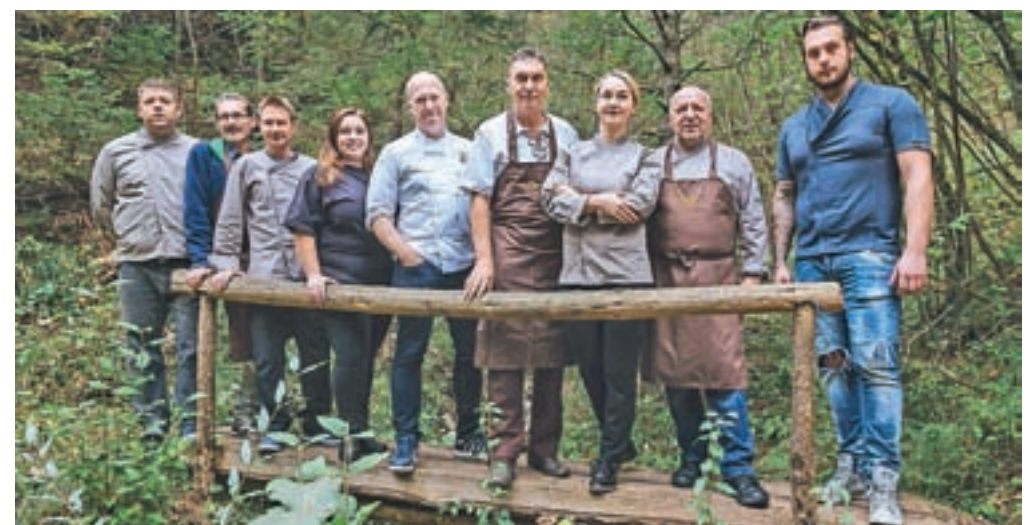
Devet kuharskih mojstrov bo za uvod v kulinarčni mesec pripravilo večerjo v Vili Podvin.

November, mesec Okusov Radolce, bodo z dnevi odprtih vrat in podobnimi dogodki popestrili tudi lokalni dobavitelji. Več o dogajanju bo objavljeno na spletni strani www.radolca.si .