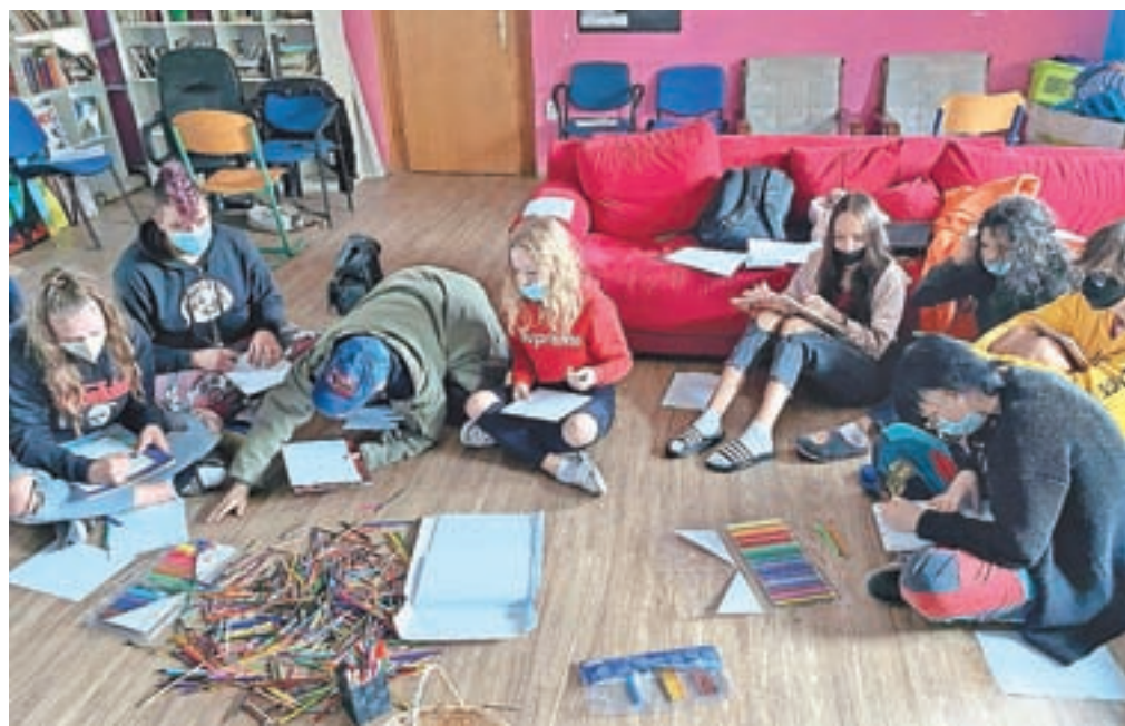
Spoznavna ustvarjalna delavnica, ki so jo v sklopu programa PUM-O pripravili ob začetku letošnjega šolskega leta. V programe se sicer lahko vpišete celo leto.

Poletni program je bil zaznamovan tudi z ustvarjalnimi delavnicami ter sodelovanjem z Zavodom Manipura ter Legebitro. Prostovoljci Zavoda Manipura so tako zanje pripravili zanimive delavnice, polne socialnih iger, ki so jih pretežno izpeljali v naravi, zaposleni v