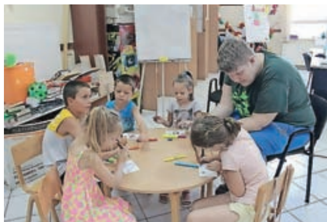
Dve udeleženci sta se v okviru evropske mobilnosti odpravili v Italijo, dve na Portugalsko, eden (na fotografiji pri delu z otroki) pa v Bosno in Hercegovino.

Za dostop do igre se jim lahko oglasite na elektronski naslov pum@siol.net.