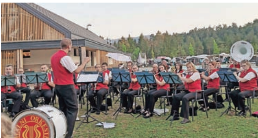
Sredi avgusta so v River Campingu Bled izvedli samostojni koncert.

A zaradi pandemije in z njo povezanih omejitev gibanja in prepovedi zbiranja so bili ti to pomlad prikrajšani za doživetje žive glasbe in odkrivanja akustike prostora. Orkester pa ni počival, pač pa se je lotil snemanja dveh avtorskih skladb. Poleti je imel tudi precej nastopov na različnih prireditvah v domačih Lescah in okolici. Pred-