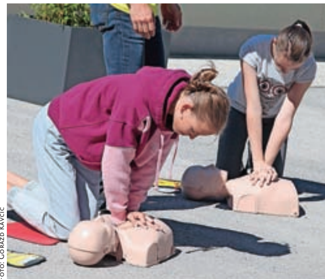
Tudi mlade na OŠ F. S. Finžgarja usposabljujejo, da jih ne bo strah pristopiti in pomagati, ko bo treba.

reševalci, občinski štab Civilne zaščite ter vse osnovne šole v občini. Doslej je bilo v okviru projekta izvedenih tudi skoraj devetdeset tečajev za laike, na katerih se je za posredovanje usposobilo skoraj dva tisoč osnovnošolcev, srednješolcev in drugih krajanov. Sicer pa so ob svetovnem dnevu prve pomoči na Rdečem križu Slovenije ponovno poudarili svoja desetletna prizadevanja, da se vsebine prve pomoči umestijo v učne načrte vseh slovenskih šol in da je dostop do usposabljanja o prvi pomoči zagotovljen v vseh življenjskih obdobjih. Pri tem pa poudarjajo, da je treba znanje s tega področja obnavljati in dograjevati.