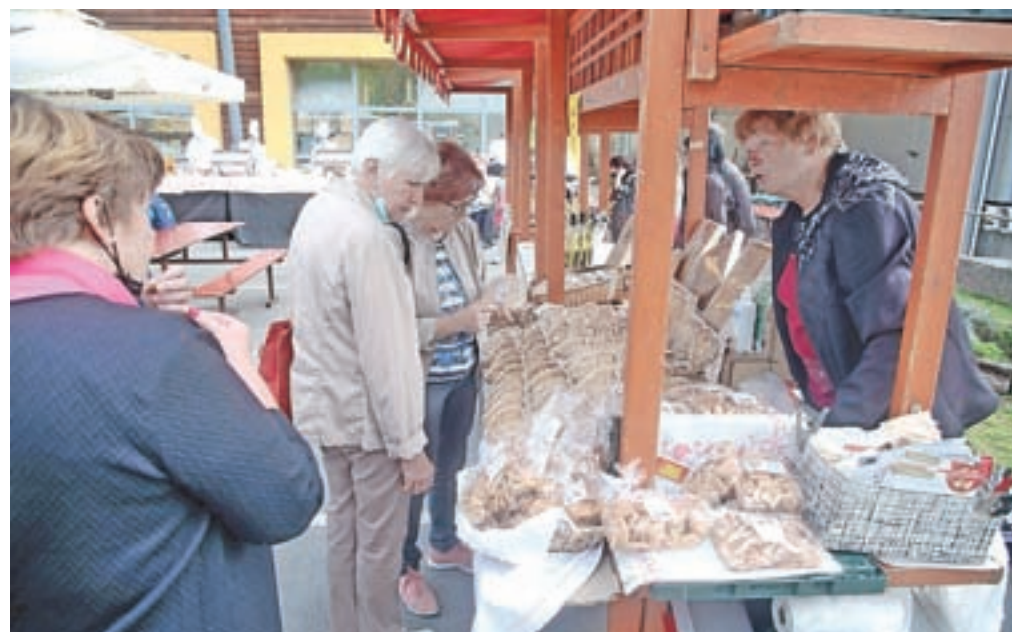
Tradicionalna tržnica s ponudbo čebeljih pridelkov in izdelkov, ki jih je bilo letos zaradi slabe letine manj kot običajno, je bila na prostoru pred Čebelarstvu centrom kljub okoliščinam lepo obiskana.

V spremljevalnem programu na prostoru pred Čebelarstvu centrom je bila seveda še tradicionalna tržnica s ponudbo čebeljih pridelkov in izdelkov, ki jih je bilo letos zaradi že omenjene slabe letine manj kot običajno, pa ustvarjalne delavnice, degustacije različnih vrst medu ter ponudba medenih pijač ter kave in čaja z medom.