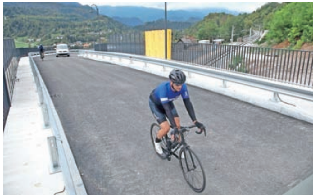
Promet po novem mostu nad železnico pa že teče, zato je tudi na Linhartovem trgu spet vzpostavljen običajni prometni režim, ki vstop na trg z motornimi vozili dovoljuje samo prebivalcem in dostavi.

njegorenjskih občin, zgornjegorenjske občine nadgradnjo gorenjske železniške proge podpirajo, saj bo zagotovo pozitivno prispevala k trajnostni mobilnosti – za uporabnike prijaznejšemu javnemu železniškemu prometu. Ob tem, pravijo, se zavedajo problemov, ki jih je zaradi gradnje povzročila prekinitve železniškega prometa, in razumejo težave, s katerimi se v zadnjem letu srečujejo potniki. "Z investitorji in izvajalci si ves čas gradnje prizadevamo, da bi bila dela čim prej končana in da bi omilili posledice, ki otežujejo življenje tako potnikom kot prebivalcem. Sproti opozarjamo tudi na odpadke in sanacijo vseh poškodb na prometni infrastrukturi, ki so posledica gradbišč. Kot smo seznanjeni, pa bo promet na obnovljeni progi v celoti normaliziran marca 2022, ko se predvidoma zaključijo vsa dela ob nadgradnji proge," so še pojasnili v odgovoru, ki ga je v imenu občin pripravila Razvojna agencija Zgornje Gorenjske.