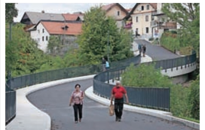
Prenovljeni most nad železnico na poti proti radovljiškemu pokopališču je zdaj širši in omogoča srečevanje dveh osebnih vozil, dodali pa so mu tudi tako imenovani konzolni pločnik.

V sklopu urejanja železniškega postajališča je občina uredila še nadomestno cestno povezavo proti zaselku Na Mlaki, urejena pa bo tudi pešpot, ki vodi od gostišča Kunstelj do novega nadvoza oziroma novega perona.