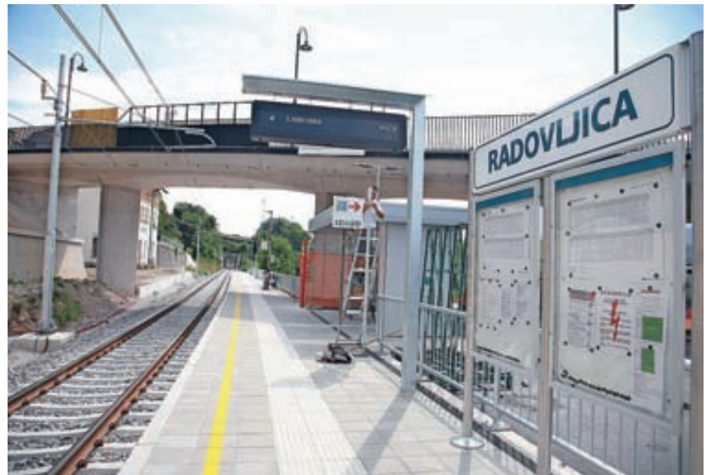
Železniški promet po obnovljeni progi naj bi bil v celoti normaliziran šele prihodnje pomlad.

"Uporabniki storitev železniškega potniškega prometa, ki iz smeri Gorenjske dnevno migriramo na delo v Ljubljano in nazaj, smo pričakovali, da bo istočasno z obnovo železniškega predora sosednje države zaključena tudi obnova odseka železniške proge Kranj–Jesenice. Na veliko razočaranje je bilo odprtje proge podaljšano, 'normalne' vožnje potniških vlakov brez zamud nismo doživeli niti do današnjega dne. Zaprtje proge tako v pomladnih in zgodnjih poletnih mesecih letošnjega leta kot tudi lansko jesen smo potniki zaradi situacije kot posledice pandemije in posledično možnosti dela od doma lažje sprejeli kot sedaj, ko potniški vlak na relaciji med Jesenicami in Lescami zaradi počasne vožnje ustvari od 30 do 45 minut zamude na posamezno vožnjo," je v pismu Slovenskim železnicam in ministrstvu za infrastrukturo, zapisala ena od sicer rednih uporabnic železniškega potniškega prometa.