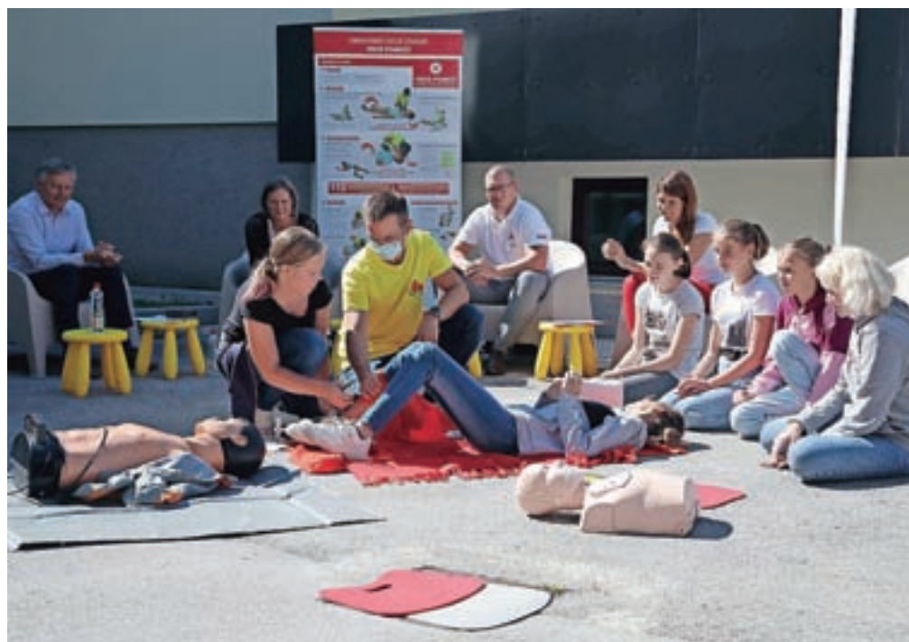
Vsako drugo soboto v septembru že več kot dve desetletji zaznamujemo svetovni dan prve pomoči. Letos so v ospredju otroci in mladi – ter stališče, da bi morala biti prva pomoč sestavni del učnih načrtov že v vrtcih ter osnovnih in srednjih šolah.

iz izkušenj in dodaja: "Pomembno je, da otroke začnemo vzgajati že v osnovni šoli in jim privzgojimo vrednoto pomagati drugim. To je tisti najpomembnejši del – saj veste, imamo sto in en izgovor, da gremo mimo človeka, ki leži na tleh. Prepričan sem, da je bistveno lažje pristopiti in pomagati, če imamo znanje o tem, kako pomagati človeku, ki potrebuje pomoč," je povedal Müller, navdušen nad znanjem in odnosom otrok, prepričan, da se bodo, ko bo