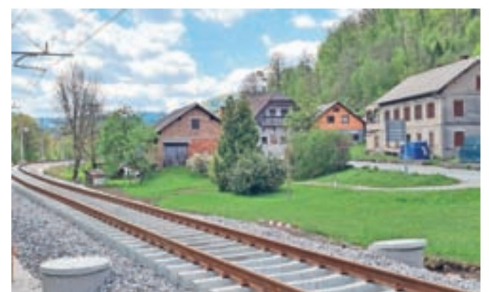
Po železniški progi med Kranjem in Jesenicami bodo vlaki ponovno začeli voziti prihodnji petek.

Po železniški progi med Kranjem in Jesenicami bodo vlaki ponovno začeli voziti v petek, 30. julija, po 15. uri. Kot so nam povedali na Direkciji RS za infrastrukturo, bo takrat ukinjena popolna zapora proge, ki je trajala vse od začetka novembra lani. Obnovitvena dela se v teh dneh zaključujejo, na odseku Kranj–Podnart so že zaključena dela na zgornjem in spodnjem stroju, nameščena je vozna mreža, urejeni so prepusi, podporni zidovi ter odvodnjavanje. Na odseku Podnart–Lesce Bled polagajo tire, na odseku Lesce Bled–Jesenice pa zaključujejo izvedbo prepustov, treh novih podvozov, premostitvenih objektov ter sanacijo predora Žirovnica. Obenem so že začeli polagati tire. Že 10. julija pa je ponovno stekel železniški promet skozi obnovljeni železniški predor Karavanke, in sicer od postaje Jesenice do postaje Področja v Avstriji, kjer je po novem le še en tir.