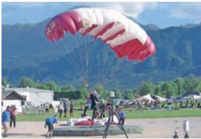
Junija se je na padalskem tekmovanju svetovne serije v skokih na cilj v Lescah pomerilo kar šestintrideset ekip.

Konec junija so nato dobro izkoristili domače letališče v Lescah in s pomlajeno ekipo prikazali dobre skoke na cilj ter prišli do dvojnih stopničk. Organizacija tekmovalja je bila zaradi ukrepov za prep-