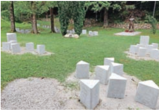
Obnova grobišča se je začela prejšnji teden, končana pa naj bi bila do sredine septembra.

pa bo poskrbelo Kamnoseštvo Šajn. Prenovljeni bodo tako obelisk kot spomeniki z imeni padlih, trenutno poteka peskanje, med predvidenimi deli so še prenova vseh napisov, nanašanje ustrezne zaščite ter betoniranje in poravnava vseh kubusov. Obnova bo predvidoma zaključena do 15. septembra. "Zaradi narave dela vojno grobišče v teh dneh ne kaže prave podobe, zato svojce padlih in druge obiskovalce vojnega grobišča prosimo za razumevanje v skupnem prizadevanju po čimprejšnji in kakovostno izvedeni obnovi," še pravijo na občinski upravi.