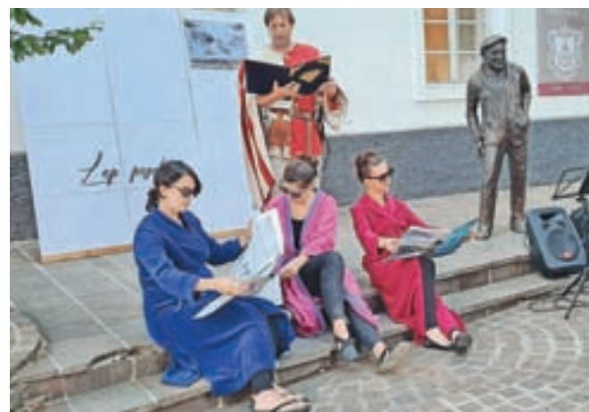
Letoviščarke z "živih razglednic", ki so predstavile turizem v Radovljici skozi več kot stoletno obdobje.

Takratni pristojni avstrijski minister je bil nek češki inženir, ki je bil Slovencem naklonjen. Prigovarjal je, naj se ne branijo postaje, ki bo prinesla pretežni večini prebivalstva velike gospodarske koristi. Purgerji pa so neomajno vztrajali pri svojem sklepu za zaščito vere in ženske morale. Njegova ekscelenca je končno pristal in odgovoril: »Prav! Če postaje nikakor nočete, vam je ne smemo vsiliti. Samo to vam še povem, da boste ta sklep obžalovali. Ampak postaje ne boste dobili niti takrat, ko jo boste želeli.«"