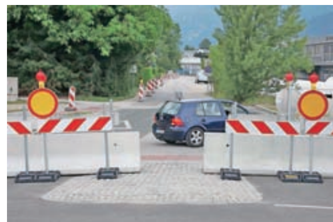
Pred krožiščem je onemogočeno prehajanje motornih vozil v smeri Šobčeve ceste, Boštjanove ulice ter Doline. Dostop vozil je mogoč s severne strani.

mesecih zaradi popolne zapore državne ceste ob rekonstrukciji železniške proge in podvoza pod njo uporabljala kot obvoz za Lipniško dolino. Kot pojasnjujejo na občinski upravi, je cilj spremenjene prometne ureditve predvsem odprava tranzitnega prometa z namenom izboljšanja varnosti vseh udeležencev v prometu, še zlasti pešcev in kolesarjev, pa tudi preprečitev pospešenega slabšanja stanja ceste, ki je občina po odločitvi sodišča ne sme vzdrževati, dokler sodni postopki v zvezi z lastništvom niso zaključeni.