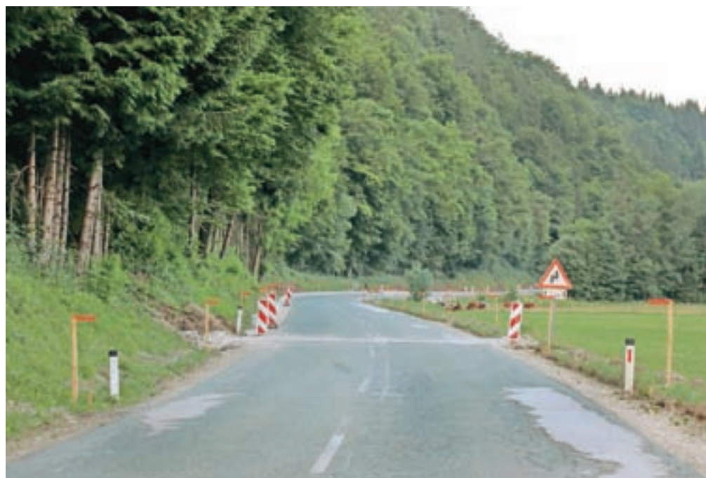
V času intenzivnih del na različnih odsekih državnih in lokalnih cest ter obnove železnice se v Lipniški dolini neprestano srečujejo z zaporami, obvozi in zastoji, ki jim zelo otežujejo vsakodnevno življenje.

Predsednik sveta krajevne skupnosti Nejc Šter se strinja, da so razmere v zadnjem letu precej zahtevne. "V zadnjem desetletju na našem območju ni bilo večjih projektov, potem pa najprej obnova cestišča na Ovsiašah in Poljšici, ki je trajala skoraj enot leto, nato