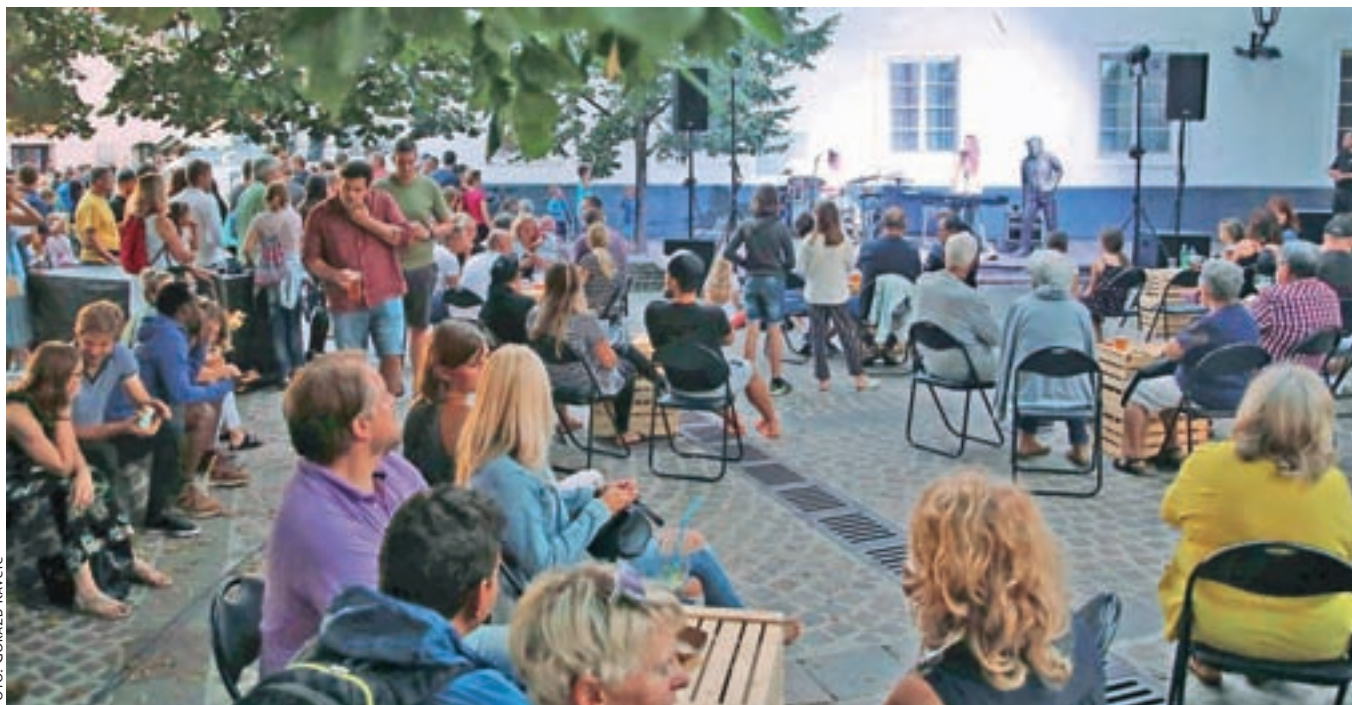
Priljubljeni četrtki v starem mestnem jedru Radovljice, letos umaknjeni na slikovit trg pred cerkvijo sv. Petra.

bodo predstavili domači proizvajalci čokolade, potekale pa bodo številne odlične delavnice za odrasle in otroke: o spajanju vina in čokolade, piva in čokolade, konjaka in čokolade ..., med gosti festivala pa bodo številna znana imena slovenske kuhinje, ki bodo obiskovalcem ponudila vrhunsko doživetje. Vstopnice bodo od avgusta naprej na voljo v spletni trgovini www.radolca.si in na prodajnih mestih Eventima.