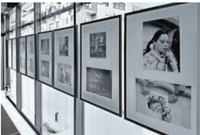
Razstava v pritličju v spomin Alenki Bole Vrabc, avtorica Vida Markovc, 3. nagrada