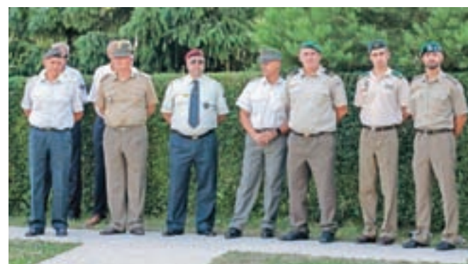
Slovesnosti so se udeležili tudi predstavniki Natovega centra odličnosti za gorsko bojevanje iz Poljč.

vensko zastavo, jo izobesim tudi na svoji rojstnodnevni zabavi, naročim torto v obliki slovenske zastave, predvsem samo slovensko glasbo ... Zakaj? To je del mene. Čutim, da lahko to poklonim tudi drugim, saj mislim, da se predvsem mladi premalo zavedajo, kakšen blagoslov je živeti v svoji državi, z lastnim jezikom, himno, zastavo in grbom. Vse to nam je bilo mladim, ko smo se rodili, že položeno v zibko. Zato srčno upam, da se bo med Slovenci narodna zavest okrepila.«