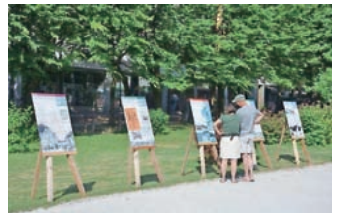
Na desetih panojih so poudarjeni ključni dogodki v zgodovini društva. Razstavo, ki bo v Grajskem parku na ogled do konca avgusta, je oblikoval krajinski arhitekt Luka Vidic.