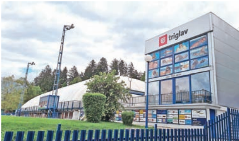
Postopna obnova radovljiškega kopališča se je začela že predlani.

Pri tem poudarjajo, da je cilj posodobiti kopališče tako, da bo predstavljalo atraktivno turistično, sodobno športno-rekreacijsko ter terapevtsko in velneško infras-