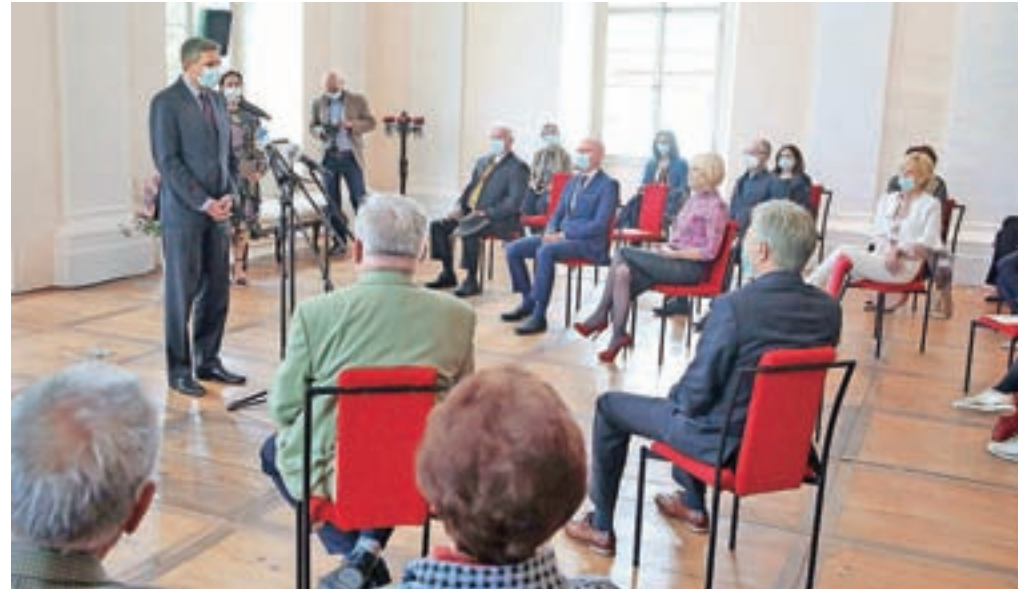
Slavnostni govornik na odprtju prenovljenega muzeja je bil predsednik države Borut Pahor.