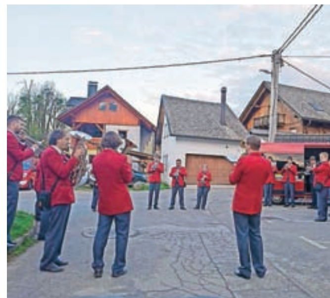
Letošnja prvomajska budnica Pihalnega orkestra Lesce, letos zaradi epidemije v omejenem obsegu

Godbeniki upajo, da bo prihodnje leto možno organizirati budnico s celotnim orkestrom, da bodo lahko obiskali več krajev in da bi na posameznih točkah lahko izvedli daljše nastope. Tokrat so bili postanki kratki, malo dlje so se zadržali le pred Domom dr. Janka Benedika. Z zaključnim koncertom pa so se poslovili pri Šobcu, kjer se je zbralo kar nekaj ljudi. Tako kot se za prvi maj spodobi!