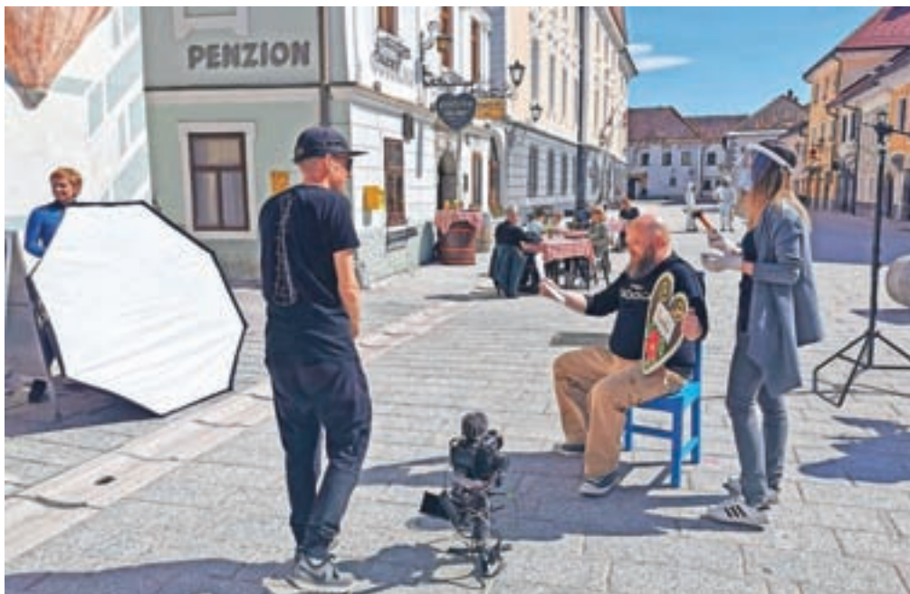
Novi promocijski videospot so posneli na slikovitem Linhartovem trgu.

Kratek promocijski video s pomenljivim naslovom "Radovljica, vzem'te si cajt" je tako med 10. in 23. majem mogoče zaslediti v oglasnih blokih Televizije Slovenija, oglaševalska akcija pa poteka tudi na omrežjih Facebook in YouTube, na kanalih VisitRadolca. Televizijskemu oglasu se z enakim sporočilom v drugi polovici maja pridružuje tudi radijski, prihodnji mesec pa načrtujejo lansiranje še enega promocijskega spota, v katerem bodo v ospredje postavili raznoliko ponudbo športnih doživetij v naravi, ki jih omogoča