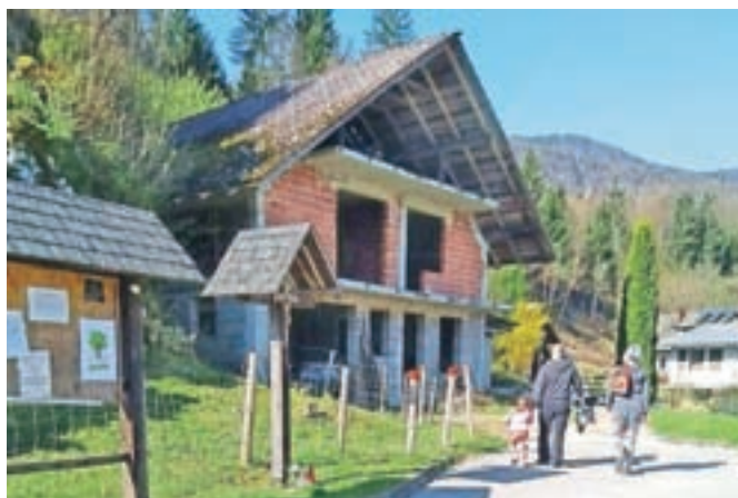
Čistilne akcije v Kropi se je udeležilo okoli trideset krajanov. Največ smeti so pobrali ob cestah.

območje kamnoloma Brezovica, ob glavni cesti Brezovica-Kropa), ob glavni cesti Kropa-Jamnik, na območju poslovilne vežice ter pokopališča, na območju nekdanjega počitniškega naselja RK Osijek, otroško igrišče in ob cesti Kropa-Stočje. Največja težava z odpadki je ob glavni cesti in nasploh ob cestah, saj so odpadki odvrženi predvsem iz avtomobilov,« je izkušnje strnila Pavličeva.