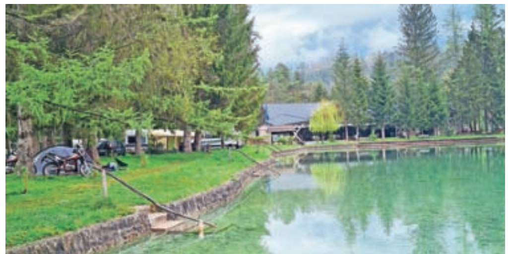
Letošnjo sezono tudi v Kampu Šobec krojita predvsem epidemija in vreme.

»Zadnje obdobje je za vse nas polno prepovedi in omejitev. Zato smo se v kampu odločili, da do ljudi poskusimo pristopiti na drugačen način in jim s pozitivno