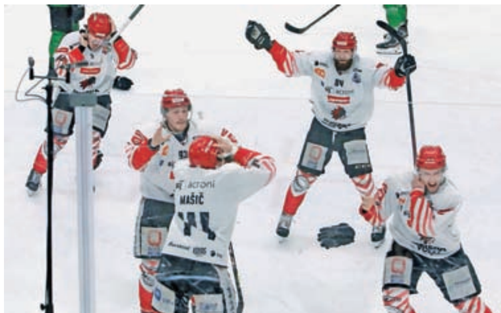
Na odločilni tekmi za naslov državnega prvaka 10. maja v Ljubljani

Ko so se ukrepi sprostili, so nogometaši Šobca Lesce odigrali zaostalo tekmo desetega kola v tretji slovenski ligi – zahod in izgubili v gosteh z Adrio z 2 : 1. Sledila sta še dva poraza, v gosteh z ekipo Brinje Grosuplje z 2 : 1 in doma s Famo Vipava z 2 : 1. Prejšnjo soboto so dosegli izredno pomembno zmago za obstanek v gosteh proti Savi Kranj z 2 : 0. Ko boste brali te vrstice, boste že vedeli, kako so doma igrali v sredo proti Adrii. Lestvica po sobotnih tekmah v ligi za obstanek: 8. Tolmin (20 točk, tekma manj), 9. Adria (20), 10. Sava Kranj (14), 11. Škofja Loka (12), 12. Žiri (11), 13. Šobec Lesce (9), 14. Zagorje (2). Tekme igrajo tudi leški mladinci in kadeti v drugi slovenski ligi – zahod. Mladinci so v dveh tekmah imeli polovičen uspeh. Doma so premagali Izolo z 2 : 1. Z enakim rezultatom so v nedeljo izgubili v gosteh z ekipo Arne Tabor. Kadeti so dosegli zmago in remi. Izolo so premagali s 3 : 0, z ekipo Arne Tabor pa so se razšli brez zadetkov. Na skupni lestvici mladincev in kadetov vodi Roltek Dob z 48 točkami. Med 12 ekipami so leški mladinci in kadeti na odličnem šestem mestu z 28 točkami.