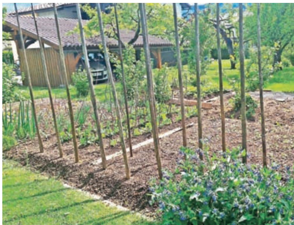
Majhen korak k samooskrbi je zagotovo tudi pridelava hrane doma, na vrtovih in njivah. Domača ekološka hrana je bistveno bolj zdrava, njena pridelava ima manjši negativen vpliv na okolje.

O samooskrbi s hrano v Sloveniji in na zgornjem Gorenjskem težko govorimo, ugotavljajo na Razvojni agenciji Zgornje Gorenjske (RAGOR), kjer so tudi zato, ker se je v času epidemije covida-19 (spet) pokazalo, kako pomembno je, da smo si vsaj del hrane sposobni pridelati sami, spet aktivirali projekt Lokalna samooskrba. "Majhen korak k samooskrbi je zagotovo tudi pridelava hrane doma, na vrtovih in njivah. Domača ekološka hrana je bistveno bolj zdrava, njena pridelava ima manjši negativen vpliv na okolje. S pridelavo lastne hrane preprečimo uvajanje monokultur, ki uničujejo naravno ravnovesje, in se upiramo multinacionalkam, ki agresivno prodirajo na evropski trg," poudarjajo in dodajajo, da je prav prehranska varnost in dostopnost