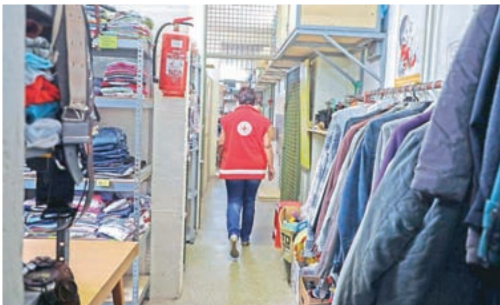
V radovljiškem Rdečem križu poudarjajo, da centralno skladišče ne more biti odlagališče, zato prosijo, da pri oddaji tekstila upoštevate minimalne standarde čistoče.

Barbara Zorko iz Ekologov brez meja je pojasnila, da je delež prodaje rabljenih oblačil v primerjavi z nakupom novih v letu 2019 znašal le 0,62 odstotka in je po njihovem mnenju premajhen. »Trgovin z rabljenimi oblačili na Gorenjskem resni veliko, a več kot bo povpraševanja po rabljenih oblačilih, več bo tudi ponudbe in različnih drugih poslovnih modelov, kot sta najem in izposoja oblačil,«