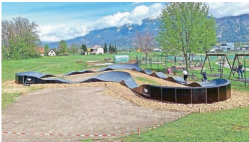
Kolesarski poligon ob otroškem igrišču pri Centru v Lescah

Lesce so dobile kolesarski poligon, tako imenovani pumptrack, ki stoji ob otroškem igrišču pri Družbenem centru. Pri postavitvi so moči združili Krajevna skupnost Lesce, Elan Invento in sponzorji. Idejni vodja postavitve je bil član sveta KS Lesce Matjaž Planinšek, ki je povedal, da gre za modularni poligon, ki je sestavljen iz zaobljenih grbin in zavojev, ki so med seboj ritmično povezani v krožno zanko. Namenjen je vožnji s kolesi, poganjalci, skiroji, rolkami, skratka vsem, kar je na dveh kolesih. Na poligonu je