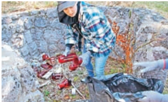
Ob grobišču talcev v Dragi so ljudje ostanke sveč nametali kar v opuščeno obzidje.

"Neprijetno nas je presenetila predvsem Draga – ob grobišču talcev so ljudje ostanke sveč nametali kar v opuščeno obzidje, poleg sveč pa je bilo tam kar nekaj drugih odpadkov, med njimi celo barve za lase. Poleg tega pohodniki praktično celotno dolžino ob potoku uporabljajo za stranišče, povsod je polno toaletnega papirja. Najbrž bi bilo glede na veliko število planincev,