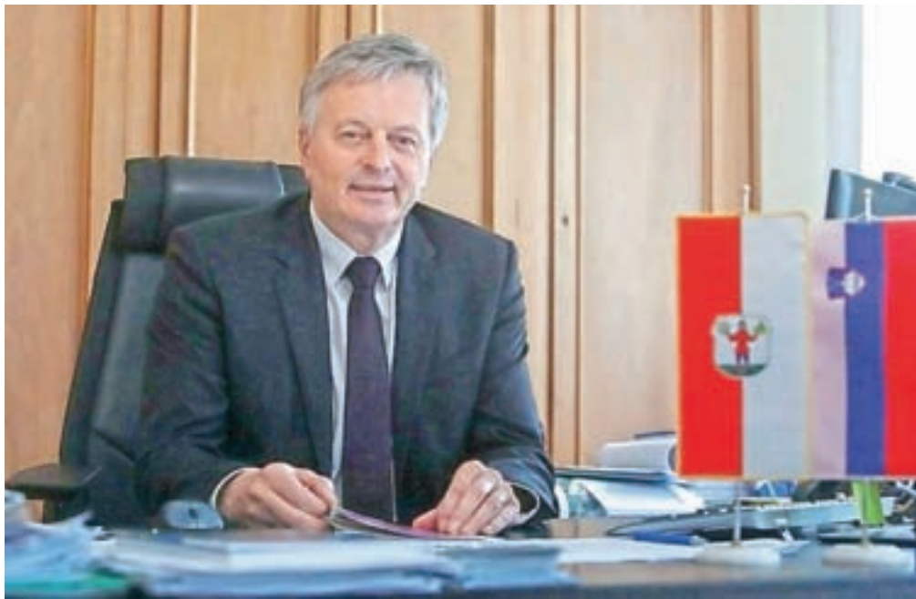
Župan Ciril Globočnik

Krajevni skupnosti Lesce in Begunje sta se v zadnjem obdobju povezali v prizadevanjih za aktivnejše reševanje težav, s katerimi se srečujejo v daljšem obdobju. Prejšnji mesec sta izdali tudi lastni publikaciji, v katerih so predstavljeni problemi in izzivi, kot jih opredeljujejo, ter posebej poudarjen odnos med krajevnima skupnostma in občino. Ker se v javnosti pojavljajo tudi razmišljanja in ugibanja o odhodu iz radovljiške občine in ustanovitvi lastne, smo nekaj vprašanj o aktualnem dogajanju zastavili tudi županu Cirilu Globočniku.