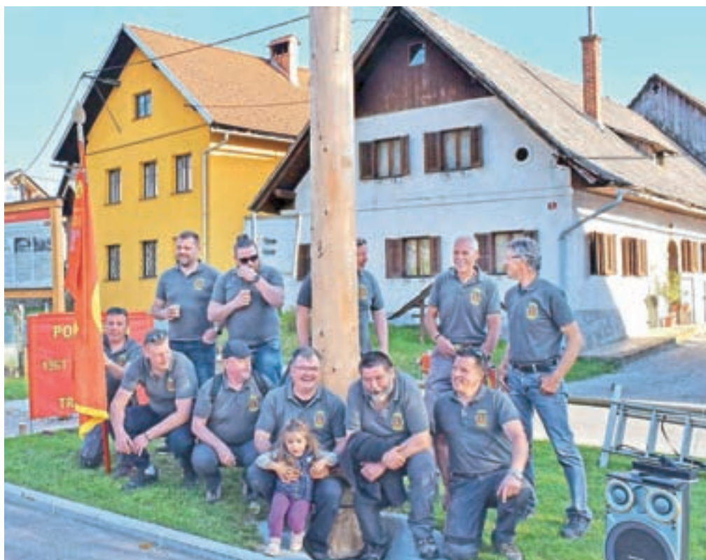
Tradicijo postavljanja mlaja v Poljčah nadaljuje mlajša generacija domačinov.