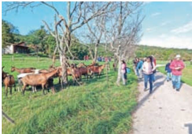
Člani društva na eni od strokovnih ekskurzij, na kateri so se seznanjali s primeri dobre prakse reje drobnice.