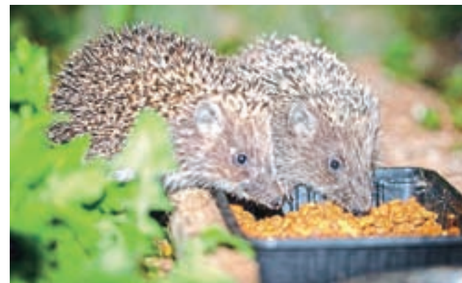
Jež sodi med ogrožene živalske vrste, zato so človekova pomoč, previdnost in sočutje pomembni za njegovo ohranitev.

Ježovo preživetje je v veliki meri odvisno od človeka. Pomagamo mu lahko tako, da nasadimo čim več grmovja, zelenja in ne pokosimo vse trave. Pospravimo mreže in druge predmete, kamor bi se jež lahko zapletel ali zagozdil. Pred kurjenjem ognja dobro pregledamo listje in veje, da ježa ne bomo živega zažgali. Ježi sicer znajo plavati, toda v primeru, da nimajo urejenega izhoda iz vode, lahko utonejo, zato je smiselno, da k ribnikom, zbiralcem vode in bazenom nastavimo veje, kamenje ali deske. Predvsem pa je smiselna velika previdnost na cesti, da ježa