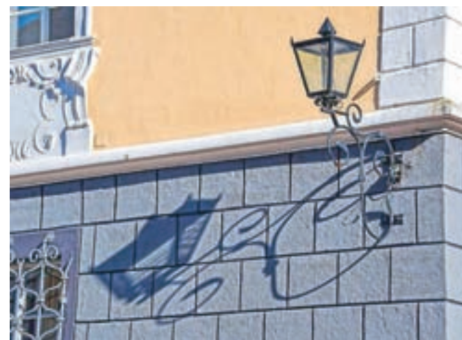
Mestna lampa, avtor Janez Resman, druga nagrada za temo Kovaška tradicija Kroepe