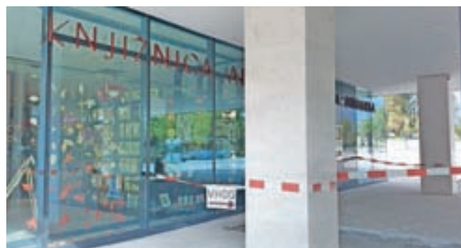
Izvedli bodo tudi sanacijo stropa kletne etaže, kjer se vztrajno in vedno resneje pojavlja zamakanje ob požarnem stopnišču. S tem namenom so že odstranili tlak in začeli urejanje drenaže po celotni dolžini ploščadi pred stavbo, kjer se ulovi in nadzorovano odteka voda, ki predvidoma prihaja z Vurnikovega trga.

Zdaj popravljajo poškodovano stavbo pohoštvu, kjer se na velikih drsnih vratih pojavlja zamakanje ob večjih nalivih, ter odpravljajo zamakanje na podest v drugem nadstropju, ki je po oceni izvajalca sanacije tudi posledica netesnosti fasade. Izvedli bodo tudi sanacijo stropa kletne etaže, kjer se vedno resneje pojavlja zamakanje ob požarnem stopnišču. S tem namenom so že odstranili tlak in začeli urejanje drenaže po celotni dolžini ploščadi pred stavbo, kjer se ulovi in nadzorovano odvede voda, ki predvidoma prihaja z Vurnikovega trga, so še pojasnili.