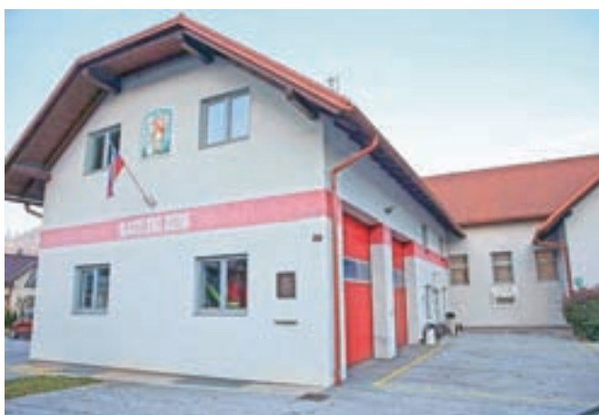
Dejavnost socialne oskrbe in pomoči na domu je Dom dr. Janka Benedika že preselil v prostore Gasilskega doma v Mošnjah.

Kot je pojasnil Gril, so se na sestanku s pristojnimi na Občini Radovljica dogovorili, da celotno delovanje enote, ki izvaja storitve pomoči