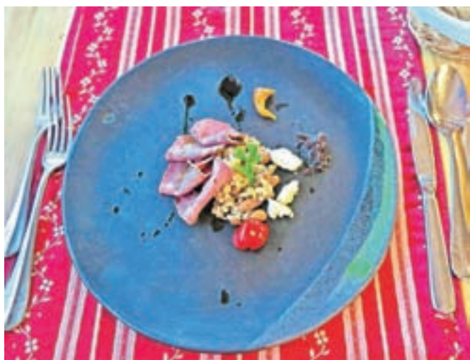
Prekajeni goveji jezik, hrenov sladole, bučno olje in domače vložnine, ki so okuse na krožniku še nadgradile.