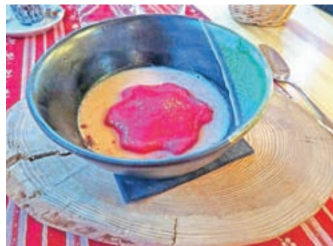
Pastinakova kremna juha z rdečo peso je bila postrežena res domiselno.