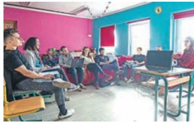
V KamRa se ves čas nekaj dogaja. To jesen je na sporedu delavnica, na kateri se bodo udeleženci učili uspešne organizacije dogodka.

Ja, spremljam situacijo s tem virusom. Klobuk dol vsem zdravstvenim delavcem, ki morajo prenašati vse to, ni jim lahko. Enako tudi ljudem na drugih delovnih mestih, ki morajo prav tako osem ur nositi masko in imeti kontakt z ljudmi, npr. trgovci. Tudi sama sem med počitnicami delala v Psihiatrični bolnišnici Begunje, saj so zaradi covid-19 potrebovali dodatno delovno silo, z veseljem sem priskočila na pomoč.