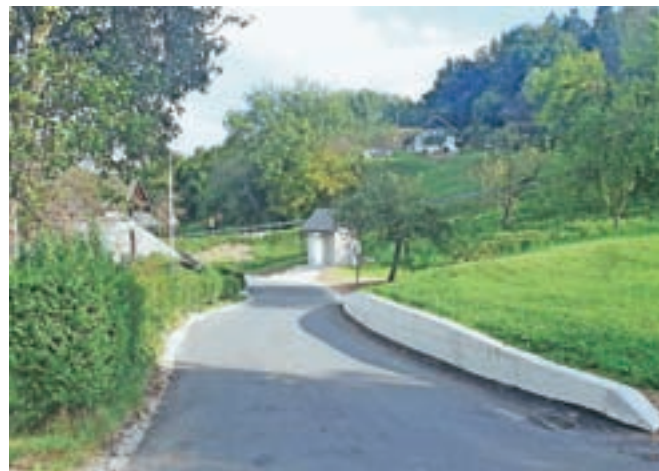
Ob obnovi odsekov vodovoda v skupni dolžini nekaj manj kot dva kilometra je bila obnovljena tudi cesta in na novo zgrajena javna razsvetljava.

pa vendarle verjamem, da so obnovljeni odseki vredni vloženega truda," je na priložnostni slovesnosti, ki so jo pripravili učenci Podružnične šole Ovsišje, povedal župan.