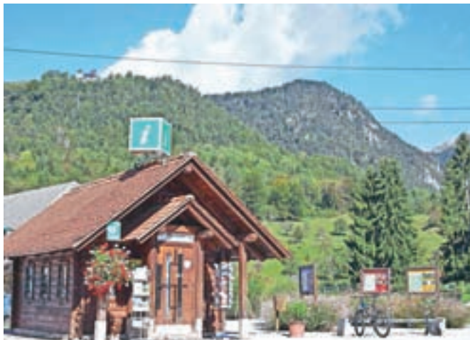
Ocenjevalci so posebej poudarili urejeno središče kraja in TIC, ki je odprt tudi ob nedeljah.

Med pozitivnimi dogodki in pridobitvami v Radovljici so organizatorji pohvalili četrtkovne poletne večere z glasbo in Okusi Radol'ce in novi katalog ter pestro ponudbo za vsakovrstne goste, od športa do kulturnih znamenitosti. Posebej so poudarili pestre kulturne prireditve na visokem nivoju, rekreativne površine, urejen kamp,