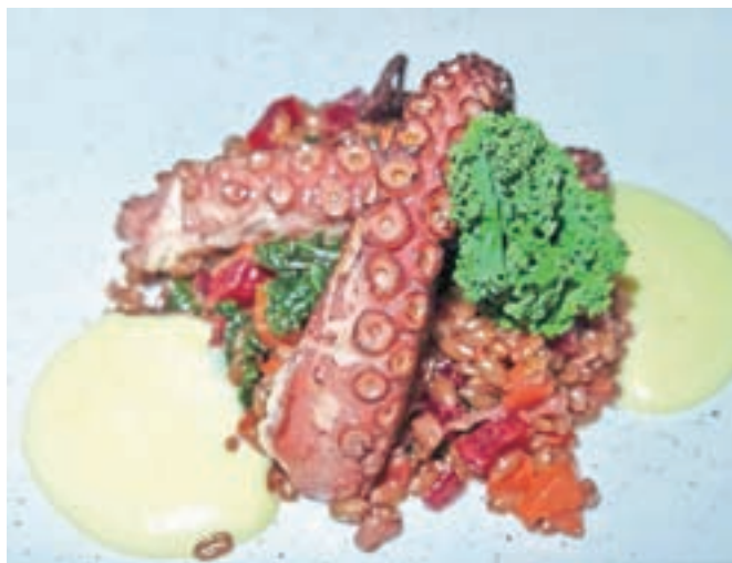
Hobotnica s pirino rižoto z zelenjavo in dodano peno Likozarjevega krompirja

a kot smo že zapisali, se zaradi nastale jesenske situacije letošnja kulinarična Radovljica prestavi na čas, ko bo izvedba mogoča. Vseeno pa si lahko doma privoščite kakšen dober krožnik, okusite Radovljico iz domačega naslonjača, bi lahko rekli. Večina zaprtih gostinskih obratov se je namreč prilagodila in se odločila za možnost oseb-