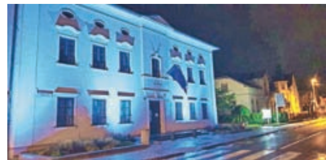
Stavba Občine Radovljica in Čebelica, stavba upravne enote nasproti nje, sta bili prejšnji petek osvetljeni v modri barvi.

Ob 75. obletnici ustanovitve Organizacije združenih narodov so tudi stavbo Občine Radovljica in radovljiške upravne enote obsvetili z modro svetlobo. Ustanovitvena listina OZN je začela veljati 24. oktobra 1945, slovensko ministrstvo za zunanje zadeve je občine pozvalo, da 24. oktobra, na dan OZN, v večernih urah zgradbe, spomenike ali druge znamenitosti osvetlijo v modri barvi. V Radovljici so se na pobudo odzvali in tako sta bili prejšnji petek zvečer v središču mesta modro osvetljeni stavba Občine Radovljica in secesijska stavba Čebelica, ki je razglašena za kulturni in zgodovinski spomenik lokalnega pomena.