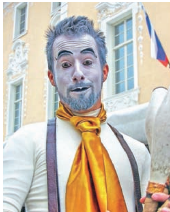
Pogled z višine, avtor: Matjaž Klemenc, diploma