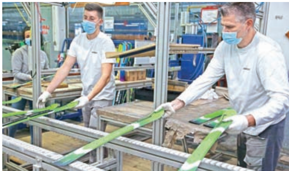
Eden ključnih stebrov Elana so nekdanji in sedanji zaposleni s svojim znanjem in izkušnjami.

smučala na Elanovih smučeh in osvaja kolajne na vseh največjih tekmovanjih. Kot je dejal Križaj, je ponosen, da je lahko del Elanove zgodbe in da še vedno lahko pomaga pri promociji in delno tudi pri razvoju. Tudi Filip Flisar vso svojo kariero gradi z Elanom. »Elan je podjetje, ki je odprto in ki prisluhne – včasih celo malo norim idejam,« je dejal.