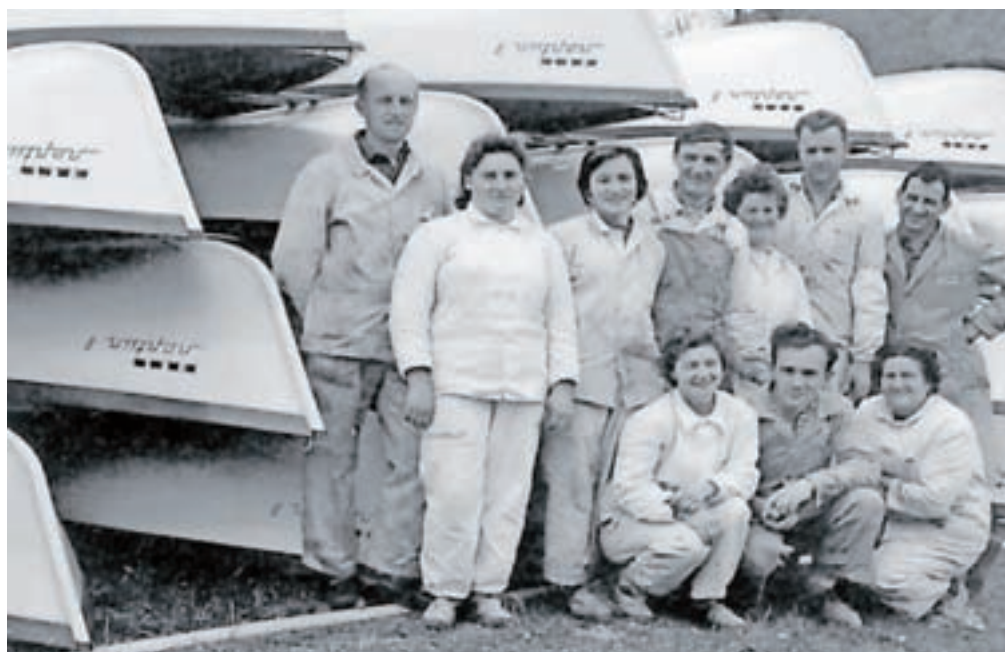
Delavci Elana leta 1949