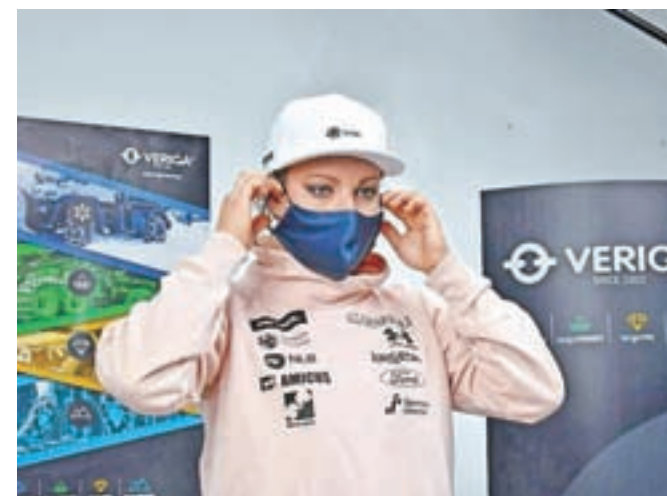
Tudi smučarka Ilka Štuhec spodbuja k uporabi zaščitne maske.

Slovenski smučarji, med njimi tudi Ilka Štuhec, se na smučiških in zunaj njih držijo zdravstvenih priporočil. Kot uspešni posamezniki, katerih mnenje ljudje cenijo in upoštevajo, k odgovornemu vedenju spodbujajo tudi druge. Ilka Štuhec je tako nedavno v prostorih podjetja Veriga v Lescah posnela video sporočilo, v katerem je pokazala, kako pravilno namestiti masko. "Maska je v tem času, od marca do sedaj, postala stalna spremljevalka naše ekipe. V primeru okužbe lahko izgubimo nastop na tekmah ali pomembne dni treninga, zato si prizadevamo odgovorno ravnati in skrbeti zase ter drug za drugega, kar med drugim pomeni tudi vestno uporabo maske, dodatno razkuževanje rok in tako dalje. Verjamem in želim si, da bo smučarska sezona varno izpeljana, saj to prinaša tudi tekme v Sloveniji. Skupaj, čeprav na varni razdalji, bomo premagali virus," je ob tem povedala priljubljena vrhunska športnica.