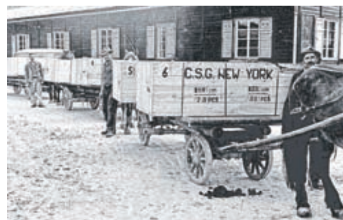
Prva pošiljka smuči v ZDA