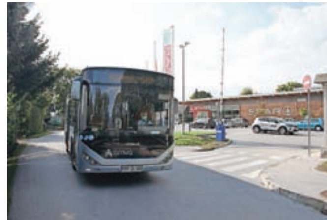
Po ulicah Radovljice in Lesca je na krožni trasi spet vozil brezplačen mestni avtobus.