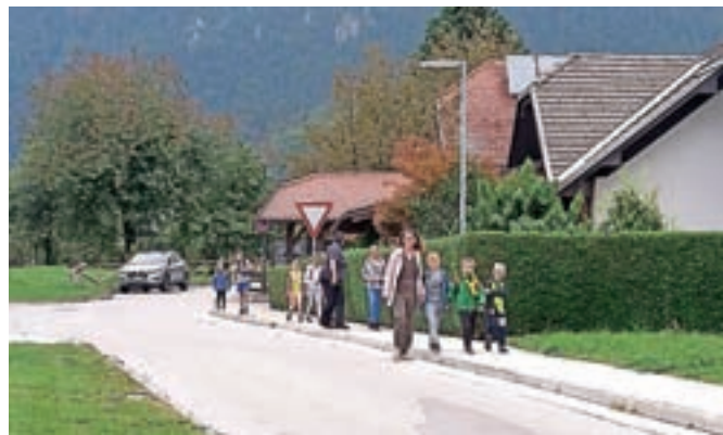
Številne aktivnosti za promoviranje hoje in kolesarjenja, med njimi tako imenovani pešbus, so pripravili tudi po osnovnih šolah in vrtcih.

letos odpravilo okoli petdeset kolesarjev. Po vrnitvi so si lahko ogledali biodinamični učni vrt in se okrepčali z napitki in jedmi, pripravljenimi iz pridelkov z vrta, ki zaključuje že svojo sedmo sezono.