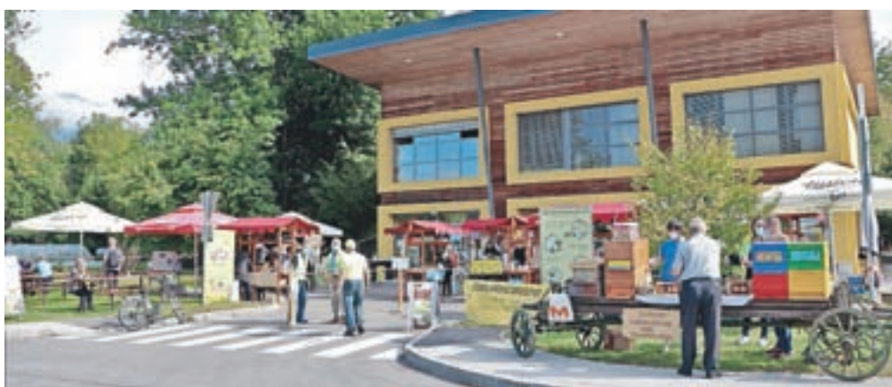
Čebelarstvo razvojno-izobraževalni center Gorenjske je pred kratkim gostil Dan medu v kulinariki in Festival medu.

Medeni meni Gostišča Drača je ponujal izbiro med sirovimi štruklji z medom in orehi, jelenom v medeno-poprovi omaki, čokoladno salamo z medom in