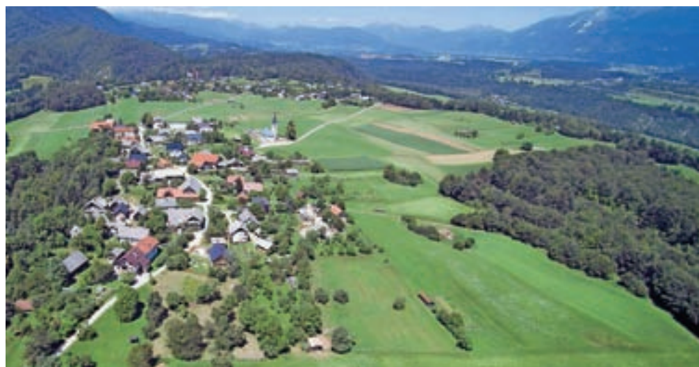
Pogled na Zgornjo, Srednjo in Spodnjo Dobravo iz zraka, kjer so razvidni grupiranje vasi ter poselitev in prometna mreža, urejena okoli kraških vrtač. Na fotografiji ni medsosedskih ograj, kar je značilnost Dobrav, ki pomembno prispeva h kvaliteti javnega prostora ter skupnega življenja.

O razvoju vasi največ izvemo s starih zemljevidov, zaradi natančnosti je zelo uporaben Franciscejski kataster, ki so ga v letih 1826 in 1827 izdelali za Gorenjsko. Kataster poleg parcelnih mej prikazuje in opisuje tudi posamezne stavbe ter krajino. Starejši zemljevidi so manj natančni,