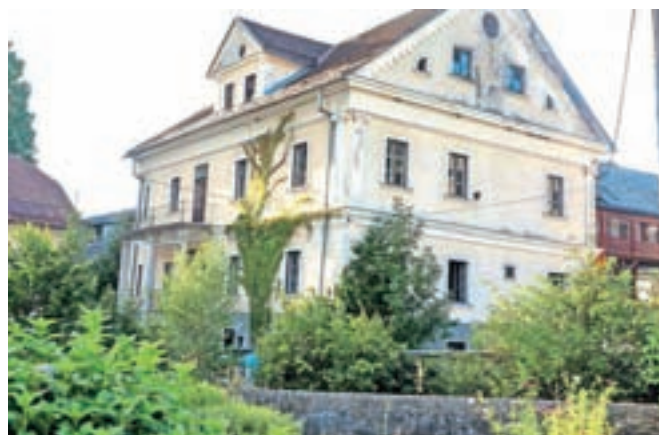
V stavbi nekdanjega Doma Matevža Langusa bi lahko uredili nov dom za starejše.

drugi strani bi bili v Kamni Gorici veseli obnove že nekaj let praznega objekta na robu vasi. Gre za stavbo, ki jo je od fužinarske družine Toman