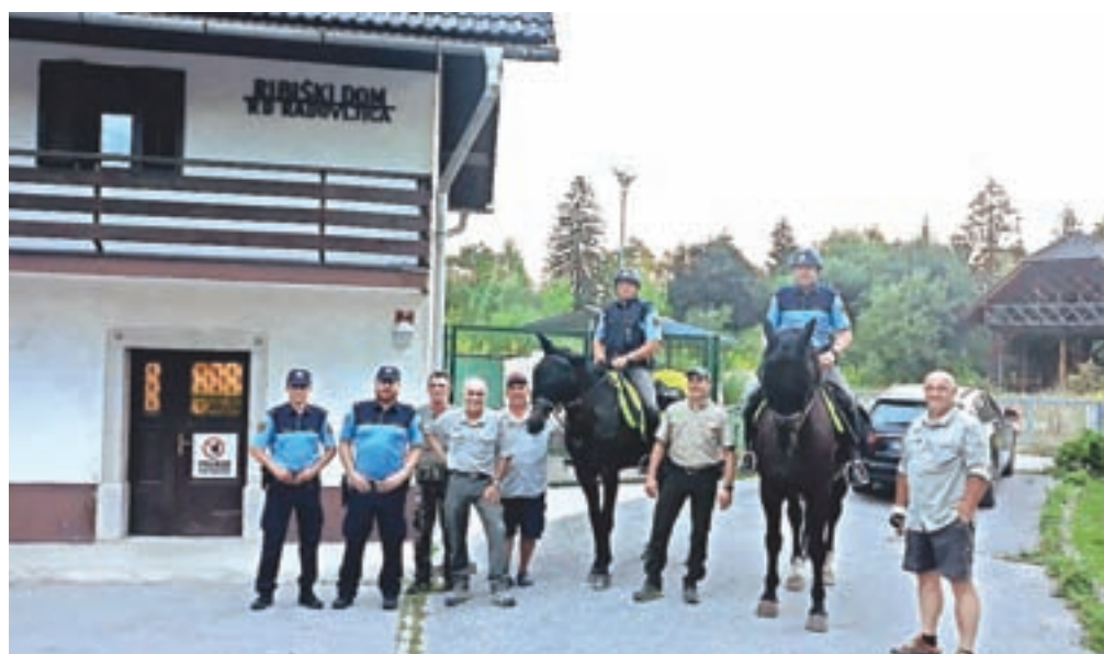
Radovljiškim ribičem so se pri nadzoru sredi avgusta pridružili tudi policisti konjeniki.

Kot je pojasnil, so čuvaji sicer pri svojem delu samostojni, včasih pa se zgodi, da so pri tem ogroženi, zlasti ko izvajajo postopek z večjim številom oseb, ki nimajo dobrega namena in najpogosteje organizirano nezakonito lovijo ribe. "To pomeni, da ribič nima pri sebi ribolovne dovolilnice, ki mu dovoljuje ribolov po pravilih ribolovnega režima, lovi pa na prepovedan način s sredstvi, ki niso dovoljena. V zadnjem času so krivolovci vse bolj organizirani in specializirani za nedovoljen ribolov,