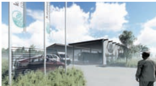
Priprave na izgradnjo komunalne opreme so v teku.

Občina je sprejela vse potrebne akte, da lahko nadaljujejo izvajanje projekta v letu 2020. Sprejeta sta bila Odlok o Občinskem lokacijskem načrtu za Centralno čistilno napravo (severni del) ter Program opremljanja stavbnih zemljišč za območje OLN za Centralno čistilno napravo (severni del) in o merilih za odmero komunalnega prispevka.