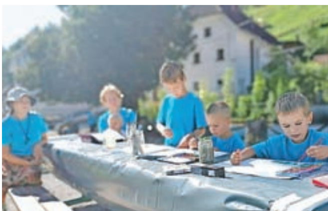
Izbira na delavnicah je bila zares velika, otroci pa so lahko ustvarjali z različnimi materiali.