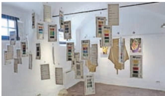
Razstava je v Šivčevi hiši na ogled še vsa jesen.