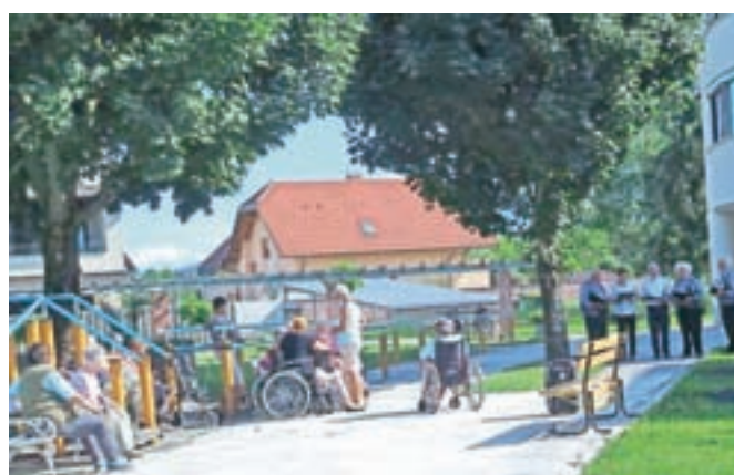
Na obisku v Domu dr. Janka Benedika so bili pevci ...