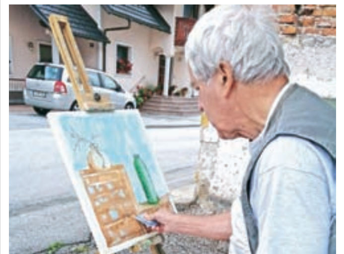
Nekateri so se odločili za motive v hiši, spet drugi za okolico.