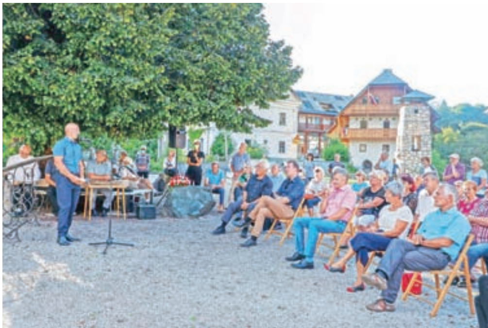
V Kamni Gorici so se na pobudo krajevne skupnosti in kulturno-turističnega društva, ki si prizadevata za ohranjanje bogate dediščine kraja, poklonili spominu na rojaka Lovra Tomanu.