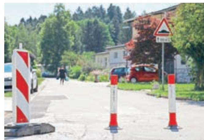
Med obema naseljem je bilo vse poletje s stebrički, nameščenimi na cestišču, fizično onemogočeno prehajanje motornih vozil.

ljšanju prometne varnosti, zlasti ranljivejših udeležencev v prometu, in h kakovosti bivanja na območju celotne stanovanjske soseske. Zaporu so z odločbo, izdano v začetku meseca, kljub temu odpravili. "Takšno odločitev je občinska uprava sprejela glede na prejete pobude z nasprotovanjem uvedbi slepe ulice. Po odpravi slepe ulice bo izvedeno štetje prometa in izdelana primerjalna analiza prometnih tokov na območnih prometnicah, ki bo podlaga za nadaljnje odločitve glede prometne ureditve na tem območju. Prometna signalizacija in povozni stebrički bodo odstranjeni po pravnomočnosti izdane odločbe in najkasneje do 1. oktobra," so sporočili z občinske uprave.