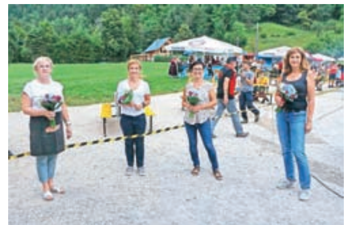
Dekleta, ki se jim je Niki za pomoč pri sodelovanju in organizaciji dogodka zahvalil javno in s cvetjem.

kovalcev je prišlo tudi iz tujine: tradicionalno so se oglašili Avstrijci, Bavarci, celo iz Švice so se pripeljali. Seveda je bilo v primerjavi s prete-