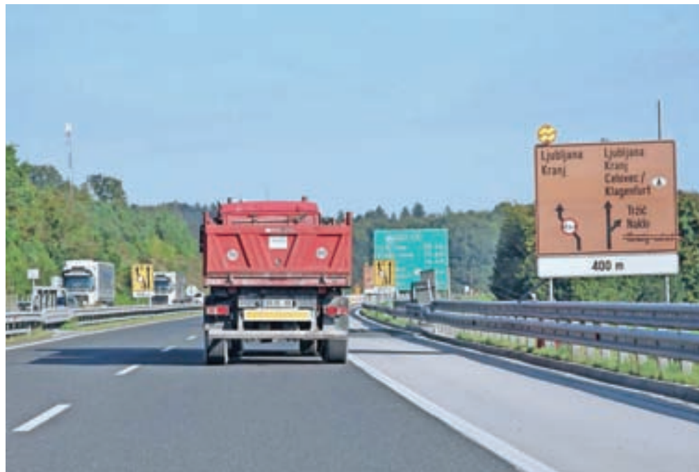
Gradbena dela na gorenjski avtocesti na odseku od Brezij do Strahinja so stekla v ponedeljek in bodo po načrtih končana do sredine novembra.

Gradbena dela so stekla v začetku tega tedna, promet pa bo v času del potekal po dveh, sicer zoženih pasovih v