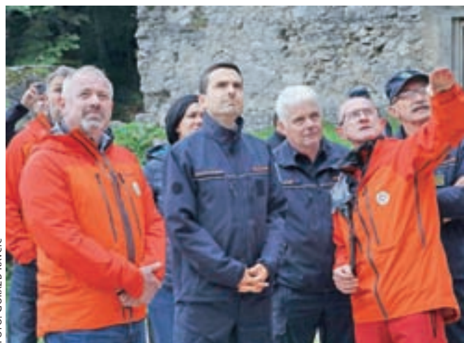
Reševalno vajo si je ogledal tudi minister Matej Tonin.

vanje najbolj idealen," je poudaril Smolej. Prikazali so še primera najzahtevnejših stenskih reševanj, ko je treba iz stene rešiti visečega alpinista na vrvi. "Ti štirje načini reševanja za slovenske razmere zadostujejo," je še pojasnil Smolej. Na obrambnem ministrstvu imajo v načrtu 15 milijono-