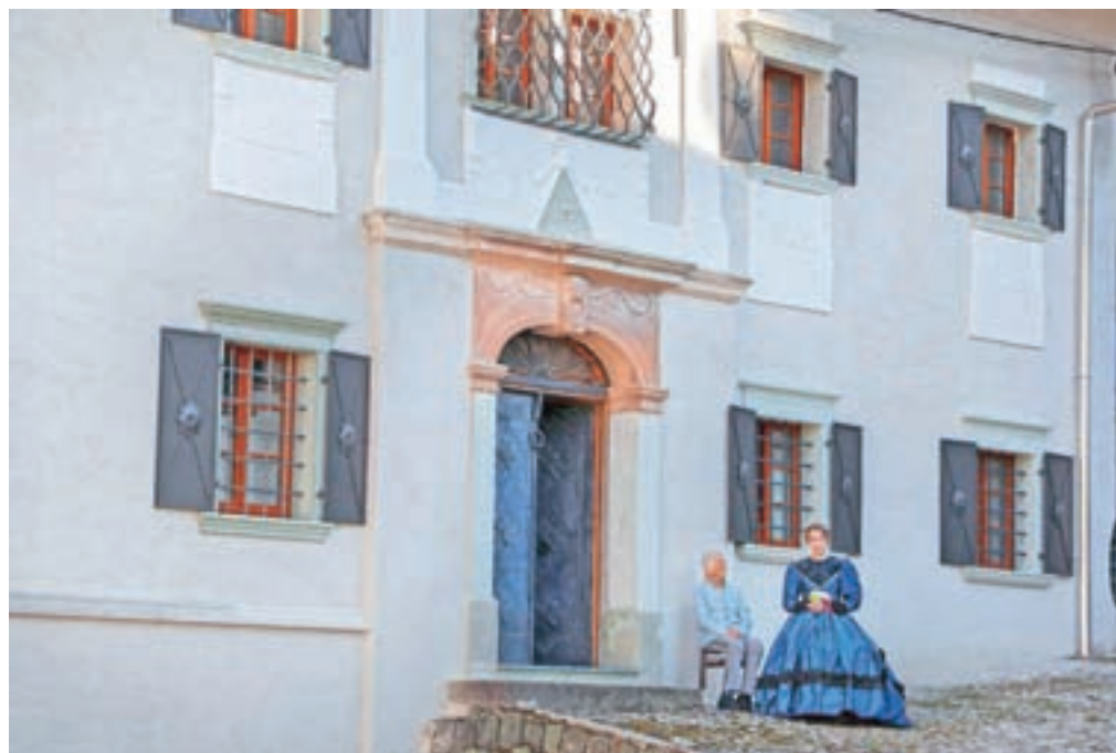
Ena od ohranjenih posebnosti hiše, ki spominja na družino Toman, pa je hišno znamenje nad vhodom, v trikotnik vklesan trojni križ. Ta ima lahko več pomenov, eden je tudi vera, upanje, ljubezen ...