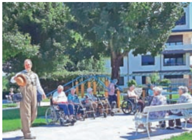
... za posebej prešerno razpoloženje pa so poskrbeli tudi Rdeči noski.

čeni predstavitvi smo malo pozabili na tegobe in bolečine. Zato lahko rečemo, da