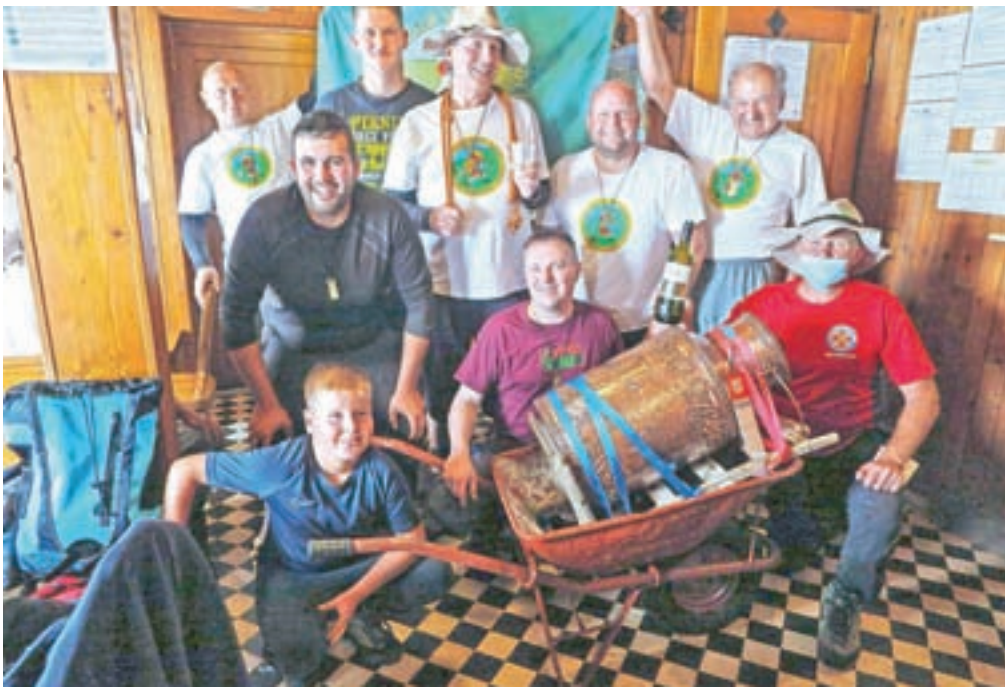
Podelitev zakramenta večne mladosti je tokrat potekala v koči.

Pohod je bil tokrat namenjen le članom kluba, brez povabljenih gostov, že na zbornem mestu v Radovljici pa so pisne prijave dopolnjevali z elektronskimi naslovi in telefonskimi številkami, ki so služile za izdelavo seznama udeležencev. Zaradi aktualnih razmer so bili organizatorji primorani odpovedati koncert pihalnih orkestrov in večerni koncert, povorko ter druženje na Linhartovem trgu. Pohodniki upajo, da bo prihodnje leto pohod potekal v starem sijaju, kot doslej že skoraj pol stoletja.