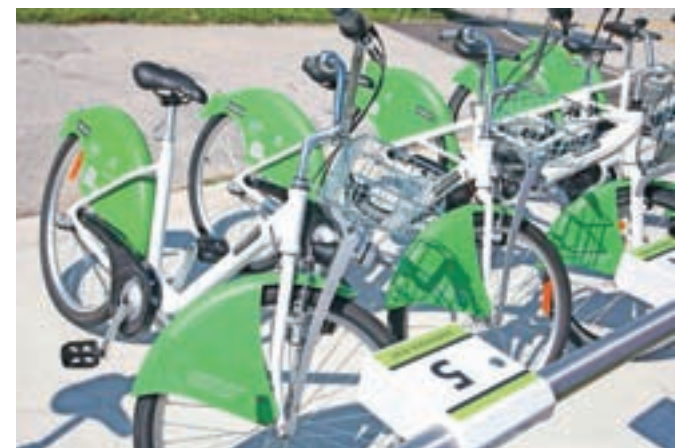
Na treh postajah za avtomatizirano izposojanje koles bo občinska uprava v sredo organizirala predstavitve uporabe novega sistema Gorenjska.bike. / FOTO: GORAZD KAVČIČ

Osnovne in srednje šole ter vrtci se z različnimi dejav-