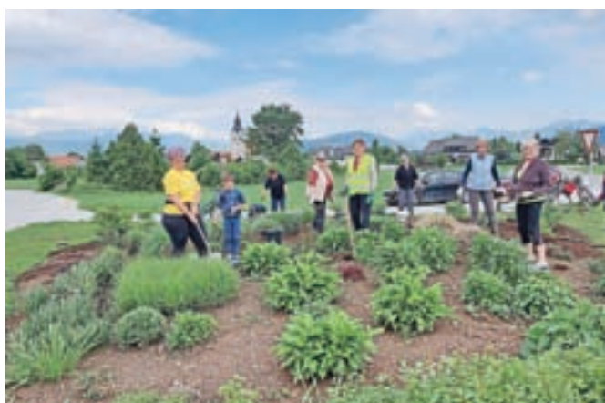
Članice hortikulturnega društva pri urejanju gredic