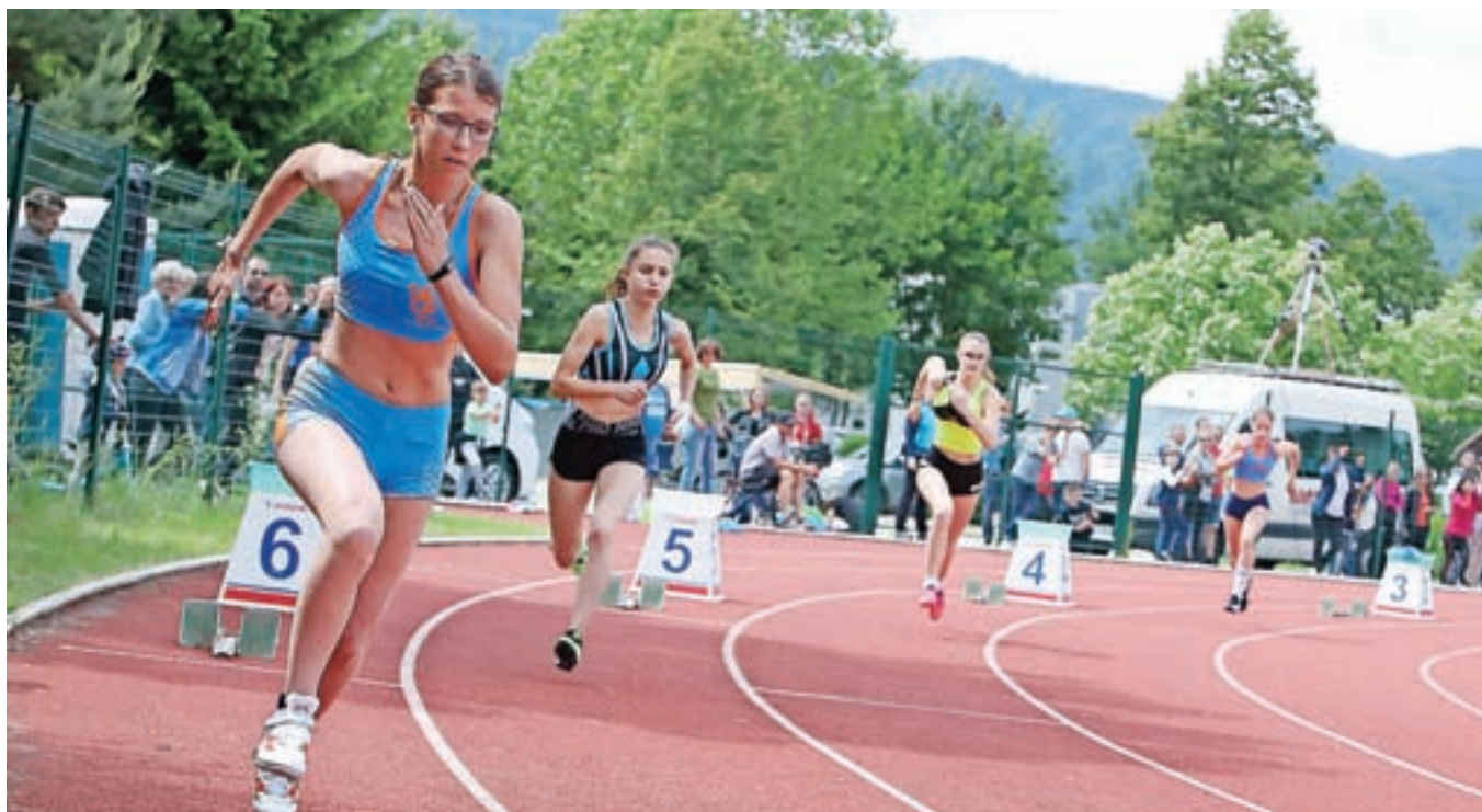
Odprtje atletske sezone na prostem je bilo prejšnjo nedeljo prav v Radovljici.