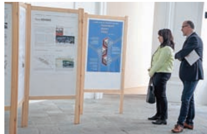
Prispeli predlogi vseh natečajev bodo v Radovljiški graščini in v galeriji Šivčeva hiša na ogled ves junij.