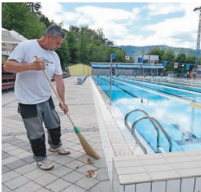
V ponedeljek so odprli radovljiško kopališče, na odprtje bazena v Kropi bo treba še malo počakati.

so tudi popoldanske vstopnice za odrasle, katerih cena je po novem 5 evrov, cena popoldanskih vstopnic za otroke ostaja 3,50 evra.