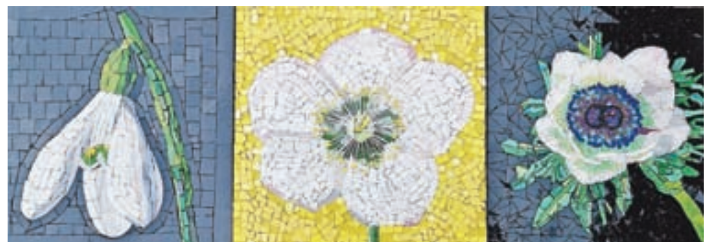
Na razstavi z naslovom Rože v mozaiku je v Čebelarskem centru v Lescah na ogled osem mozaikov; izdelali so jih člani medgeneracijske skupine, ki deluje v okviru Ljudske univerze Radovljica.