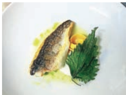
Piranski brancin, testenine, polnjene z mohantom, čista brancinova juha, kopriva

njem najdete vse od dimljene Zupanove postrvi, Mrkovega ješprenja, Dolenčevega jogurta, telečjega jezika, mariniranega v ribezovem