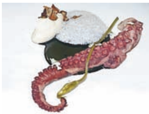
Hobotnica, krema pečene cvetače, sipina omaka, topinambur, vloženi čemaževi vršički

olju, travniške kislice, detelje, kopriv, belušev, zeliščne rižote z bezgom, hobotnice, piranskega brancina, Šlibarjevega domačega piščanca,