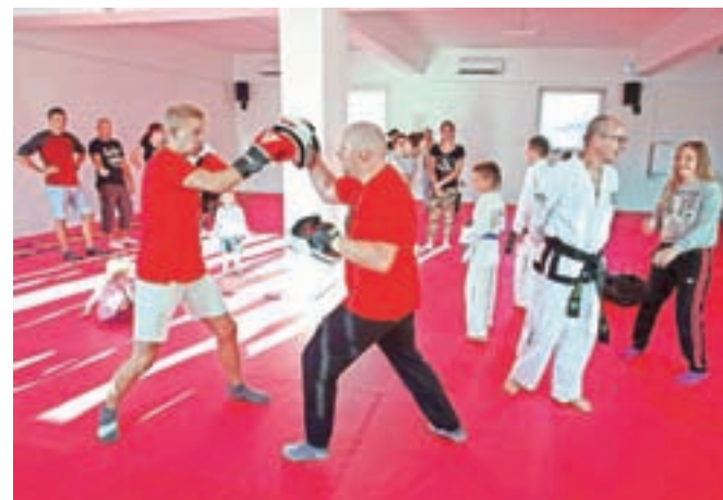
Športniki že močno pogrešajo telovadnico v Verigi, ki je vrata zaprla sredi maja in kamor se za zdaj še ne vračajo.

"Treninge vsak dan vodi drug trener, s čimer so zagotovljene raznolikost, zanimivost in raznovrstnost vadbe. Prav tako mora biti vadba malce prilagojena, saj so prostorske možnosti doma omejene. Tovrstna vadba je tudi trenerski izziv. Izkazalo se je, da nam je uspelo povečati nabor vaj in uvesti dodatne trenajzne tehnike ter tako tudi uspešno prenesti 'žive' treninge domov. Z vadbo kondicije, moči, tehnike taekwondoja, form in vaj za raz-