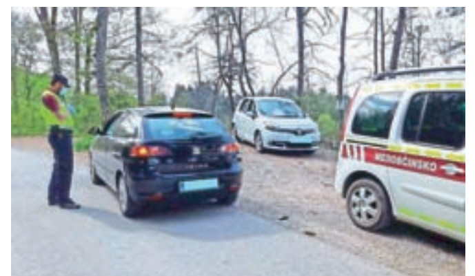
Redarji v dogovoru in sodelovanju s Policijsko postajo Radovljica poostreno izvajajo tudi nadzor gibanja ljudi izven svojih občin na lokalnih cestah in v naseljih predvsem na vstopnih cestah in poteh v občino Radovljica.

"Ljudje se obnašajo disciplinirano, nobenih večjih težav ne opažamo, zato bi se rad zahvalil vsem občanom, ki v teh zahtevnih časih spoštujejo vse predpise in tudi na ta način skrbijo drug za drugega. V obdobju epidemije covid-19 se vsi srečujemo z nevzakdanjimi okoliščinami, kar pa ne sme pomeniti, da druga pravila ne veljajo več, pa dodajajo na redarstvu, kjer