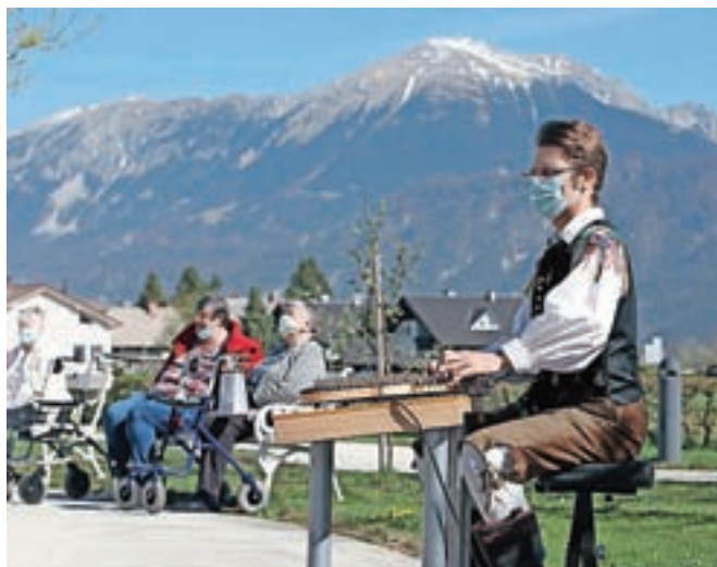
Zaigral je melodije, kot so Cvetje v jeseni, Sestavljena polka, Malo miru, Veter, Čebelar, Dravski most, Ples perzijskih jagenjčkov, V dolinci prijetni, Ne prižigaj luči ...