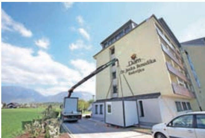
Zabojnika so pri Domu dr. Janka Benedika postavili preteklo sredo.

oziroma obvladovanje morebitne okužbe s koronavirusom poskrbela za postavitev dveh zabojnikov pred Domom dr. Janka Benedika v Radovljici, v enem od turističnih objektov na območju občine pa so rezervirane tudi začasne nastanitvene zmogljivosti, ki bi ob primeru okužbe v domu omogočile samoizolacijo zaposlenih. "Tako kot vsi domovi imamo tudi pri nas pripravljen scenarij, ki zajema predvidene aktivnosti v primeru, da bi bil stanovalec doma pozitiven na covid-19. To pomeni, da moramo dom razdeliti na tri cone (cona 1: zdravi, cona 2: sum na covid-19 in cona 3: okuženi s covidom-19). V ta namen smo