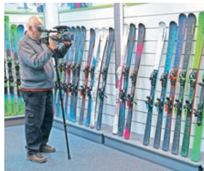
V Elanu so zaradi koronavirusa proizvodnjo sredi marca ustavili, 14. aprila pa ponovno pognali.

"Število prisotnih zaposlenih bomo povečevali postopno skladno s potrebami delovnega procesa in splošnim stanjem v državi," so pojasnili. In kakšen je bil izpad poslovanja v obdobju, ko je proizvodnja stala? "Izpada in posledic še ne moremo komentirati, saj je v tem trenutku bistvenega pomena, da smo s sprejetimi ukrepi zaščitili zaposlene. Ob umiritvi razmer bo seveda naša prioriteta nadoknaditi čim več izpada," so še dodali.