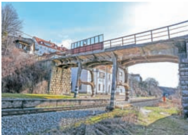
V sklop obnove sodi tudi novogradnja nadvoza čez železniško progo na Cesti svobode pri železniškem postajališču v Radovljici.

"Nadgradnja na teh odsekih je treba izvesti prednostno predvsem zaradi slabega stanja zgornjega in spodnjega ustroja proge, vozne mreže in nosilnih konstrukcij, podpornih in opornih zidov, dotrajanih prepustov in premostitvenih objektov, železniških predorov Globoko in Radovljica, obstoječega nadvoza nad progo v območju železniškega postajališča Radovljica, zastarelih signalnovarnostnih naprav, nezavarovanih nivojskih prehodov, označenih le s prometnim znakom Andrejev križ ter neustreznih dostopov na peronsko infrastrukturo," ugotavlja vlada. "Z investicijo se bosta na obravnavanih odsekih povečali prometna varnost in zmogljivost proge, zmanjšala se bo obremenitev okolja s hrupom, skrajšal se bo tudi potovalni čas vlakov." Ocenjena vrednost druge faze projekta je malenkost