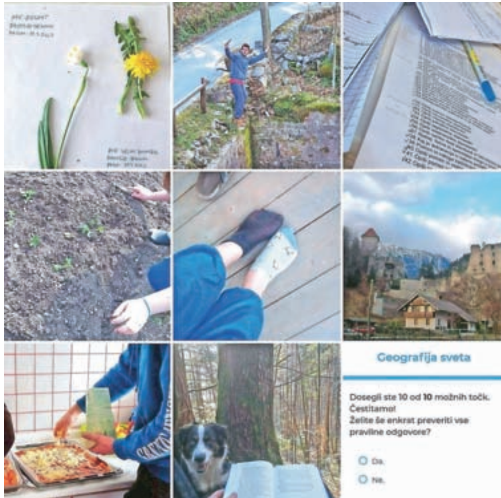
Za vse aktivnosti, ki jih izvajajo, morajo poslati slikovne dokaze v FB-skupino.

Tako so drugi dan karantene začele izvajanje igre Naj samoizolator, pripoveduje