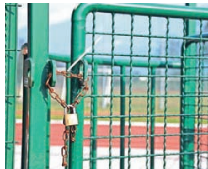
Večina športnih objektov na prostem za zdaj še ostaja zaprtih.

atletski park pri Osnovni šoli Antona Tomaža Linhartaradovljiška, nogometni center v Lescah, športni parki in površine ob osnovnih šolah, drugi športni objekti na prostem ter vsa javna otroška igrišča na območju občine do nadaljnjega še vedno ostajajo zaprti.