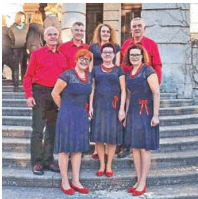
Še februarja so se udeležili mednarodnega pevskega tekmovanja Istria Cantat, na katerem je nastopilo 28 zborov iz Hrvaške, Bosne in Hercegovine ter štirje iz Slovenije, in se iz Pulja vrnili z dvema srebrnima priznanjema.