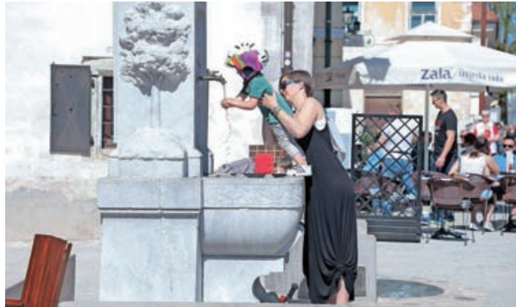
Gostje bodo, če bo ponudba dobra, prišli ne glede na ceno, so prepričani v Turizmu Radovljica.

V skupnosti Julijskih Alp pa poudarjajo: "Navkljub novim izzivom, pred katere smo zdaj vsi postavljeni, zdajšnja situacija nikakor ne sme zavreti naših razvojnih aktivnosti – ravno nasprotno: moramo jih še okrepiti. Močno verjamemo, da je to čas, ki ga moramo dobro izkoristiti."