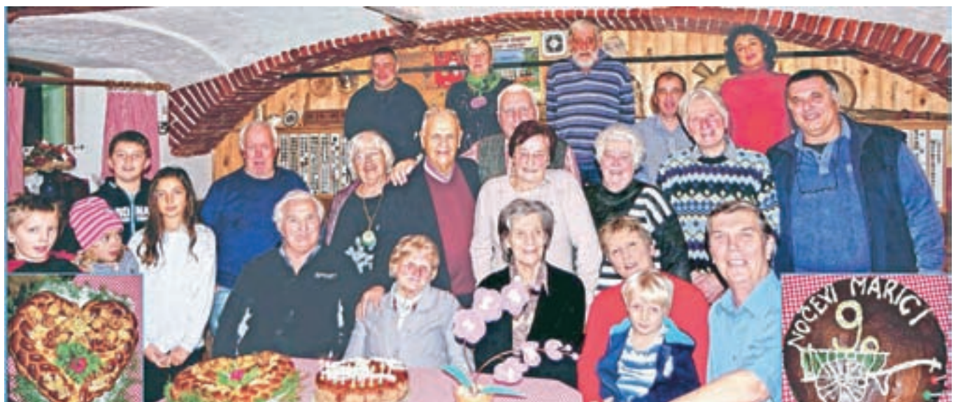
Sokrajani so slavljenko presenetili s srečanjem v njeno čast.

Vaščani jo pogosto obiščejo, saj pravijo, da je »duša« vasi. Ob rojstnem dnevu so jo presenetili s srečanjem v njeno čast in ji zaželeli še na mnoga zdrava leta.