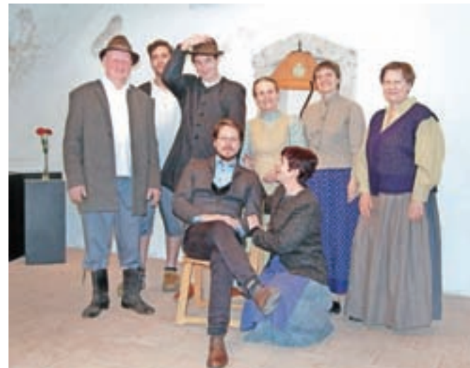
Dramska skupina Čofta v Kovaškem muzeju