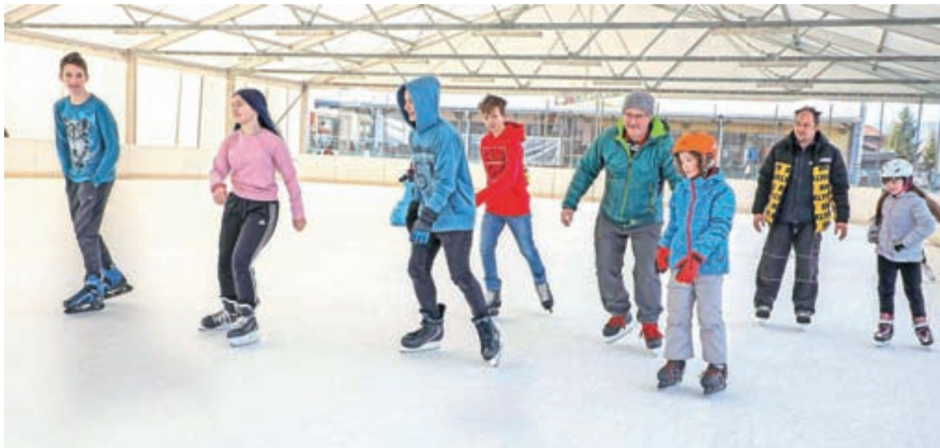
Drsališče v Športnem parku Radovljica je priljubljeno zbirališče tako mlajših kot starejših.