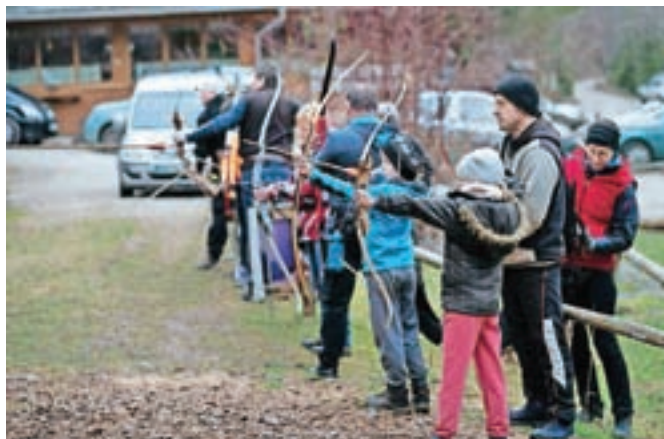
Zadnja tekma v sklopu 3D-lokostrelskega turnirja v dolini Draga bo potekal 29. februarja.