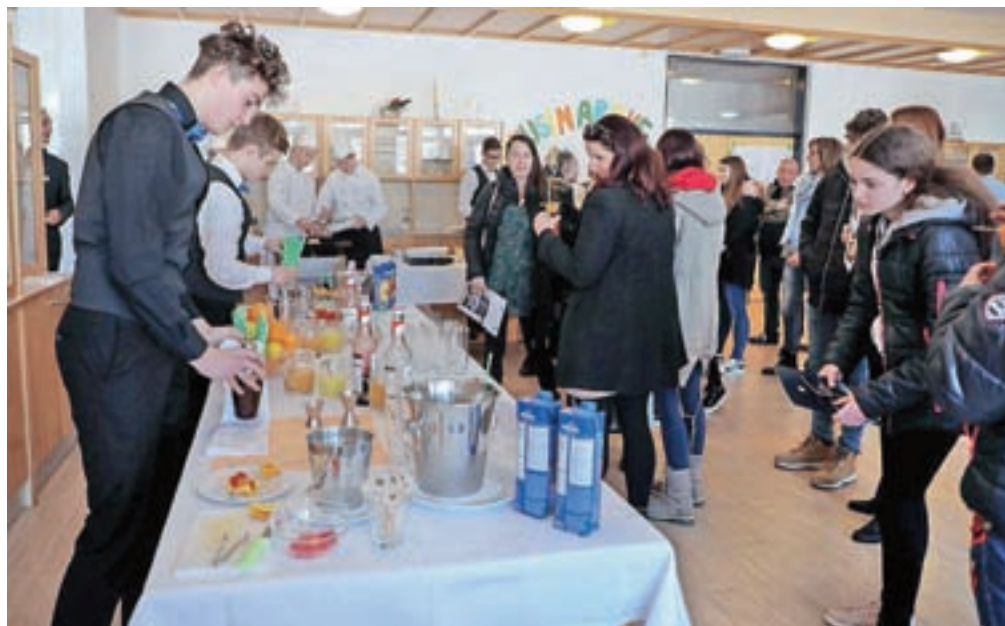
Osnovnošolci in njihove starše so dijaki Srednje gostinske in turistične šole Radovljica pogostili s koktajlom, imenovanim Osnovnošolček.