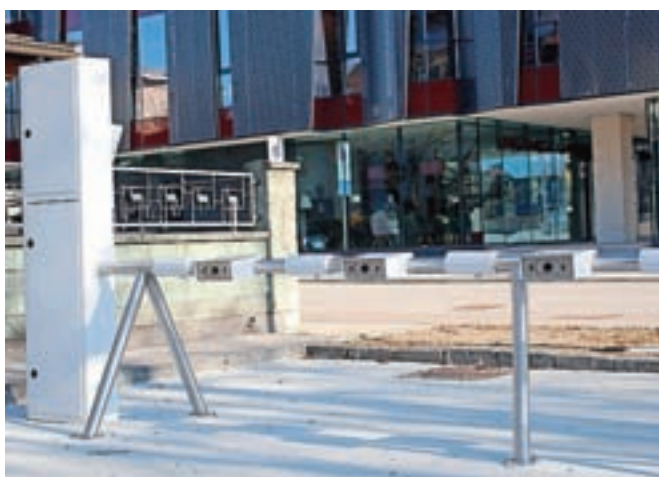
Postaje za avtomatizirano izposajo koles so že postavljene na parkirišču nasproti knjižnice in na Gradnikovi cesti v Radovljici, pri vrtcu in na železniški postaji v Lescah ter pri avtobusni postaji v Begunjah. Kolesa bodo pripravljena še pred poletjem.

V okviru projekta Hitro s kolesom je občina konec leta namestila pet postaj za avtomatizirano izposajo koles: v Radovljici na parkirišču nasproti knjižnice in na Gradnikovi cesti, v Lescah pri železniški postaji in pri vrtcu ter v Begunjah pri avtobusni postaji. Pred poletno sezono bo na postajah na voljo skupaj 32 koles, od tega dvajset električnih. Kot so pojasnili na občinski upravi, bo enoten sistem izposoje koles vzpostavljen še v štirih gorenjskih občinah: na Jesenicah, v Naklem, Tržiču in Kranju. Za delovanje sistema bo