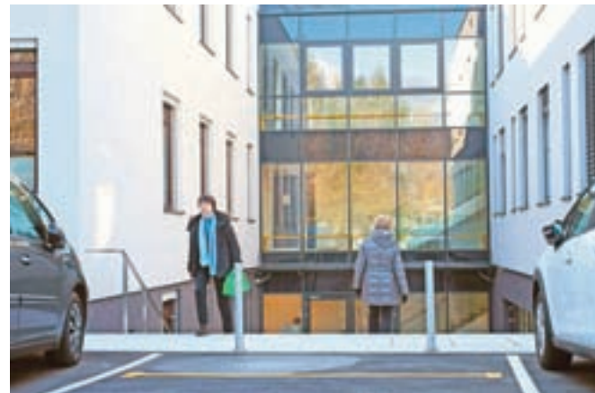
Občina Radovljica je na letošnji Dan odprtih vrat slovenskih občin predstavila preventivne dejavnosti v novem prizidku zdravstvenega doma.

Prizidek k radovljiškemu zdravstvenemu domu je bil dokončan in odprt jeseni, v njem pa so na več kot 850 kvadratnih metrih novih površin pridobili tri ambulante družinske medicine, ambulanto pediatrije, telovadnico za nevrofizioterapijo, večnamenski prostor ter prostore za referenčne ambulante in psihologe. Stroške za 1,9 milijona evrov vredno naložbo sta si v polovičnih deležih razdelila Občina Radovljica in Osnovno zdravstvo Gorenjske. Občina ob tem sofinancira tudi preventivne programe zdravstvenega varstva in za programe dela kineziologov v lanskem in letošnjem letu namenja po 23 tisoč evrov. Prav preventivne programe in kineziološko obravnavo so občanom na dnevu odprtih vrat zdravstveni delavci