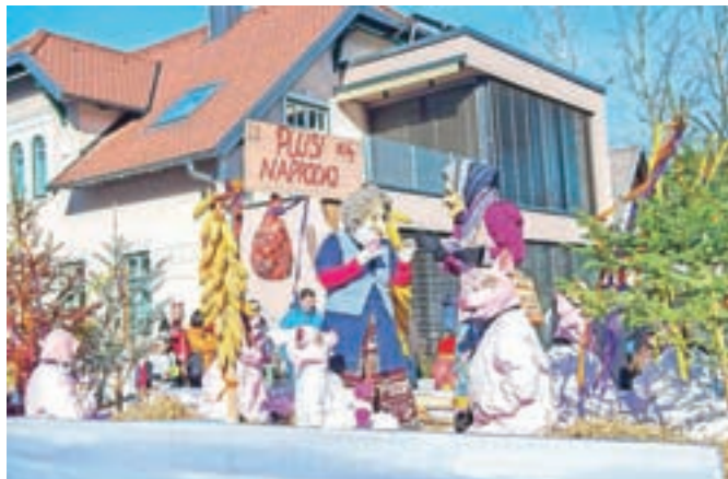
Pustni sprevod se bo začel pri semaforju in zaključil s rajanjem na Linhartovem trgu.

Pustni sprevod skozi Radovljico bo letos v soboto, 22. februarja, sporočajo organizatorji, Turistično društvo Radovljica. Začel se bo ob 14. uri pri semaforju, nato pa ga bo kritična pustna županja po ustaljeni poti vodila do Linhartovega trga. Organizatorji na prireditve še posebej toplo vabijo mlade družine.