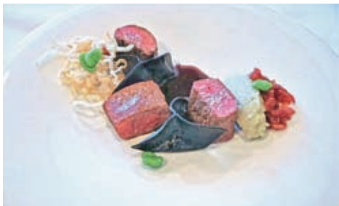
Krožnik Tisočletna Škofja Loka