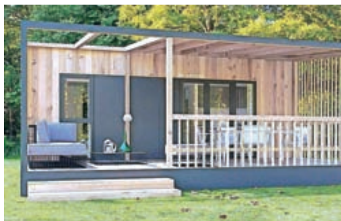
Takšne naj bi bile nadstandardne alpske hišice v kampu.

Bodoči kamp ima že povsem urejeno spletno stran, na kateri je že mogoče rezervirati bivanje, znane so tudi cene. V visoki sezoni bo nočitev za odraslega znašala 17 evrov, najem alpske hišice 220 evrov.