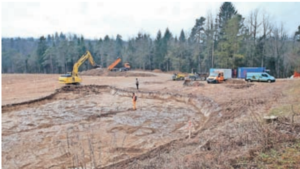
Gradnja novega kampa se je začela prejšnji mesec, prva faza bo končana do junija. Dovoz do kampa bo iz križišča pod golfskim igriščem.

V kampu bodo na voljo parcele za kampiranje s šotori, prikolicami in avtodomi, gostom pa bo na voljo tudi od petnajst do dvajset nadstandardnih alpskih hišic. Poleg recepcije, sanitarij, pralnice s sušilnico in pomivalnico posode bo v kampu tudi restavracija z barom, na osrednjem trgu kampa bo vsako jutro odprta mini tržnica z lokalno hrano.