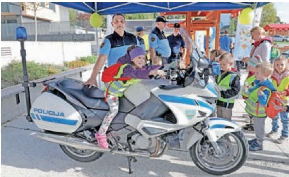
Vozila policistov Policijske postaje Radovljica so pritegnila pozornost otrok.

Na stojnicah so se predstavili gasilci, policisti, reševalci nujne pomoči, jamarji, gorski in podvodni reševalci, redarji, kinološko društvo, ekipa Rdečega križa, prvi posredovalci in drugi. Nekateri izmed njih so pripravili tudi zanimive in poučne delavnice. Agencija za varnost v prometu je na primer ponudila ogled šotora, imenovanega Vidko, kjer so predstavili uporabo odsevnih teles. Postavili so manjši