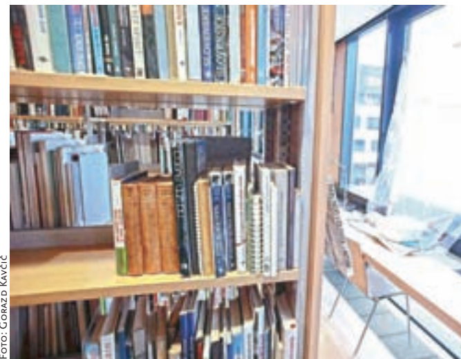
Ob vsakem večjem deževju v knjižnici zamaka.

bomo morali izpeljati unovčitev bančne garancije in bodo napake odpravljali drugi izvajalci,« je pojasnil. Prav za slednje se je občina odločila pri še eni od svojih investicij. Pri pred osmimi leti zgrajenem Čebelarskem centru v Lescah se izvajalec, to je podjetje Tehnik v stečaju, ni odzval na pozive za sanacijo napak, zato je občina že unovčila bančno garancijo, je povedal župan. Dela na fasadi, ki jih zaključujejo prav v teh dneh, zdaj opravlja drug izvajalec.