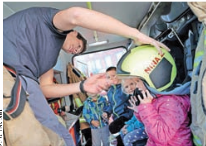
Obiskovalci so se lahko povzpeli v gasilsko vozilo, si nadedli gasilsko opremo ali pa se celo peljali z avtolestvijo.