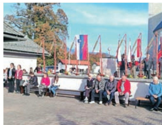
Spominska slovesnost na Srednji Dobravi