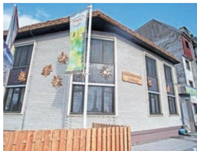
Nove prostore so si uredili v stavbi nekdanjega Alpdoma na Cankarjevi ulici v Radovljici.

Radovljiški waldorfski vrtec trenutno obiskuje 47 otrok, večinoma prihajajo iz zgornjegorenjskih občin. Razporejeni so v tri skupine prvega in drugega starostnega obdobja, zanje pa skrbi osem vzgojiteljic, je povedala vodja gorenjskih waldorf-