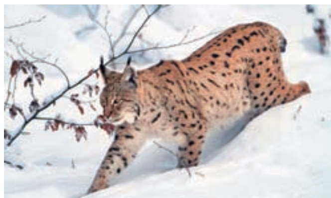
Največje evropske mačke, ki jo bomo prepoznali po črnih pikah na rjavkastem kožu, predvsem pa po značilnem kratkem repu s črno konico in čopkih na ušesih, ki so edinstvena značilnost risov, se ni treba bati, saj ne napada človeka.

koliko ob tem uničimo še drugih živali, ki so se slučajno znašle prav na tistem mestu ob istem času.« Kot pravi, ljudje ubijamo in uničujemo z golj iz enega razloga: da bi pridelali več hrane, kajti več hrane pomeni več zaslužka. »Ne več hrane, ki jo lahko pojemo, kajti pojemo samo dvajset odstotkov hrane, ki jo pridelamo,« poudarja profesor Toman. »Dokler bodo tudi naše otroke v šolah učili, da ločimo živali na koristne in škodljive ter rastline na kulturne in strupene, bo tako. Vsaj za risa je sicer za nekaj časa nekaj upanja, da bo tudi pri nas, ne nazadnje na obronkih Jelovice, kjer je že bil, zaživel. Hvala vsem, ki se trudite z ozaveščanjem, kajti z vsako vrsto, ki jo izgubi-