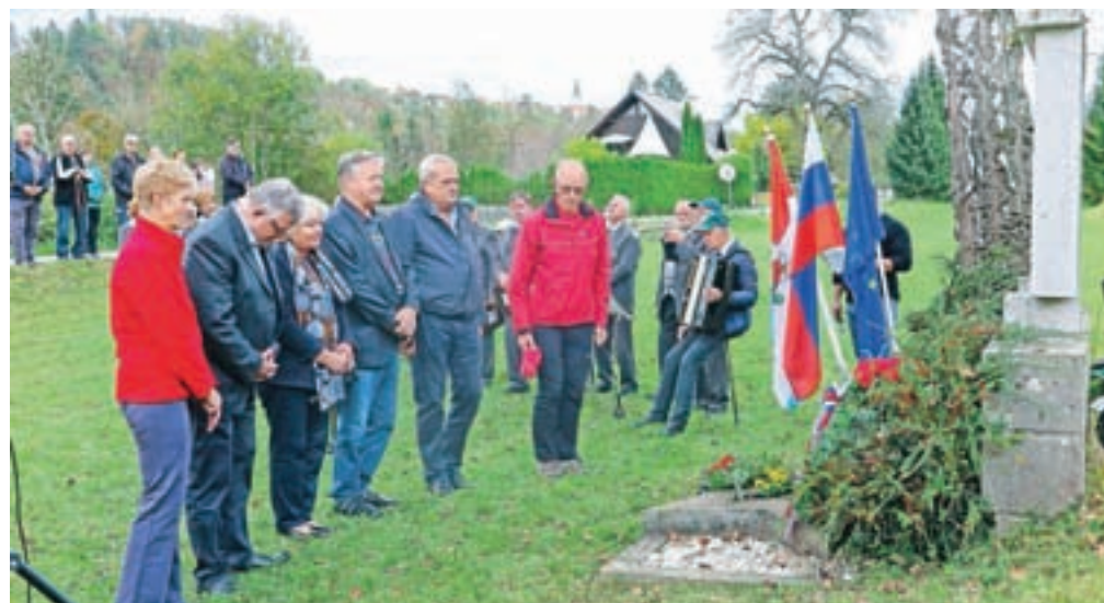
Predstavniki združenja borcev za vrednote NOB iz Radovljice in Črnuč, od koder je bila večina ustreljenih talcev, so k spomeniku položili vence.