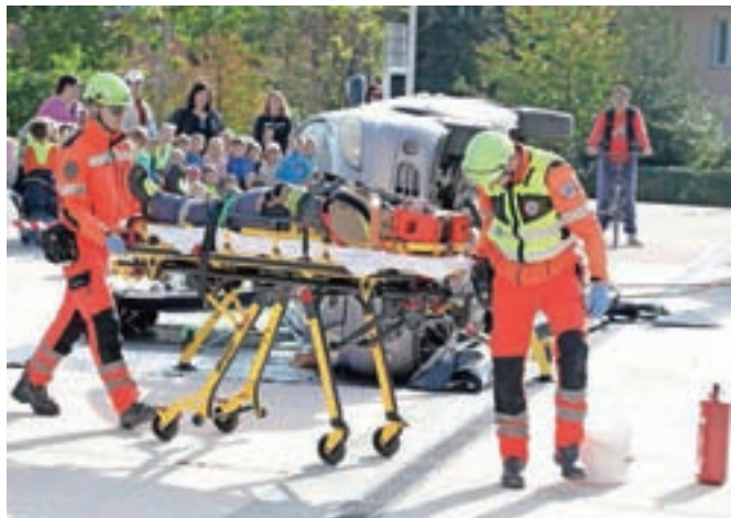
Vaja prometne nesreče, kjer so sodelovale vse ključne reševalne službe

reševanja, ki ima vedno večjo vlogo. Prvi posredovalci so pravzaprav občani prostovoljci, ki so pripravljene pomagati, ustrezno znanje pa pri nas lahko pridobijo v Zdravstvenem domu Radovljica.« Popoldan je potekala še druga prikazna vaja, tokrat evakuacija radovljiške knjižnice. »Sodelovale so gasilske enote iz Radovljice, Lesc in Begunj ter poklicni gasilci z Jesenic. Stanje je predvidevalo požar v stavbi, kjer so bile ujete osebe,« je povedal Lenček.