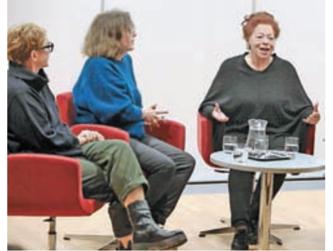
Pridobljeno s prevodom, pogovorni večer s prevajalkami Gabriela Garcíe Márqueza

Márqueza. Izkušene prevajalke so se strinjale, da je tudi prevajanje umetniško delo in mnogo mnogo več kot zgolj prestavljanje besed in stavkov iz enega v drug jezik. Posebej so omenile vprašanje prevajalske zvestobe na eni in svobode na