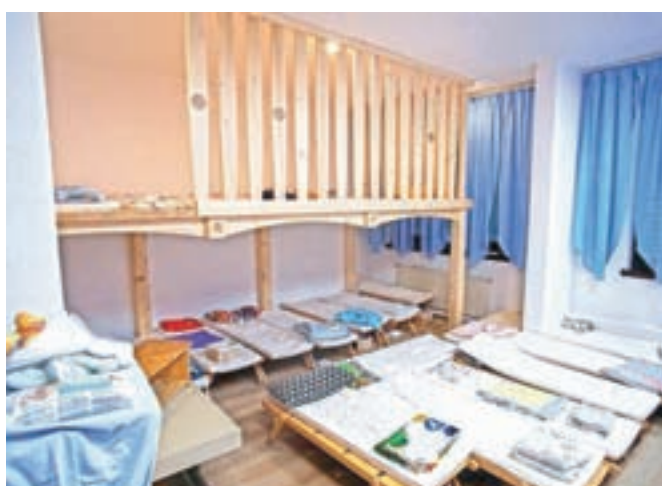
Z dvema igralnicama, dvema spalnicama, velikim osrednjim prostorom in sejno sobo ter seveda dovolj prostornim igriščem pred stavbo ima vrtec zdaj bistveno boljše pogoje za delovanje kot prej.

Waldorfski vrtci so sicer med drugim znani po tem, da v njih uporabljajo igrače iz naravnih materialov. »Glavni medij, prek katerega otroci pridobivajo informacije, je vzgojiteljica s svojim glasom in kretnjami, zelo skrbimo za močan ritem po dnevih, tednih in mesecih, zelo se prilagajamo letnemu času in praznikom, ki prihajajo iz našega okolja.« Zato niso praznovali dneva čarovnic, so pa obeležili martinovo, ko so spekli in med seboj razdelili kruh ter se odpravili v dom starejših občanov, kjer bodo tamkajšnje stanovalec razveselili z mafini in pesmijo.