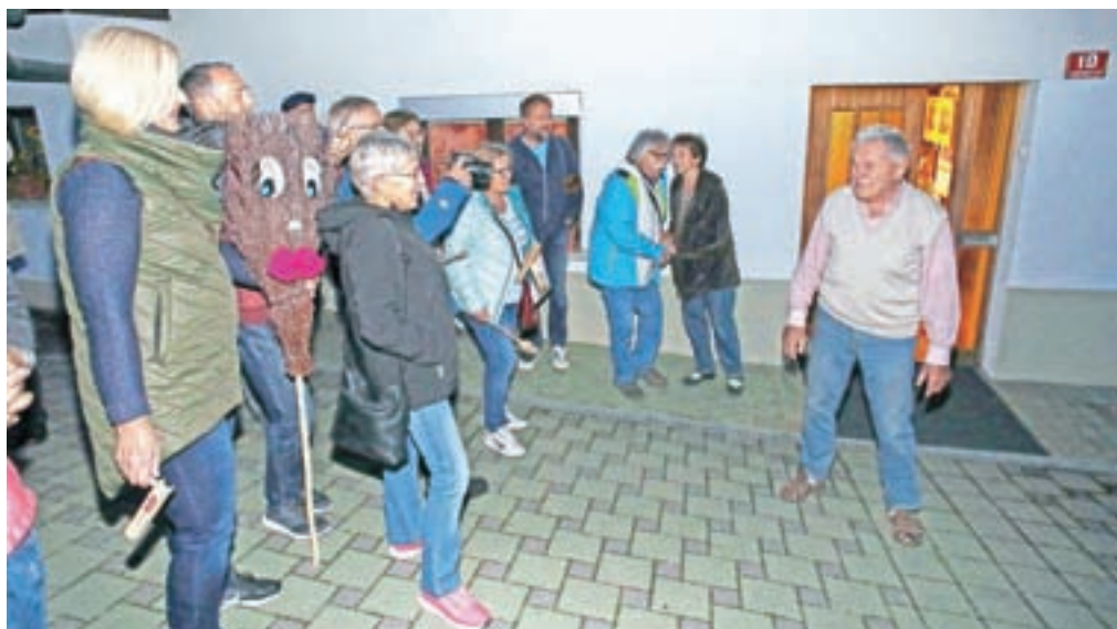
Na predvečer slavljenčevega devetdesetega rojstnega dne so se pred njegovo hišo zbrali sorodniki, prijatelji, sosede in čebelarski kolegi ter mu ob zvokih leške godbe voščili ob visokem jubileju.