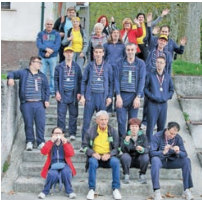
Ekipa Sožitja, ki se je uspešno udeležila nedavnega balinarskega tekmovanja v Ajdovščini

»Zelo veseli smo, da na tekmovanjih vedno sodeluje ekipa navijačev – članov