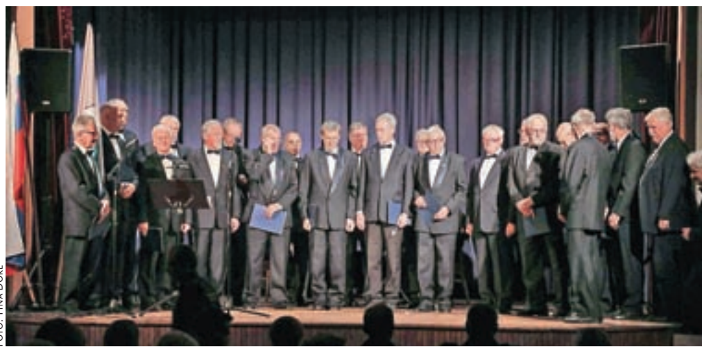
Moški komorni zbor Podnart - Kropa na prireditvi ob krajevnem prazniku KS Podnart.