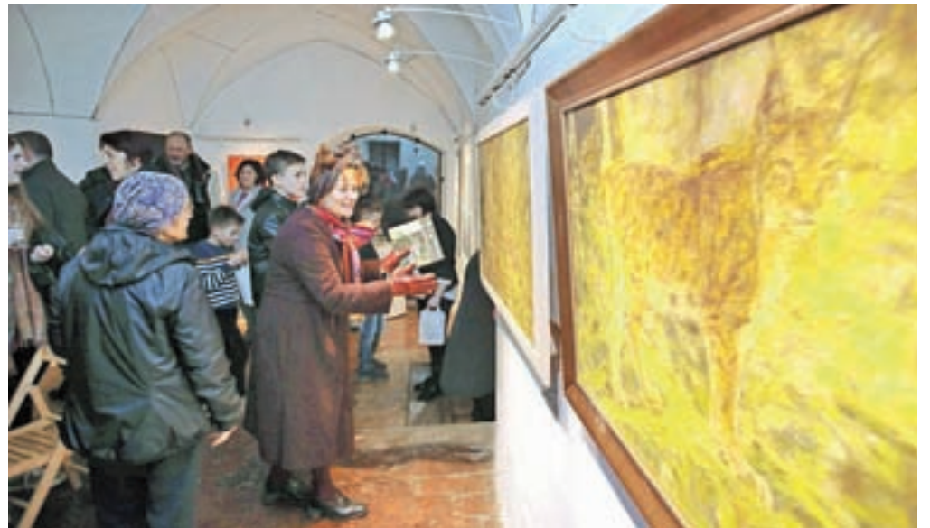
V Galeriji Šivčeva hiša je še do 3. decembra na ogled razstava slik, ki so nastale v okviru likovne kolonije z naslovom Ohranimo risa.