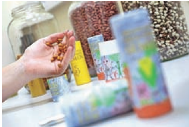
V Semenjalnici pridelanih semena fižola in graha za zdaj še ne prodajajo, delijo jih kot protokolarna darila ter razdeljujejo med vrtničarje.