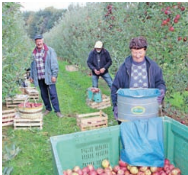
Sadjarjem iz Kmetijsko gozdarske zadruge Sava Lesce so pri obiranju sadja pomagali pogodbeni obiralci.