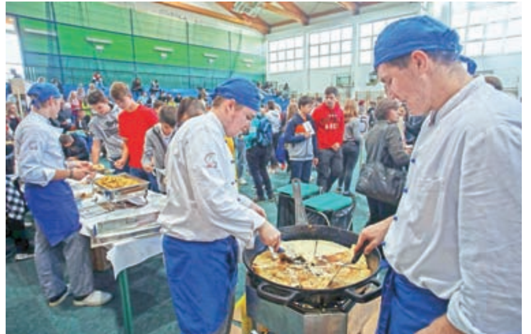
Dijaki Srednje gostinske in turistične šole Radovljica so udeležence Vrtiljaka poklicev prijazno pogostili s pražencem.