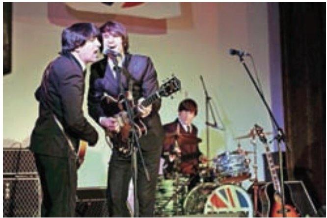
Fotonatečaj Dogodki v občini Radovljica 2018: V duetu, avtor Damjan Markovec, diploma