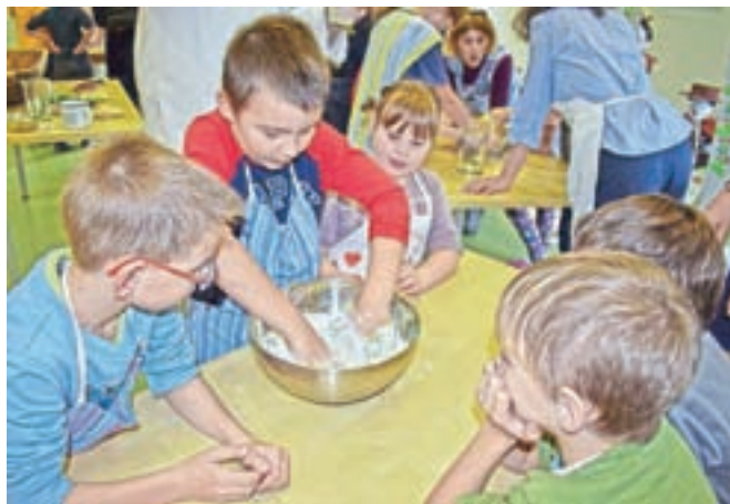
Na Osnovni šoli Antona Janše Radovljica so pomenu in pripravi zdrave prehrane posvetili kar ves teden. Učenci so v času pouka spoznavali kruh, sami pripravljali in mleli žito ter pekli žemlje in rogljičke za svoje vrstnike.

Letošnji petek, 15. novembra, je bil dan, ko je otroke v vrtcih in šolah pričakal tradicionalni slovenski zajtrk z lokalno pridelano hrano slovenskega porekla – domači kruh, med, maslo, mleko in jabolko. Tradicionalni slovenski zajtrk je eden izmed osrednjih dogodkov dneva slovenske hrane, ki ga od leta 2012 obeležujemo v Sloveniji in še posebej poudarja pomen zdravega prehranjevanja in zagotavljanja hrane iz lokalnega okolja. Dan slovenske hrane ozavešča o pomenu rednega in zdravega prehranjevanja, kamor sodi tudi pomembna zdrava navada, ki jo je dobro osvojiti že v otroštvu, da dan začnemo z zdravim zajtrkom.