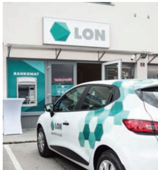
LON točko v Radovljici najdete v poslovnem centru pri športnem parku.

Res je, zadnja tri leta z družino živim v Begunjah na Gorenjskem. Svojo mladost sem skozi šolanje preživel na Bledu in v Radovljici. Ravno tako sem svojo bančno pot pred osmimi leti začel v Radovljici.