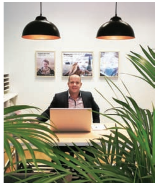
Notranjost LON točke vas bo očarala s svojo domačnostjo.

Iz teh krajev imam kar veliko poznanstev, kar bi lahko dodatno pripomoglo k pozitivnemu učinku name na LON točke. Potenciala je precej, mislim, da ljudje so dovtetni za nek »nov« koncept bančništva, kategera lahko precej prilagodimo vsakemu posamezniku. Seveda pa je sklepanje poslov v bančništvu tek na dolge proge. Potrebna je potrpežljivost in predvsem pridobiti zaupanje in skozi to sklepati kvalitetne posle.