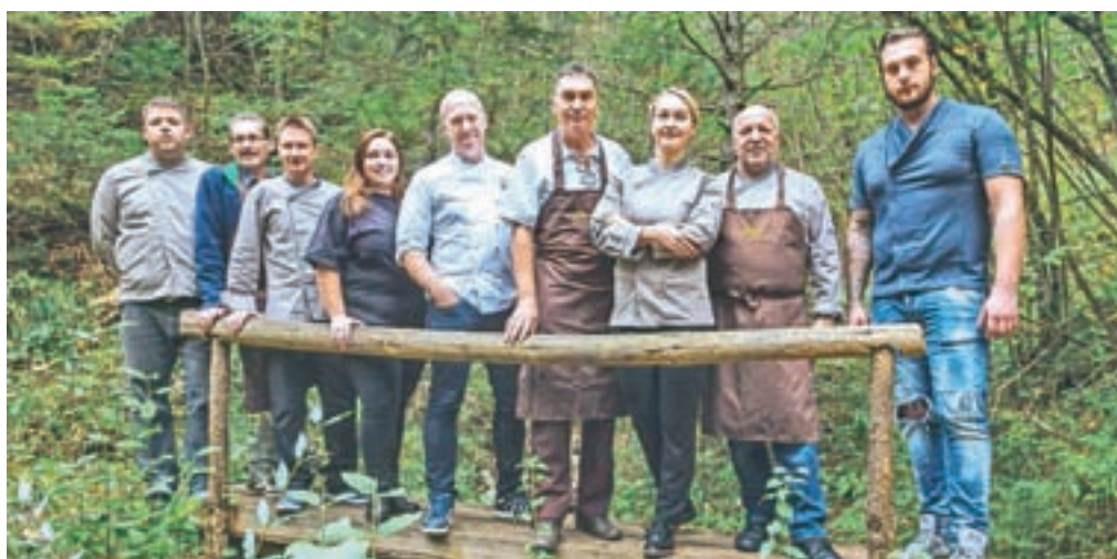
Kuharski mojstri, ki sodelujejo v letošnjih Okusih Radol'ce