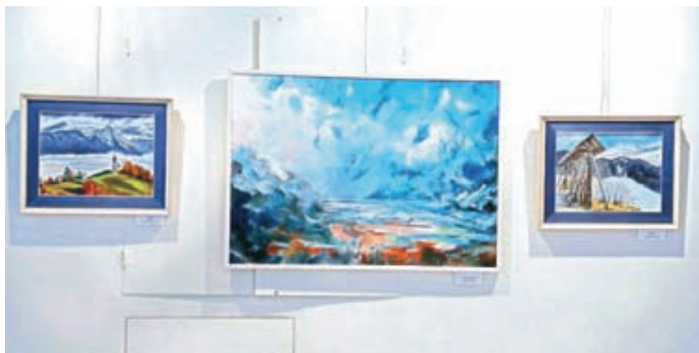
V Galeriji Avla v prostorih Občine Radovljica je še do sredine prihodnjega meseca na ogled razstava likovnih del članov društev upokojencev.

Na tej razstavi je slik toliko, da se jim umetnostna zgo-