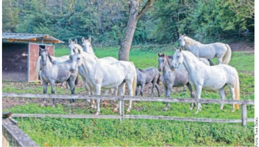
Čreda lipicancev vzrejne hiše Barbana iz Globokega danes šteje že štirideset konj.