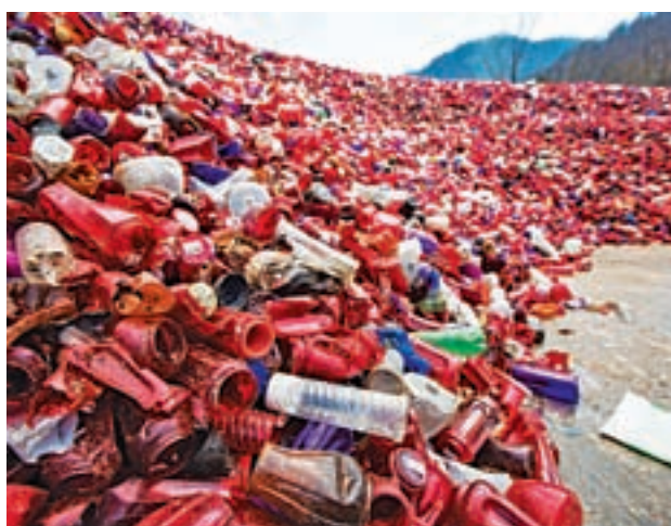
Poskrbimo, da dan mrtvih ne bo ovit v tone plastike.

Namesto da kupujemo sveče za na pokojnikov grob, naberimo šopek svežega cvetja . Pokojnikom se lahko poklonimo tudi s trenutno aktualnimi kreativnimi rešitvami, na primer poslikanimi kamenčki, lesenimi nadomestki sveč ... Denar darujmo v dobrodelne namene – pomagamo lahko društvom za zaščito živali, posameznikom, ki zbirajo sredstva za drago operacijo ... Pomagajmo tistim, ki še živijo, če nismo mogli vsem, ki se jih spominjamo.