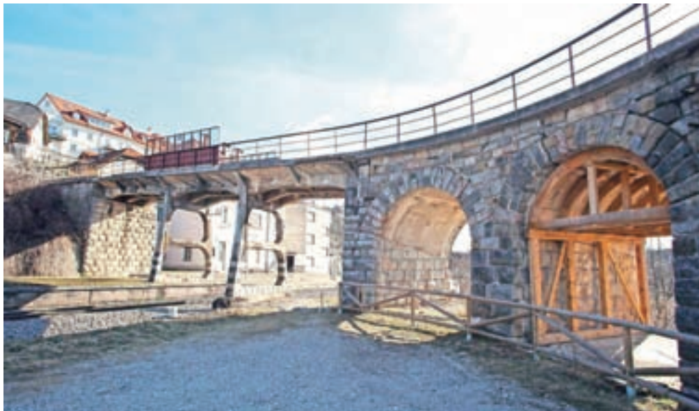
Med načrtovanimi projekti v sklopu obnove gorenjske železniške proge je bila tudi rekonstrukcija nadvoza pri radovljiški železniški postaji.

Na Direkciji RS za infrastrukturo so potrdili informacijo, ki jo je občinskemu svetu na zadnji seji posredoval vodja oddelka za infrastrukturo, okolje, prostor in investicije Borut Bežjak: v predlogu proračuna za prihodnji dve leti ni denarja za načrtovano nadgradnjo gorenjske železniške proge, čeprav je bilo za pripravo dokumentacije za projekt že namenjenih precej sredstev. Direkcija je tako že financirala izdelavo izvedbenih načrtov za nadgradnjo glavne železniške proge na odsekih Kranj-Lesce-Bled in Lesce-Bled-Jesenice ter progovno kabliranje. Gre za investicijo, ki je na podlagi projektantske ocene brez davka na dodano vrednost ocenjena na 120 milijonov evrov. Prav tako so veliko denarja v projekte, ki se navezujejo na obnovo železniške proge, že vložile tudi občine, tudi radovljiška. Načrtovana nadgradnja naj bi tako zajemala temeljito rekonstrukcijo same proge, pa tudi ureditev peronske infrastrukture na postajah in postajališčih in vzpostavitev protihrupne zaščite, na