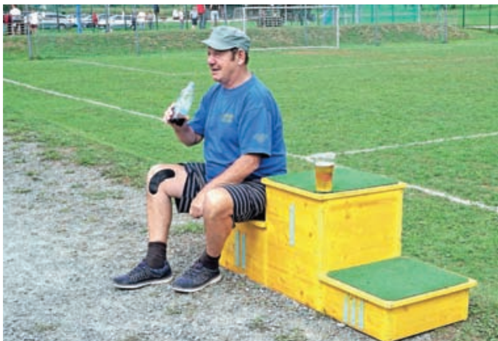
Fotonatečaj Dogodki v občini Radovljica 2018: »Brez besed«, avtor Ljubo Kozic, diploma