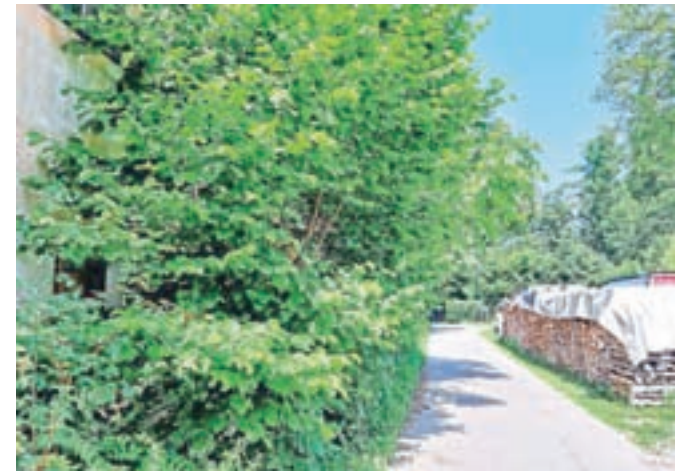
Majhna sadika ali grmiček, posajen tik ob robu parcelne meje, se hitro razraste na cestišče, pločnik ali javno površino.

Skladno z navedeno zakonsko določbo in določbami občinskih odlokov o cestah ter javnem redu in miru to pomeni, da je prepovedano izvajati ali opustiti kakršna koli dela na javni cesti, na zemljiščih ali na objektih ob javni cesti, ki bi lahko škodovala cesti ali ogrožala, ovirala ali zmanjšala varnost