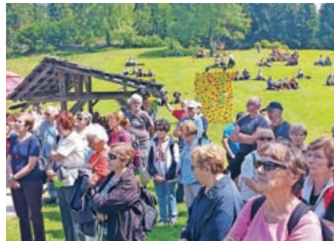
Lep sončen dan je na Vodiško planino privabil številne obiskovalce.

genocidno koalicijo in nekakšne vsiljene pogojnike kot na primer 'partizanstvo da, revolucija ne' in na tej osnovi izvajanje opravičil za kolaboracijo, pri kateri naj bi šlo za upravičen boj proti komunizmu. Taka stališča so neosnovana in so z zornega kota dolgoročnega slovenskega nacionalnega interesa škodljiva. Vnašajo nepotrebno razdvajanje v sodobno slovensko družbo in nam jemljejo prostor in energijo za soočanje z vprašanji obstoja in razvoja sodobne slovenske države. Vrednoti, ki smo ju Slovenci okrepili med NOB, sta tudi upornost in ponos. Ti vrednoti morata postati temeljni sestavini razvoja višje ravni inovativnosti in udarnosti