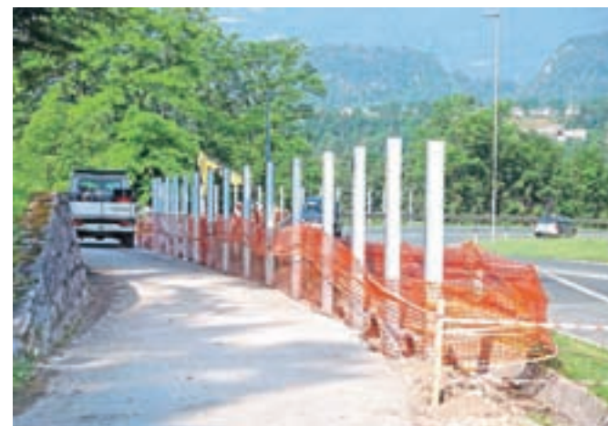
Protihrupno ograjo naj bi po načrtih dogradili od konca letošnjega leta.

pol. Rekonstruirali pa bodo tudi obstoječo osemdesetmetrsko ograjo na Bledu. »Ograja bo na celotni poti izdelana iz obojestransko visokoabsorpcijskih protihrupnih panelov, ki izpolnjujejo zahtevane vrednosti zvočne absorptivnosti in izolirnosti,« navajajo na direkciji in pojasnjujejo, da je bila kolesarska steza zaprta le v času, ko so ob njej postavljali temelje za ograjo. Takrat je bil za kolesarje tudi urejen obvoz po občinskih cestah. Investicijo v vrednosti nekaj več kot 685 tisoč evrov v celoti financira Direkcija RS za infrastrukturo.