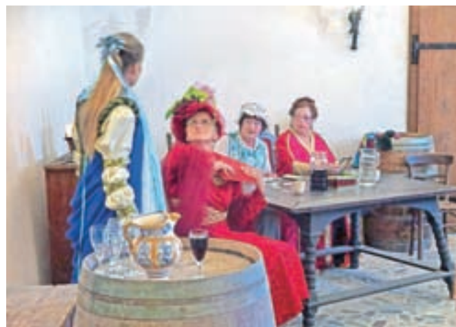
V graščinski kleti je Linhartov oder, ki deluje v okviru KUD Radovljica, iz srednjeveške Carmine Burane povzel znameniti dramski prizor: Prepir med vinom in vodo.