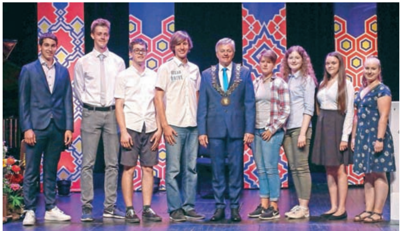
Posebno priznanje in denarno nagrado za nadaljnje izobraževanje so prejeli letošnji zlati maturanti in dijaki, ki so bili odlični v vseh štirih letnikih srednje šole.

svetega Petra, na njegovo pobudo je bila leta 2007 urejena kapela, posvečena Edith Stein. Sodeloval je pri organizaciji tekmovanja za Chopinov zlati prstan, je velik podpornik Festivala Radovljica, preko Kulturnega društva Sotočje organizira koncerte, razstave, predavanja, izlete. Je tudi urednik občasnika Skrinja.« Že več let je prostovoljec pri vodenju turistov po Radovljici, nad katero mu uspe navdušiti tako domače kot