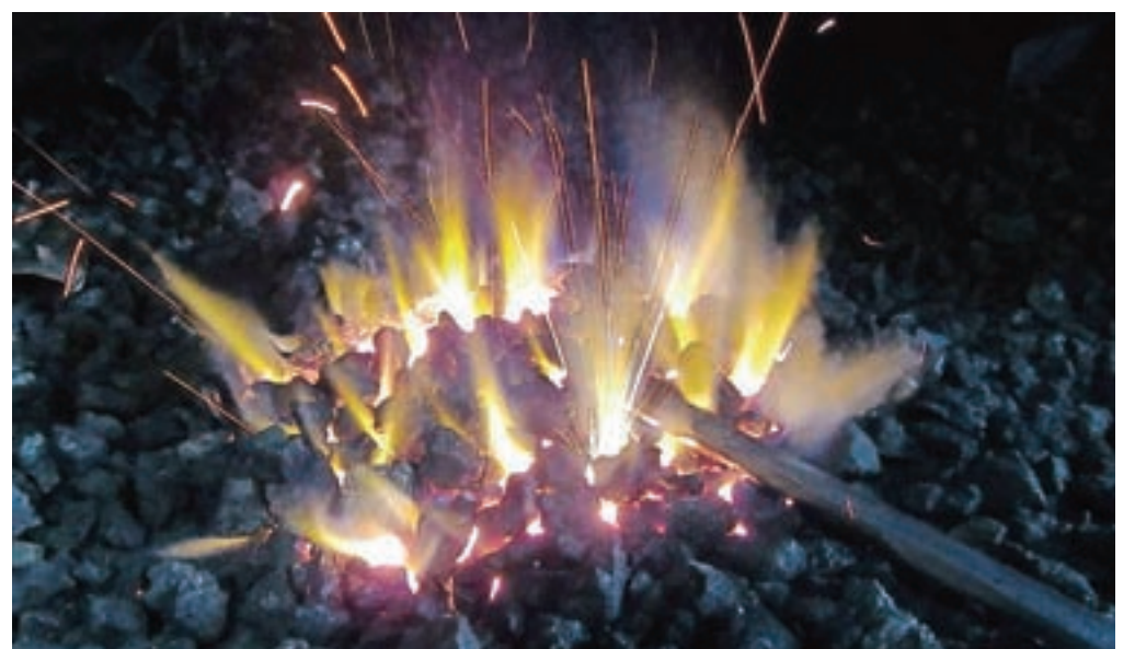
Dogodki v občini Radovljica 2019: »Ješa 6« s Kovaškega šmarna 2018 v Kropi, avtor Marijan Ješe, diploma