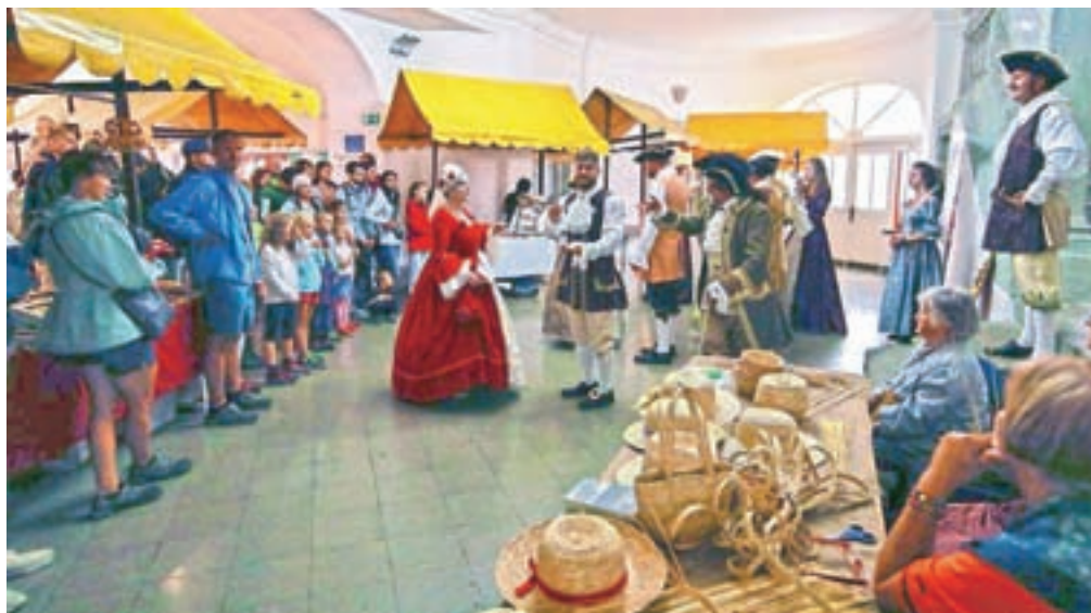
Obiskovalci so z zanimanjem spremljali dogajanje v graščini, kjer je kulturno društvo Igralska skupina Gašperja Lambergerja uprizorilo tri dinamične zgodbe in slikovit baročni ples.

Tudi za letošnjo zadnjo nedeljo v juliju je radovljiško turistično društvo pripravilo bogat program tradicionalnega, letos že 24. Srečanja mest na Venerini poti s pisano srednjeveško tržnico v starem mestnem jedru. A jo je organizatorjem in obiskovalcem zagodlo vreme, tako da so morali dogajanje s slikovitega Linhartovega trga preseliti v atrij Radovljiške graščine. »Žal mi je za tiste sodelujoče, ki so prišli od daleč, z drugih koncev Slovenije, da bi svoje izdelke predstavili na stojnicah v Radovljici, pa so se nato odločili, da se zaradi slabega vremena vrnejo domov. Tisti, ki so ostali, so