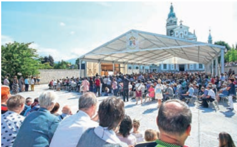
Na Brezjah se je na praznični četrtek pri slovesnem bogoslužju zbralo več kot pet tisoč ljudi, v celem dnevu okoli deset tisoč.