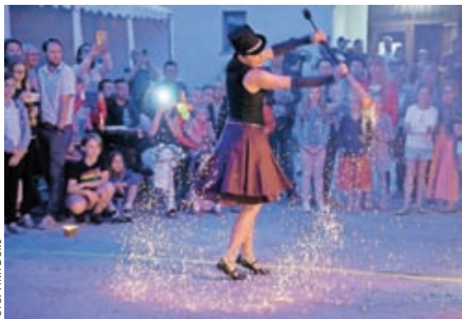
Obiskovalce je navdušil nastop skupine Čupakabra.