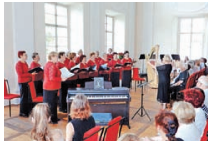
Pevski zbor Lipa

Ženski pevski zbor Lipa je ob štiridesetletnici delovanja v začetku junija pripravil jubilejni koncert v Radovljiški graščini.