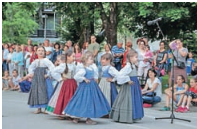
V kulturnem programu sta nastopila folklorna skupina Nageljčki z Brezij (na fotografiji) in Pihalni orkester Lesce.

Po slovesnosti je bil najprej na sporedu otroški tek, nato pa start že osme Radol'ske 10ke. Radovljiška območna izpostava JSKD je pred dnevom državnosti v Baročni dvorani Radovljiške graščine pripravila tri koncerte, na katere je bil vstop prost: koncert Pevske skupine Korona KUD Radovljica, koncert zboru Carmen manet Kranj in koncert MePZ Vox Carniola Jesenice. V Športnem