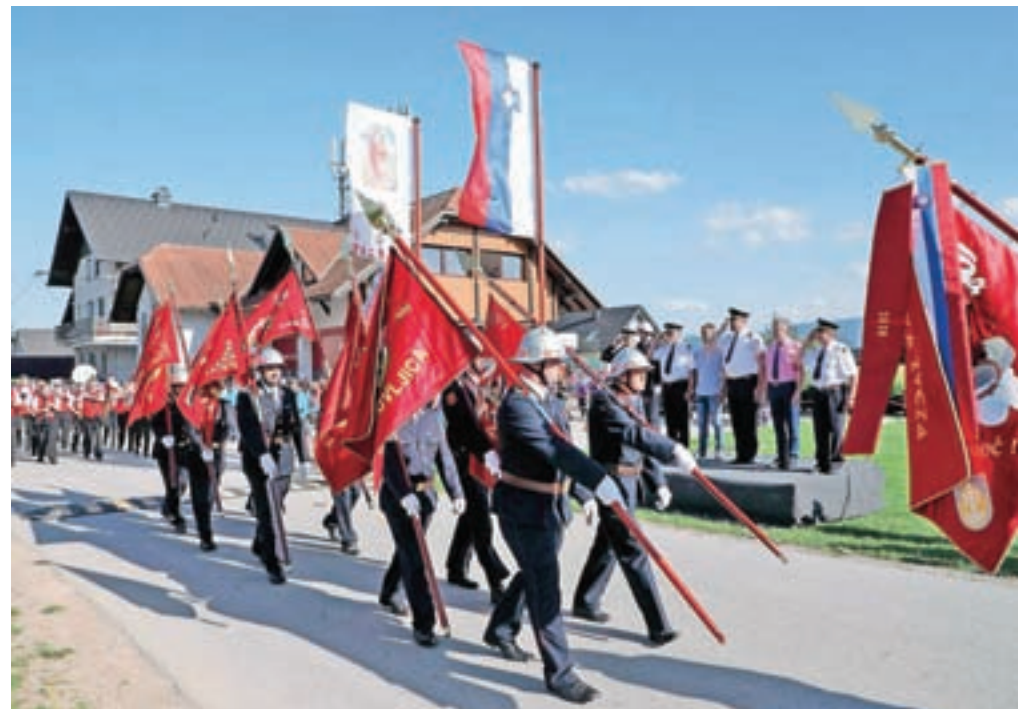
Junija so s tridnevним programom obeležili jubileje brezjanskega gasilskega, športnega in turističnega društva.