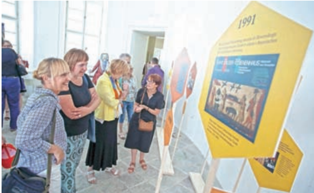
Ob obletnici Čebelarskega muzeja so v atriju Graščine in v zgornji avli pripravili razstavi, ki osvetlujeta šestdesetletno zgodovino muzeja.

Čebelarski muzej v Radovljici je edini muzej v Sloveniji, ki se že šestdeset let ukvarja z zbiranjem, ohranjanjem in promocijo kulturne dediščine čebelarstva. Zbirka prikazuje tri ključne teme, ki zaznamujejo slovensko čebelarstvo. To so: avtohtona rasa čebel (kranjska sivka), svetovno priznani čebelarji in poslikane panjske končnice. Prvi začetki Čebelarskega muzeja segajo v leto 1925, ko