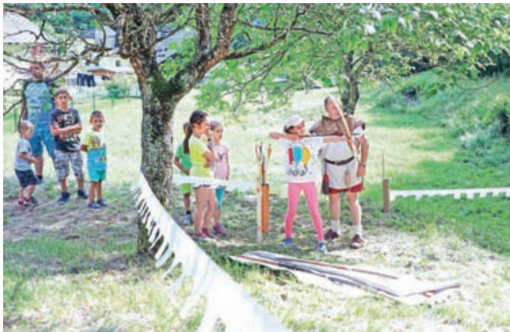
Otroci so se preizkusili v lokostrelstvu na viteški način.

so se urili še v veččinah žongliranja, hoje s hoduljami in ravnotežnih vajah. Robert Levstek je mladim predstavil lokostrelstvo na srednjeveški način, pri katerem se strelja brez merjenja, zgolj z občutkom – in kot je še dejal Levstek – z velikim srcem. V drugi večerni del je obiskovalce pospremil Pihalni orkester Lesce, Teater Cizamo je uprizoril igro Glumači, skupina Čupakabra pa spektakularno ognjeno predstavo. Za glasbeno spremljavo je poskrbel ansambel Aufbiks, za gurmansko