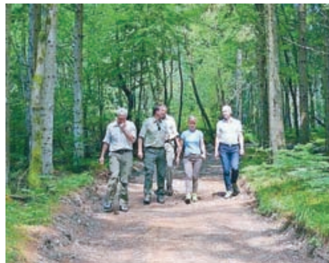
Ministrica za kmetijstvo, gozdarstvo in prehrano Aleksandra Pivec si je skupaj z gozdarji ogledala stanje gozdov na Jelovici.

"Prišli smo, da bi si ogledali trenutno stanje zgornjegorenjskih gozdov, glede na to, da se bo v njih zaradi zelo toplega vremena verjetno zelo hitro začel razmnoževati podlubnik," je razlog za obisk pojasnila ministrica. "Z obiskom in tudi z vsemi prihodnjimi aktivnostmi želim opozarjati predvsem lastnike zasebnih gozdov, ki jih je na tem območju veliko, naj bodo zelo pozorni na to, kaj se v gozdu dogaja, ter naj pravilno in pravočasno ukrepajo v primeru, da se tudi v njihove gozdove nasele podlubnik."