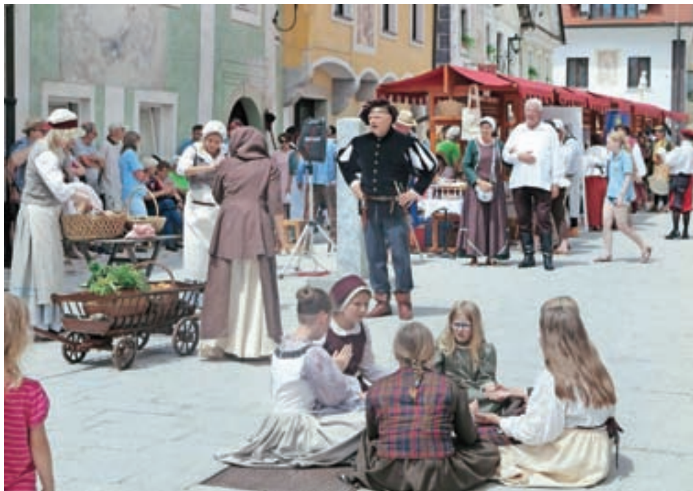
Radovljica je v soboto spet zaživela v srednjeveškem vzdušju. V starem mestnem jedru so pripravili Prangerijado, srečanje mest, ki še imajo ohranjene sramotilne stebre.

Na prireditvi, ki so jo pomenovali Prangerijada, se srečajo enkrat letno, vsako leto v drugem od sodelujočih krajev; tokrat, na 22. srečanju, je bila gostiteljica Radovljica. "Prireditev je etnološko obarvana in osre-