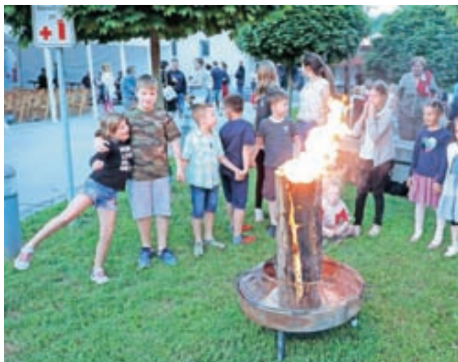
Letos so prireditev zaradi muhastega vremena s prizorišča pri Vili Rustici preselili na prostor pred gasilskim domom.