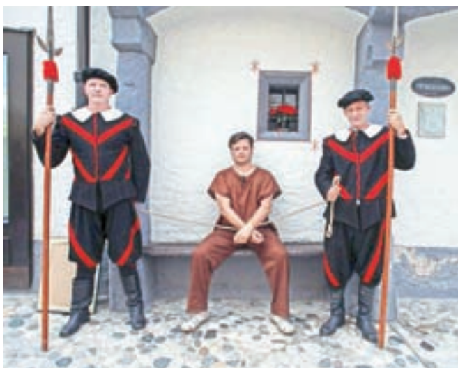
V Radovljici so sramotilni steber skupaj s sramotilno klopjo (na fotografiji) postavili na mestnem trgu nasproti Radovljiške graščine. Pranger je bil arhitekturno povezan z vhodom v hišo; njegovi ostanki so vidni še danes, saj je v veži odprtina z nastavki za verige, s katerimi so privezovali obsojence.

dotočena na prikaz srednjeveškega življenja, sojenja in plesov. Nazorno prikaže srednjeveško življenje na tržni in sodni dan s prikazom obsodbe na kazen prangerja. Sodelujoči kraji