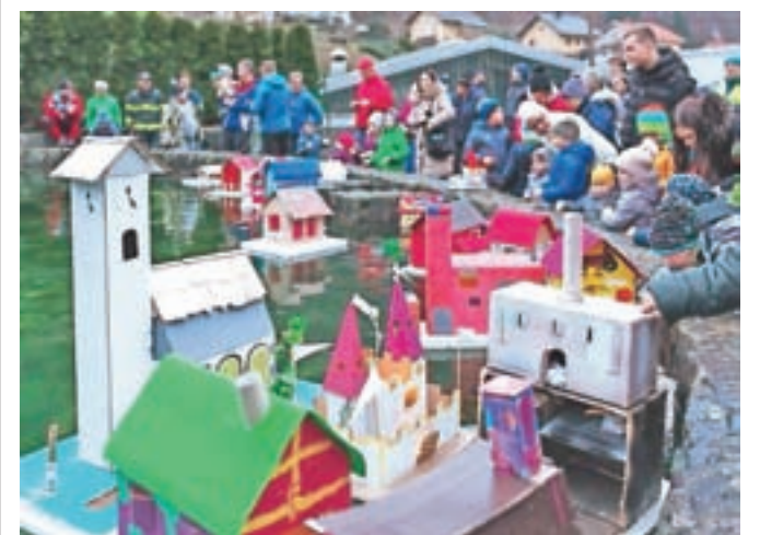
Tudi letos so v Kamni Gorici in v Kropi na predvečer Gregorjevega v vodo spustili barčice.