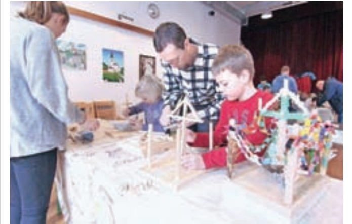
V Kamni Gorici so pripravili delavnico, na kateri so otroci izdelovali tradicionalne kamnogoriške barčice.

organizirali otroško delavnico. Na njej so otroci izdelovali poleg hišic tudi tradicionalne kamnogoriške barčice. To so tako imenovani šmarni križi, ki v drugih krajih s tradicijo barčic niso poznani, so pa bili nekoč ena najpogostejših barčic v