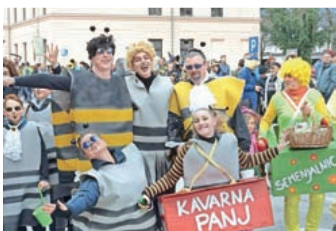
Čebelja limonada v dolini rož: za izvirnost je bila čebelja družina nagrajena s prvo nagrado.