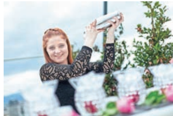
Mladinsko barmansko tekmovanje bo letos prvič odprto za širšo javnost, vstop bo prost.

Zadovoljen je, da bo letošnje tekmovanje, ki je odlična odskočna deska mladim v svet barmanstva, gostil eden najlepših slovenskih kampov. Poleg tekmovanja, na katerem bodo sodelovali tudi štirje tekmovalci omenjene blejske višje strokovne šole, se obeta še pester spremljevalni program. "Za obiskovalce bodo naši študenti po njihovih recepturah mešali pet različnih vrst koktajlov, spoznali bodo tudi edinstvene tipe kave in različne načine priprave kave," je napovedal. Podelitev nagrad najboljšim barmanom bo na gala večerji v hotelu Astoria, sicer pa bodo