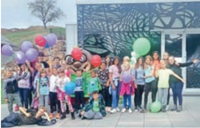
Izlet na Goričko je bil nagrada za letošnje uspešno delo v kulturnem društvu.