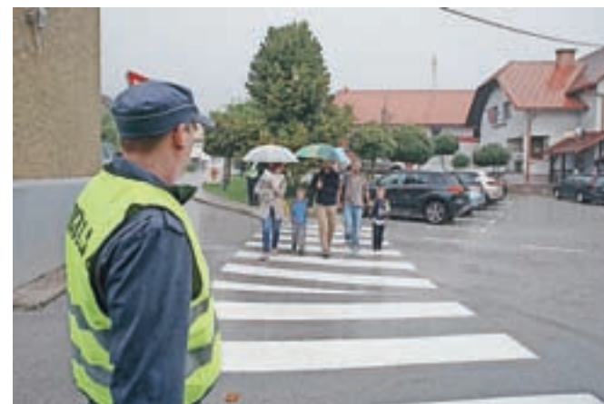
Za varno pot v šolo v prvih dneh skrbijo policisti, občinski redarji, gasilci in drugi prostovoljci.