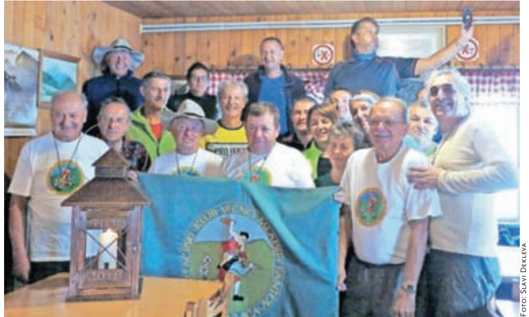
V dežju in megli je skupinska fotografija pohodnikov nastala kar v Prešernovi koči.

Radovljica – Lahko bi rekli, da je bil letošnji simbol pohoda – povečana laterna s svečo na sredini – ravno pravi za rezanje megle pred Prešernovo kočjo pod Stolom, kjer je bilo v primerjavi s preteklimi leti, ko so krstili nove pohodnike, tokrat precej tišje. No, o simbolu kasneje, zagotovo pa lahko potrdim, da v dolgoletni zgodovini pohoda Večno mladih fantov na Stol, ta že 44 let poteka zadnje soboto v avgustu, je le redko zabeleženo slabo vreme, kot smo ga bili planinci deležni letos. To je bil tudi razlog za nekoliko nižje število pohodnikov kot v preteklih letih, kljub temu pa se je v deževnem vremenu do Prešernove kočje pod Stolom povzpelo 27 najbolj vztrajnih, od tega 24 Večno mladih fantov, ki so se jim pridružile tudi tri predstavnice neznanejšega spola. Tudi letos niso manjkali zadnja leta redni udeleženci pohoda iz sosednje Hrvaške. Druga polovica članov Rekreativskega kluba Več-