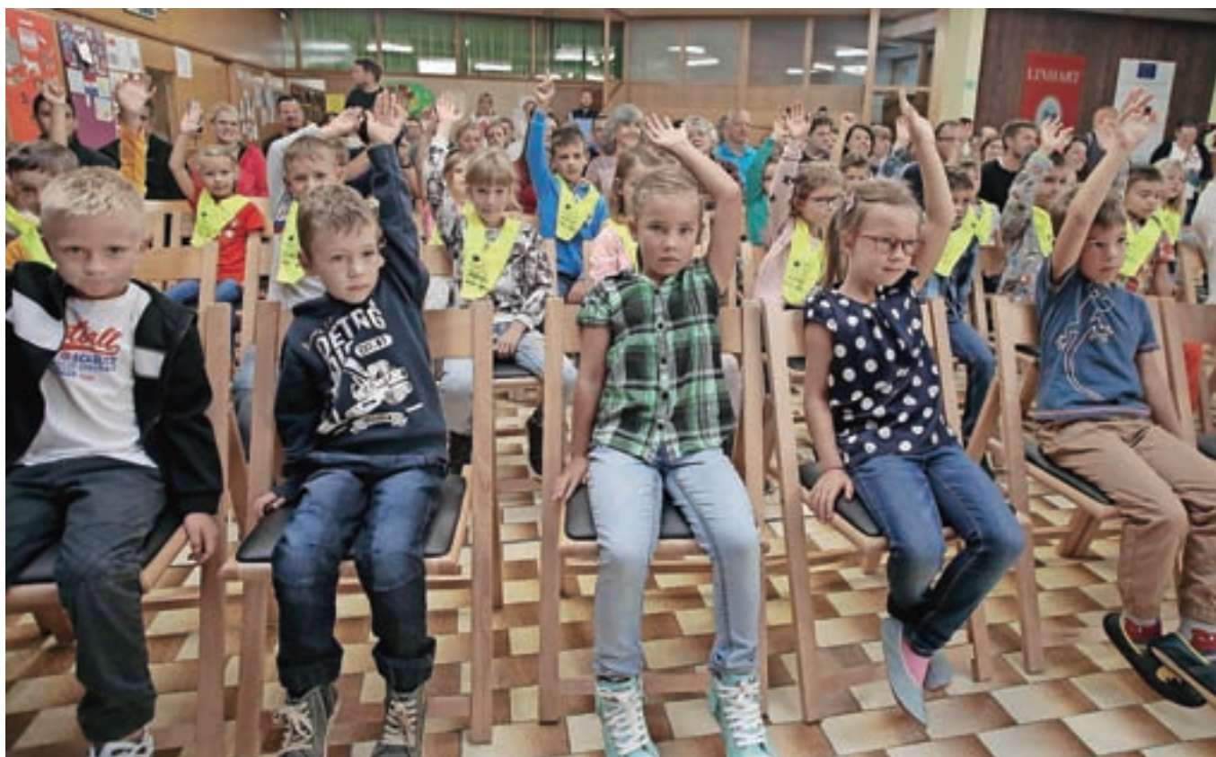
Prvi šolski dan za prvošolce v OŠ A. T. Linhartarja Radovljica