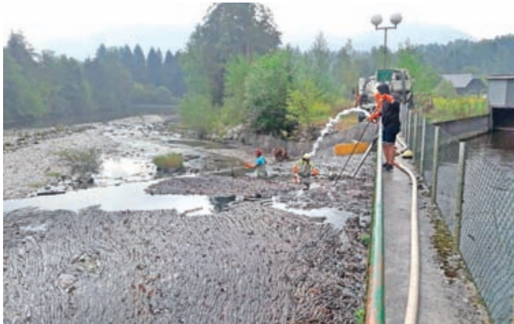
Sedemdeset kubičnih metrov materiala so pomagali odstraniti gasilci iz PGD Lancovo.

Na Bledu so sicer še pojasnili, da je okoljska inšpekcija že avgusta lani in februarja letos prejela prijavo glede neurejenega javnega kanalizacijskega omrežja za odvajanje komunalne in padavinske odpadne vode v občini Bled, a v rednih inšpekcijskih pregledih ni ugotovila čezmerne obremenitve okolja. Čistilna naprava deluje skladno s predpisi s področja okolja, izpadov v delovanju ni, ugotavljajo. So pa še navedli, da imajo v blejski občini kanalizacijski sistem, ki je delno tudi mešanega tipa. V kanalizacijski sistem zato pritečejo tudi zaledne oziroma izvirne vode in tako prihaja občasno do preobremenitev.