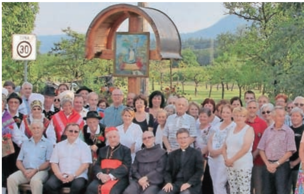
Kardinal Rode in župnika iz Mošenj in Radovljice s farani pred obnovljenim znamenjem v Vrbnjah