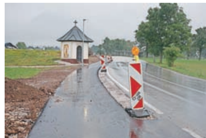
Do začetka šole so uredili tudi novo pešpot ob cesti Hlebce-Lesce.