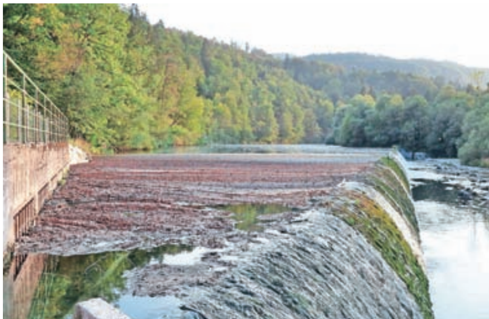
Sredi avgusta je na reki pri jezu nastala velika smrdeča gmeta naplavljenega materiala.

»Poklicali smo inšpekcijo, pa nismo naleteli na kakšno posebno razumevanje. Pomislili smo, da bi lahko očitno onesnaženi vodi botrovala velik naval turistov na višku sezone na Bledu in relativno dolgo sušno obdobje z nevihtami, a na Bledu zatrujejo, da njihova čistilna naprava deluje brezhibno.« Na dogajanje so se odzvali na radovljiški občinski upravni, kjer so dogodek prijavili