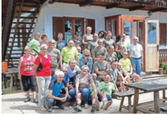
Pred Sankaško kočjo