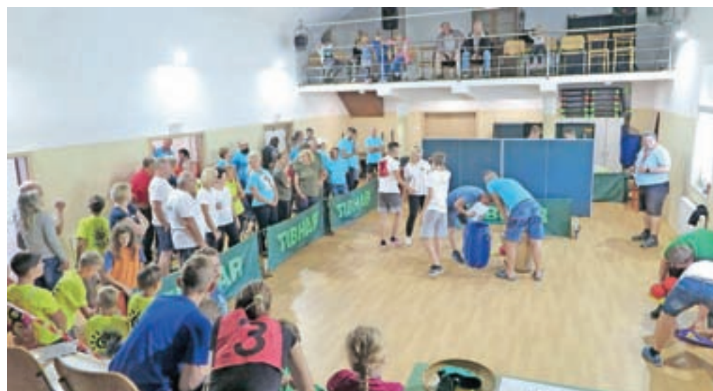
Navijači so napolnili dvorano.