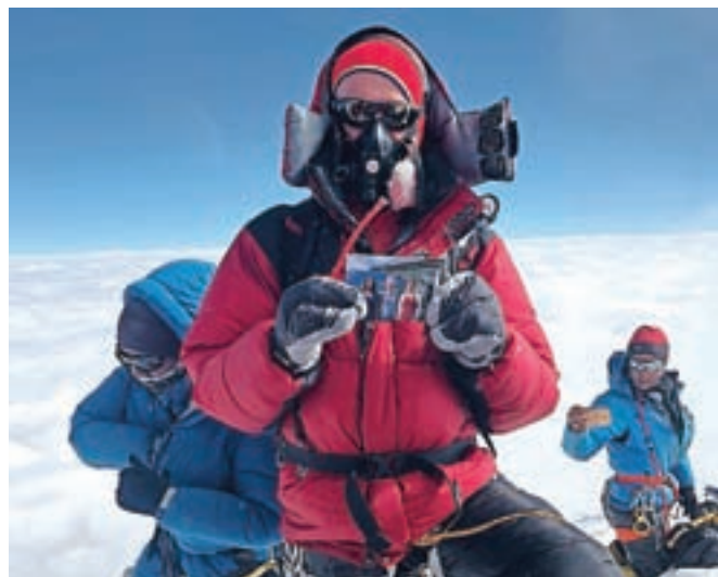
S fotografijo družine: tradicija na vrhu

"Za razliko od Everesta je K2 precej odročeno. Do baze se ne da priti z avtom. Od Escole, zadnje vasice, do katere se lahko pride z avtom, je do baznega tabora (nadmorska višina slabih