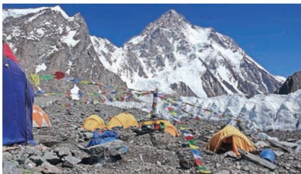
Baza in pogled na mogočni K2