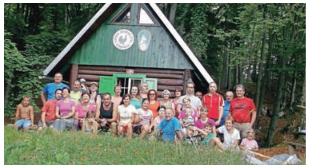
Studenčičani ob lovski koči

Studenčice pa imajo poleg vaškega pohoda tudi vsakoletni piknik, ki je na prvo soboto v septembru. Organizirajo ga na sredi vasi in je vedno dobro obiskan.