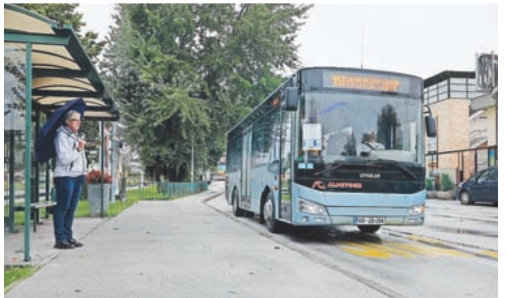
V okviru Evropskega tedna mobilnosti bo od 16. do 22. septembra organiziran brezplačni mestni avtobus Radovljica-Lesce.

Na Ekoprazniku bodo na biodinamičnem vrtu najprej predstavili nov čebelnjak, ki ga je Čebelarsko društvo Radovljica s podporo občine postavilo v počastitev prvega svetovnega dneva čebel. Od 15. do 18. ure bodo na stojnicah na Ekoprazniku svoje pridelke in izdelke ponudili ekološki in biodinamični kmetje, zato je občina k sodelovanju povabila Združenje ekoloških kmetov Gorenjske. Tudi letos organizatorji vabijo občane, da delijo stare sorte stročnic za pridelavo semen, ki jih na vrtu pridelujejo v največji možni meri. Aktivno se bo letošnji prireditvi priključila Srednja gostinska šola Radovljica, saj bodo dijaki