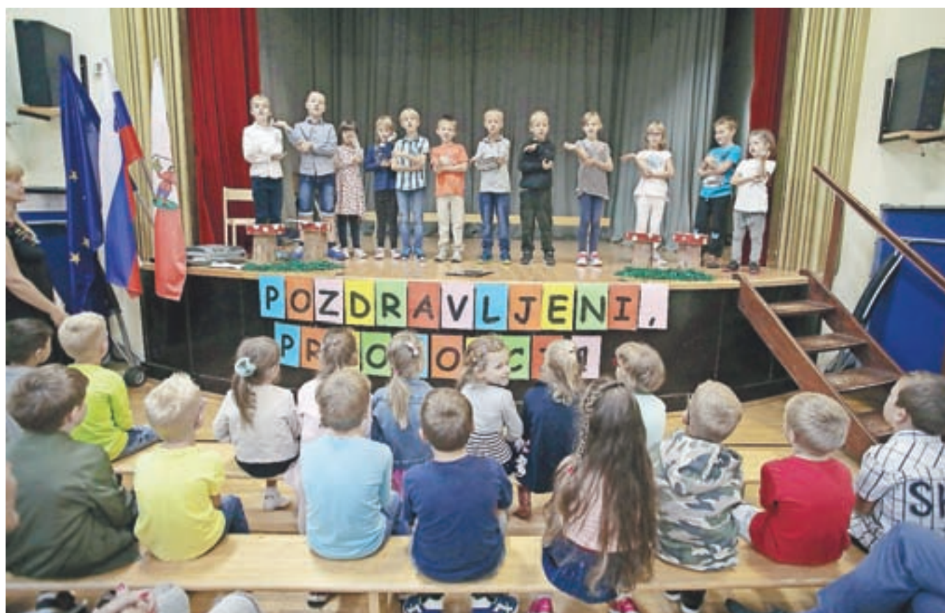
Učenci v Mošnjah so jim pripravili tople dobrodošlice.