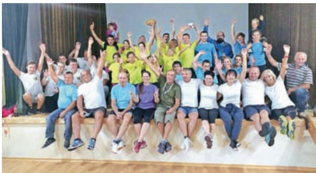
Vaške igre so bile tokrat v dvorani športnega društva.