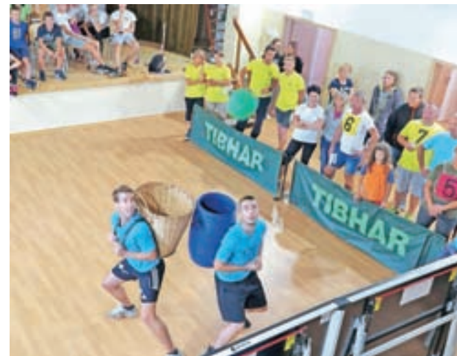
Ekipa so se pomerile v šestih različnih igrah.

Z obnovo doma so resno začeli leta 2014. Zamenjali so zunanja vrata in okna, lani celotno električno napeljavno in razsvetljava ter izolirali in obložili strop. Lani so zamenjali še vseh 17 notranjih vrat in dotrajane radiatorskih sredstev za obnovo več, dodatno osvetlili veliko dvorano, kjer so za piko na i, kot pravi Praprotnik, zamenjali še pod. Dela so letos končali z izolacijo odra, obnovo fasade in pleskanjem lesenih oblog.