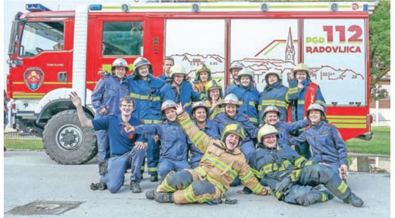
Predstavnice Gasilske zveze Radovljica, ki so sodelovale na skupni vaji gorenjskih gasilk.

Gasilke, članice Gasilske zveze Gorenjska, so se sredi avgusta zbrale na šesti taktični vaji, ki so jo tokrat pripravili na Osnovni šoli Lipnica.