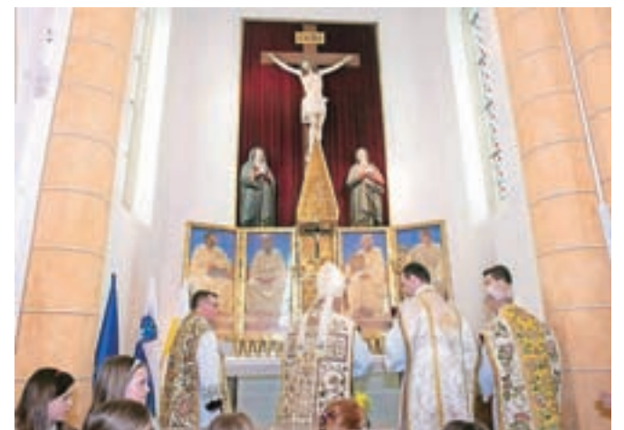
Z razstave v Narodni galeriji se je v domačo cerkev vrnil tudi prenovljen Vurnikov tabernakelj.