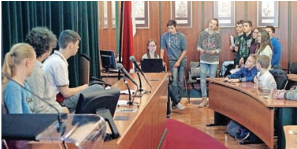
Veliko sejno sobo Občine Radovljica so tokrat zasedli člani otroškega parlamenta, predstavniki štirih osnovnih šol, ki delujejo na območju občine.

Otroški parlament, ki ga pripravlja Zveza prijateljev mladine, sestavljajo predstavniki šolskih skupnosti osnovnih šol Staneta Žagarja Lipnica, Antona Janše Radovljica, A. T. Linhartaradovljica in F. S. Finžgarja Lesce. Letos so učenci razpravljali o temi Šolstvo in šolski sistem. Predstavili so svoja mnenja, razmišljanja, pobude o izobraževanju, običajnem šolskem dnevu pri nas in v tujini, rezultatih različnih tekmovanj, slovnici, črkah, šolskih predmetih, vključenosti vere v šole. Predstavili svoja stališča o kriterijih za ocenjevanje, smiselnosti nacionalnega preverjanja znanja, ustreznosti obsega učnih načrtov, urnika, domačih nalog, prostega časa in počitnic, uporabi elektronskih naprav pri pouku, motiviranosti učencev, šolski prehrani, kakovosti opremljenosti šol, ustreznosti šolskih poti, reševanju vzgojne problematike ... Učenci vseh šol so se strinjali, da so njihove ugotovitve podobne. Učenci so med šolskim letom izvajali različne dejav-