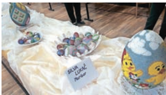
Osnova razstave so bili tokrat pirhi, oblečeni v pisane perlice, delo Silve Lukač.