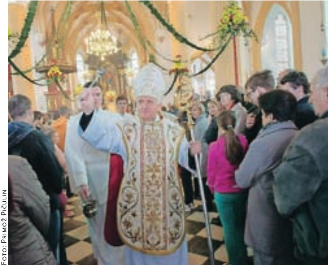
Obnovljeno cerkev je blagoslovil nadškof Stanislav Zore.