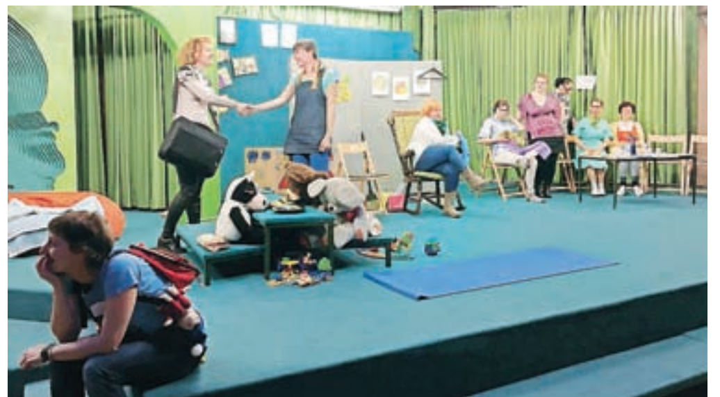
Komedija Čistilna terapija je polna humornih in nepričakovanih zapletov.