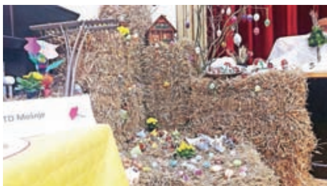
Zanimiva postavitev izdelkov domačega turističnega društva