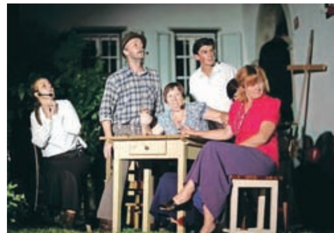
Gledališka skupina Čofta KD Kropa

Sklad bo od 4. do 7. junija v Linhartovi dvorani gostil najboljše gorenjske ljubiteljske gledališke predstave po izboru selektorja Gašperja Jarnija. Radovljiški organizatorji upajo, da bo med predstavami na srečanju, imenovanem Festival gorenjskih komedijantov, tudi katera izmed domačih skupin. Tudi na te predstave bo vstop prost.