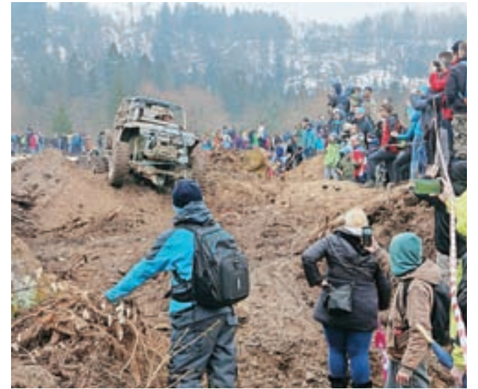
Da navdušencev nad tem športom tudi pri nas ne manjka, je pokazala odlična udeležba tako voznikov kot gledalcev.

Kot še dodajajo organizatorji, to tekmovanje ni le zabava z avtomobili, ampak voznikom daje tudi priložnost, da v varnem okolju preizkusijo zmogljivost svojih avtomobilov in tudi sprostijo svojo divjo voziško plat,