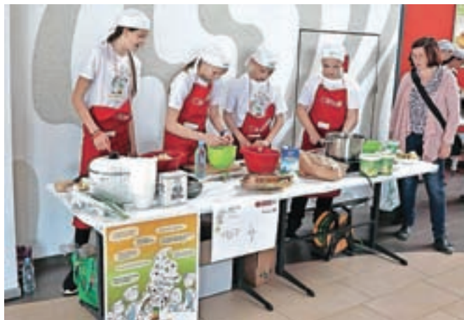
Ekipa TOP 4 je pripravljala golaž s kruhovimi cmoki.