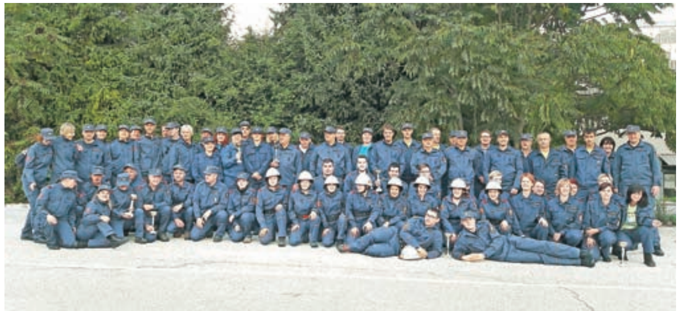
Ekipa članov in članic ter sodnikov GZOR na tekmi na Bledu

Gasilci, tudi v radovljiški občini, v oktobru, ki velja za mesec požarne varnosti, še posebej aktivno opozarjajo na preventivno obnašanje vseh občanov. Letošnji vseslovenski moto preventivnega meseca je: Ko se nesreča zgodi, naj bodo proste poti.