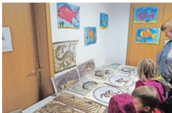
Obiskovalci prireditve so si z zanimanjem ogledali razstavo mozaikov.

kopalnica v mošenjski Villi Rustici, vodotesna, zaradi česar so jo verjetno v kasnejših obdobjih ljudje odnašali iz originalne zgradbe in jo uporabljali za gradnjo svojih objektov. "Ko so Rimljani svoje zgradbe krasili z mozaiki, so radi uporabljali morske motive. Tako je tudi v Mošnjah, kjer so v kopalniških mozaikih upodobljeni delfini."