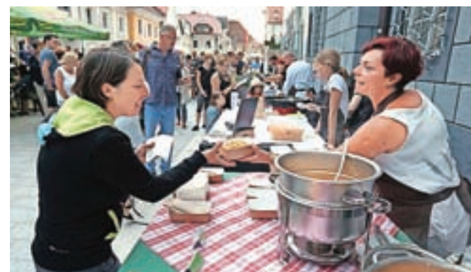
Okusi Radol'ce, ki so poleti navdušili s ponudbo ulične hrane na Linhartovem trgu; Gostišču Tulipan v Lescah je član ekipe že od samega začetka.

Na Turizmu in kulturi Radovljica poudarjajo, da krog Okusov Radol'ce ni zaprt, mesec kulinarike pa je najbolj prepoznavna akcija.