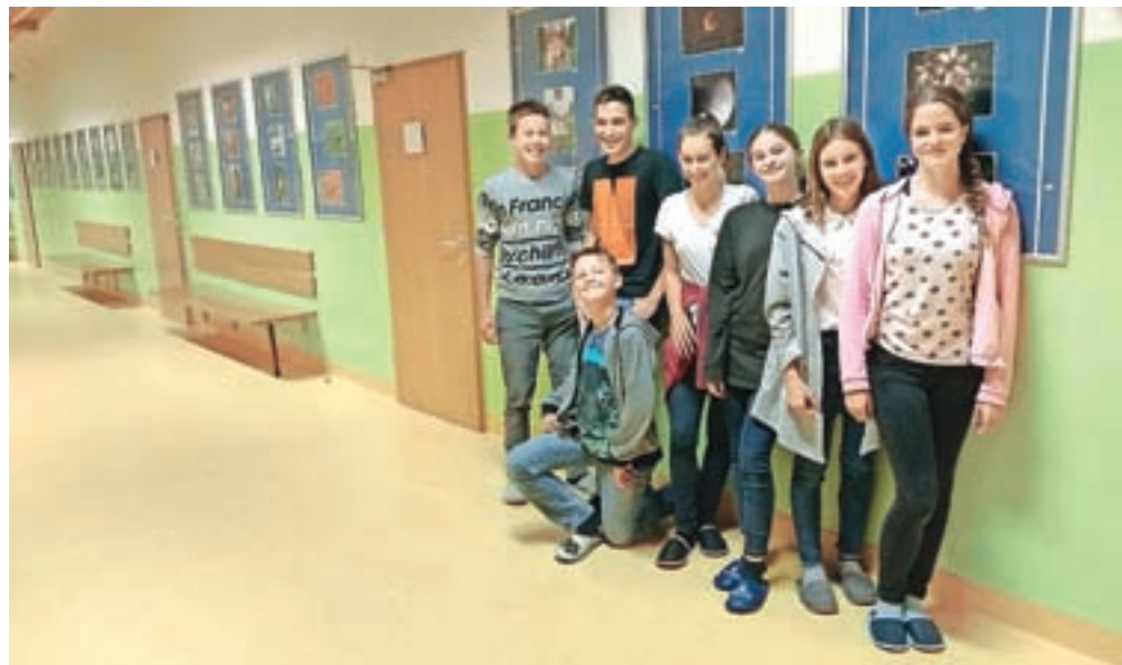
Sodelujoči učenci v "učilnici na hodniku"