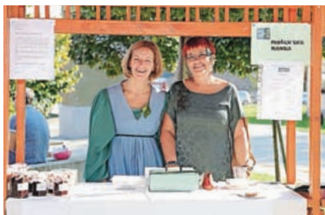
Plačevalo pa se je, tradicionalno, z "moši", ki jih je menjala mošenjska banka.