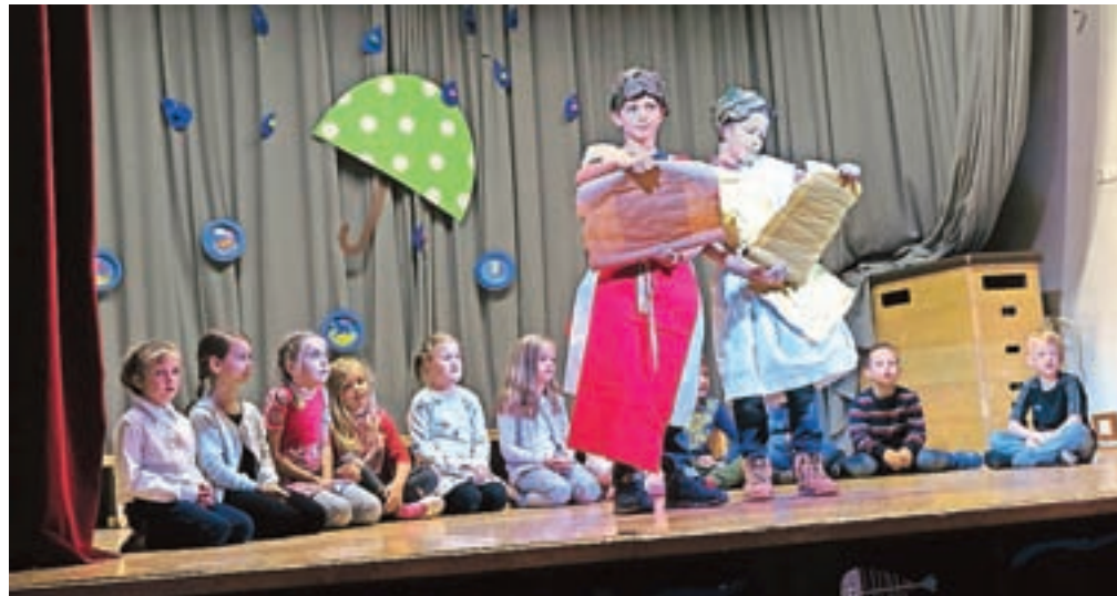
Učenci podružnične šole Mošnje so takole predstavili življenje Rimljanov.