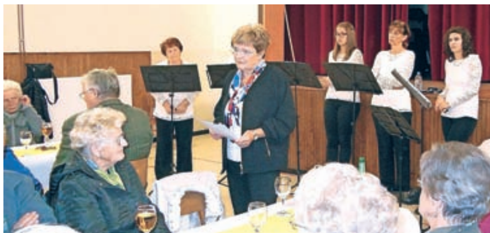
Tudi v Podnartu so za svoje starostnike pripravili lep program.