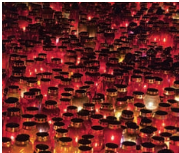
Prižgite svečo manj: predniki ne bodo zamerili, potomci bodo hvaležni.

Se je mogoče nakupu izogniti in se svojih bližnjih spominjati na načine, ki so prav tako – če ne še mnogo bolj – čudoviti kot nagrobne sveče?