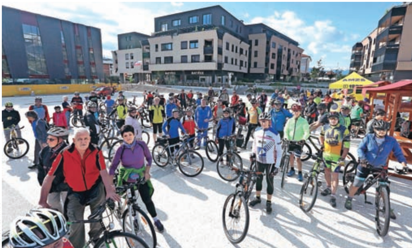
Kolesarskega izleta po občini Radovljica se je letos udeležilo 117 kolesarjev, ki so se na pot odpravili z Vurnikovega trga.