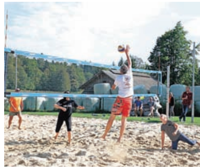
Prireditve je združevala tri glavne športne dogodke: Kostanjev tek, turnir v malem nogometu in turnir v odbojki.

Na malonogometnem turnirju je sodelovalo šest ekip. V skupini A je z dvema zmagama zmagala ekipa Elmont Bled, v skupini B je bila z zmago, neodločenim rezultatom in najboljšo gol razliko prva Smola. Ti dve ekipi sta se na koncu srečali v finalu. Elmont je osvojil tur-