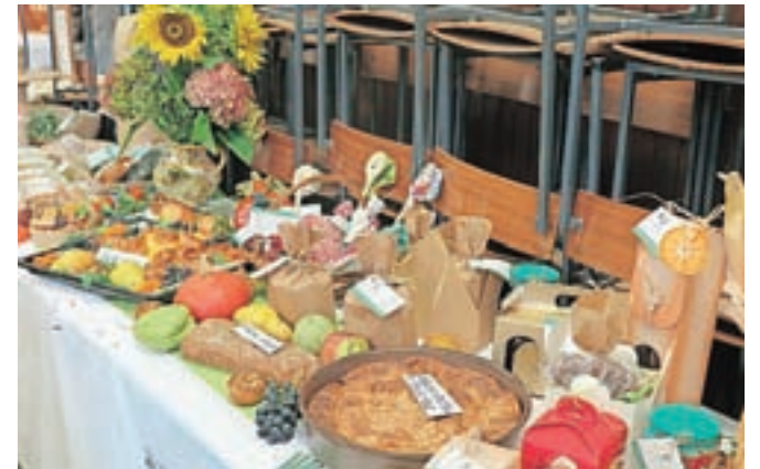
Ob prazniku so v dvorani kulturnega doma pripravili razstavo ročnih del, obrti in kmetijstva.