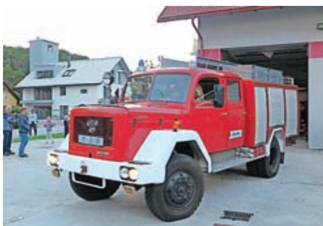
Staro vozilo bodo odslej uporabljali gasilci iz Begunj.