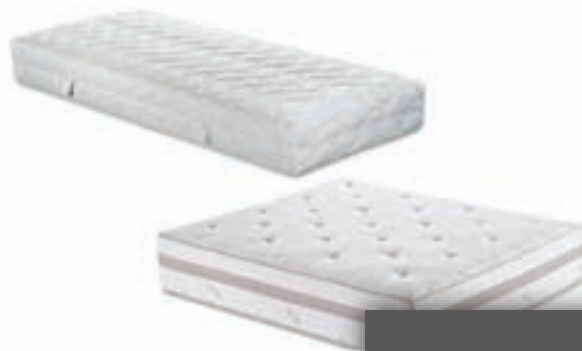
vzmetnice in postelje