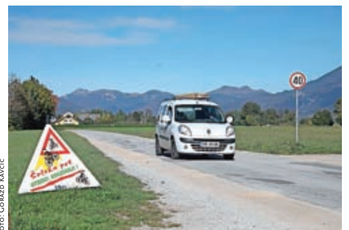
Prenova ceste med trgovino Spar in hotelom Manca je v načrtu za obdobje med letoma 2018 in 2020.

poti na najbolj kritičnem odseku od Borove hiše do Osnovne šole A. T. Linharta.