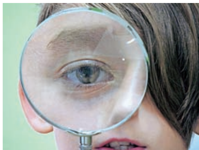
Povečano oko / FOTO: BLAŽ MEKINA

stave predstavljali fotografije in jim postavljali vprašanja z delovnih listov. Odprtje razstave je popestril še profesor Andraž Hrastar s fotografijami Marsa.