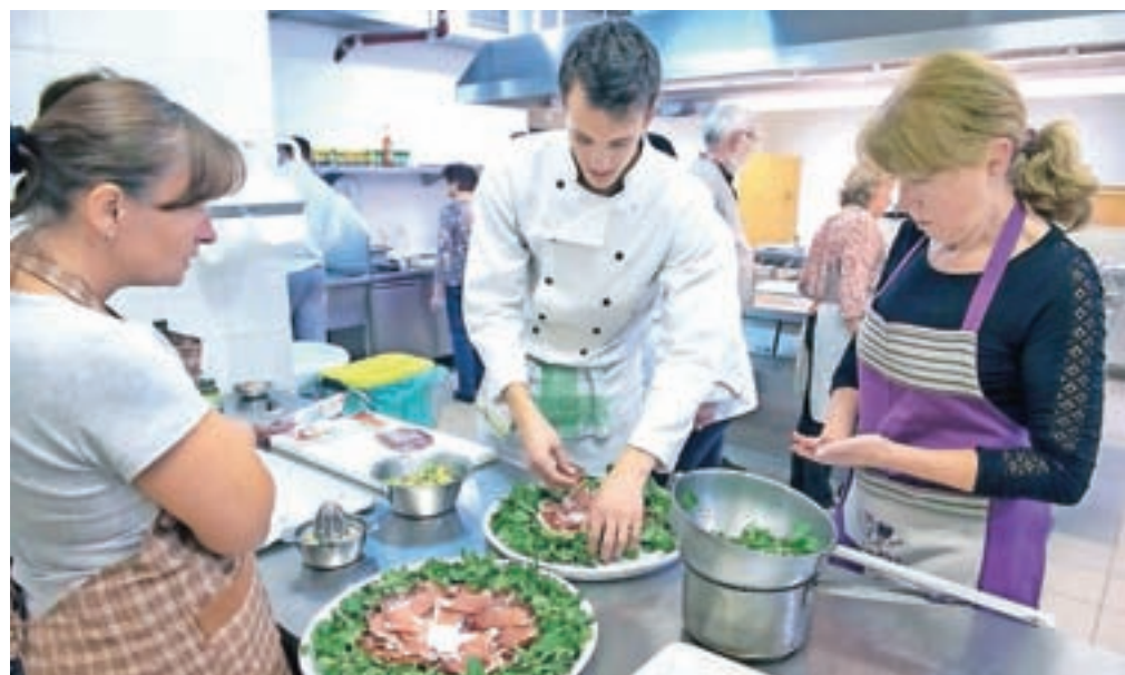
Tudi izdelava zapletenih tortelinov, nadevanih z medenimi jurčki, je šla udeležencem jubilejne kulinarične delavnice dobro od rok.