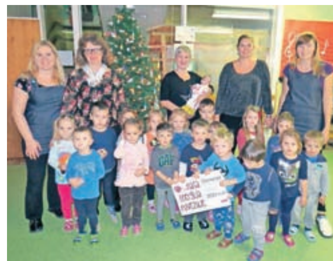
V vrtcu so se razveselili Petrolove donacije.