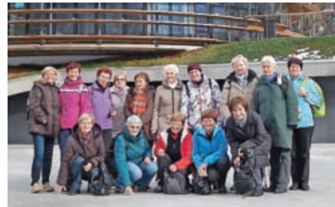
Prostovoljke v Planici

opažanja so dobrodošla tudi strokovnim službam. Za nagrado za uspešno delo v letošnjem letu so se prostovoljke odpeljale v Planico. Ogledale so si to našo lepoticco in vse nove objekte, nad katerimi so bile navdušene. Prijetno druženje so sklenile ob izviru Save Dolinke pri Zelencih.