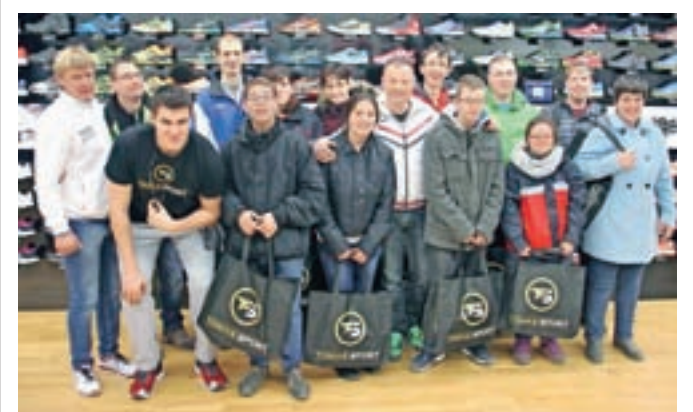
Zadovoljni so odhajali iz trgovine Tomas sport, kjer so jim pri nakupu pomagali z lepim popustom.