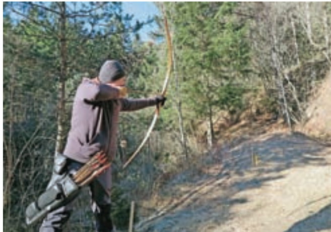
Zanimiva priložnost za aktivno preživljanje prostega časa.