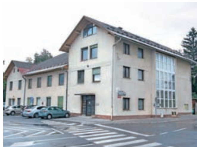
Stavba nekdanjega TVD Partizan v središču Radovljice je že nekaj let v klavrnem stanju.