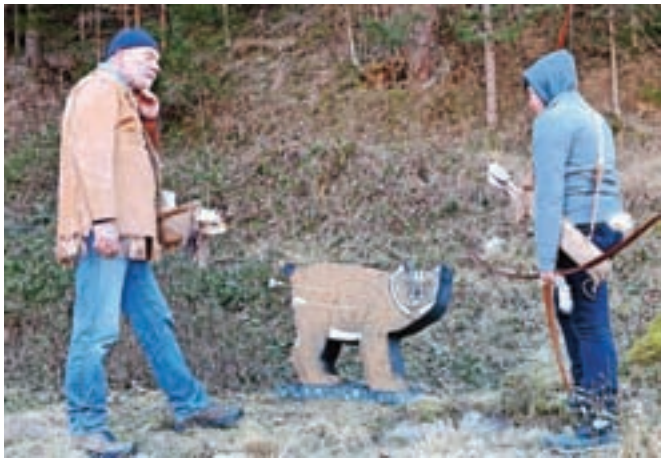
Izvrlejo puščice, zapišejo rezultat in se odpravijo dalje.

V dolini Draga se je prvo soboto v januarju na tradicionalnem 3D-trening turnirju zbralo blizu sto lokostrelcev iz Italije, Avstrije in Slovenije, ki so se pomerili v streljanju v tarče, replike divjih živali.