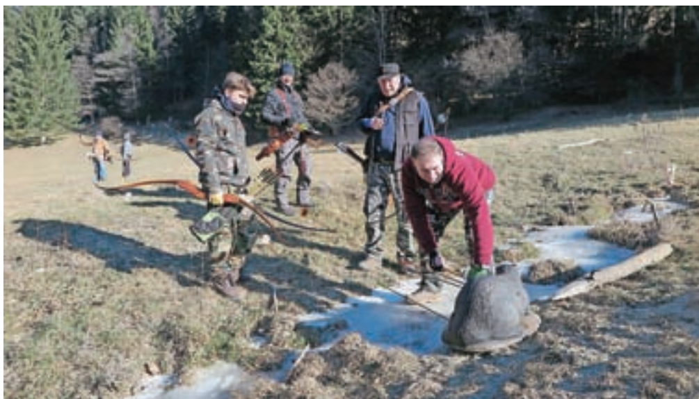
Tekmovalci streljajo v tarče, replike divjih živali.

ženje in prijetno preživljanje prostega časa v naravi.« Naslednji dve tekmi v okviru Zimskega trojčka bosta 11. februarja in 4. marca.