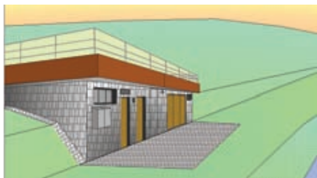
Projektna dokumentacija vodarne Ovčja jama je že izdelana.

Vodi iz izvira Ovčja jama, ki bo v obdobju do izgradnje nove vodarne z UV-dezinfekcijsko napravo v Krnici prihajala po povezovalnem vodovodu Hraše–Ledevnica, je treba zaradi večje varnosti uporabnikov minimalno dodajati dezinfekcijsko sredstvo. Vodo iz omrežja uporabniki lahko uporabljajo brez kakršnihkoli omejitev.