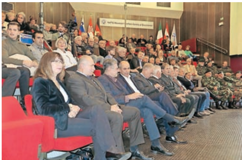
Slovesnost v Natovem centru odličnosti za gorsko bojevanje v Poljčah