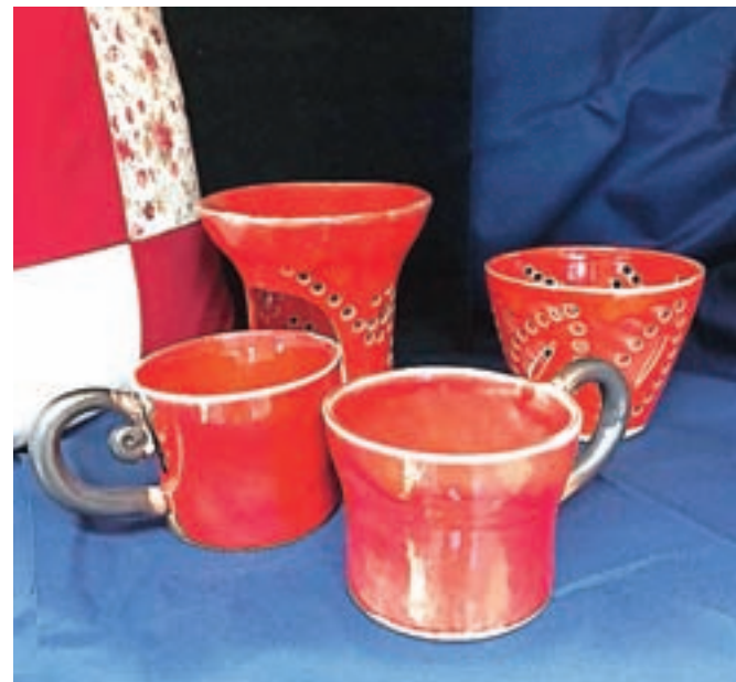
Bisere imajo na voljo tudi v obeh trgovinah CUDV Matevža Langusa, v Radovljici in na Jesenicah. Obe delujeta v sklopu tamkajšnjih varstveno delovnih centrov.