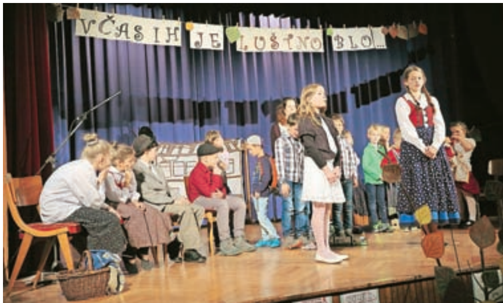
Zanimivo prireditev ob obletnici šole, v kateri so na zabaven način prepletli preteklost s sedanjostjo, so pripravili učenci in učiteljice Podružnične šole Ovsiša.