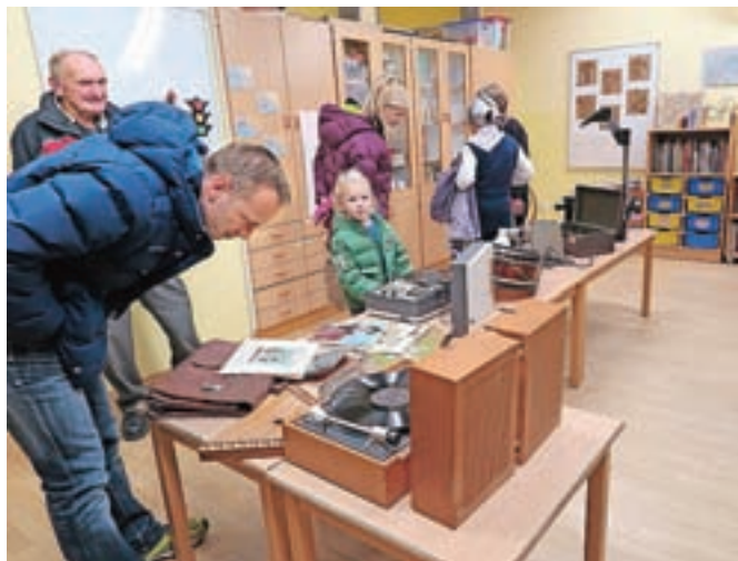
Ob 120-letnici delovanja šole so v Ovsišah pripravili zanimivo razstavo o življenju v šoli nekoč.

Podružnična šola Ovsiša, ki sodi pod okrilje Osnovne šole Staneta Žagarja Lipnica, letos praznuje sto dvajset let neprekinjenega delovanja. V Podnartu so v ob krajevnem prazniku pripravili slovesnost, s katero so obeležili ta visoki jubilej.