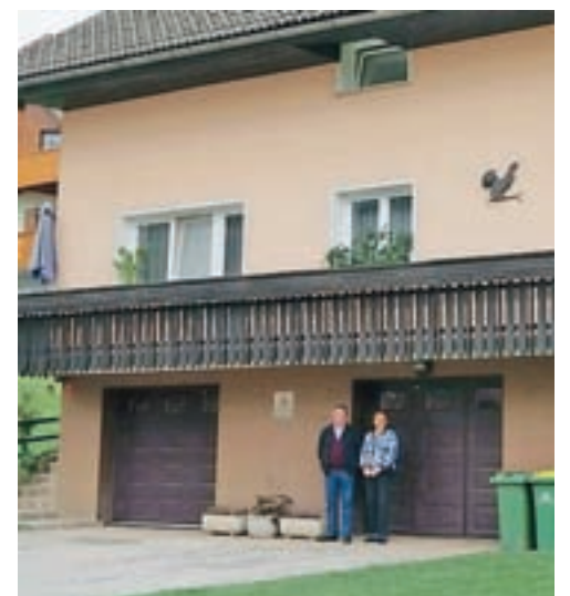
Spominska plošča na hiši Fistrovih na Brdih

Drugo spominsko ploščo so veterani vojne za Slovenijo odkrili pri Vinku Fistru z Brd, kjer je bilo v času osa-