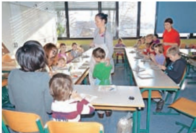
Z ene od otroških delavnic

Sodelujejo tudi na različnih prireditvah, kot so srečanja nevladnih organizacij ipd., kjer se predstavljajo obiskovalcem, jih povabijo v svoje vrste in tudi prosijo za pomoč, saj so neprofitna organizacija, ki se financira z donacijami, prostovoljnimi prispevki in članarinami. Predsednica meni, da se ozavešenost žensk izboljšuje, vendar se glas o društvu širi prepočasno, gre namreč za nov koncept, ki potrebuje čas, da ga okolica spozna. »Društvo želi s svojim delovanjem pridobiti zaupanje in spoštovanje lokalne skupnosti in širše. Za enkrat glas širimo prek spletne strani, Facebooka in predstavitve medijem, seveda pa si želimo, da bi dosegel kar največ žensk, še posebej tistih, ki potrebujejo našo pomoč oziroma želijo deliti svoje izkušnje.