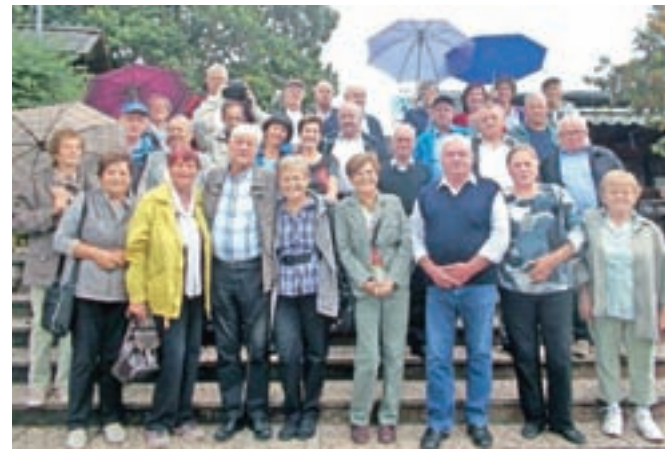
Generacija nekdanjih vojakov se skupaj s soprogi družijo že več kot trideset let.