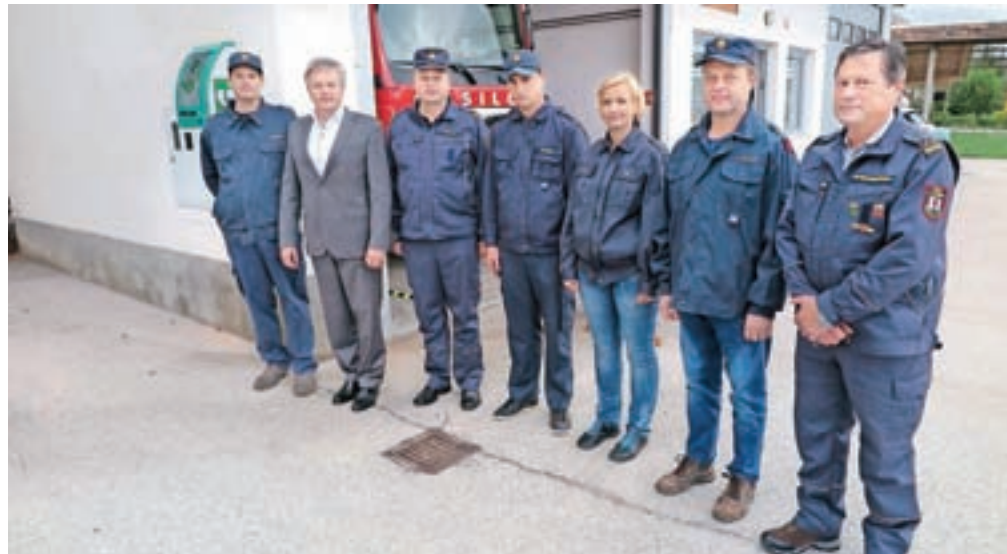
V Ljubnem je defibrilator nameščen na gasilskem domu,