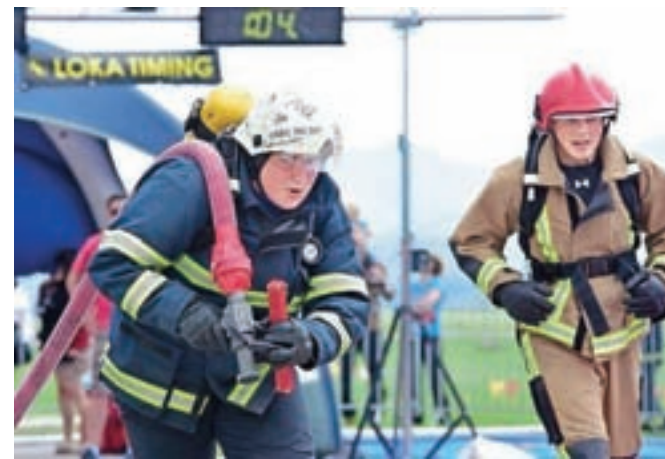
Vleka cevi, avtor Branko Habjan, diploma