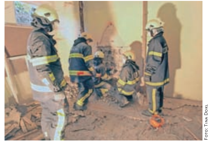
Do ponesrečencev v poškodovanih stavbah so se reševalci prebijali tudi z napornim kopanjem odprtín v stenah.

delom nadaljujemo, zaradi lažjega obvladovanja situacije smo občino razdelili na dva sektorja, eden je v Kamni Gorici, drugi v Mošnjah. Danes je v reševalnih nalogah aktivnih 147 pripadnikov različnih enot – od gasilcev, gorske reševalne službe do radioamaterjev, Rdečega križa, Komunale Radovljica. Aktivne so torej vse službe, ki jih imamo v občini na razpolago. Na vaji sodeluje še veliko markirantov, saj je Rdeči križ organiziral tudi poizvedovalno službo, ki se ob takih nesrečah aktivira za iskanje pogrešanih in za psihološko pomoč žrtvam in svojem. Skupaj torej na vaji sodeluje okoli dvesto ljudi," je razložil 18 ur po namišljenem potresnem sunku. Snovalci vaje so si zamislili, da so morali iz 195 (več)stanovanjskih stavb v Radovljici, Lescah, Begunjah, Mošnjah, Kamni Gorici in Kropi, ki jih je močno poškodoval potres, evakuirati skupno 834 prebivalcev. Večina je zatočišče dobila pri sorodnikih in sosedih, v nastanitvenem centru v OŠ A. T. Linhartar v Radovljici pa so prvo noč sprejeli