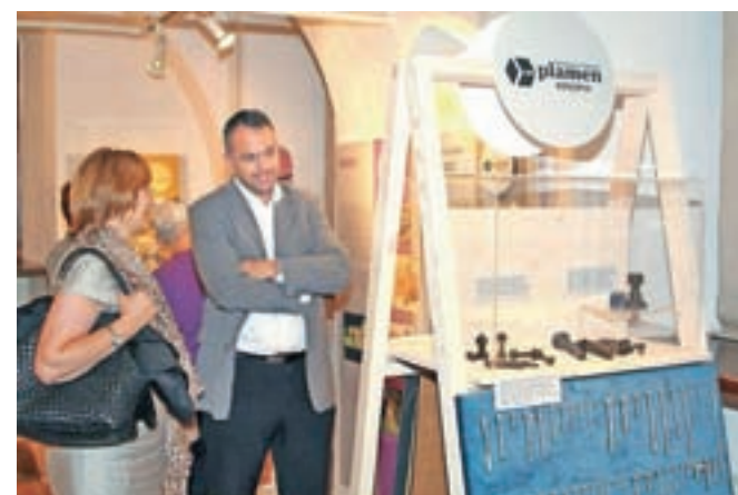
Nekdanji Plamen se predstavlja z vijaki, ki so jih izdelali tudi po devet tisoč ton letno.

izdelki so v Jugoslaviji dobivali najvišja odlikovanja za oblikovanje, predstavljali so jih na sejmi in modnih revijah, prodajali pa v lastnih trgovinah v Radovljici, Bohinjski Bistrici, na Bledu in Jesenicah. V najboljših časih je tovarna zaposlovala 815 ljudi.