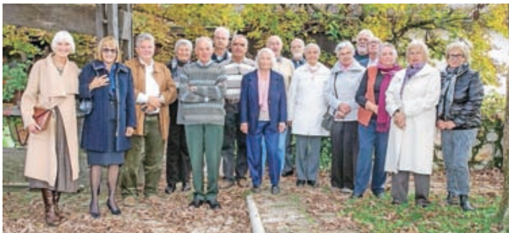
Nekdanji sošolci iz radovljiške nižje gimnazije se redno srečujejo.

nili, da se dobimo zopet čez pet let, to je leta 2021. Odredbo, da se v Radovljici ustanovi nižja gimnazija, je 3. septembra 1945 podpisal tedanji minister za prosveto,