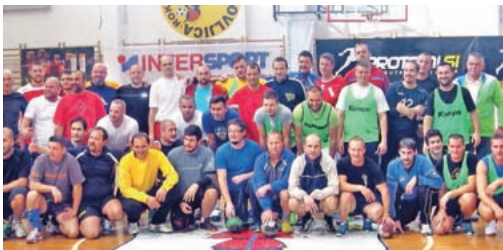
Lepo število veteranov

Če potegnemo črto, je rokometni dan dosegel svoj namen. Rokomet je bil to nedeljo najpomembnejši šport v Radovljici, poleg tega so se srečale vse generacije radovljiškega rokometarja.