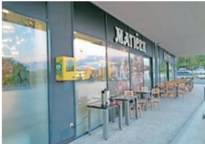
... na Vurnikovem trgu v Radovljici pa tik ob vhodu v picerijo Matiček.

V okviru projekta se vzpostavlja tudi mreža prvih posredovalcev, to je tistih ljudi, po navadi gasilcev, ki pridejo do bolnika prvi, še pred prihodom ekipe nujne medicinske pomoči (NMP). "Prvi posredovalci prvi nudijo pomoč osebam v nenadnem srčnem zastoju ali ob nekaterih življenjsko ogrožajočih stanjih, za katera so usposobljeni (hude krvavitve, nenadna huda bolečina v prsih, sveža možganska kap, tujki v dihalih, nezavest). Njihova prednost je, da so bolnikom bliže kot ekipa NMP, kajti