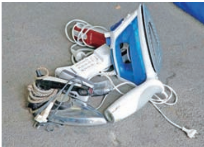
V zaboynike lahko odlagamo manjše električne aparate in elektronsko opremo, kot so odsluženi likalniki, mešalniki, brivniki, pa tudi baterije.