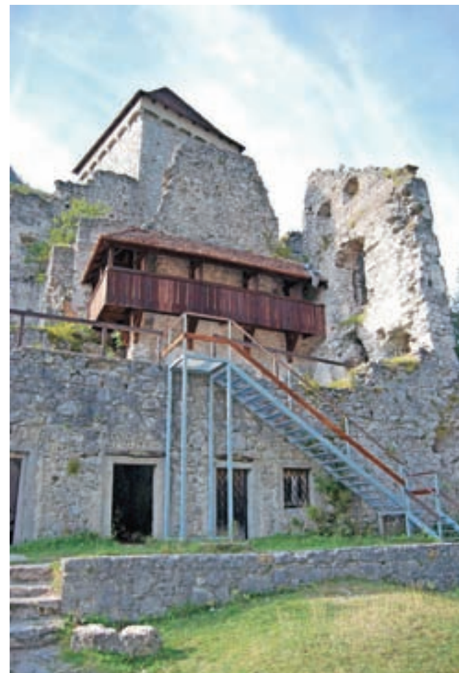
Do takrat, ko bodo utrdili razrahljana mesta zidov, bo treba del poti zapreti in urediti nov dostop v notranjost obzidja.