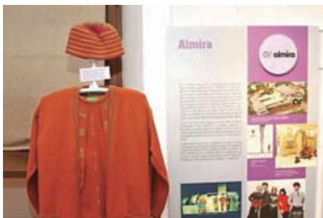
Na razstavi so na ogled tudi nekateri Almirini izdelki, denimo pleten kostim.

Obrata so imeli tudi v Novi Gorici in Bohinju. Leta 1982 so v Grimščah pri Bledu uredili center ročnih pletenin, prodajalno in razstavišče, nato pa še nov trgovski center za slovensko tekstilno industrijo na Pristavi. V Almira so sprva pletli bombažne in sintetične (perlon) nogavice, po letu 1963 pa predvsem vrhne pletenine. Almirini