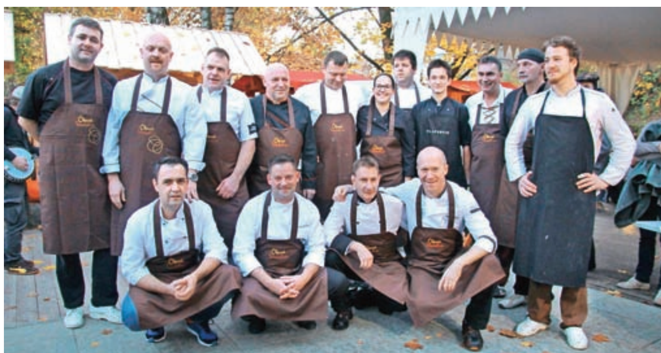
Ekipa kuharskih mojstrov Okusov Radol'ce 2016, ki bo v novembru skrbela za vrhunsko kulinarčno ponudbo na krožnikih trinajstih gostiln v občini.