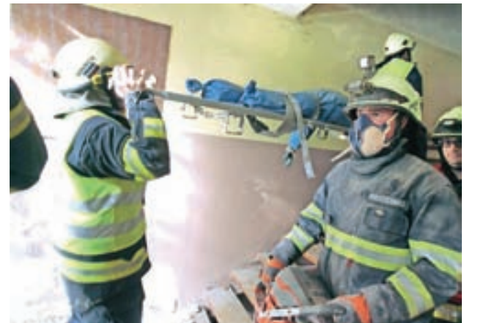
Po scenariju so v močnem potresu umrli vsaj štiri občani, štirinajst pa jih je bilo ranjenih.

150 občanov, katerih objekti niso bili varni za bivanje. Potres, ki je terjal tudi štiri smrtno žrtve, 14 oseb pa je bilo poškodovanih, je poškodoval tudi vodovodno omrežje, zato so v Kamni Gorici ostali brez pitne vode, po občini je bilo moteno delovanje električnega in telekomunikacijskega omrežja, več cest je postalo neprevoznih. Občina Radovljica je sicer na meji potresne ogroženosti