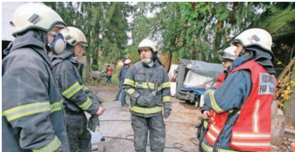
Še zadnji posvet pred odhodom na ruševine

do osme stopnje po evropski lestvici, je poudaril Koselj. "Po zgodovinskih podatkih rušilnega potresa tu še ni bilo, so pa daleč nazaj že čutili posledice večjih potresov v oddaljeni okolici. Predvidevamo, da bi bili ob močnem potresu na našem območju novejši objekti v veliki meri manj poškodovani, skrbijo pa nas starejši objekti v vaških in mestnih jedrih," je dodal.