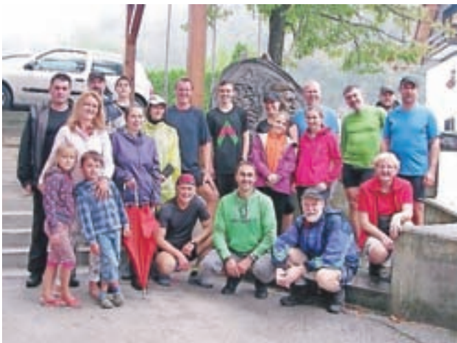
Na cilju tekaškega in pohodniškega podviga, v Kamni Gorici