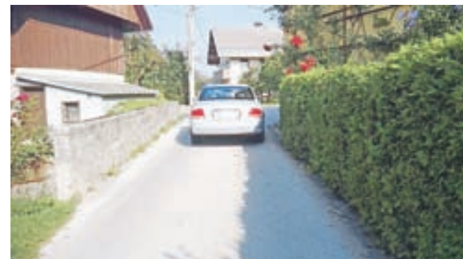
Nevarni cestni odsek na Mišačah

Krajani Mišač so opozorili na nevarne razmere v ovinku sredi vasi, kjer betonski oporni zid opuščene gnojne jame zoži vozišče. "Na nevarne razmere opozarjamo že leta," pravijo krajani in poudarjajo, da gre prav skozi ovinek, kjer se avtomobili ne morejo srečati, vsak dan v šolo pet otrok, ki se nimajo kam umakniti. Kot so pojasnili na radovljiški občinski upravi, bo občina v prihodnjem letu naročila izdelavo projektne dokumentacije za ureditev kritičnega odseka ceste na Mišačah, čemur bo sledila izvedba po vzoru nedavne prenove ceste v Otočah.