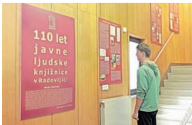
Razstava 110 let javne knjižnice v Radovljici je na ogled še do konca meseca.

V radovljiški knjižnici Antona Tomaža Linhartar je še do konca meseca na ogled razstava z naslovom 110 let javne ljudske knjižnice v Radovljici. Razstavo, ki jo je pripravil Jure Sinobad, si lahko ogledate še do konca meseca.