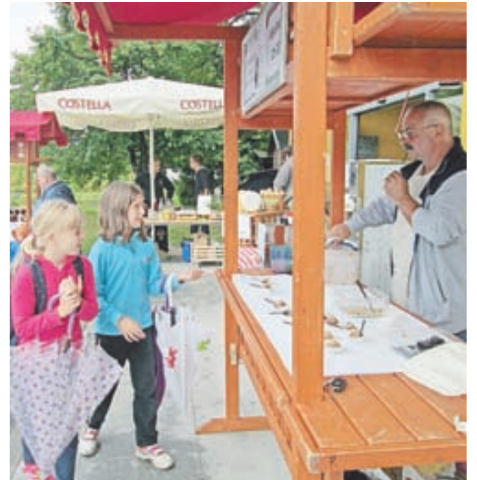
Kljub slabemu vremenu je pester program prireditve Dan medu v Lescah v soboto privabil številne obiskovalce, ki so navdušeno (p)okušali.