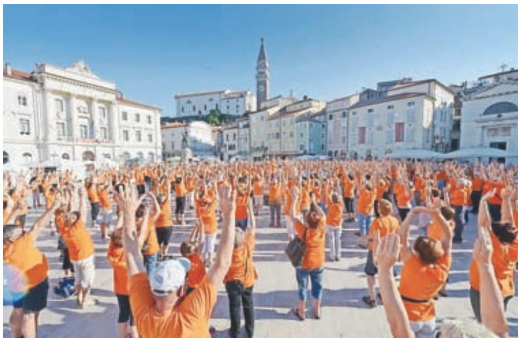
Na letošnjem srečanju v Piranu je bilo več kot tisoč udeležencev, med njimi tudi telovadci iz Radovljice in Lesc.

Telovadbo je vodil ruski zdravnik Nikolay Grishin, idejni vodja in ustanovitelj Društva Šola zdravja. Z duhovitimi prisposodobami je ob vsaki vaji povedal