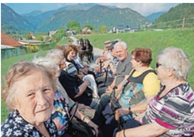
Namesto običajnega druženja so se po vaseh popeljali s konjsko vprego.