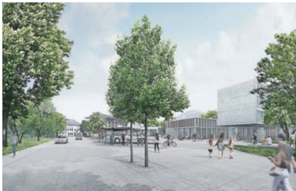
Pogled na avtobusno postajo

Umeščanje parkirišč v prostor, ki bi moral biti namenjen pešcem in zelenim površinam oz. kronično pomanjkanje parkirnih površin in predvsem pretekle delne rešitve na področju prometa danes predstavljajo težavo v celotnem območju. Grajski park se prenove kot sodobna interpretacija historične zasnove, pod njim se umesti dvoetažna parkirna hiša s 500 parkirnimi mesti. Uvoz