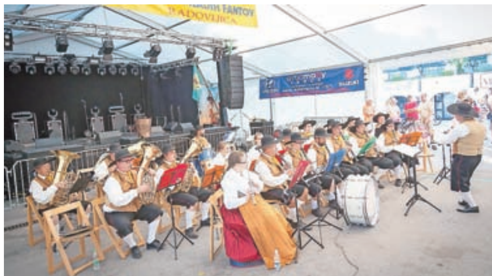
Godba iz Nabrežine pri Trstu med nastopom v Radovljici

Godbeniki iz Nabrežine so obiskali Begunje. Z velikim zanimanjem so si v muzeju ogledali zgodbo svetovnega glasbenega fenomena. Spoštljivo se se poklonili spomenu Slavka Avsenika na njegovem grobu. Popoldan so vsi štirje orkestri z Linhartovega trga slovesno prikoral