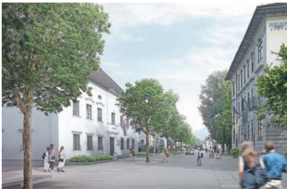
Pogled vzdolž Gorenjske ceste

Avtorji bodo projekt javno predstavili 10. oktobra ob 17. uri v plesni dvorani Radovljiške graščine. Po predstavitvi bo sledila javna debata o ustreznosti rešitev. Vabljeni na predstavitev in še posebej k skupnemu razmisleku o prihodnjih ureditvah.