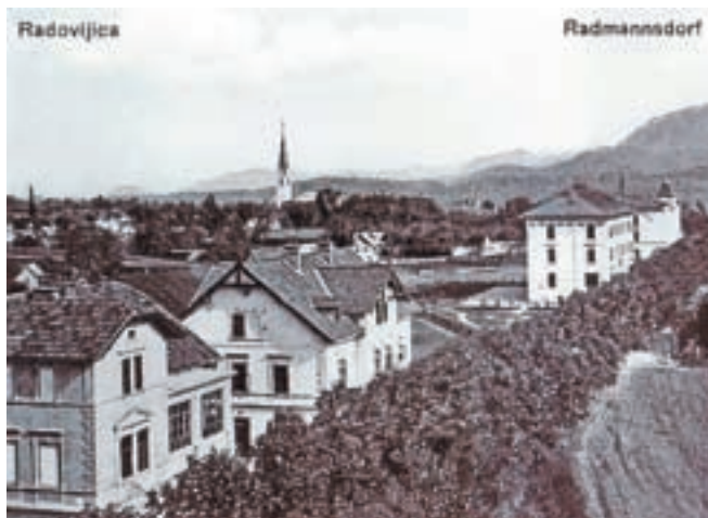
Gorenjska cesta v 30-ih letih prejšnjega stoletja

V načrtanem okviru pa lahko proučujemo tudi odnos strokovne javnosti in imetnikov do varovane dediščine od posegov pred drugo sv. vojno skoraj do konca 20. stoletja. Arhitekt Ivan Vurnik je s hotelom Grajski dvor v letih 1934/36 neus-