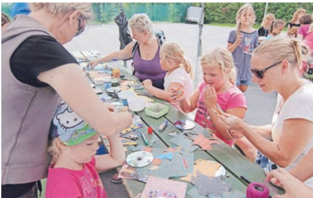
Bogato kulturno dogajanje Langusovih dni s poudarkom na likovnem ustvarjanju

Število prebivalcev Kamne Gorice je v zadnjih letih stabilno, čeprav se v kraju srečujejo s problemom starih praznih hiš. "Obnove takšnih objektov so tehnično in finančno zelo zahtevne. Tisti, ki morda imajo sredstva, včasih nimajo potrebnega znanja za kvaliteten obnovo, še pogosteje se lastniki pri načrtovanih obnovah srečujejo z velikimi finančnimi obremenitvami in strokovnimi zahtevami, zato bi si na tem področju vsekakor želeli več sodelovanja tako občine kot države," je še povedal Beton.