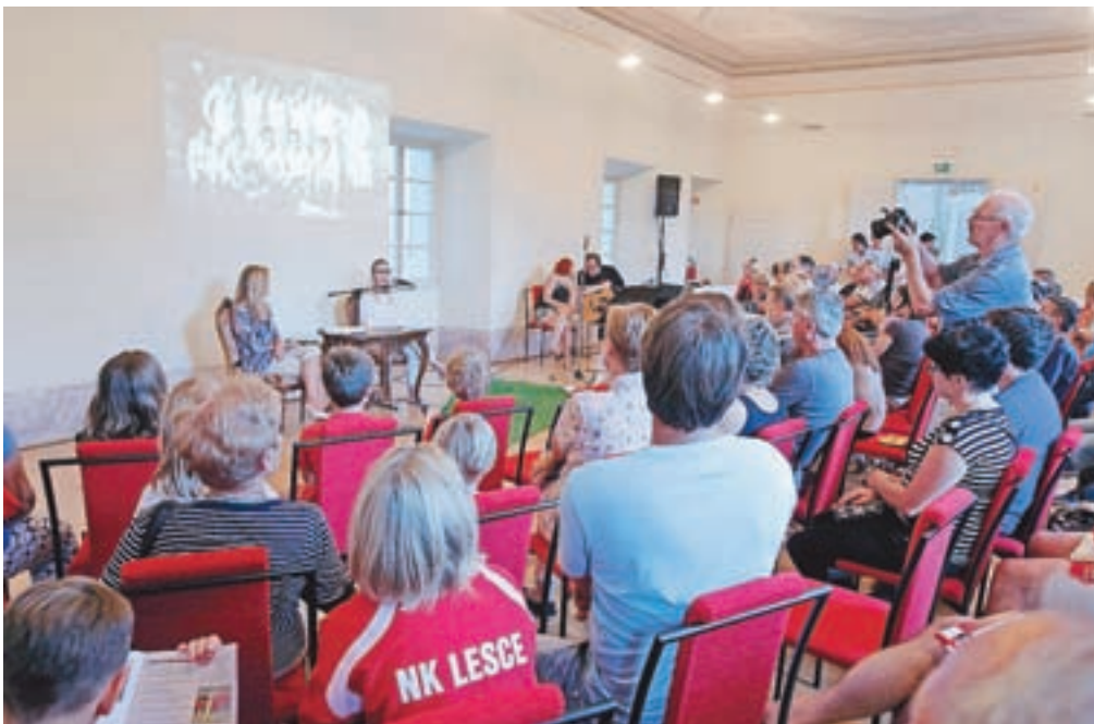
Zbornik so predstavili na muzejskem večeru.