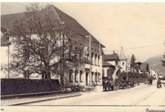
Gorenjska cesta med drugo svetovno vojno

miljeno posegel v zaključek Grajskega parka z glorieta, šolo so najprej nadzidali in ji kasneje dodali zunanje stopnice, vile in gasilski dom pa so dobile prizidke iz betona, stekla in lesa v skladu s sočasno spomeniško doktrino, da morajo biti posegi na dediščini jasno berljivi. Najbolj nesrečna je rekonstrukcija Slivnikove vile ob Čebelici. Namesto da bi zaradi nove namembnosti zgradili kvalitetno novo