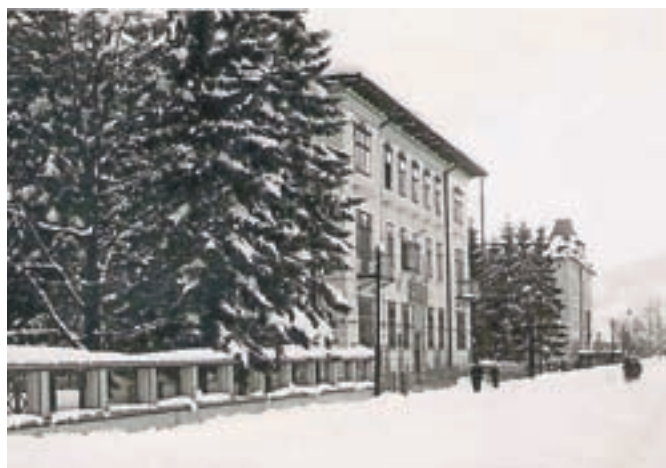
Čebelica Cirila Kocha okoli leta 1940