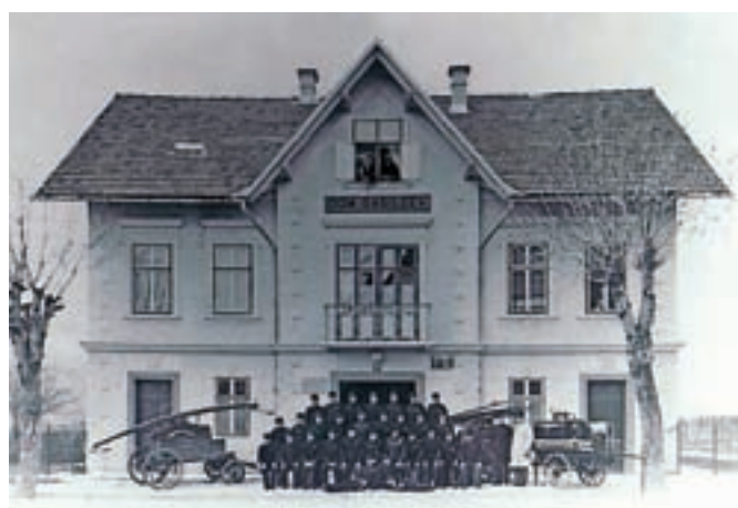
Gasilski dom