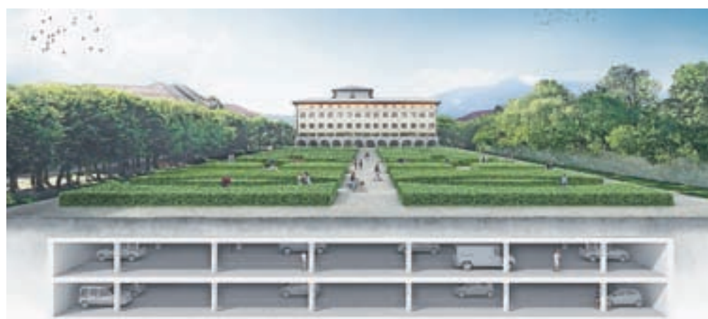
Pogled na preurejen Grajski park z garažo pod njim