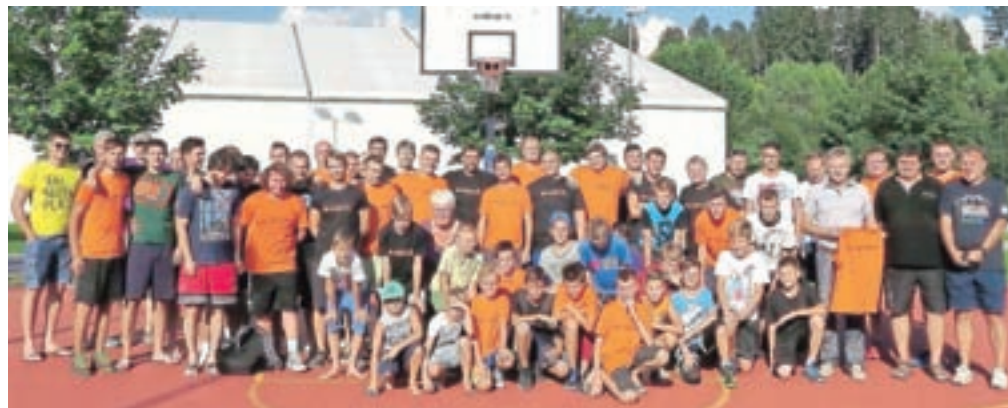
Skupinska slika različnih generacij

Vse se je začelo ob devetih zjutraj, ko je bila na sporedu prva tekma, ko je med seboj igrala selekcija U-11. Sledile so tekme selekcije U-13, U-15, U-17 in U-19, U-20, U-40, U-50 in U-60. Rezultat se je