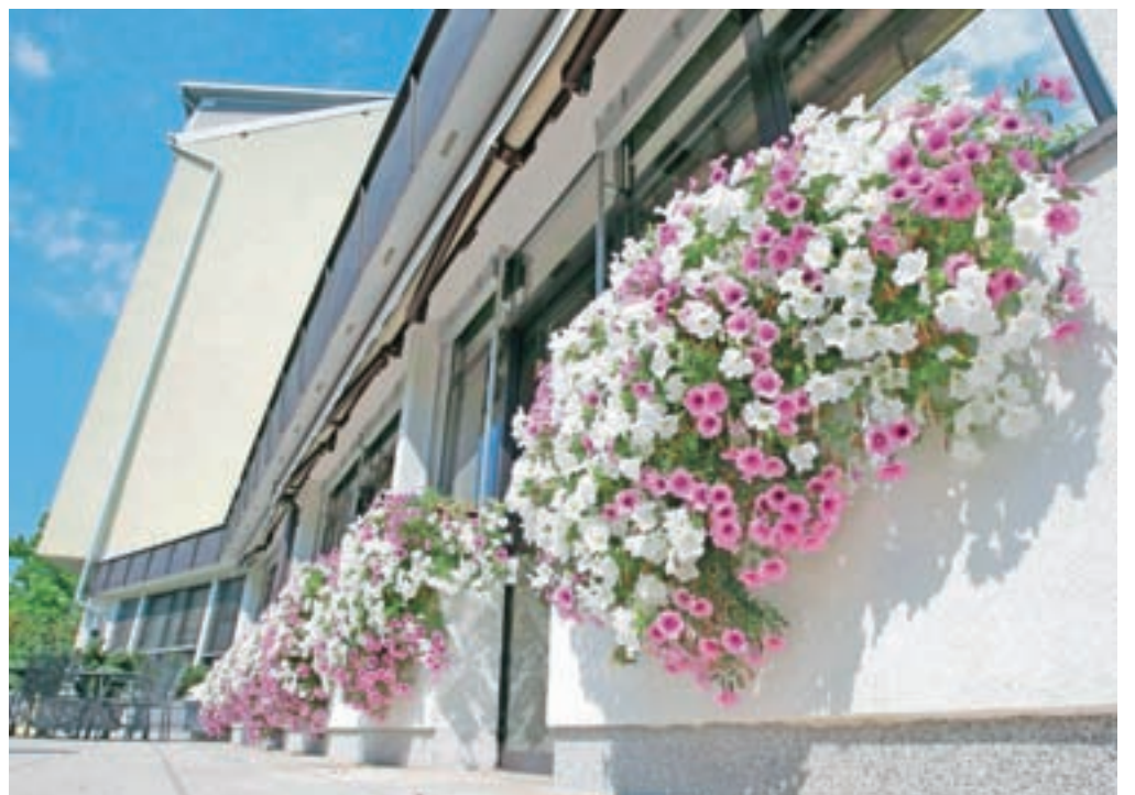
V Domu dr. Janka Benedika imajo na oknih čudovite rože.

stanovalci. "Videti je, kot da zračimo posteljnino – samo lepo belo in rdeče cvetje," je šaljivo dejala gospa Jug, in dodala: "Taka, kakršno je cvetje na oknih, je tudi naša posteljnina v domskih sobah."