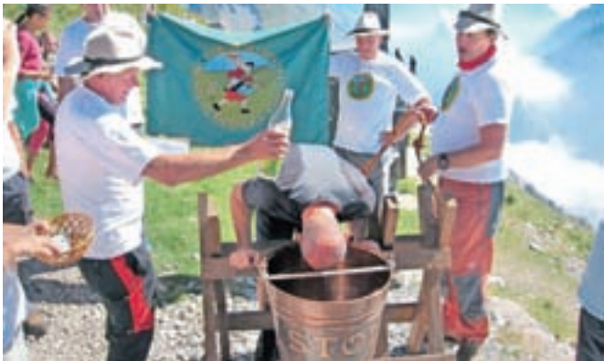
Tradicionalni krst novih prejemnikov zakramenta večne mladosti se je letos ponovil kar dvanajstkrat.

Radovljica – Pohodnike je na letošnjem tradicionalnem, že 42. pohodu večno mladih fantov na Stol spre-