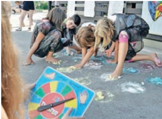
Utrinek s poletne kamp avanture

Udeleževali so se različnih ustvarjalnih in drugih delavnic, igrali softball v Begunjah, v organizaciji Softball akademije, in zadnje počitniške dni uživali v Kamp Avanturi. V Kamri so jim