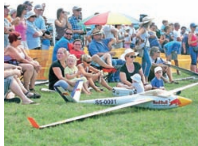
Dogodek je tudi tokrat na letališče privabil številne ljubitelje letalskih modelov. Udeležencev modelarjev je bilo štirideset.