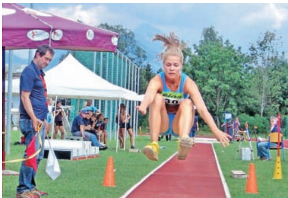
Fotonatečaj: Dogodki v občini Radovljica 2015, Leti, leti, avtor Matjaž Klemenc, diploma

Na stojnici turističnega društva se bo mogoče prijaviti na izlet Neandertalčevo glasbilo na poti k »laufarjem«, živemu srebru in čipkam, ki bo v soboto, 8. oktobra, in na ustvarjalne delavnice ročnih spretnosti.