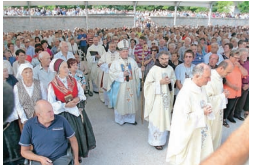
Več tisoč romarjev se je udeležilo slovesne maše na Brezjah, ki jo je daroval ljubljanski nadškof metropolit Stanislav Zore.

"Dokler bomo spreminjali svet, ki je tam daleč, dokler bomo govorili samo o tem, kakšen je naš sosed, toliko časa se nikjer ne bo nič spremenilo. Vsak človek, ki želi spremeniti svet, se mora najprej vprašati, kaj je pripravljen narediti sam."