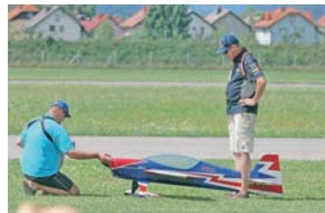
Tako kot se med seboj po izkušnosti in znanju razlikujejo modelarji, se razlikujejo tudi modeli.