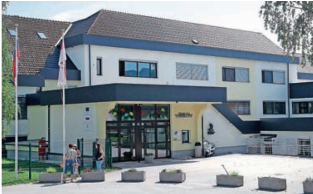
Med večjimi investicijami pred začetkom novega šolskega leta sta zamenjava dotrajane strešne kritine na Osnovni šoli F. S. Finžgarja in namestitev invalidske ploščadi v Osnovni šoli A. T. Linhartar Radovljica.

Tudi v osnovnih šolah so med počitnicami izvajali vzdrževalna dela, med večjimi so zamenjava dotrajane strešne kritine na OŠ F. S. Finžgarja Lesce. S tem je bil konec avgusta zaključen projekt celovite obnove Osnovne šole Frana Saleškega Finžgarja Lesce, ki jo bo v tem šolskem letu obiskovalo 387 učencev. V letih 2014 in 2015 je bila izvede-