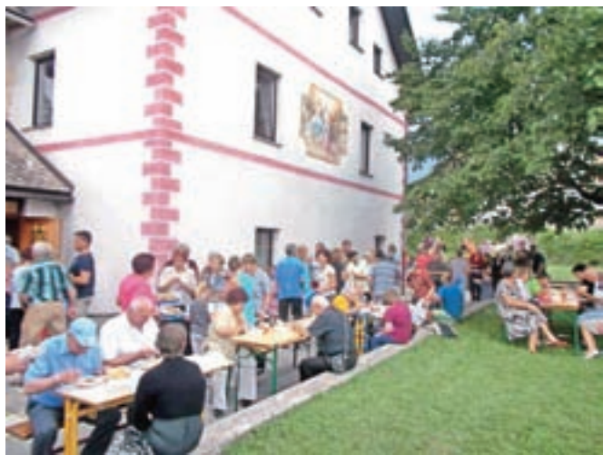
Na veliki šmaren je bilo v Lescah še posebno praznično.