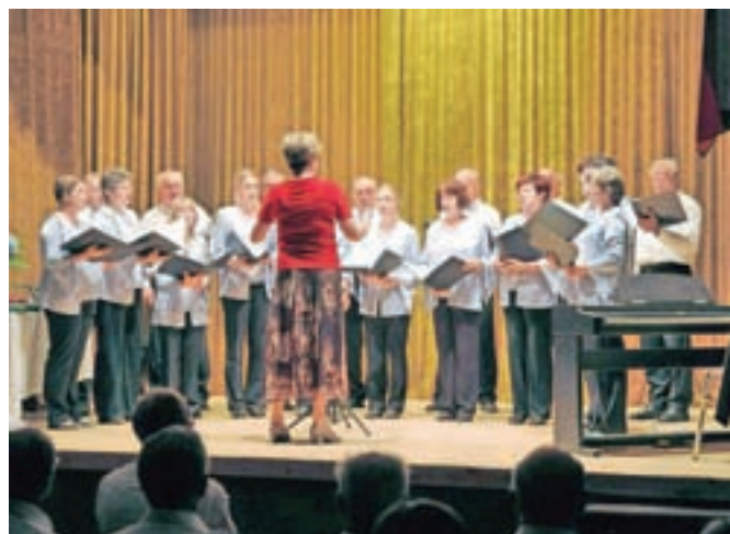
Ob krajevnem prazniku so v Ljubnem pripravili lep kulturni program.