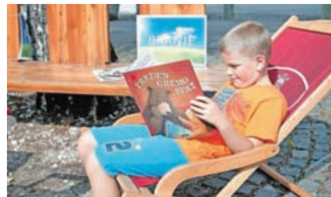
Jesen prinaša v radovljiško knjižnico raznoliko in zanimivo dogajanje.