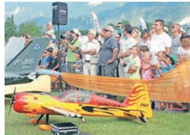
Vreme je bilo letos naklonjeno obojim, modelarjem in gledalcem, ki so uživali v pogledu na podvige.