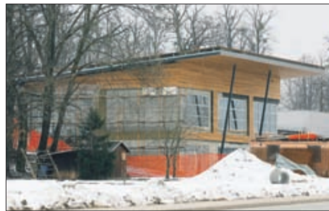
Čebelarski razvojno izobraževalni center Gorenjske bo predvidoma odprt septembra letos.

tacijo za notranjo pohištveno in tehnološko opremo, postopek izvedbe javnega naročila za izbor dobavitelja opreme pa bo izveden takoj po sprejemu proračuna za leto 2011. Milijon evrov, torej večino sredstev za izvedbo projekta, katerega vrednost je ocenjena na 1,2 milijona evrov, bo zagotovljenih iz Evropskega sklada za regionalni razvoj, projekt pa podpirajo tudi vse gorenjske občine, Čebelarska zveza Gorenjske in Čebelarsko društvo Radovljica.