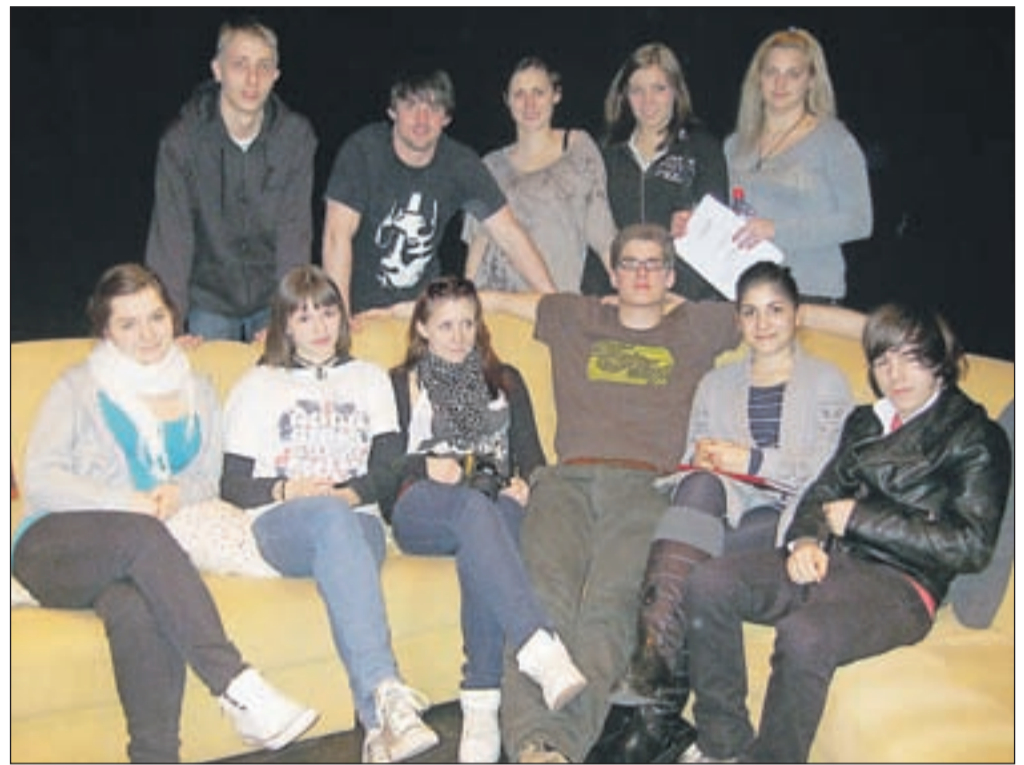
Učenci Ekonomske gimnazije in Srednje šole Radovljica uprizorili radoživo in gledljivo predstavo francoske klasike Molierovega Tartuffa v moderni preobleki.

Kako pa ti je uspelo za delo navdušiti igralce? Vlog je