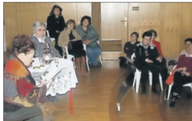
Poln avditorij in zadovoljni poslušalci v radovljiški knjižnici.

po dokončani AGRFT postane član ljubljanske Drame. Knjigo odlikujejo klenci opisi sorodnikov in sodobnikov, dramaturgija dogodkov in prepričljivi orisi nekaterih prizorišč, posebno jame Pekel, šlafjanja na prisilni prevzgoji za bodoče nemške vojake, s katerega ga preprosto odpelje babica, Maribora med bombardiranjem in prijateljskih vezi ob tajnem izdajanju gimnazijskega časopisa Iskanja. Spominjarije so branje, ki bralca navduši z iskrenostjo, barvitostjo, s pretanjenim opazanjem detajlov in prikritim humorjem, skratka knjiga, ki jo preberemo na dušek.