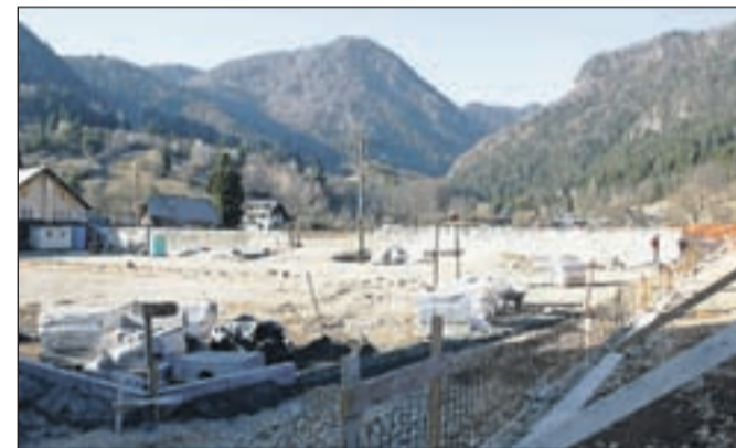
Na cesti proti Krpinu občina sodeluje s sočasno gradnjo vodovoda in fekalnega kanala.

"V Mošnjah smo v okviru del po vodni ujmi lani izvedli sanacijo plazu; na lokaciji v neposredni bližini je prišlo pozimi do dodatnega plazanja, zato trenutno tudi na tem manjšem plazu izva-