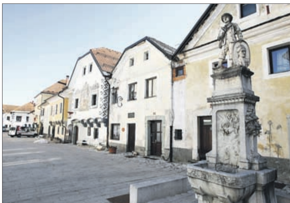
Hvaležni meščani so ji 1908 postavili spomenik v obliki vodnjaka na Linhartovem trgu, kamor zre s kamnitega medaljona, ki ga drži v rokah šolarček.