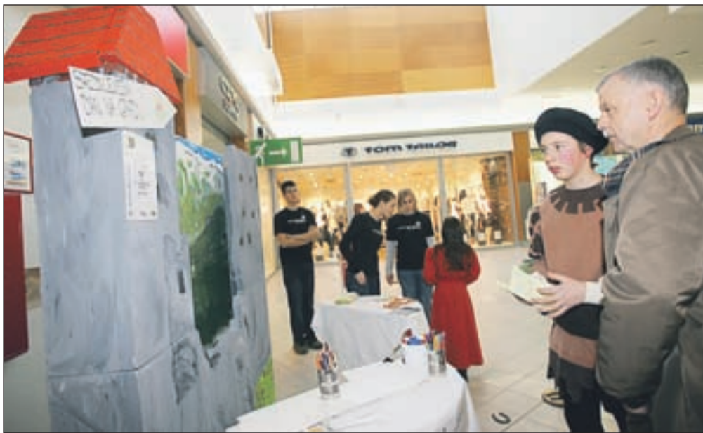
Učenci iz Lesc so izdelali stojnico v obliki makete gradu, obiskovalcem pa so ponudili metanje podkev, izdelovanje mečev, prikazali so mečevanje...