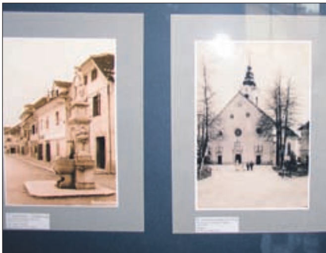
Radovljica, kot jo vidi fotograf Adi Fink

"Takoj po drugi svetovni vojni sem bil tu kot vojak in sem se želel vrniti. Prvi kruh mi je dala jeseniška železarna, obenem pa sem spoznal jeseniške prijatelje fotografije in ljubitelje gora. V Radovljici sem leta 1947 pomagal ustanoviti Foto kino klub in pomagal spravljati v življenje društva Ljudske tehnike na Gorenjskem."