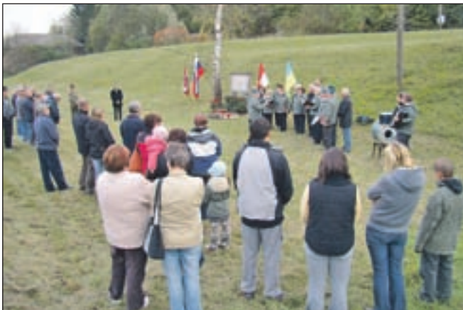
Udeleženci proslave pred spomenikom