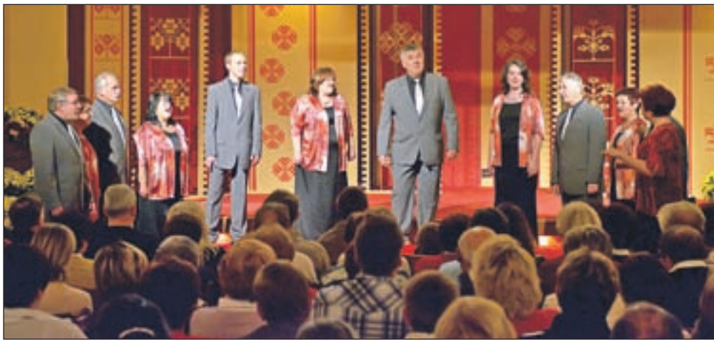
Mešani pevski zbor dr. France Prešeren Žirovnica-Breznica