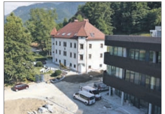
Otvoritev prenovljenega kompleksa bo konec meseca.