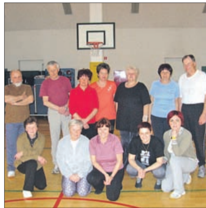
V skupini je tudi telovadba prijetnejša.

Telovadni skupini se lahko pridružite po navodilu zdravnika, lahko pa se tudi samoiniciativno pozanimajte na društvu v Kranju, ki ima uradne ure ob sredah (tel. 031/742-278).