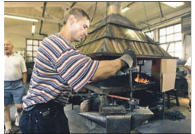
Kovači danes: tudi v kroparskem Uku so v soboto pripravili dan odprtih vrat.