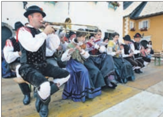
Na letošnjem Kovaškem šmarnu je nastopila tudi Godba iz Gorij.