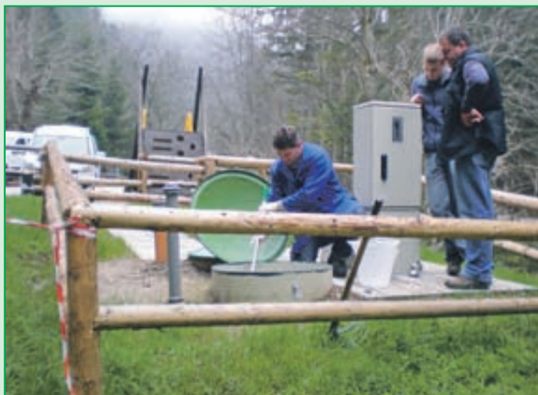
Čiščenje in odvoz blata MKČN OŠ Ovsišče