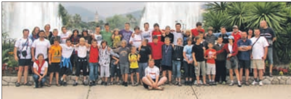
Udeleženci turnirja Granolleres cup 2009