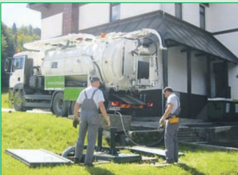
Izvedba prvih meritev MKČN Gostišče Draga