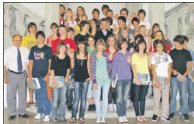
Priznanje in knjižno nagrado prejelo 40 učencev iz treh radovljiških osnovnih šol: A. T. Linharta Radovljica, F. S. Finžgarja Lesce in OŠ Staneta Žagarja Lipnica.