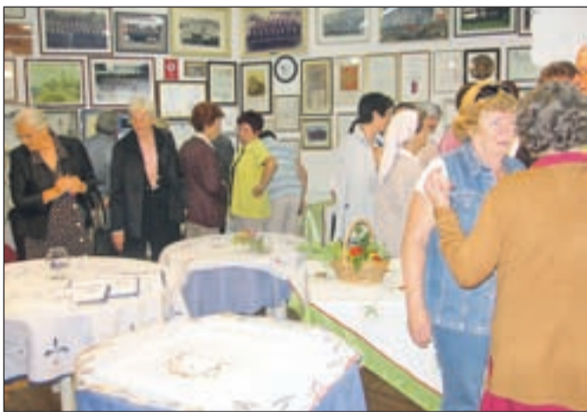
Utrinek z razstave