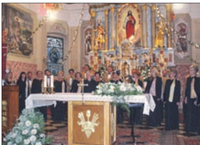
Mešani pevski zbor Valovi

izvajanja skladb, vendar je jasno tudi to, da v petju in druženju vsi uživajo, saj sicer ne bi dosegali takih uspehov. Imajo namreč pomemben delež v kulturnem dogajanju v radovljiški in blejski občini, nastopajo pa tudi drugod. Če jih ne bo zadržala recesija, se bodo jeseni odpravili celo na Japonsko, kjer bodo vrnili obisk pevkam iz zbora Yume-fusen, ki so jih gostili lani. Na koncertu so se izkazali tudi s tankočutnim izborom pesmi. Glasba je posebna lepota, skrita in skromna čaka, da jo odkrijemo, se ji posvetimo, da z njo vsaj včasih nadomestimo blaznost časa, ki ga živimo. Ali kakor je rekla povezovalka koncerta: "Pesem človeka dviga in mu veselje daje, Bogu pa čast in slavo poje."