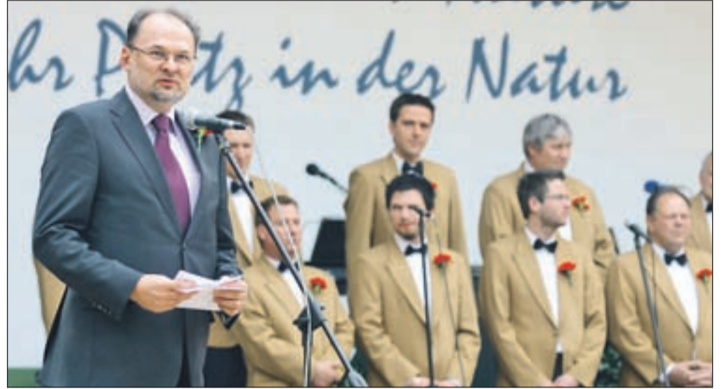
Slavnostni govornik, evropski poslanec Jelko Kacin

Po njegovem bomo krizo najhitreje rešili skupaj z drugimi evropskimi državami, z usklajenim, pravočasnim in odločnim delovanjem: "Naša prva in glavna skrb morajo biti nova, kvalitetna delovna mesta in podjetja, ki zaposlujejo na novo. Podpirati moramo ambiciozna mala in srednja podjetja, ki lahko pomagajo, da čim prej splezamo iz trenutne gospodarske krize. Spodbuda najboljšim podjetnikom in pomoč države pri črpanju sredstev iz EU je najhitrejša pot do svežega denarja za naložbe v prihodnost."