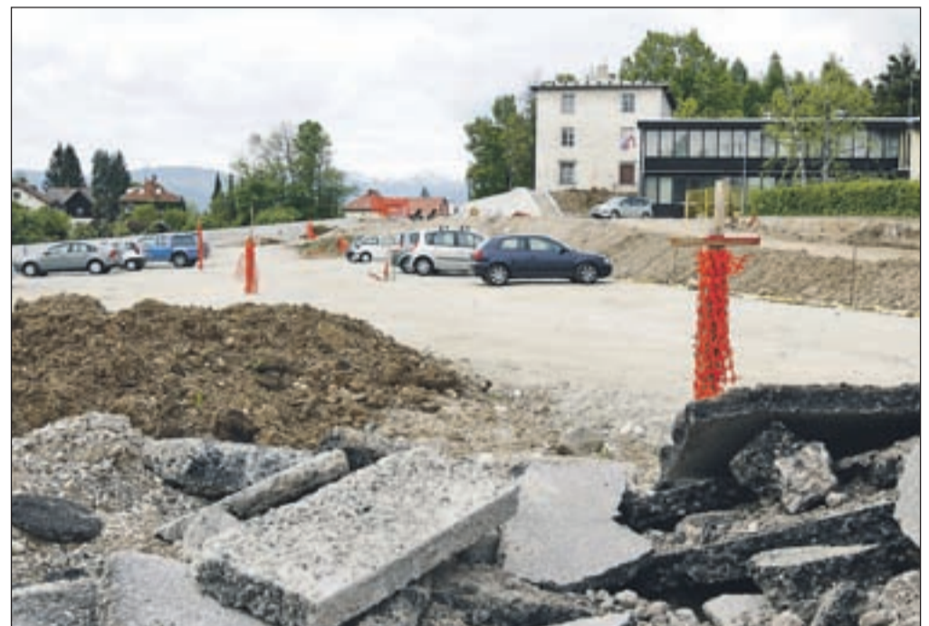
Novo cestne povezave nastajajo tudi na območju bodočega Vurnikovega trga.

V sklopu prilagoditev lokalnih cest na avtocestno omrežje je marca občina dokončala razširitev cestišča na 150-metrskem odseku Begunjske ceste v Lescah. Izvedeni prilagoditvi pripadajočega priključka ceste, obnovi pločnika in vodovoda bo sledila izvedba talne signalizacije ter prehoda za pešce. Obnovo sofinancirata občina in Strabag, d. o. o., kot eden od izvajalcev na zgrajeni avtocesti Vrba-Peračica. Družba DARS pa v sklopu izgradnje avtocestnega odseka Vrba-Peračica razgrajuje ostanek hitre ceste na odseku priključek Brezje-viadukt Peračica. "Nivojska ureditev priključne ceste za Brezje je