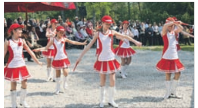
Nastopila je tudi mažoretna skupina OŠ A. T. Linhartarja.