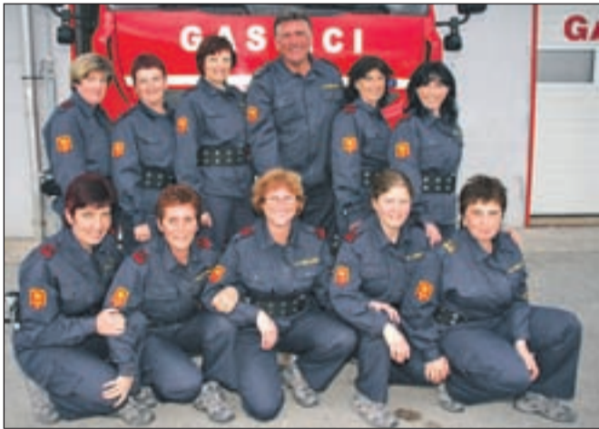
Desetčlanska ekipa gasilk iz Begunj julija odhaja na gasilsko olimpiado na Češko.