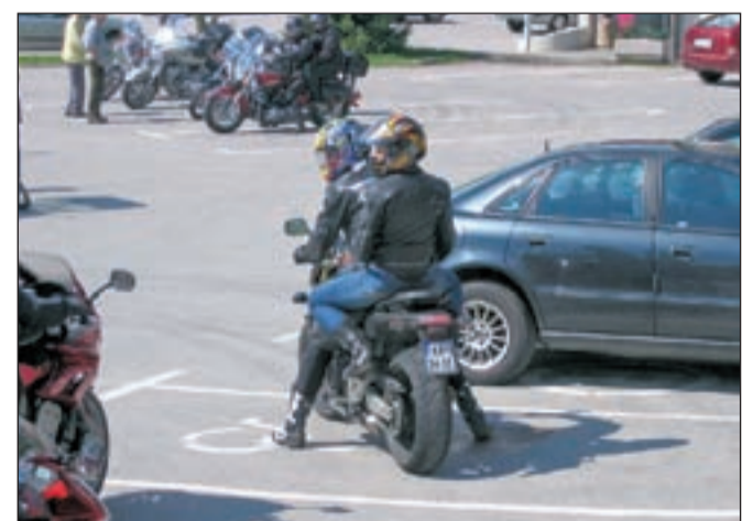
Policisti svetujejo posebno previdnost predvsem v prvih vožnjah v sezoni.