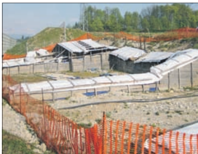
Domačini želijo čimprejšnje možnosti za predstavitev arheološke najdbe, po kateri so Mošnje postale prepoznavne.