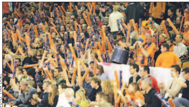
Lani so gledalci v Tivoliju pripomogli k odličnem vzdušju, tudi letos pa odbojkarji pričakujejo njihovo podporo.

Odbojkarji ACH Volleyja, ki so minuli torek odigrali prvo letošnjo tekmo v ligi prvakov ter na gostovanju pri favoriziranem Trentinu Volley izgubili s 3:0, bodo prvo tekmo na domačem igrišču odigrali ta torek. "Domače" igrišče pa v ligi prvakov zanje ni radovljjska dvorana, kot je to v srednjeevropski ligi, ampak dvorana Tivoli, ki je primerna za nastopanje v najmočnejšem evropskem odbojarskem tekmovanju. V njej prvaki v torek ob 20.15 pričakujejo moštvo Aon hot Volleys. Vstopnice za tekmo so že v prodaji. Za posameznike so 5 evrov, za skupine nad deset 1 evro na osebo, tradicionalno pa bo organiziran tudi prevoz z Gorenjskega. V. S.