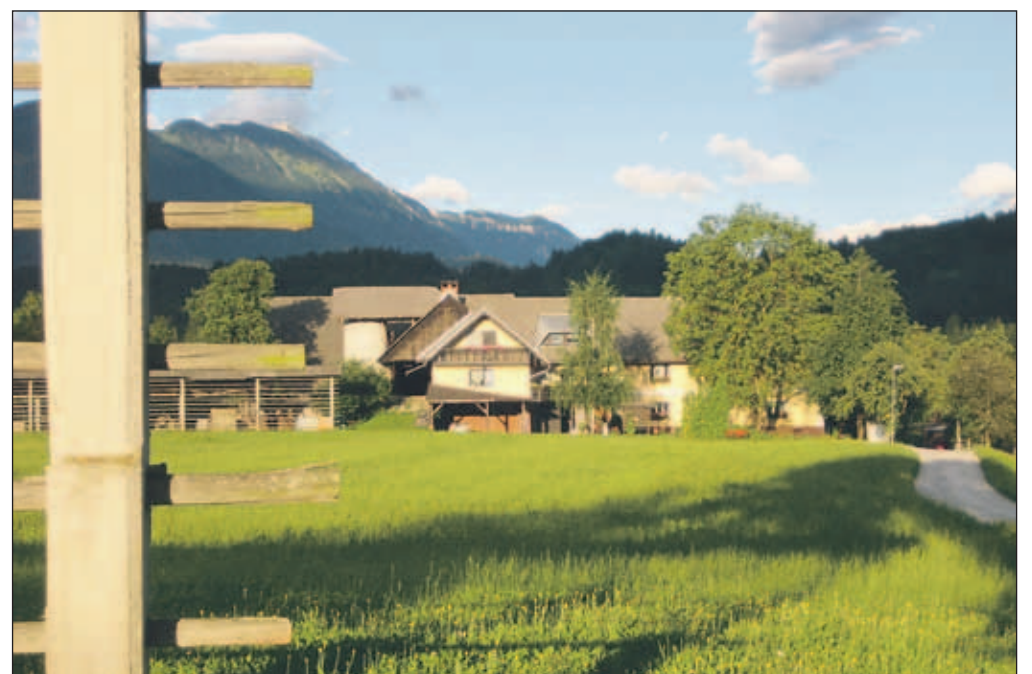
V idilični Peračici je devet domačij. Okoliški gozdovi pa tudi njive so še kako privlačni tudi za divje svinje, ki jih domačini tod redno srečujejo.