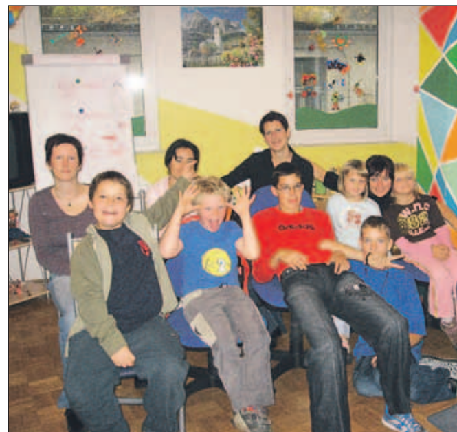
Na eni od delavnic je nastala tudi tale fotografija.