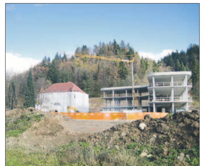
Nastajajoči kompleks Renesansa v Dvorski vasi