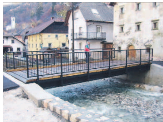
Koruzni most je že v uporabi.