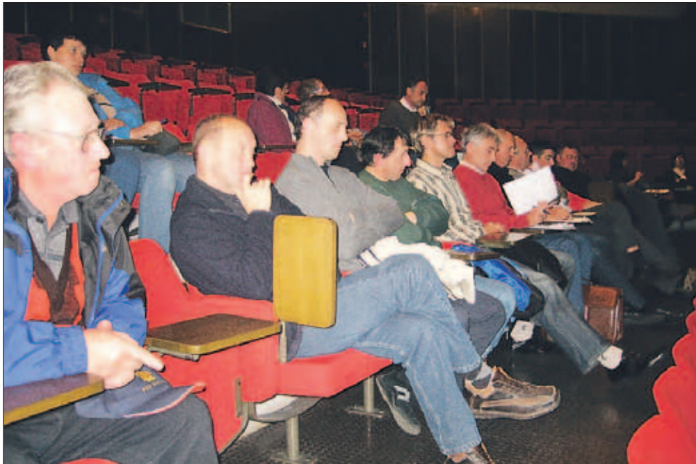
Investitor je projekt tik pred prazniki predstavil tudi domačinom.