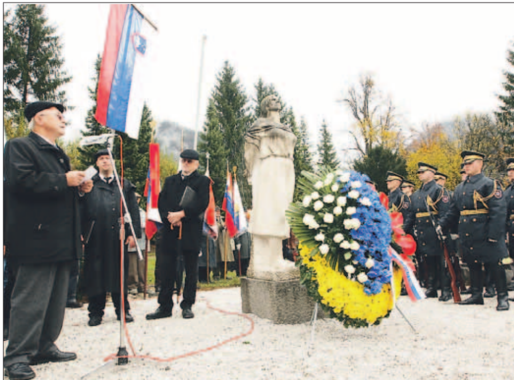
Spominska slovesnost v Begunjah