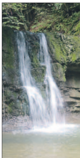
Slap Peračica je ena od številnih naravnih znamenitosti bogate in dobro ohranjene doline.