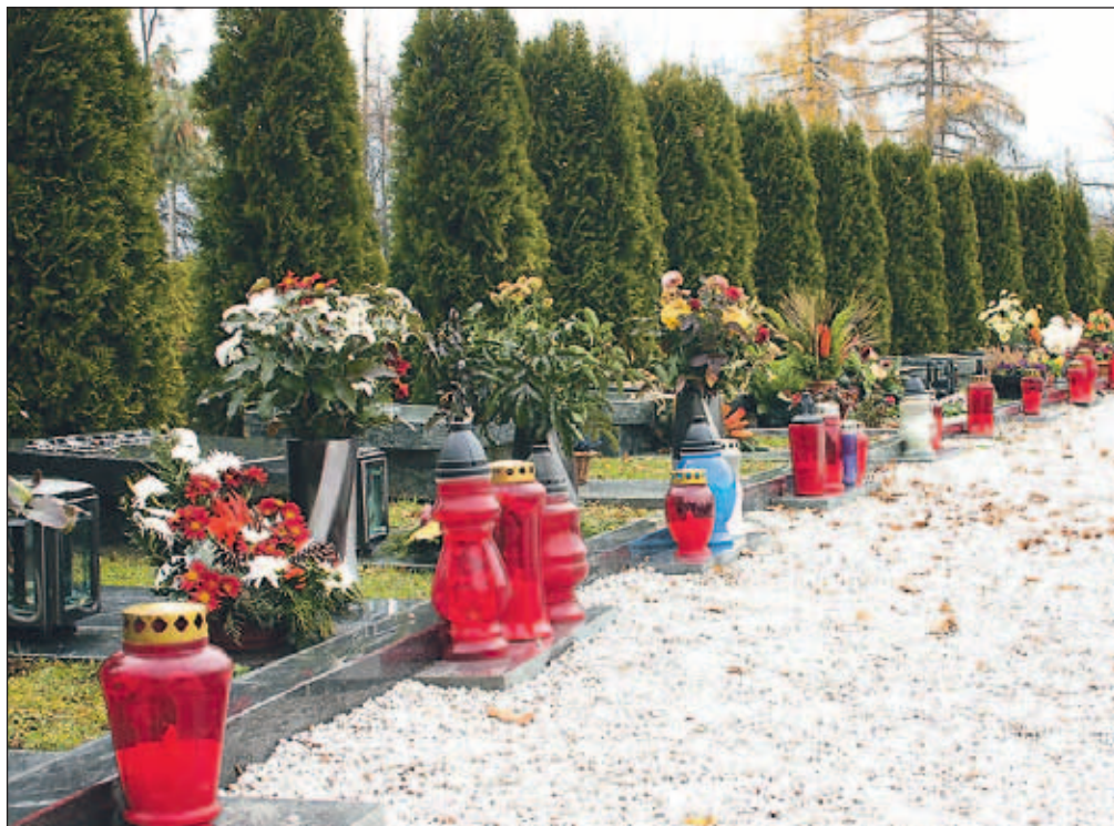
Prvi november na radovljiškem pokopališču