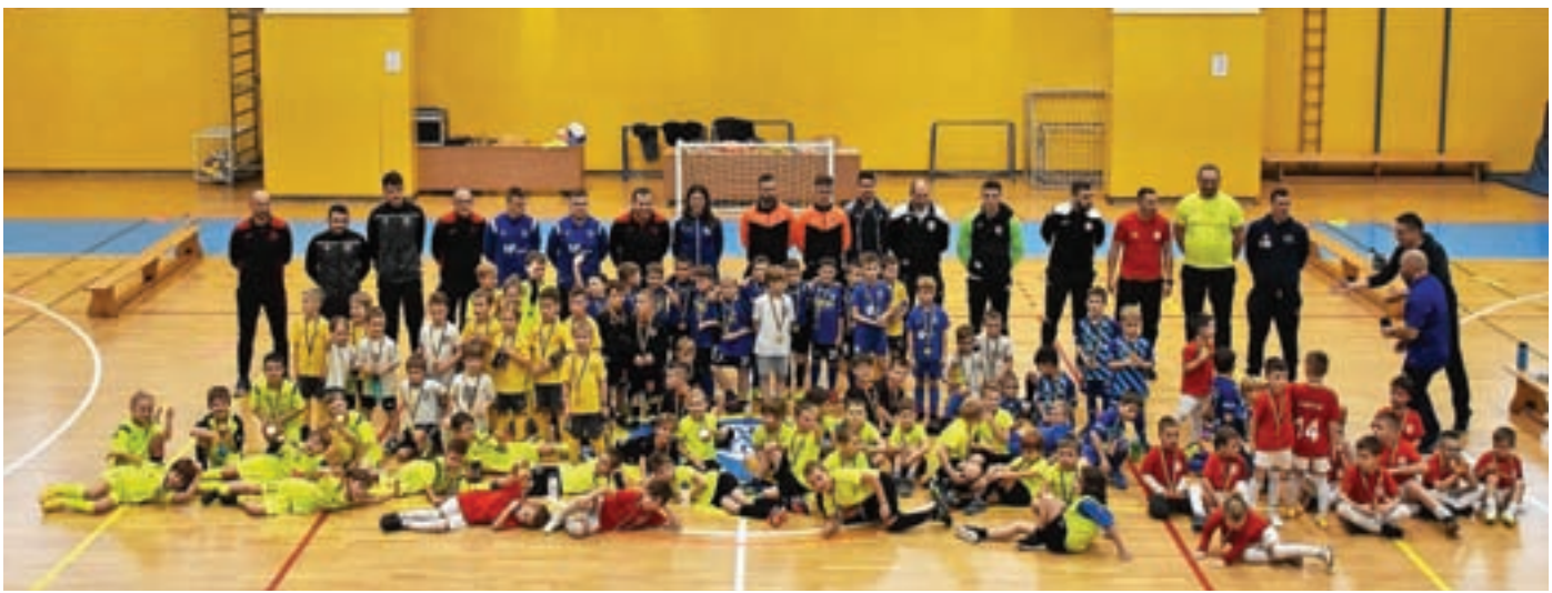
Podelitev priznanj v kategoriji U7