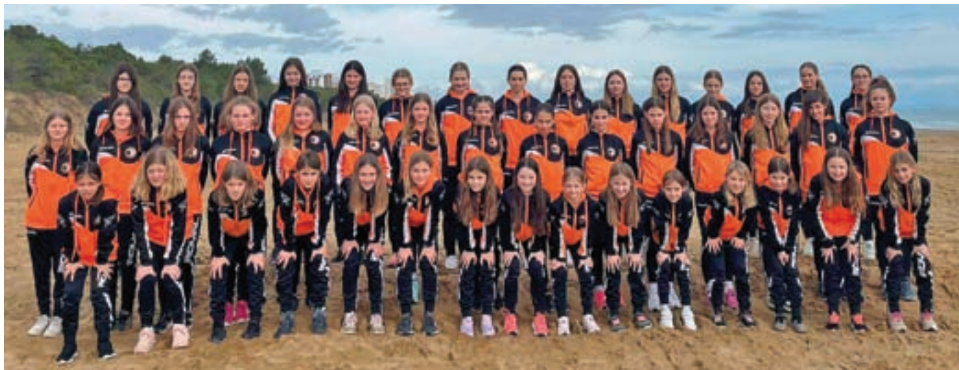
Mlajše nogometašice ŽNK Cerklje