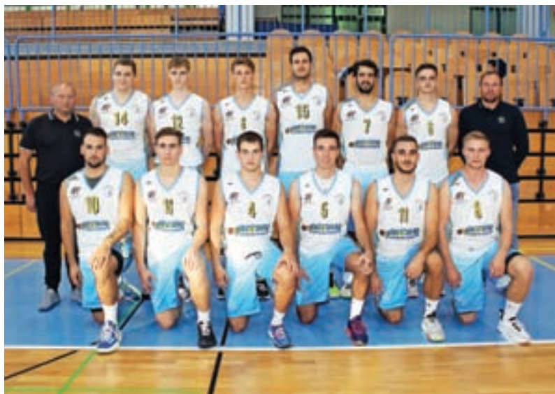
Članska ekipa ŠD Krvavec