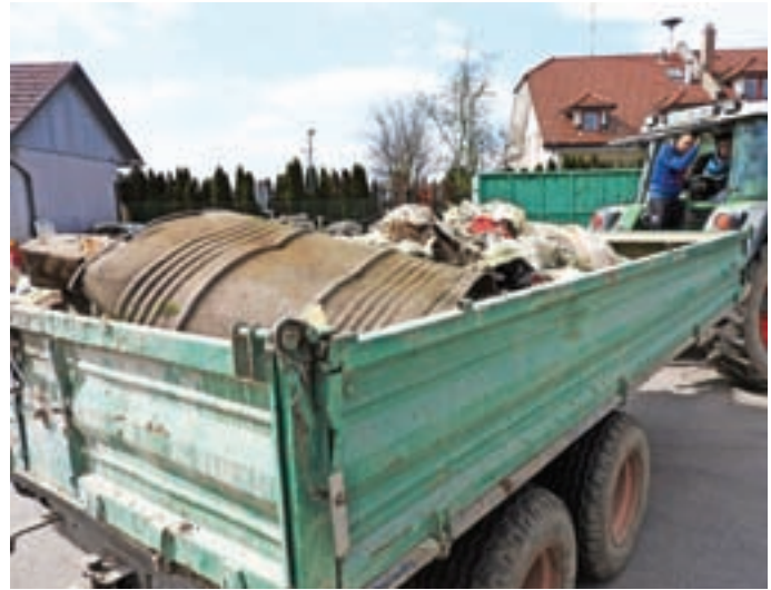
Udeleženci čistilne akcije so našli najrazličnejše odpadke.

V soboto, 23. marca, je bila v cerkljanski občini tradicionalna spomladanska čistilna akcija, ki jo Občina pripravlja v sodelovanju z vaškimi skupnostmi, Osnovno šolo Davorina Jenka, društvi, organizacijami in drugimi. Organizirana je z namenom, da se odstrani čim več v naravo odloženih odpadkov, letos tudi tistih, ki so ob vodotokih ostali po lanskih poplavih. Kar 550 občanov je tokrat urejalo okolje in tako prispevalo tudi k ozaveščanju ter kakovosti življenja. Udeleženci akcije ugotavljajo, da je odpadkov po gozdovih iz leta v leto manj, kar je zagotovo pozitivna sprememba. Bilo pa je opaziti, da nekateri še vedno odlagajo predvsem manjše količine gradbenega materiala v gozdove. Nekaj več odpadkov so tudi letos v zbirni center v Cerkljah pripeljali gasilci s Šenturške Gore, ki so pobirali napolnjene vreče ob cesti na Krvavec. Skupno je bilo v čistilni akciji zbranih 18 kubičnih metrov odpadkov.