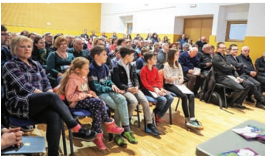
Simpozij je privabil obiskovalce od blizu in daleč.