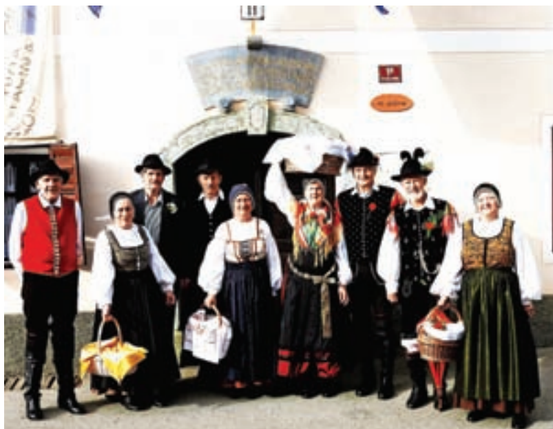
Pred odhodom z Borštnikove domačije