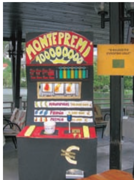
S knjigo po Evropi