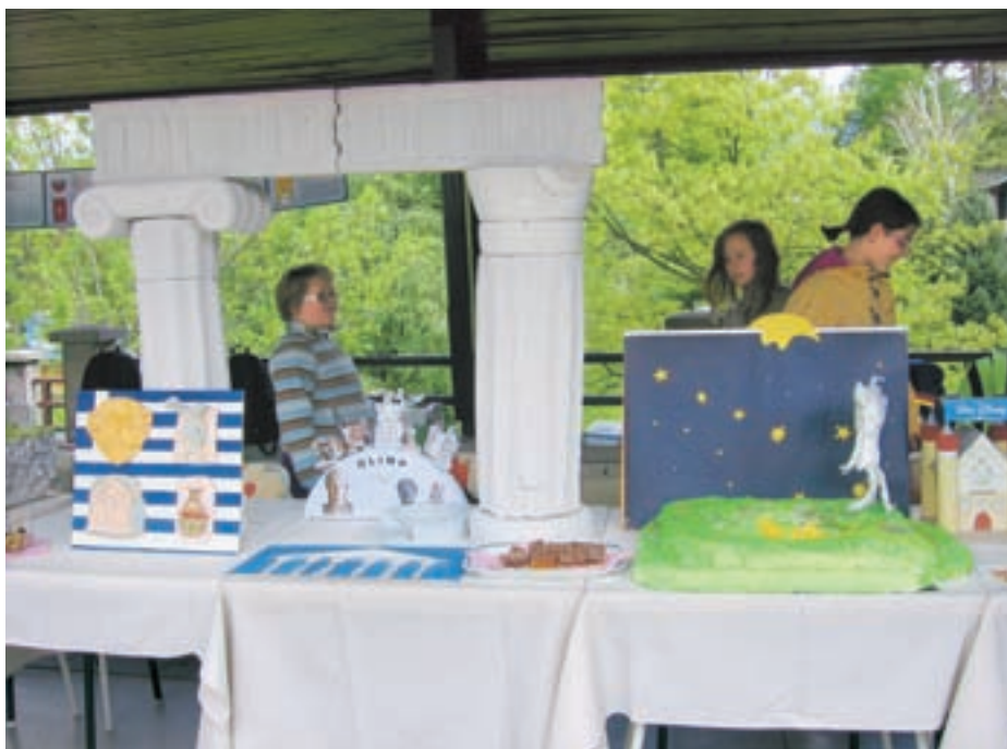
Stara Grčija v živo

predstavimo kakšnega uspešnega avtorja del za odrasle." O projektu so pripravili tudi posebno "bibliofilsko" uro, ki so se je udeležili najmlajši in tudi na ta način spoznavali EU.