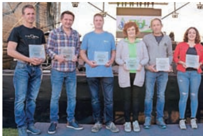
Prvi prejemniki certifikata Predoslje 100% lokalno