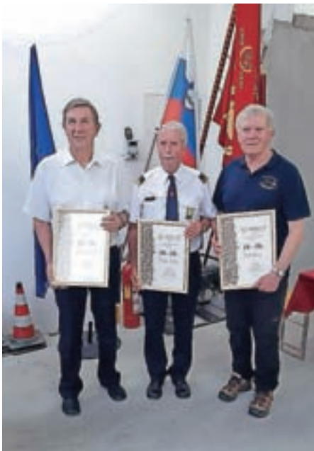
Častni člani društva

V letu 2021 smo predoški gasilci nadaljevali izobraževanja po programu Gasilske zveze Mestne občine Kranj in Gasilske zveze Slovenije. Uspelo nam je uspešno izvesti tudi kar nekaj internih strokovnih vaj, saj se zavedamo pomembnosti rednih in periodičnih usposabljanj operativnih gasilcev. Prav tako smo v prvi polovici leta začeli zbirati finančna sredstva