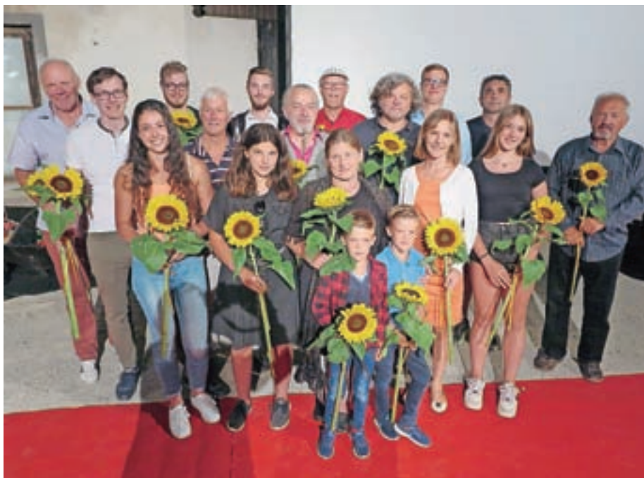
S premiere filma Deseti brat v Predosljah

Kljub temu da je bilo kulturno življenje v zadnjem času kar malce okrnjeno, pa nismo pozabili na tisto, kar šteje veliko, in tisto, na kar smo zelo ponosni – na medsebojno druženje in povezanost. V septembru smo se sreča-