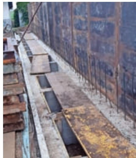
Dela na pokopališču

Krajevni praznik Naaaj dan je bil tudi letos izveden skupaj z večino delujočih društev na