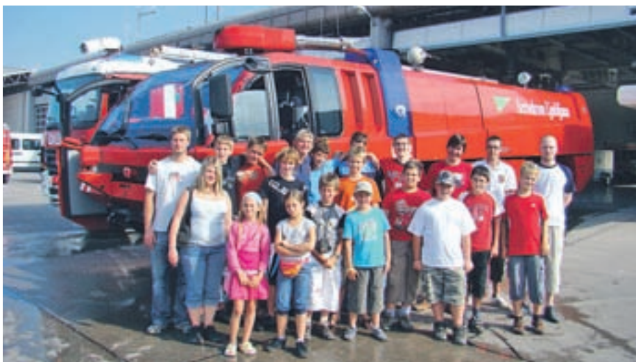
Na obisku pri gasilcih na letališču Jožeta Pučnika Ljubljana

Ob nešteto dejavnostih so bili spet uspešni na tekmovalnem področju. Konec avgusta so na tekmovanju za memorial Marjana Katrašnika dosegli tretje mesto. Septembra so se z dvema ekipama udeležili tekmovanja v spretnostni vožnji v Preddvoru, kjer so dosegli drugo in četrto mesto. Na tekmovanju članov za memorial Ernesta Lombarja ml. v Križah so člani A dosegli drugo mesto. Oktobra so se s tremi ekipami udeležili tekmovanja za memorial