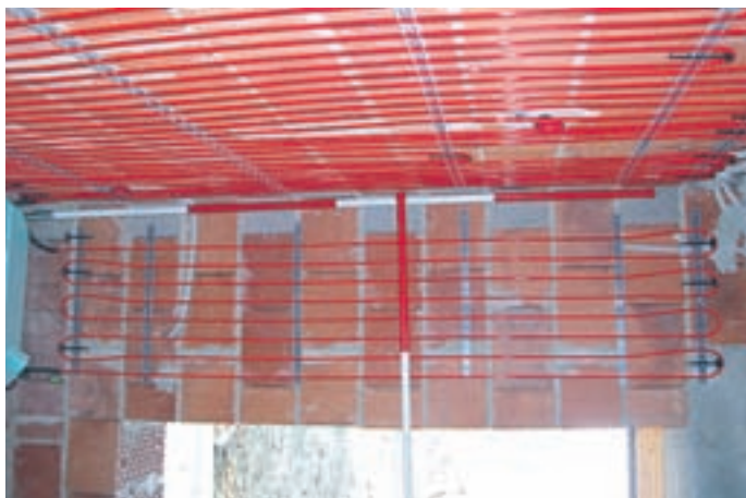
Fotografiranje s trasirkami