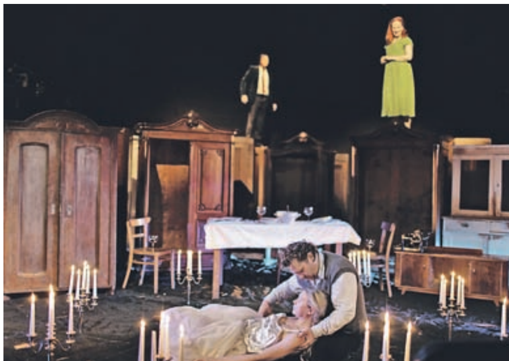
Utrinek iz predstave Steklena menažerija. Ja, dvorana kulturnega doma je te dni precej drugačna.