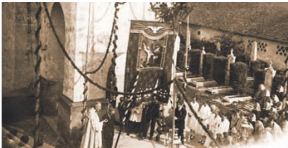
Žeganje bandere na Suhi