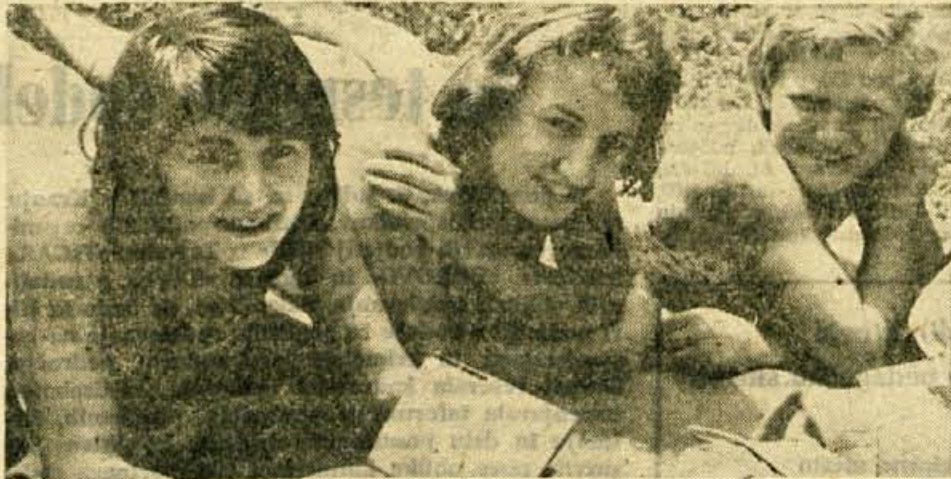
Iz Kamne gorice na Šobca peš — mar to ne pove dosti o privlačnosti tega kraja

Lepa propaganda! Sprašujemo se, kje jemljemo denar za plačevanje takih zastopnikov. — SIK