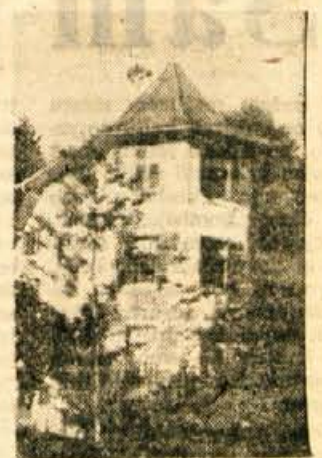
Pogled na del gradu

V letošnji sezoni so že začeli prihajati prvi gostje. Z agencijo Hotel Plan iz Holandije so sklenjene pogodbe za 45 ležišč za 155 dni. Vsakih 14 dni se menjajo skupine. Posamezne domače in tuje tura-