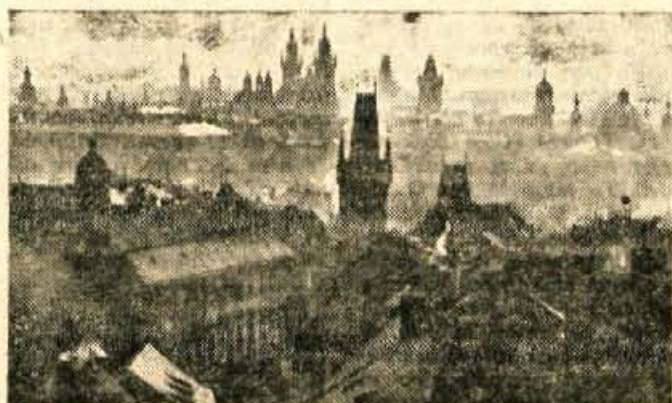
Pogled na Prago s Hradčani

Obiskovalci pa ne fotografirajo samo mostu, temveč tudi novo zanimivost — galebe in vse mogoče vodne ptice od labodov do rac. Tisoči teh letečih prebivalcev daljnih severnih vod letajo ob obali Vltave. Postala jim je prijeten dom, kakor je tudi Praga prijeten dom mnogim Čehom.