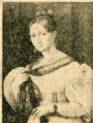
Doba Primčeve Julije

Razočaran zve na Dunaju, d a je že prestar za sprejem na akademijo. Vendar so mu dovolili, da se je kot izredni študent udeleževal pouka. To mu je omogočil naš slavni ro-