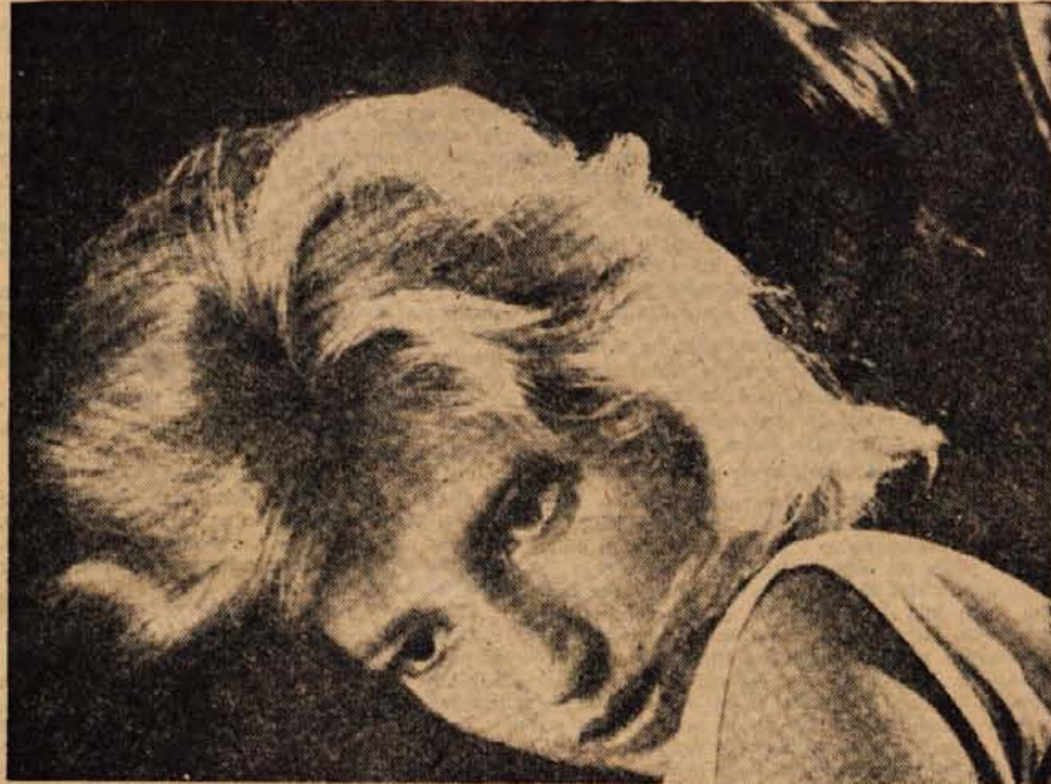
Monica Vitti je najbolj priljubljena igralka Michelangela Antonionija, s katerim je za zadnji beneški festival posnela izredno uspelo delo RDECA PUŠCAVA. Pri nas jo bomo srečali v prihodnjem tednu, ko bo na sporedu izredno delo tega dueta — MRK.

Omenjena dejstva so pripeljala italijanski film na slepi tir, s katerega se lahko reši samo, če odvrže šablone, ki so ga začele tesniti.