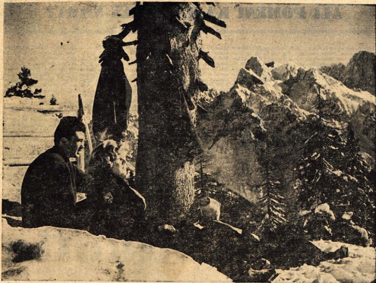
CAS SMUCANJA. SNEGA JE POVSOD DOVOLJ.