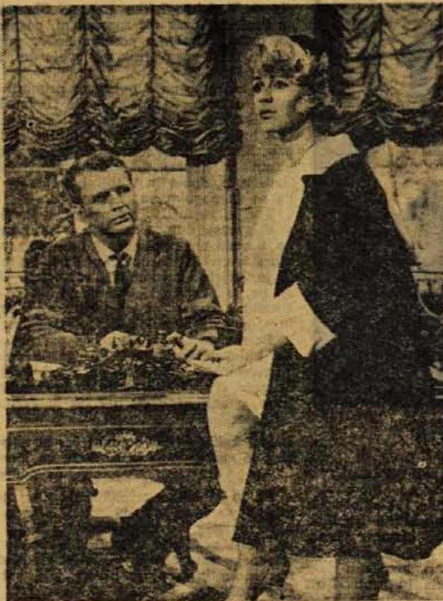
Bom našla moža in ob njem srečo?

Skušnje žena, ki si po oglasih iščejo moža