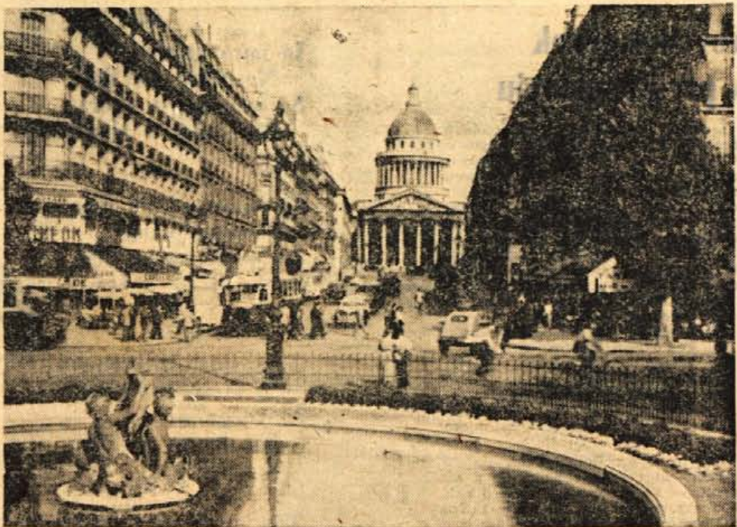
Skupni grob velikih mož Pantheona

Nihče pa ne more razrešiti neke uganke. Se vedno ležita bok ob boku krsti Jeanna-Jacquese Rousseauja in Voltaira, katerega posmrtno ostanke je pripeljalo do Panteona dvanajst belih vrancev. Ta pogreb je veljal 36.868 liber (star francoski kovanec). Toda ali sta oba velika filozofa še vedno tam, kamor so ju položili? Najverjetneje je, da sta njuni krsti prazni. Nekateri zatrjujejo, da roparji niso ajuj pepel razpršili na vse štiri strani sveta, marveč, da so ga spravili v vrečo in to odložili nekje na odprtem polju. Andre Billy dvomi v resničnost njunih po-