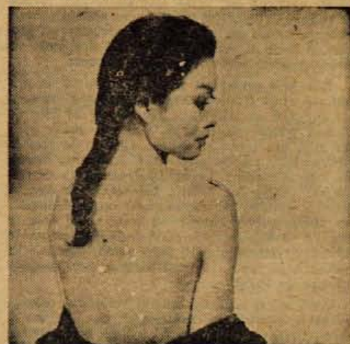
HLADNO POSMEHLJIVA (ti nebolgljeni možki!) IN MUHASTO NESTALNA — Nobu McCarthy (Hodi kot zmaj)