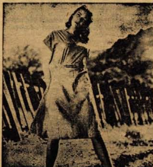
PRVOBITNA; DEVICA, LJUBICA IN MATI — samo del zemlje, kot rodovitna lepljiva prst pod njenimi nogami — Gene Tierney (Tobačna rot)