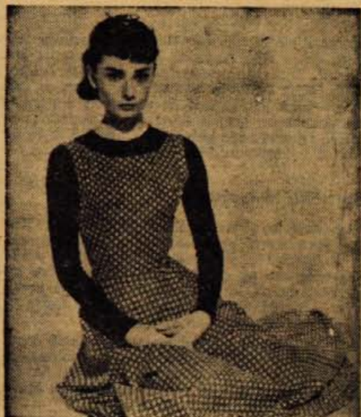
CISTI OTROK, A VENDAR — ŽENSKA, nežna, malce preplašena, toda vdano čakajoča — Audrey Hepburn