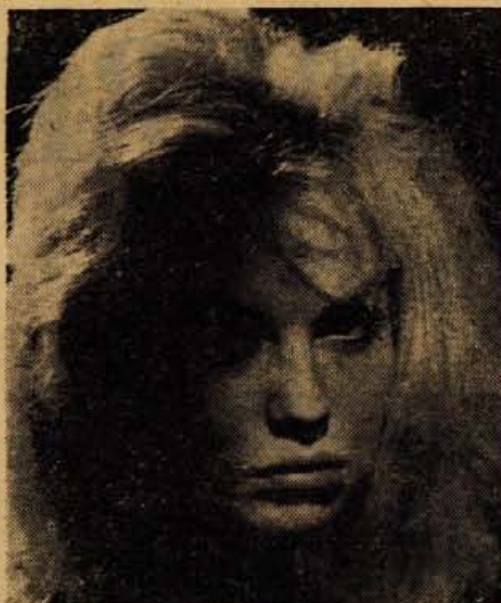
DIVJA, ŽEJNA KRVI, LEVINJA; obenem strastno sovraži in si strastno želi, iz ljubezni bi tudi ubijala — Mylène Demongeot