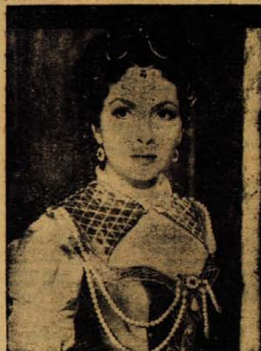
PREFINJENA, KOT SKRBNO IZBRUŠEN DRAGULJ, voščeno mehko telo odeto v šelesteča oblačila in iskriv romanski pogled — oba polna pasti in spletk — Gina Lollobrigida (Prekrižani meči)