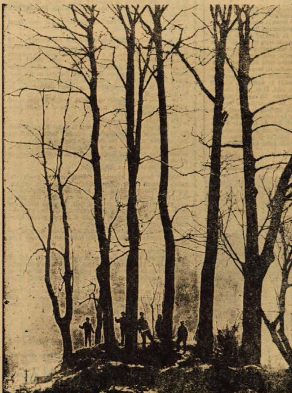
Kmalu bodo ozeleneli

NA OZEMLJU današnji Somalije živi dva in pol milijona prebivalcev. Ljudje se v glavnem, predvsem v no tranjosti dežele, nomadi. Na pol oblečeni pastirji vodijo svoje črede od pašnika do pašnika. Med njimi je velike število nepismenih. V zadnjem času zapažajo v dežel vedno več ameriških strokovnjakov. Dežela je bogata s velikih pridelkih banan. Z precej časa Somalijo imenujejo »deželo banan«. V zadnjih letih pa so ameriški strokovnjaki začeli raziskovati tudi naftna ležišča. Po sebnosti na severu so že našli petrolejska polja.