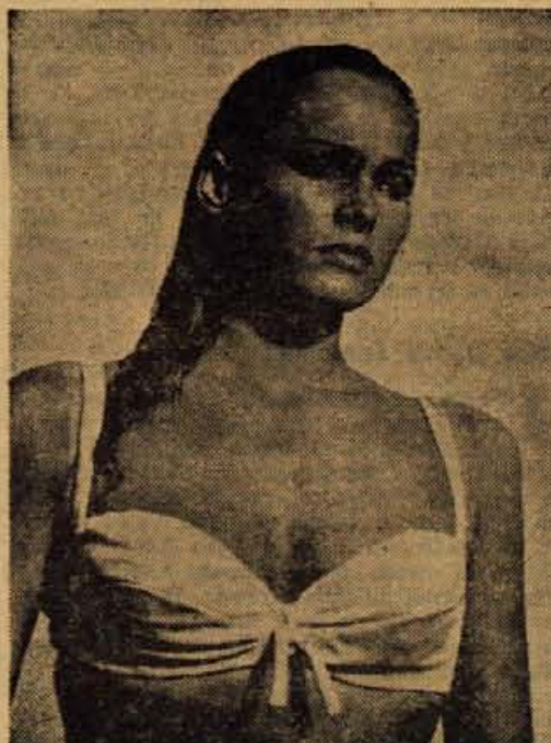
GROBO IZTESANA IZ ENEGA SAMEGA KOSA MESA, atletska postava in prusko trd pogled — Ursula Andress (Dr. No)