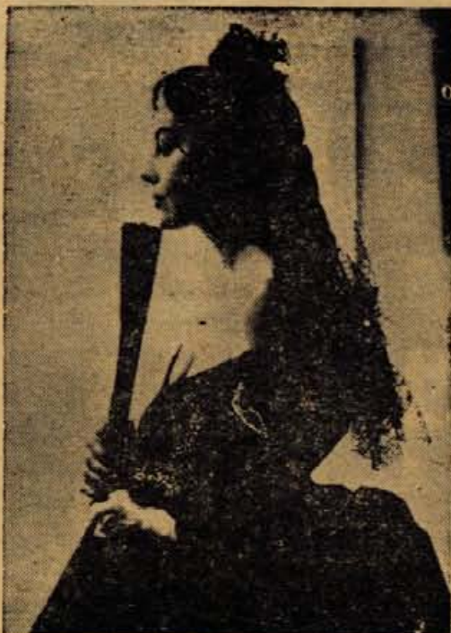
V NEDOSTOPNO ZALOST POTOPLJENA, TRAGICNA KRALJICA (toda, koliko vročega hrepenenja!) — Ava Gardner (Gola Maja)