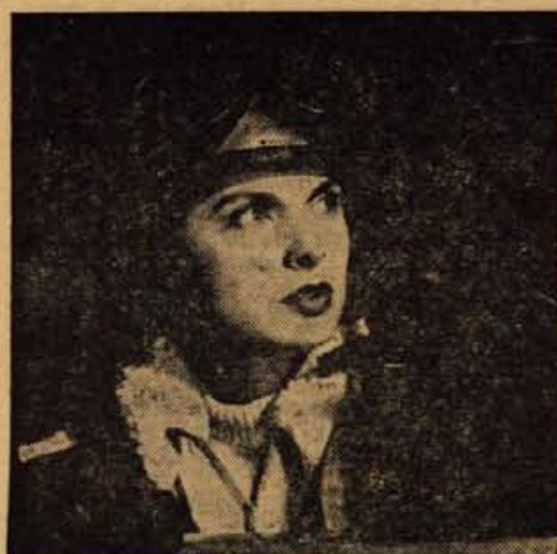
NEZNOPOLTI OTROK NAŠEGA ČASA, (skoraj brezspolna) Diana, preganjana od reaktivnih lovcev — Janet Leigh (Reaktivni pilot)