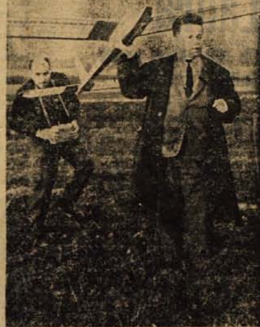
Tik pred startom jadranege modela