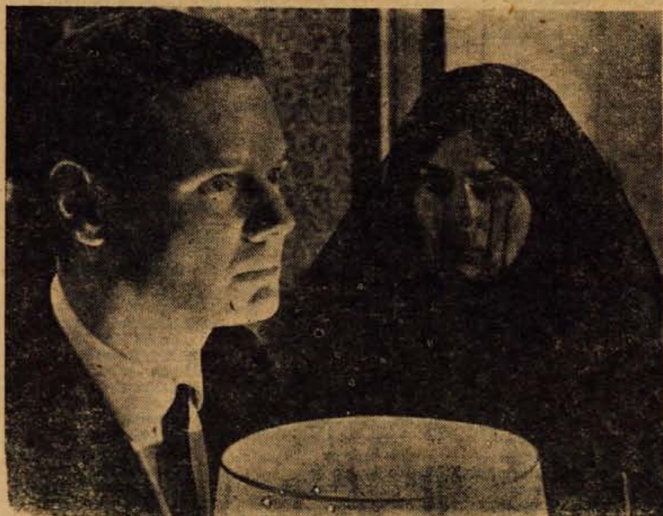
V svojem zadnjem filmu »Ophelia« je Claude Chabrol obdelal temo Hamleta v sodobni verziji. Glavni vloge sta odigrala Anne Parillaud in Juliette Mayniel

Na Kanarskih otokih sne- ma režiser Sidney Furie glas- beni film »Čudovito življe- nje« s Cliffom Richardom, Susan Hampshire in Dennis Price.