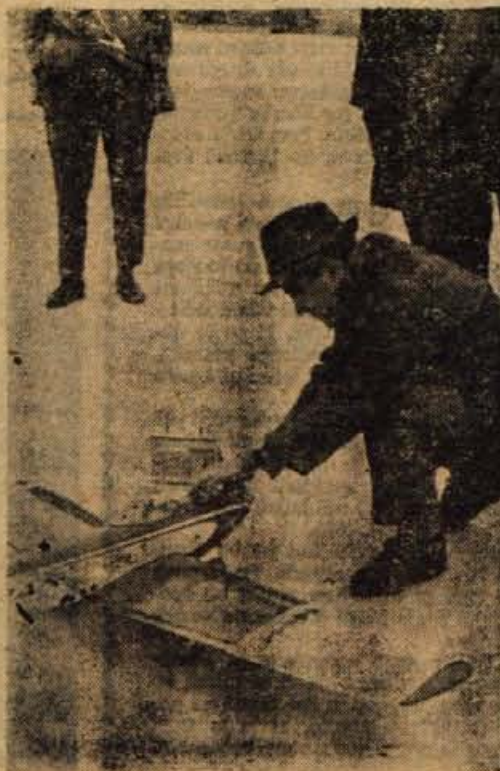
Skrbne priprave pred startom »Krgana«

Se nekajkrat so startali, vsakič bolj uspešno, in ko so se odpravljali domov, so se v »fičota« strpadi z zavestjo, da so v tej panogi napravili korak naprej da je bilo letalo kranjskega aerokluba tisto, ki je na letališču v Brniku vzletelo prvo.