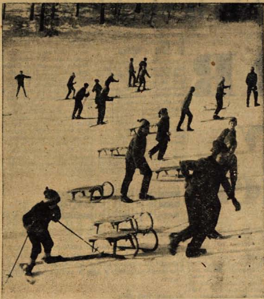
ZIMSKO VESELJE NA SANKAH

● Stran 3: LETALO, KI JE PRVO VZLETELO Z LETALI- ŠČA BRNIKI