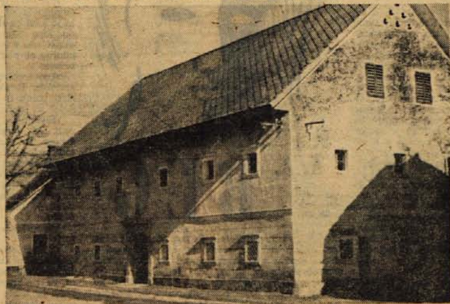
Senčur, pri Zumru; hiša bogate kmetije iz 19. stoletja

— Nova gospodarska poslopja imajo široko nastrešje, ki služi za shrambo za vozove in za različna dela doma, predvsem za mlačev z modernimi velikimi mlatilnicami. Nastrešje ima skoraj povsod betonirano tla, da se lahko očistijo, je pa na dvoriščni strani poslopja, da je čimbolj pri roki.