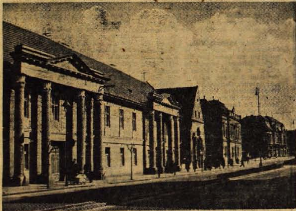
Trnava, majhno mestec z univerzo in lepo knjižnico

Tota Helpa, to je pékno mesto — to je pesem, ki smo se jo naučili najprej in se je veselo razlegala po avtobusu, ko so se v daljavi pokazali obrisi mesta. Nekoliko na vzpetini se razprostira staro mesto Nitra. Gradovi; Uhrovec, Topolčany, Oponice in Jeleneč in dragoceni spomeniki romanske arhitekture spominjajo na skoraj predzgodovinske čase Nitre. Najznamenitejši je grad Nitra, ki je dobil današnjo obliko skozi dolga stoletja.