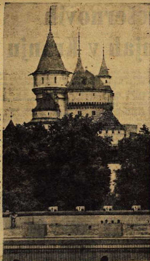
Eden izmed številnih gradov v Nitri