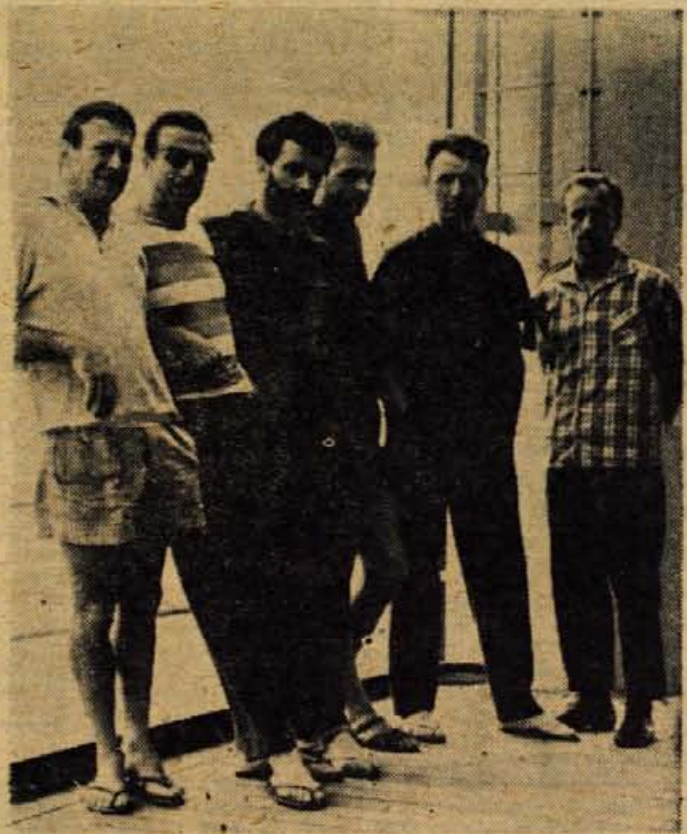
Članj odprave »Andi 1964«