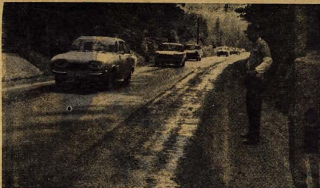
Nedeljsko popoldne: utrujeni ljudje v pločevinastih škatlah na vročem asfaltu mislijo na rekreacijo