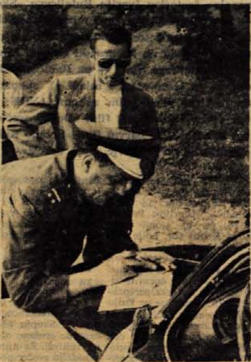
Kdo je kriv? Nepredviden motorist, za katerega pa to ni več važno! Pa vendar je treba zapisati izjave vseh, ki so videli nesrečo

Avto pomen standard. Višji standard, pa viš-