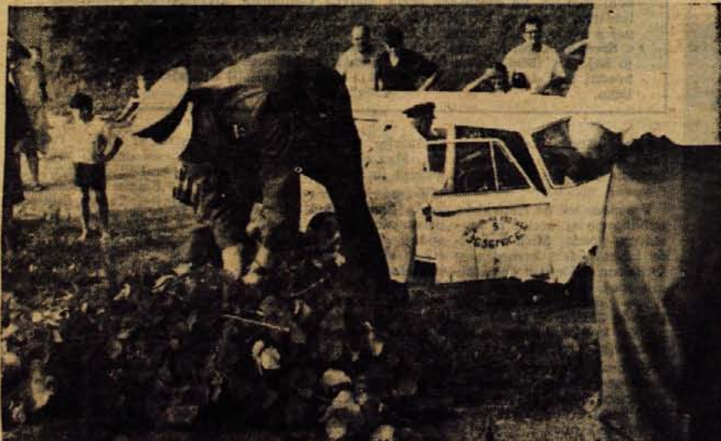
Resilni avtomobil ni potreben; treba je samo ugotoviti, kdo je mrtič pod vejami, s katerimi ga je nakada pokril pred radovednimi pogledi