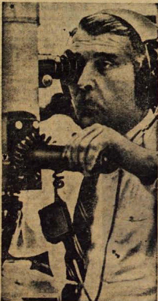
Poln napetosti in pričakovanja opazuje Werner von Braun v kontrolnem bunkerju start TITANA II.

»Za to bi morali imeti mnogo večje rakete,« mu odvrne von Braun. Za razvoj take rakete pa bi rabili najmanj štiri do pet let.«