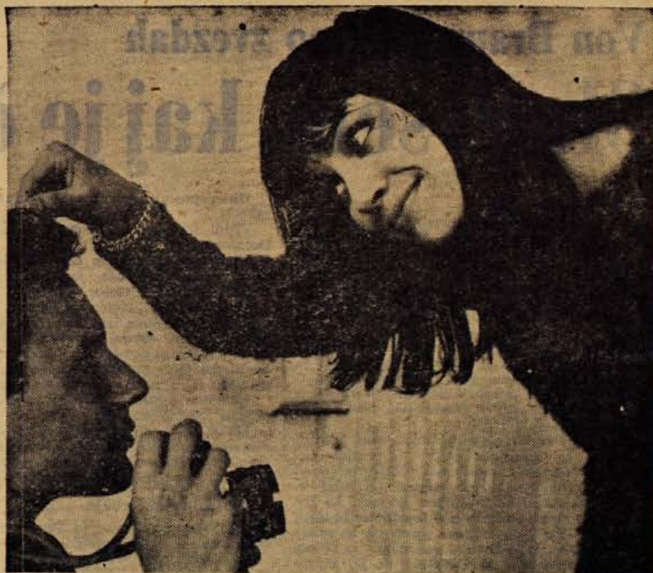
Pred mladim Cavalierem se je z alžirsko temo spoprijel že Jean-Luc Godard s filmom »Mali vojaki«, posnetim leta 1960 in nato tri leta prepovedanim, v katerem sta zaigrala Michel Subor (mladega terorista O.A.S. in Anna Karina pripadnico F.L.N.

imeli resnično umetniško vrednost — pri tem pa tudi take, v katerih sam ne bom igral. Glavno vlogo bom prevzel posebej v filmih mladih in neznanih režiserjev, da bi jim tako komercialno utrl pot. Na ta način mislim pomagati novim nadarjenim ustvarjalcem pri njihovem uveljavljanju. Če sem čisto