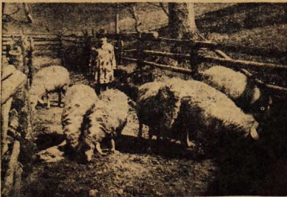
V hribovskih vaseh že od nekdanj prednjačijo med domačimi živalmi ovce