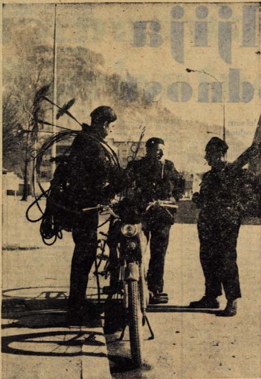
Ste se prijeli za gumb, ko ste pogledali sliko?