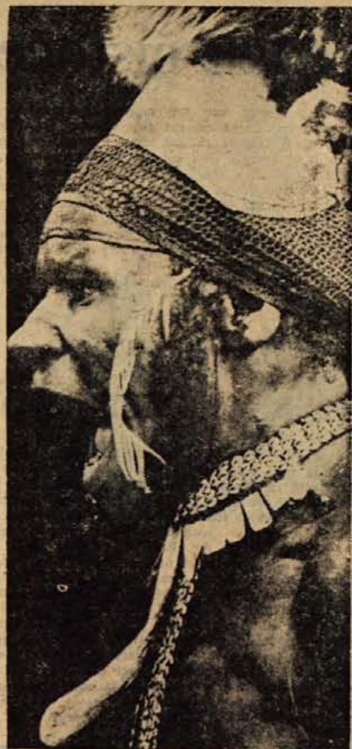
Papuananci s posebnimi vzkliki in vpitjem izzivajo sovražnika pred borbo

Spet smo med Papuanci. To pot nas bo Robert Gardner, ki je raziskoval predele Nove Gvineje in njihove prebivalce, popeljal v svojem dnevniku v običajno, vsakdanje življenje teh ne-navadnih ljudi, ki žive še v predzgodovinski dobi. Vendar se ta že močno umika bolj civiliziranemu obdobju.