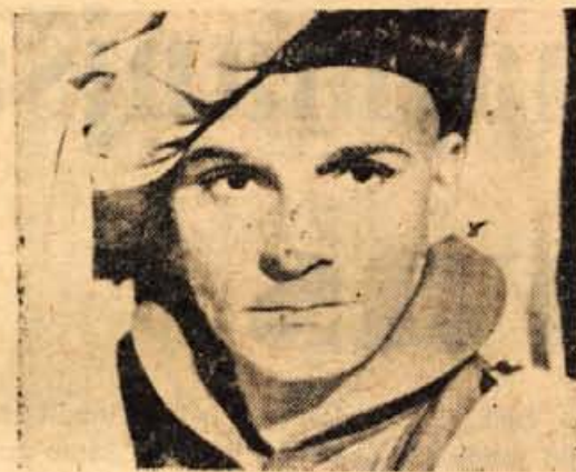
Laurence Olivier je s filmi »Hamlet«, »Henrik V.« (slika) in »Richard III.« ustvaril doslej naj- boljše prenose Shakespeareovih del

Enako samostojno, toda z manj uspeha, je v povojnih letih segel po Shakespeareu Orson Welles. Njegovega »Macbetha« (1948) je kljub zanimivemu stilu pokopala samovoljna (ka-