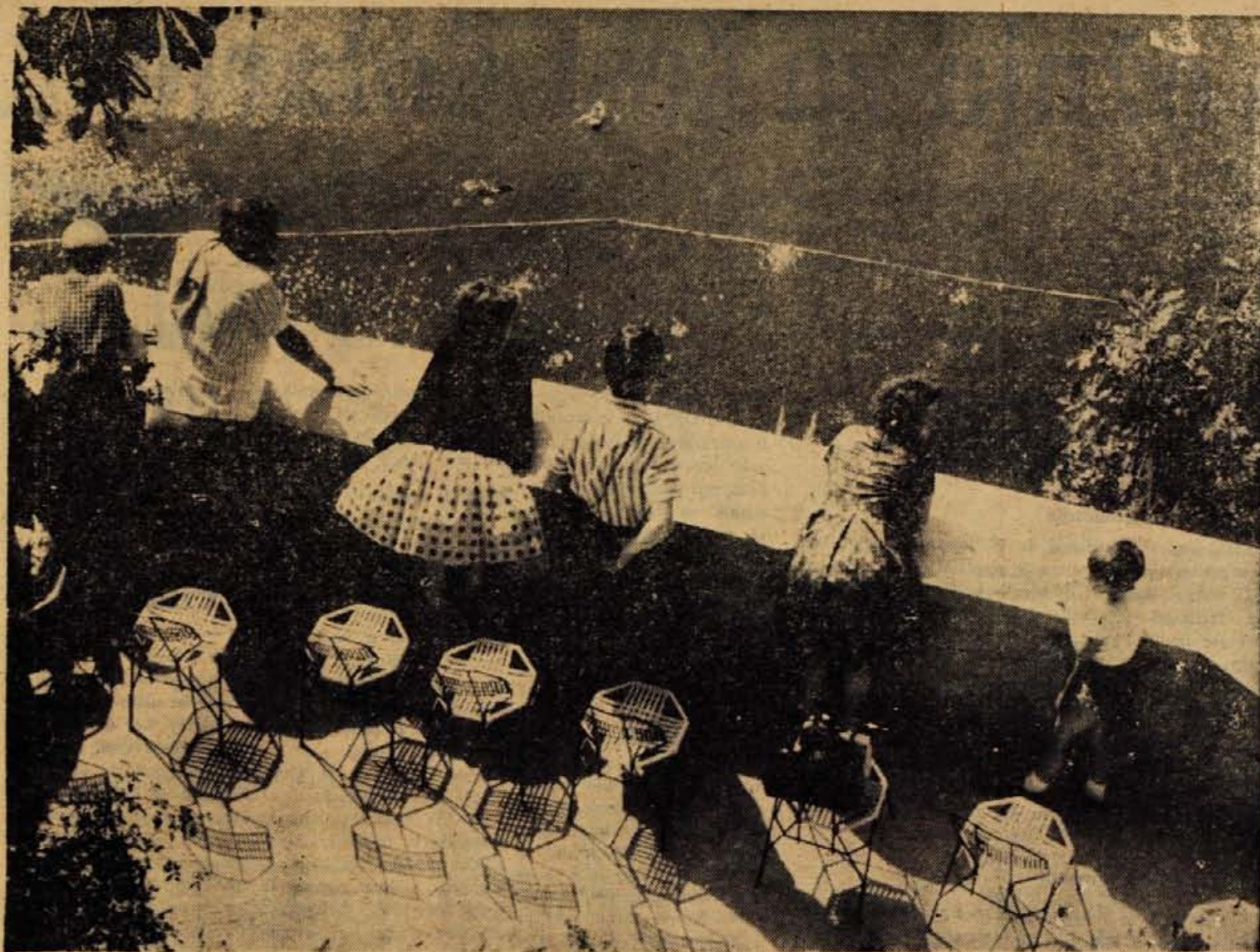
Prvomajski izlet na blejski grad