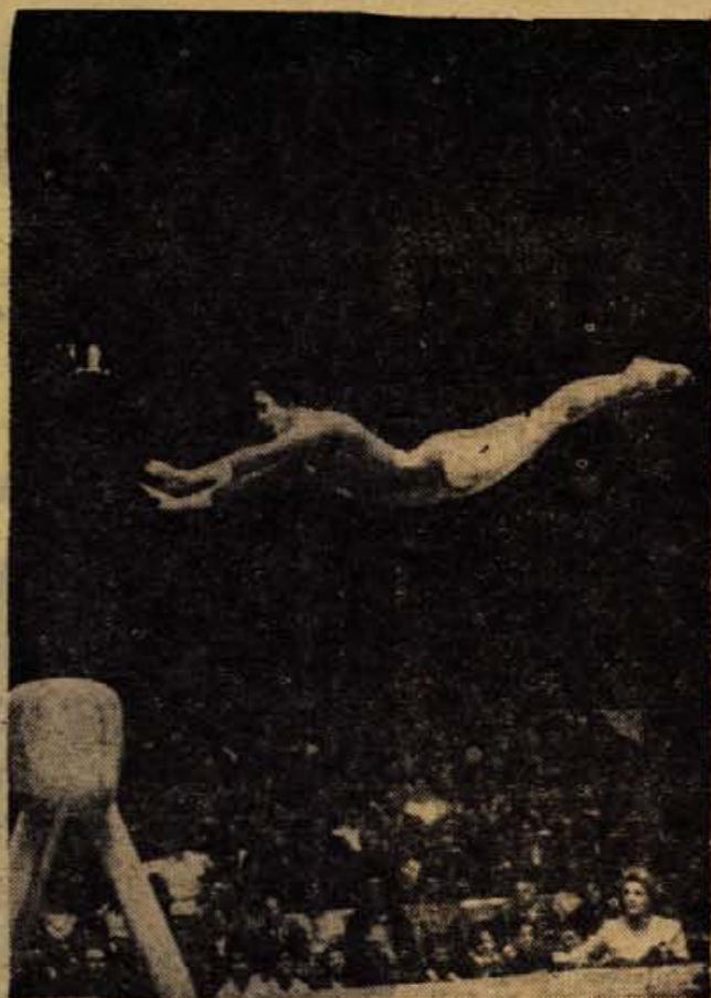
SKLADNOST — POGUM — ELEGANCA. Vse to bomo vidi tudi v Tokiu